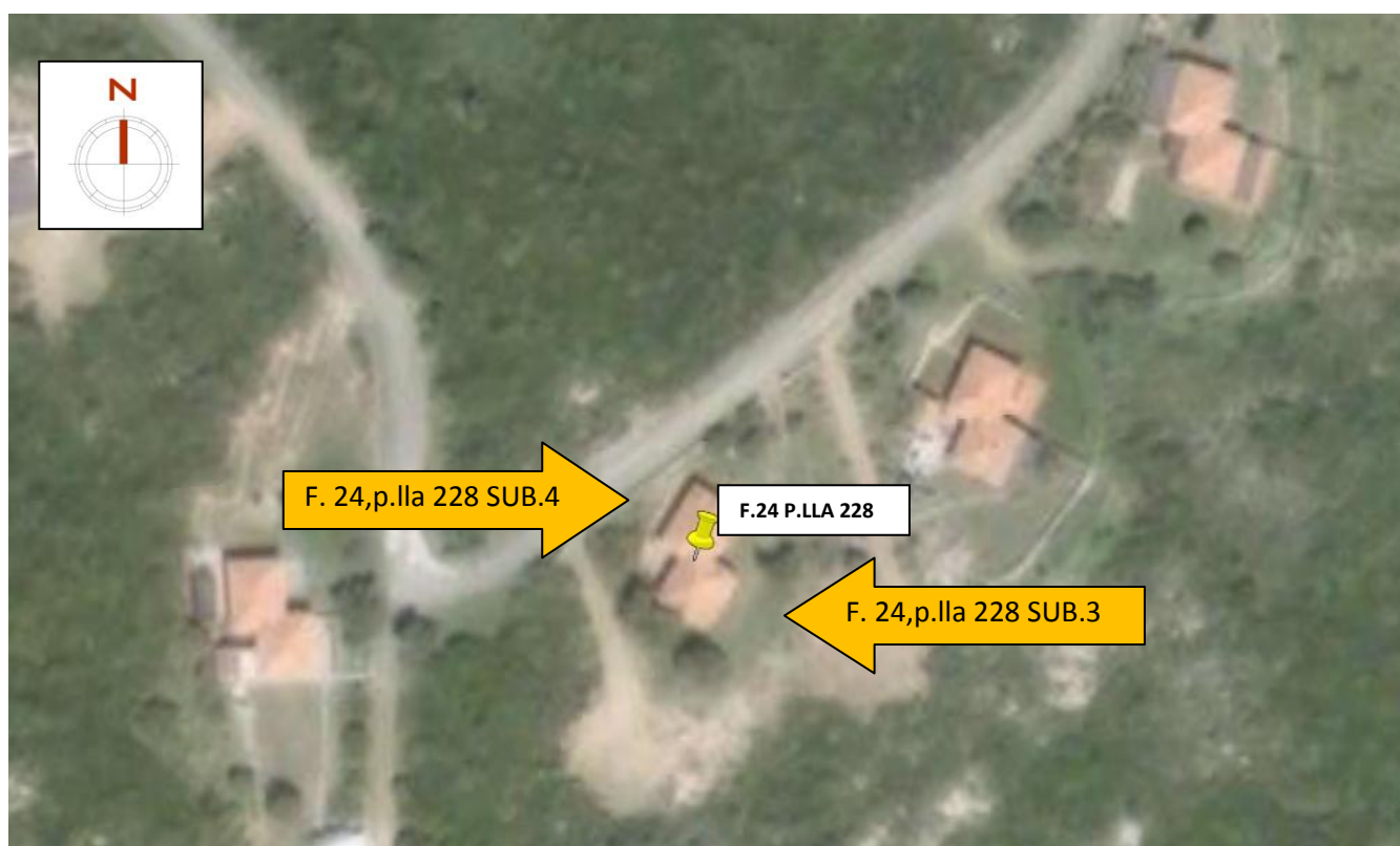
Figura 2 - - Inquadramento generale dei lotti (N.C.E.U, F. 24, p.la 228 sub. 3 e sub.4).