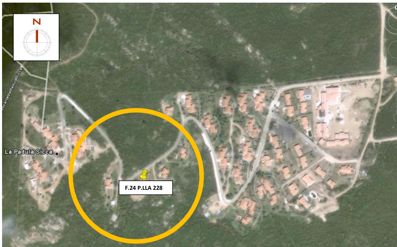
Figura 1 – Inquadramento generale dei lotti (N.C.E.U, F. 24, p.la 228).