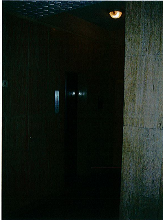
Atrio – ascensore.