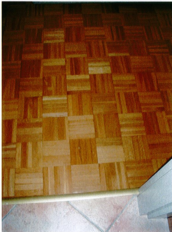
Pavimentazione stanza da letto.