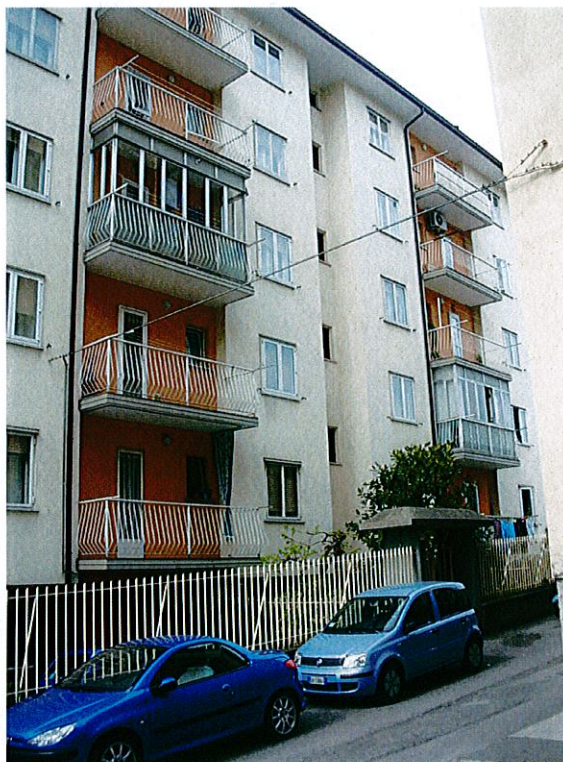
Via isola d'Istria 2.