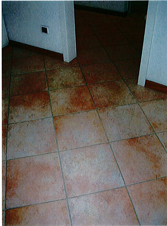
Pavimentazione zona soggiorno ingresso.