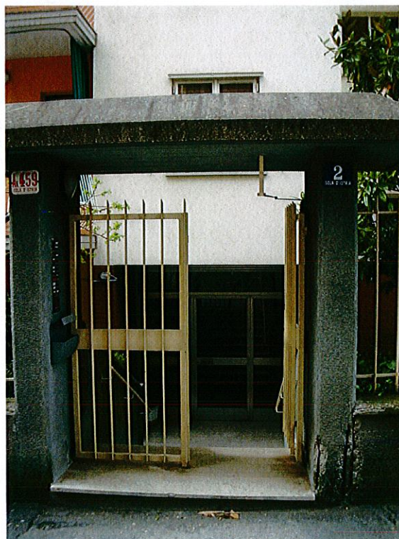
Ingresso allo stabile dalla strada.