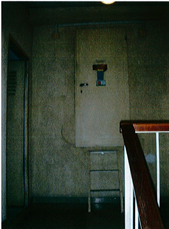
Ingresso alle soffitte.