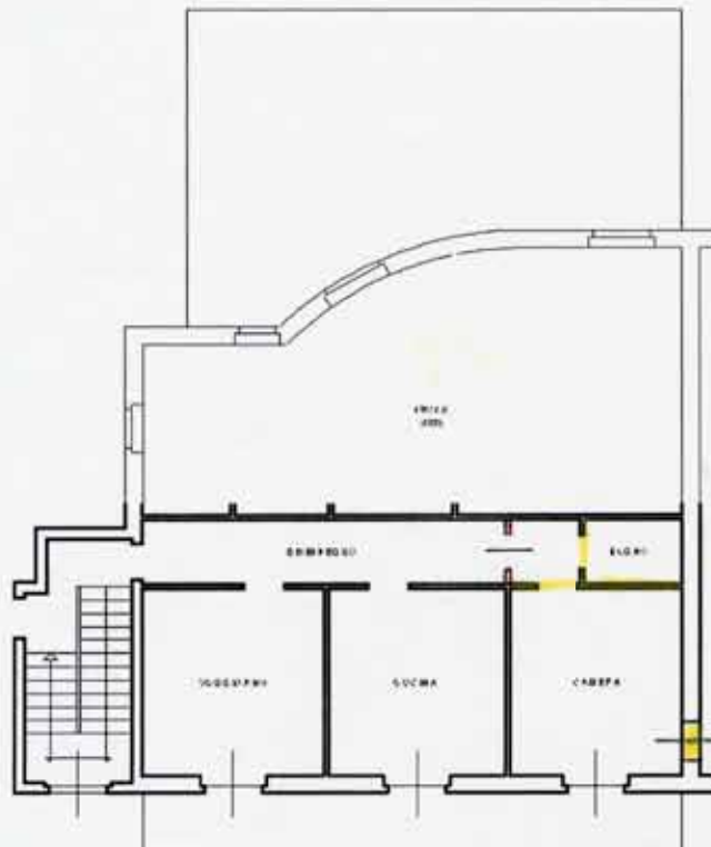
PIANO PRIMO H = 3.00