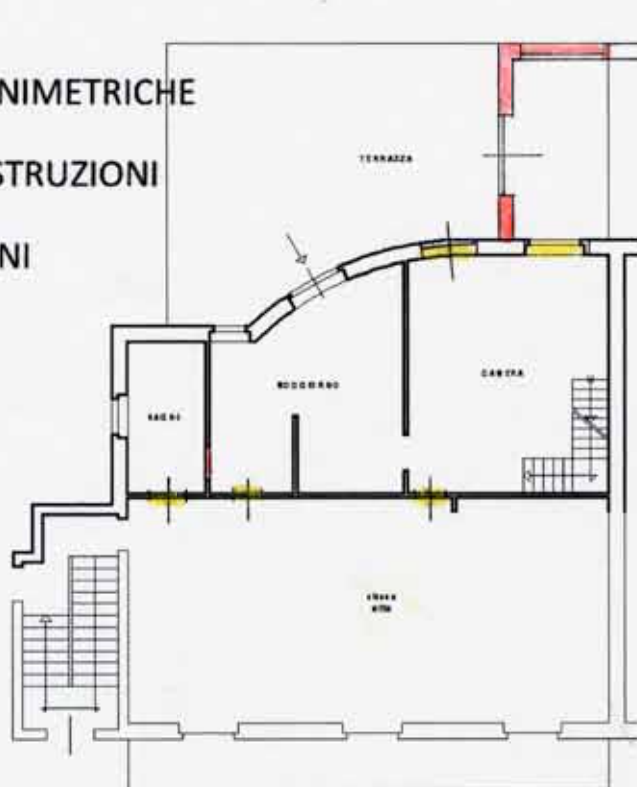
PIANO PRIMO H = 3.00