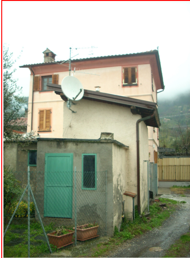
La porzione di fabbricato oggetto di perizia, visto dalla corte comune. Sulla destra la recinzione che insiste su parte della corte comune.