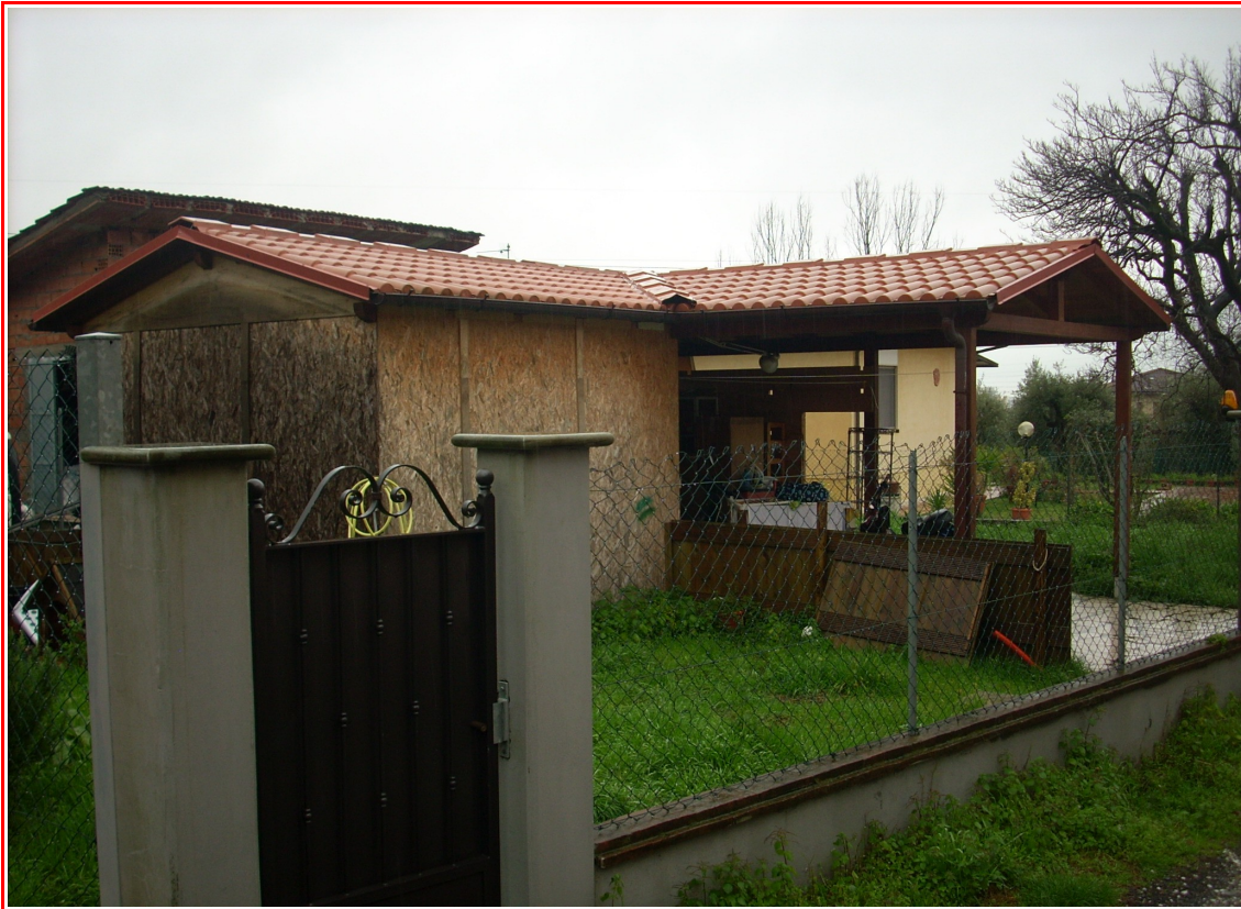
Altra vista, dalla corte a comune, della tettoia realizzata nel resede esclusivo.