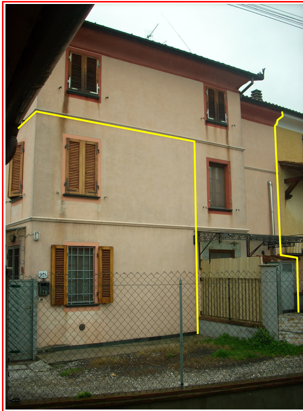
La porzione di fabbricato oggetto di perizia, visto dal resede esclusivo. Si nota la pensilina in ferro a protezione dell'ingresso.