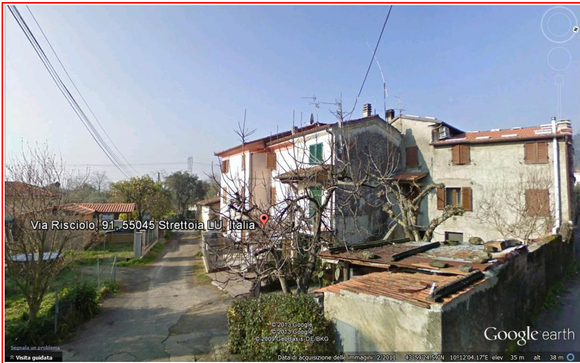
Vista del nucleo di di cui fa parte la porzione di fabbricato oggetto di perizia.