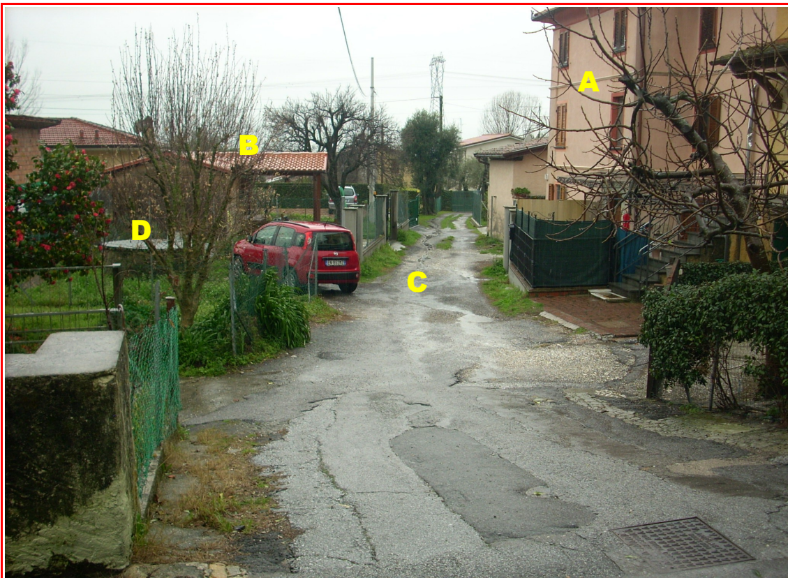
La porzione di fabbricato oggetto di perizia (A), la tettoia sul resede esclusivo (B), la corte (C) e il pozzo (D) a comune.