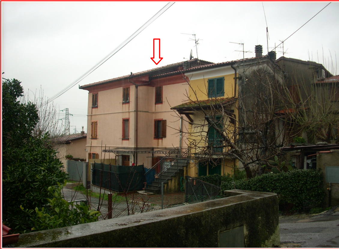
La porzione di fabbricato oggetto di perizia, visto da via Risciolo. Si nota la pensilina in ferro e vetro e la recinzione sulla corte comune.