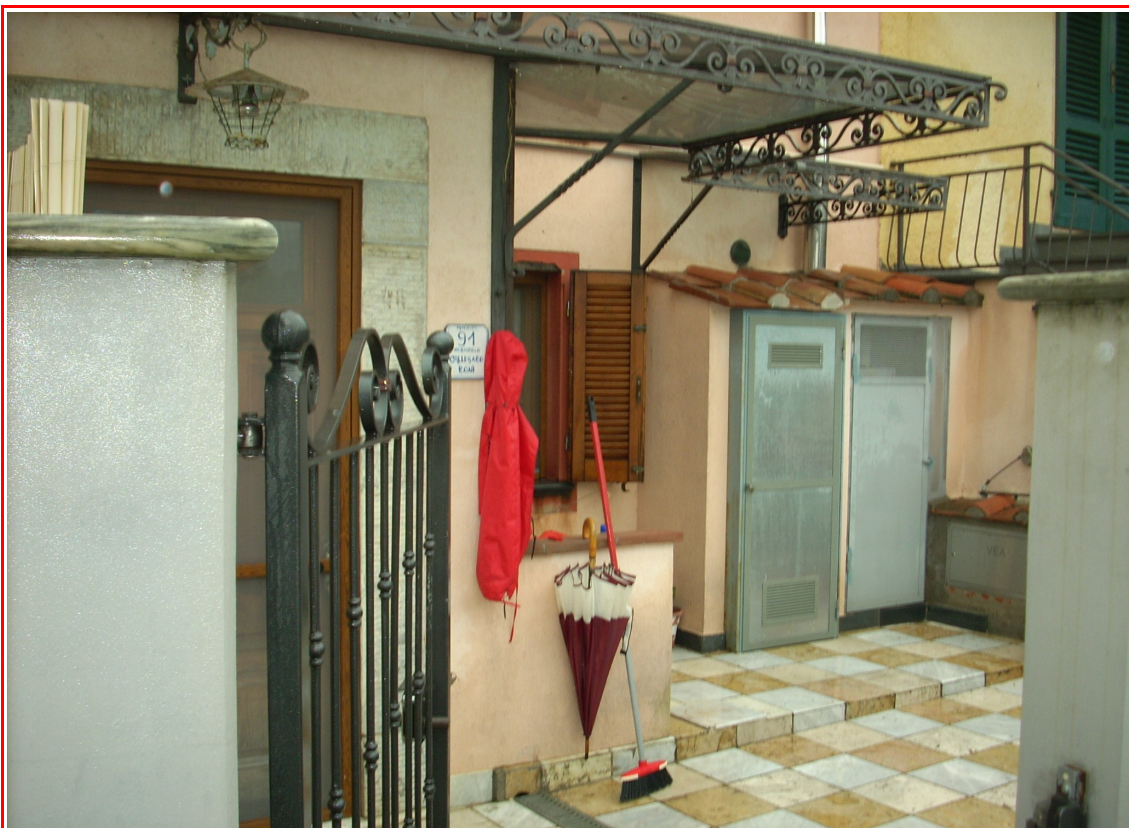
La porzione di corte a comune recintata con l'ingresso all'unità immobiliare, la pensilina in ferro e vetro e, sullo sfondo, il vano tecnico realizzato per l'alloggiamento della caldaia.