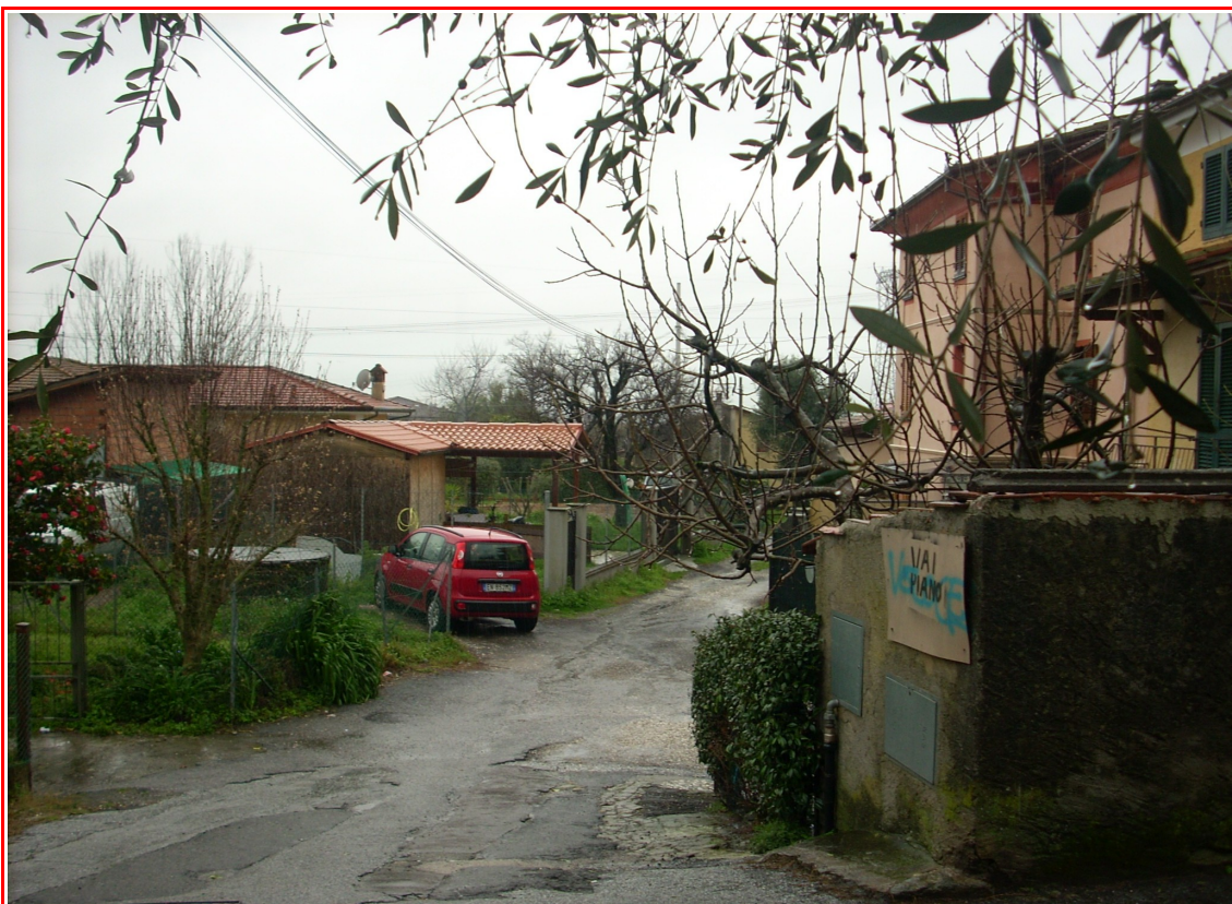
L'accesso da via Risciolo alla corte comune. Si nota il pozzo comune e la tettoia realizzata sul resede esclusivo di pertinenza dell'unità immobiliare oggetto di perizia.