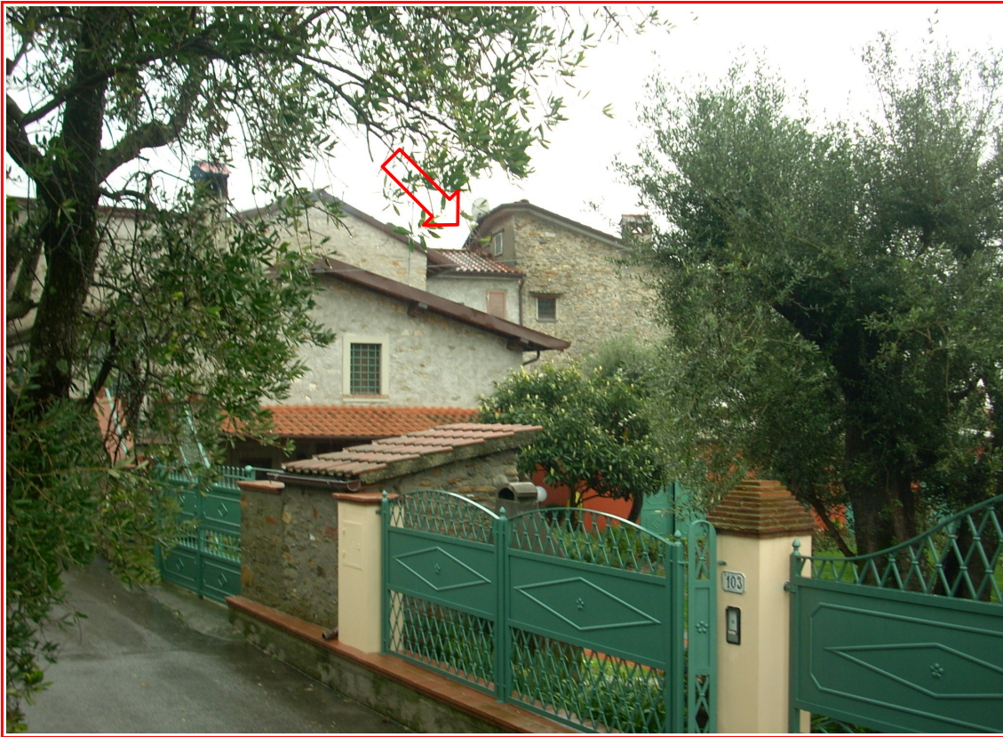
La porzione di fabbricato oggetto di perizia, visto da via Risciolo. Nella parte di tetto più alta è ricavata la soffitta.