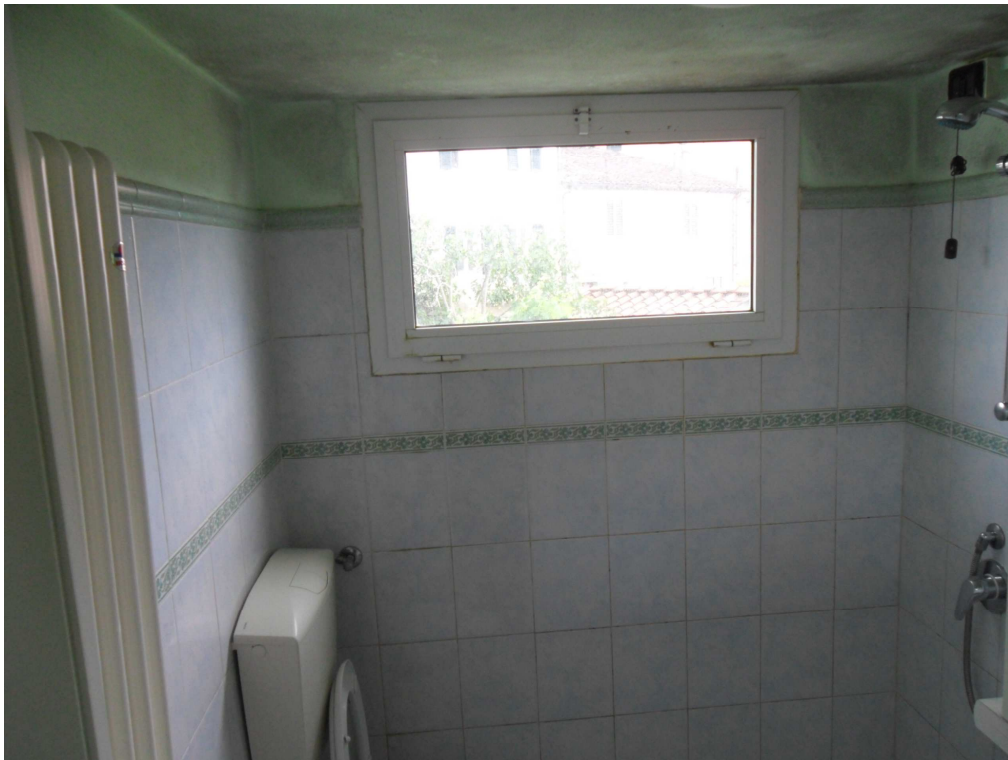
Disimpegno per accesso al piano primo