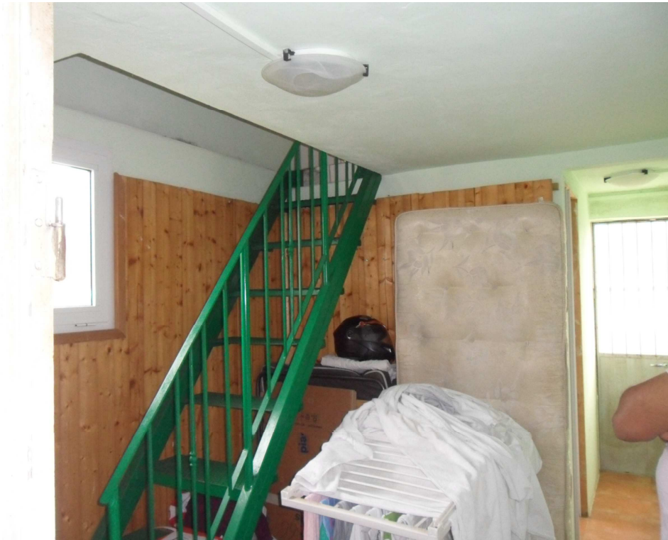
Disimpegno per accesso servizio igienico e terrazza