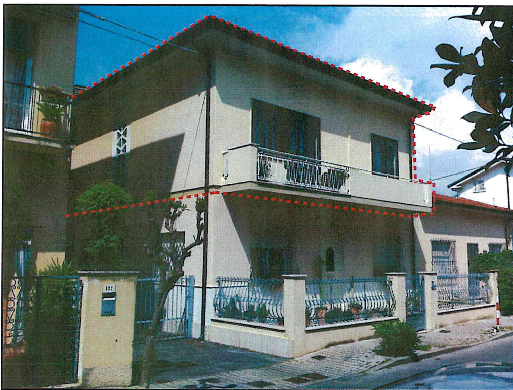
Foto 1 - prospetto principale (sud) e laterale (ovest) da via A. Vespucci