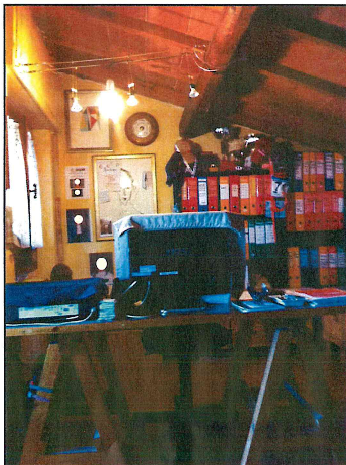
Foto 12 - locale al piano sottotetto