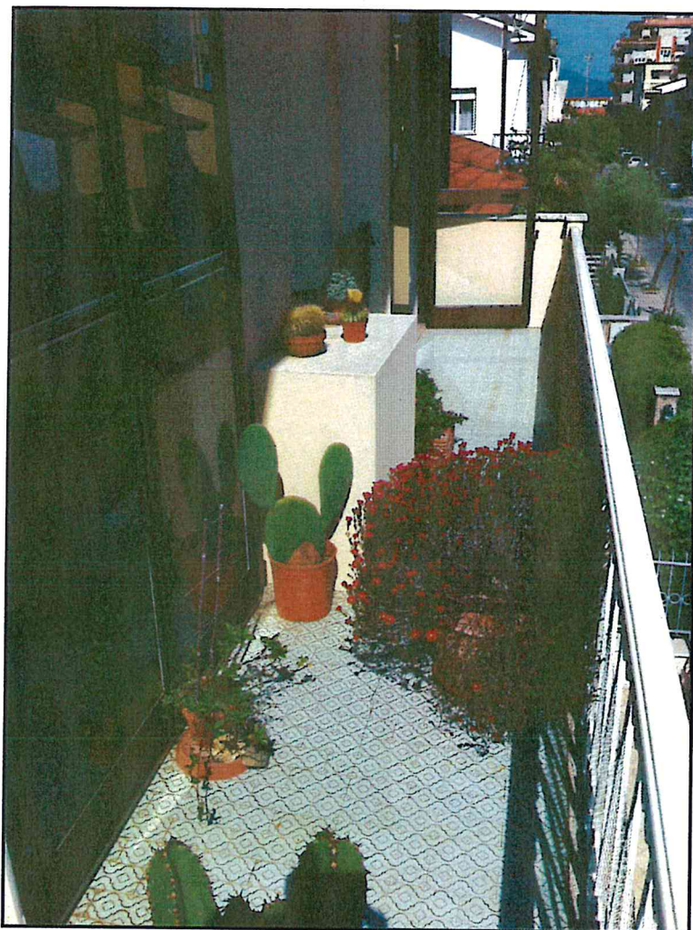
Foto 9 - balcone lato via A. Vespucci