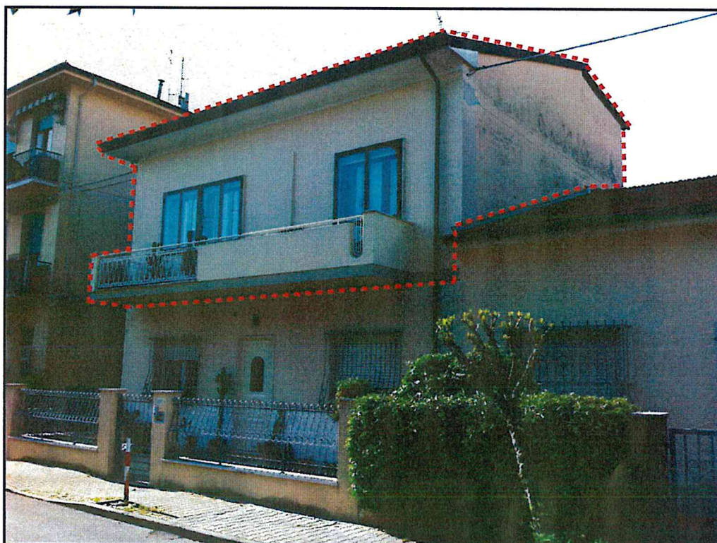
Foto 2 - prospetto principale (sud) e laterale (est) da via A. Vespucci