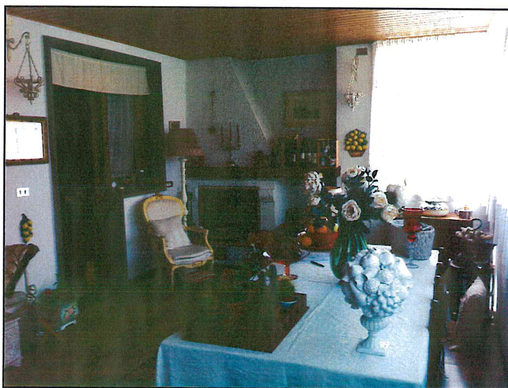
Foto 6 - veranda chiusa al piano primo