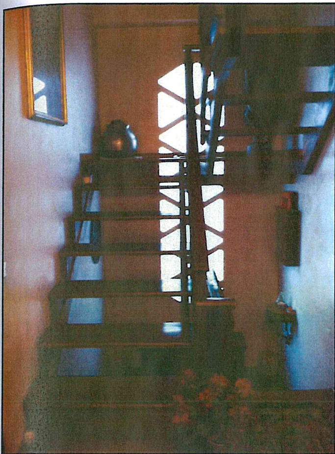
Foto 11 - Scala interna al piano primo