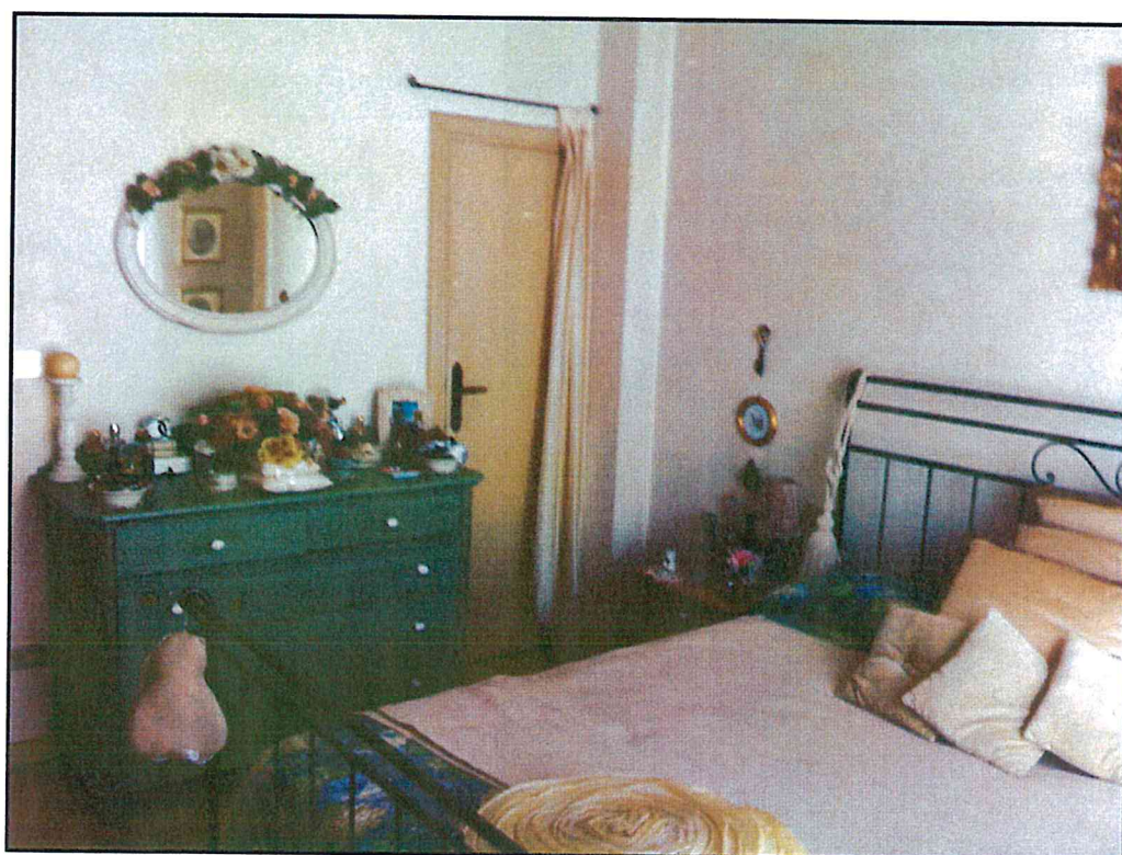
Foto 10 - camera al piano primo