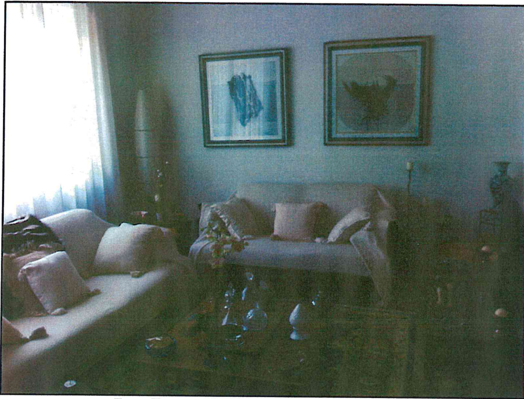
Foto 7 - soggiorno-pranzo al piano primo