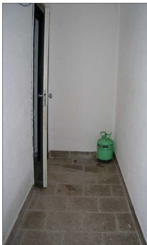
Fig. 16: Appartamento al piano terra: disimpegni