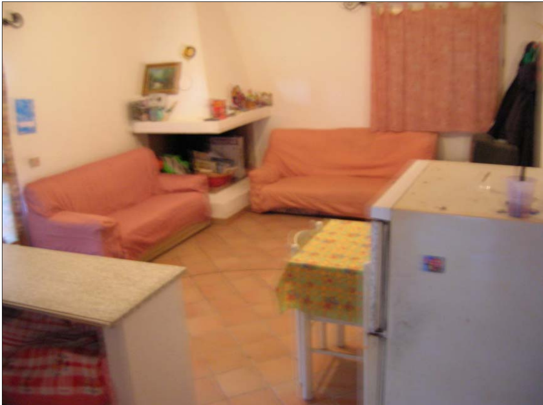
Fig. 7: Cucina - soggiorno al piano terra