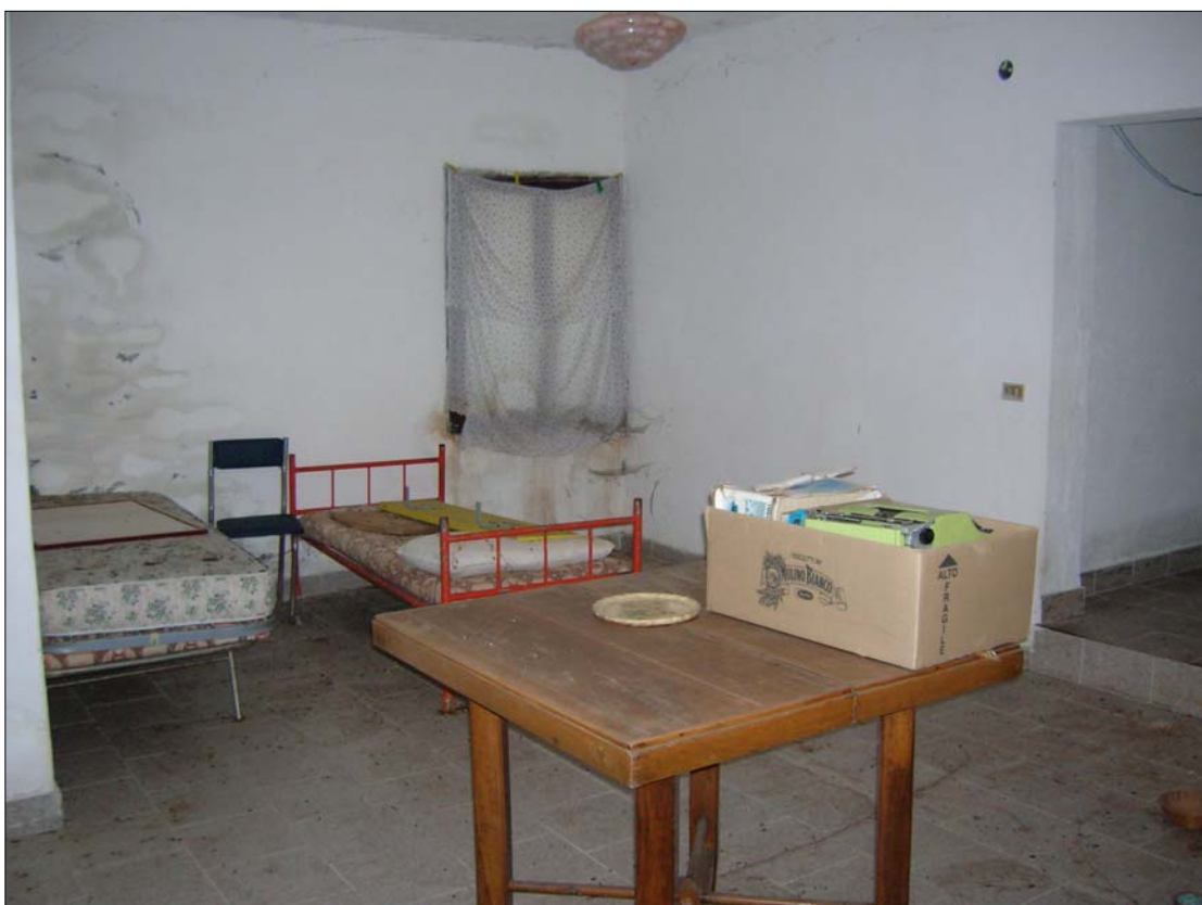
Fig. 18: Appartamento al piano terra: camera