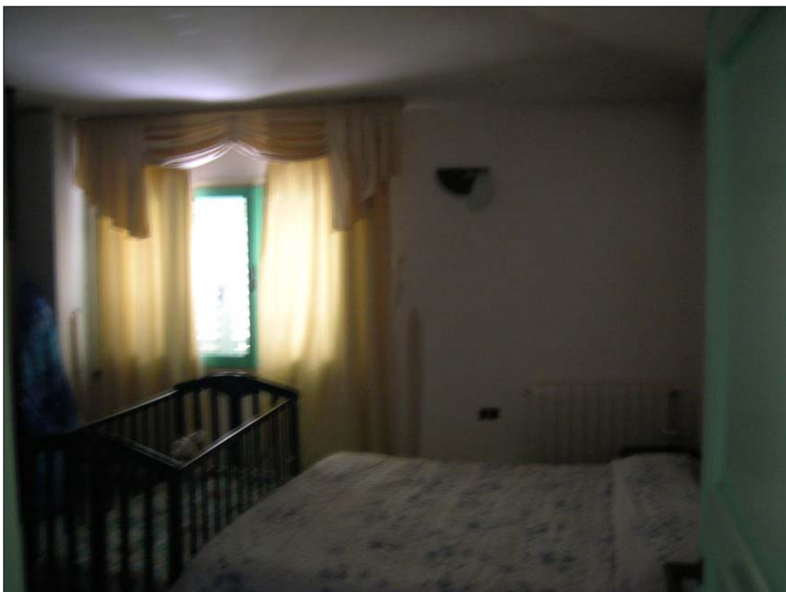
Fig. 11: Camera da letto matrimoniale