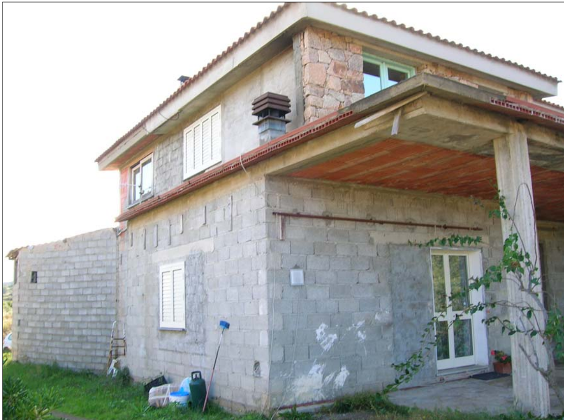
Fig. 2: Prospetto Nord