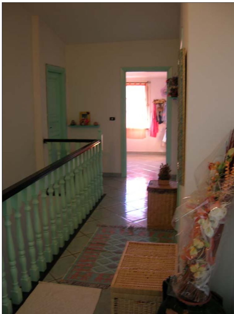
Fig. 8: Disimpegno al primo piano