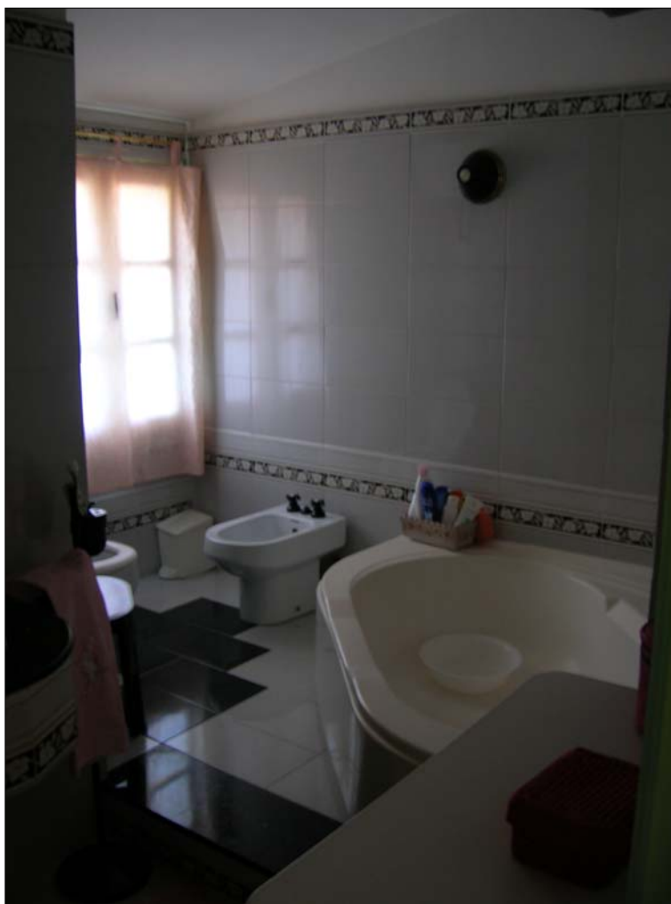
Fig. 13: Bagno