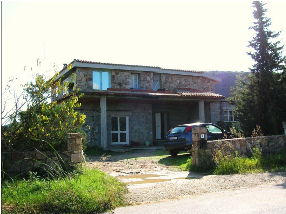
Fig. 1: Prospetto principale