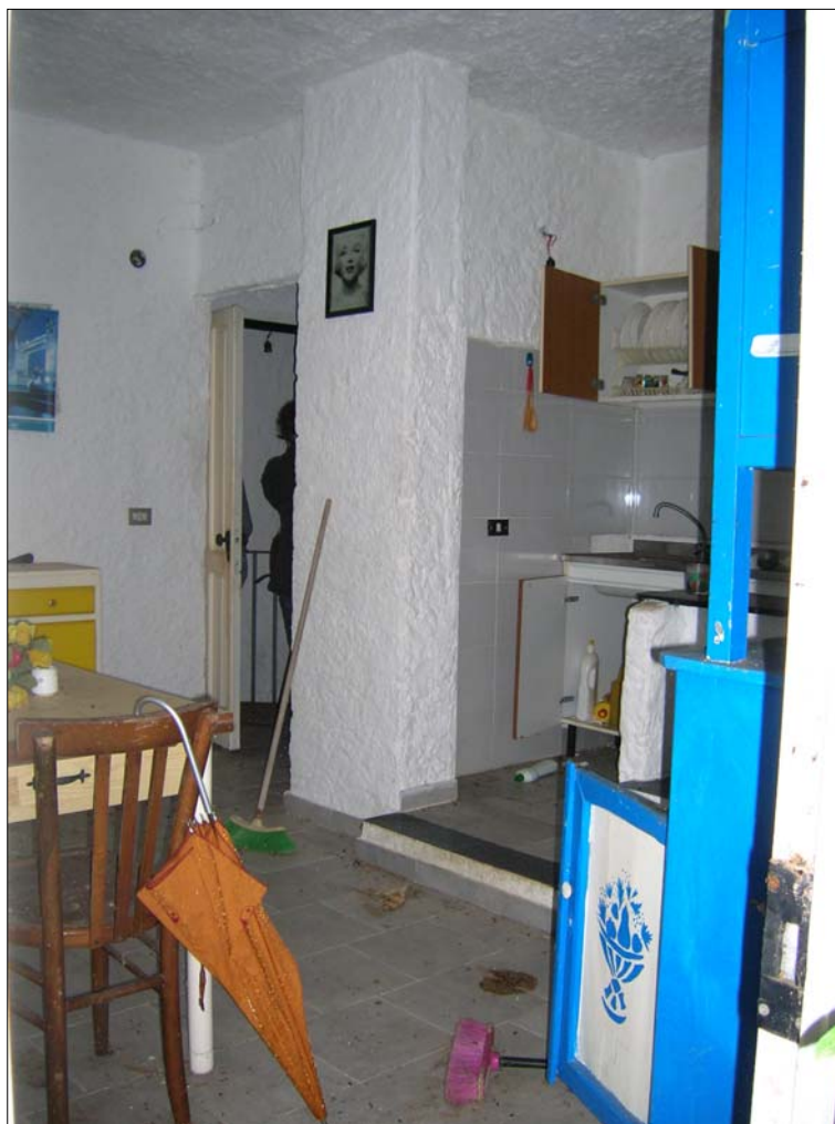
Fig. 15: Appartamento al piano terra: ingresso-pranzo