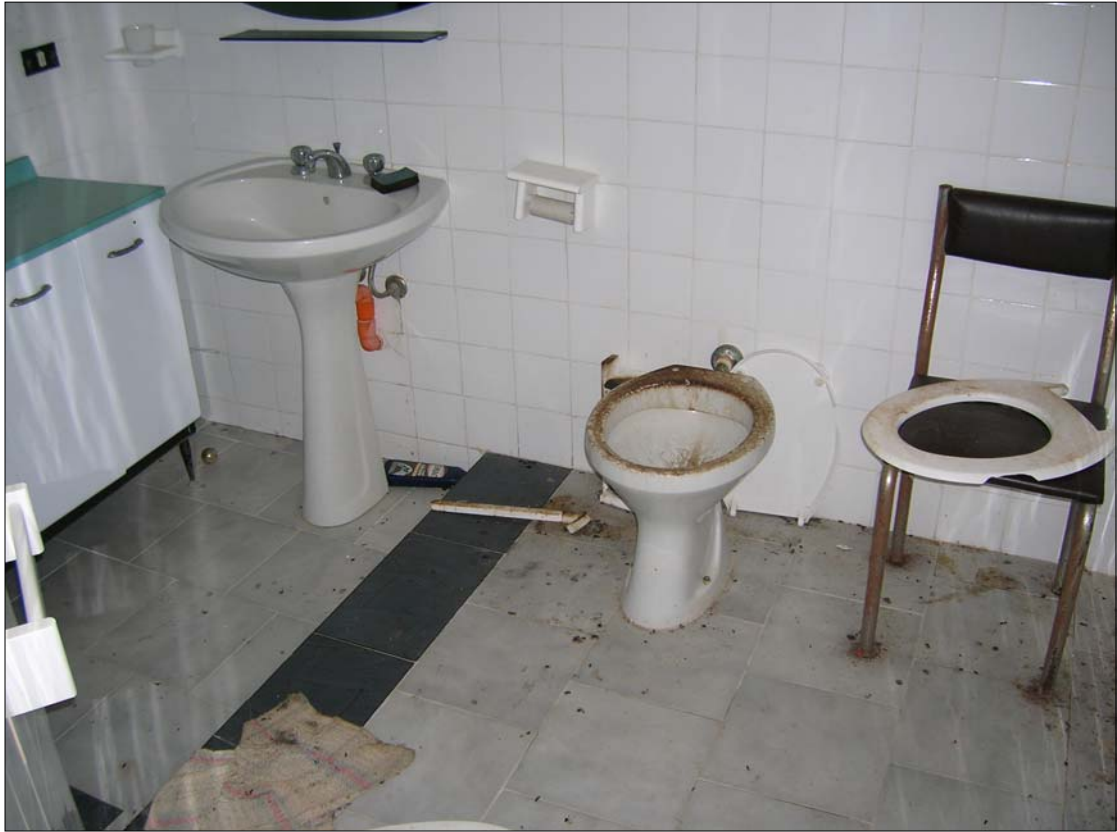
Fig. 19: Appartamento al piano terra: bagno