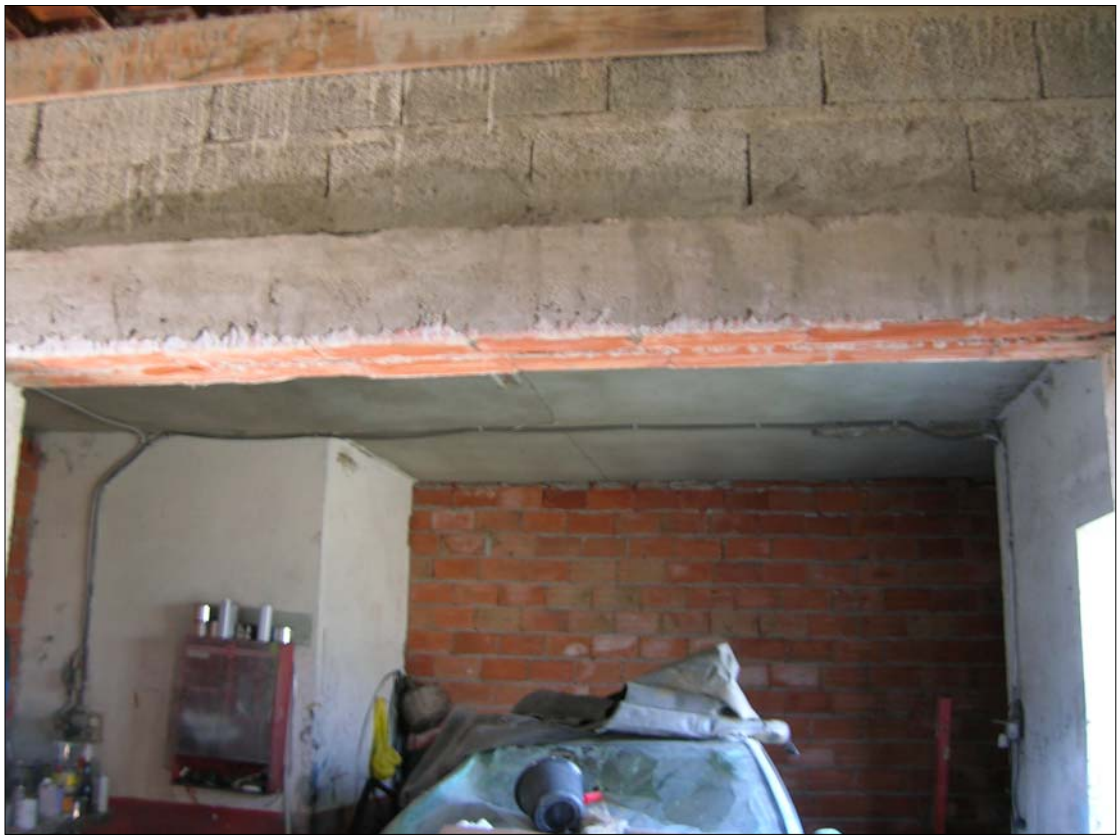
Fig. 20: Garage