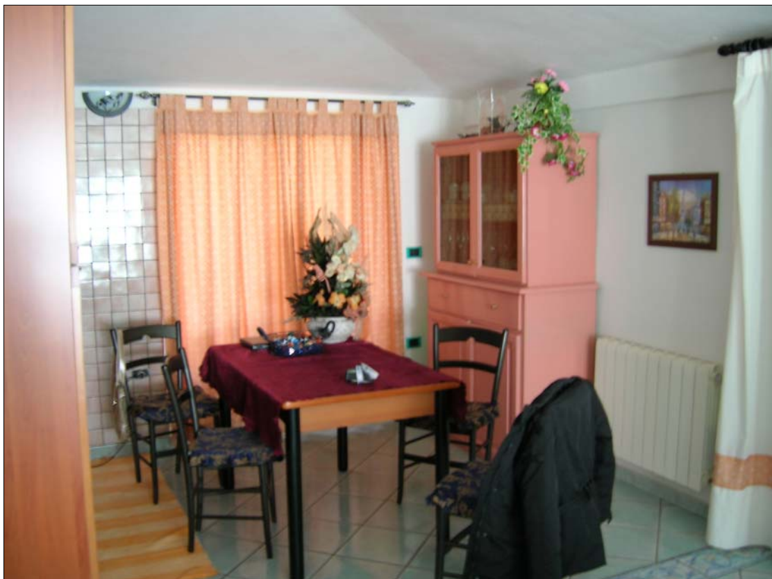
Fig. 9: Zona cottura al primo piano