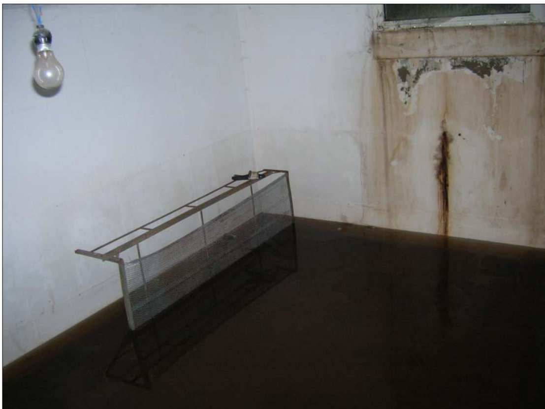
Fig. 17: Locale seminterrato