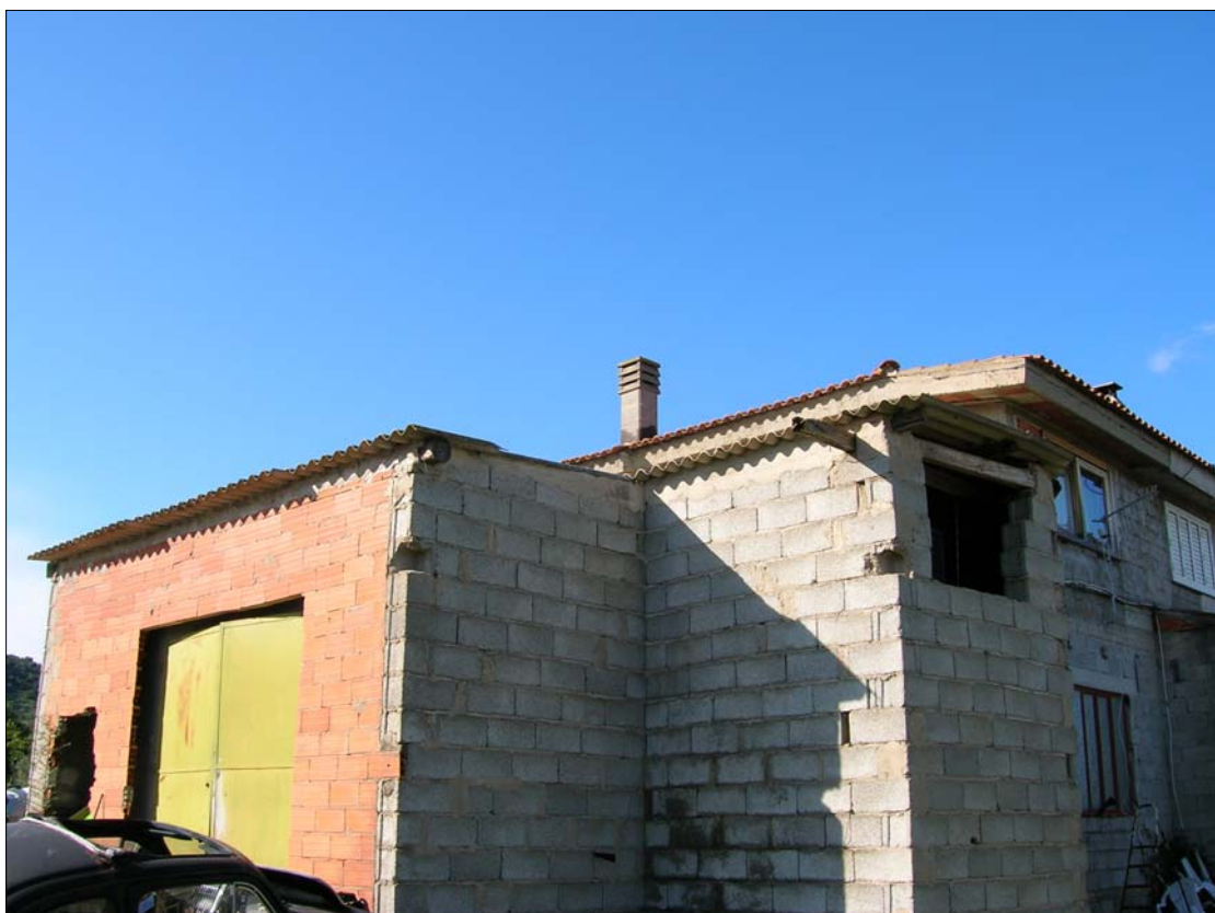
Fig. 5: Prospetto Est, in primo piano il garage-laboratorio oggetto di sanatoria