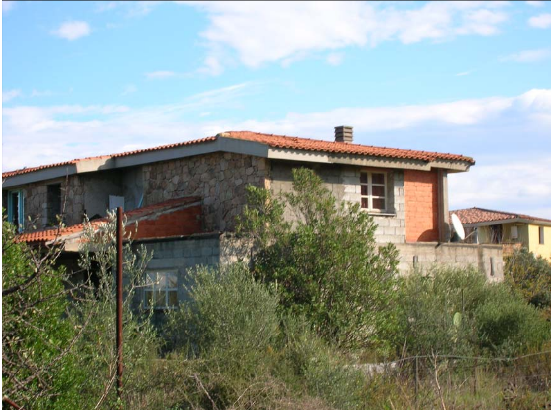
Fig. 3: Prospetto Sud