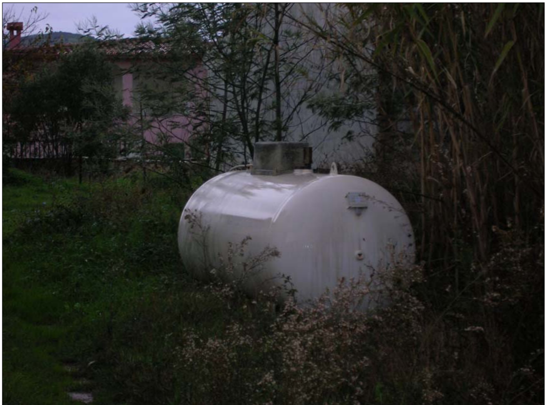
Fig. 4: Serbatoio GPL