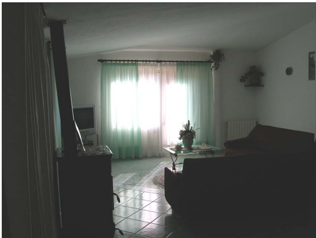
Fig. 10: Soggiorno al primo piano