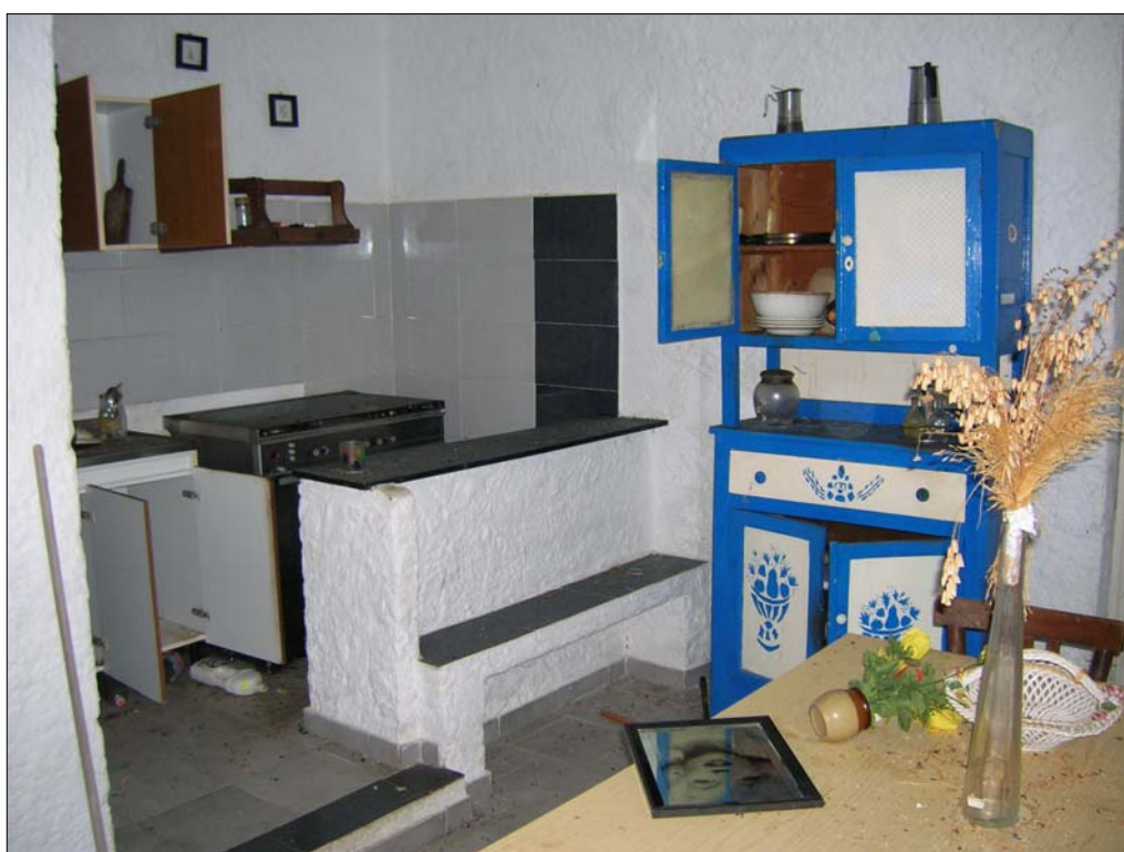
Fig. 14: Appartamento alpiano terra: zona cottura