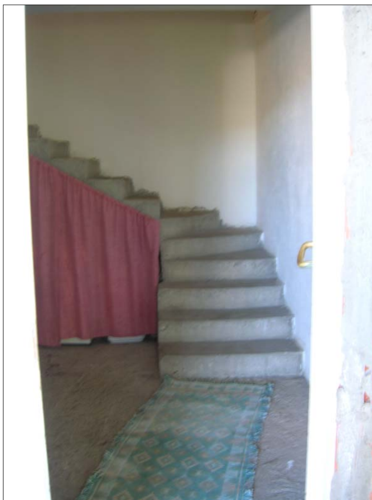
Fig. 6: Ingresso all'abitazione principale