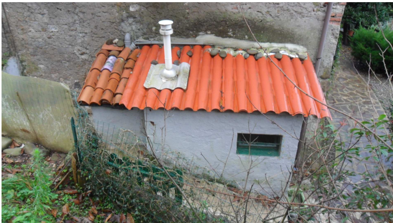
11 - Veduta delle piccole costruzioni accessorie in muratura, destinate a cuccia per il cane e centrale termica, realizzate sul tracciato della vecchia strada comunale per Turrite Cava e che dovranno essere demolite.