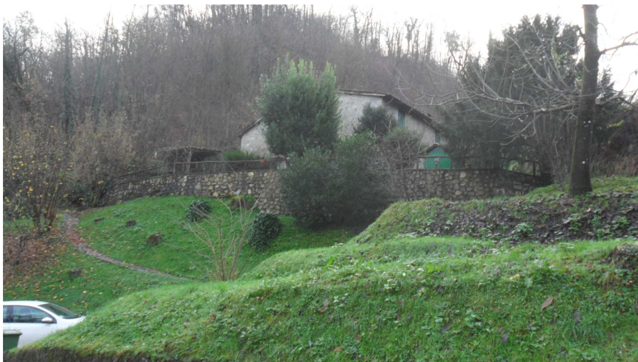
1 - Veduta del fabbricato oggetto di stima (lato nord) ripresa dalla strada carrozzabile per Cardoso