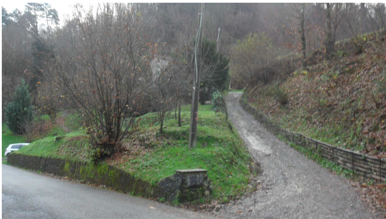
4 - Veduta del tratto della vecchia strada comunale di Turrite Cava che consente di accedere ai beni oggetto di stima: in primo piano, la nuova carrozzabile per Cardoso.