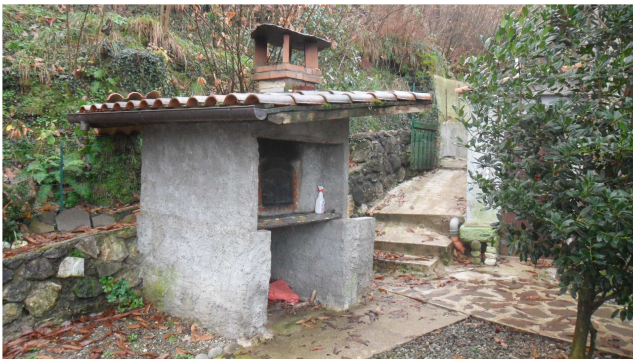
10 - Veduta del forno a legna, irregolare e che dovrà essere demolito, sito a nord est del fabbricato oggetto di stima.