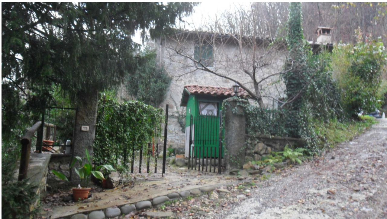
5 - Veduta del cancello di accesso al lato nord del fabbricato oggetto di stima ripresa dalla vecchia strada comunale di Turrite Cava.