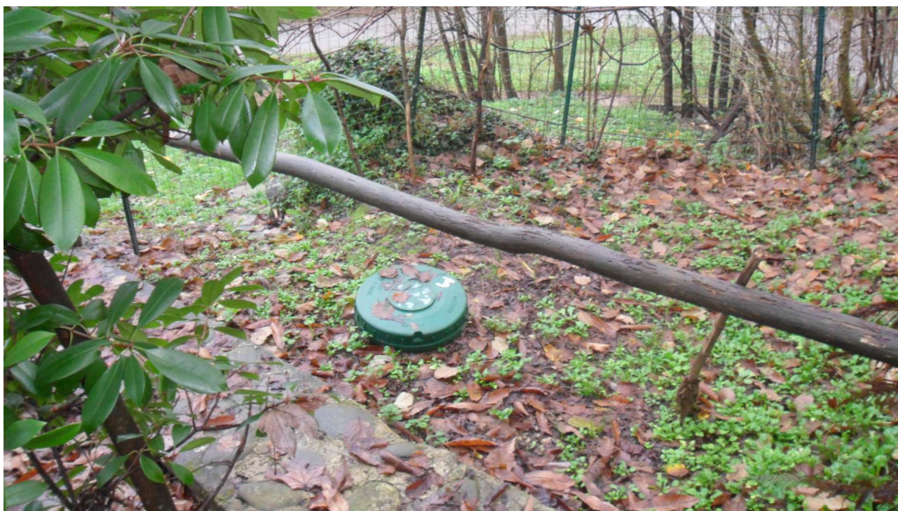
12 - Veduta del serbatoio interrato di gas GPL, per il quale non sono stati reperiti né atti autorizzativi, né certificazioni.