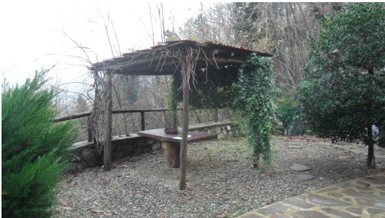
9 - Veduta del manufatto in legno, irregolare e che dovrà essere demolito, sito a nord del fabbricato oggetto di stima.