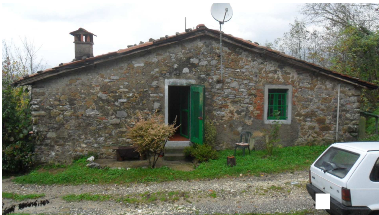
3 - Veduta del lato sud del fabbricato oggetto di stima: in primo piano, il passo che serve altre proprietà vicine.