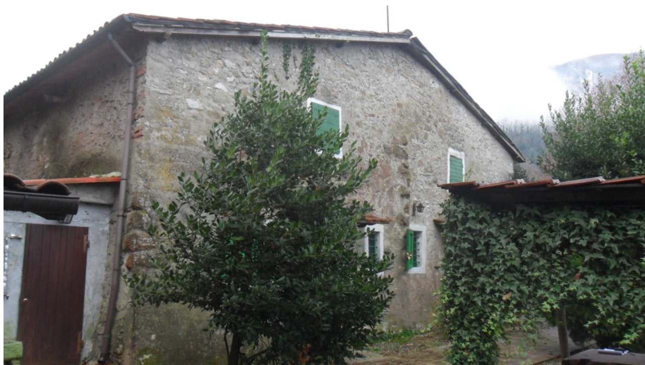
2 - Veduta della facciata lato nord del fabbricato oggetto di stima.