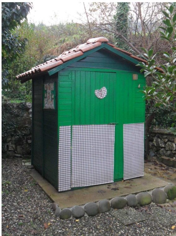
8 - Veduta del manufatto in legno, irregolare e che dovrà essere demolito, sito a ovest del fabbricato oggetto di stima In prossimità del cancello di ingresso.