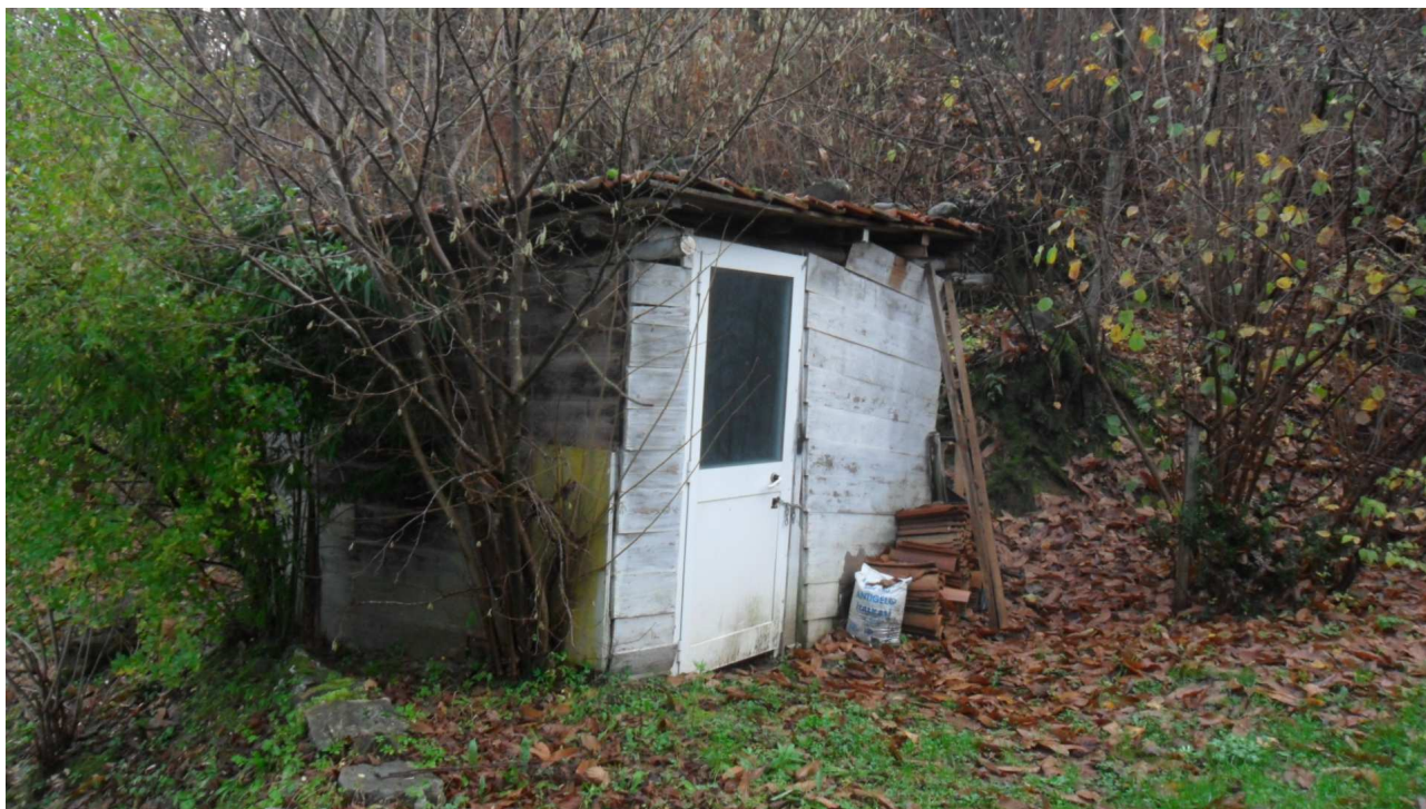
7 - Veduta del manufatto in legno, irregolare e che dovrà essere demolito, sito a sud del fabbricato oggetto di stima.