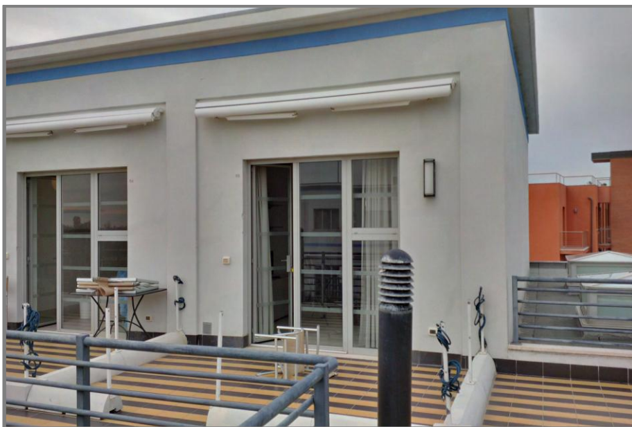
Foto n. 1 (ingresso dal ballatoio esterno condominiale e terrazza esclusiva)