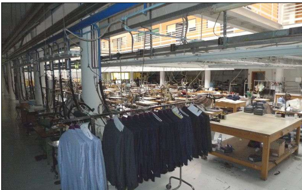
9) Sala lavorazioni