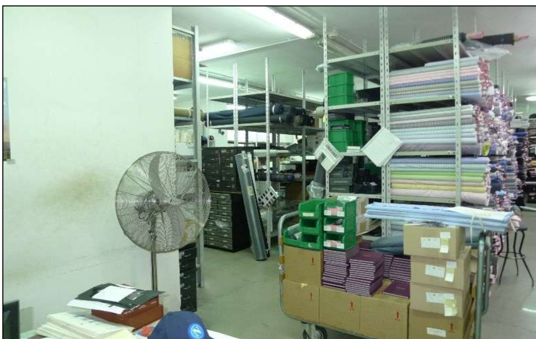
14) Area stoccaggio materie prime