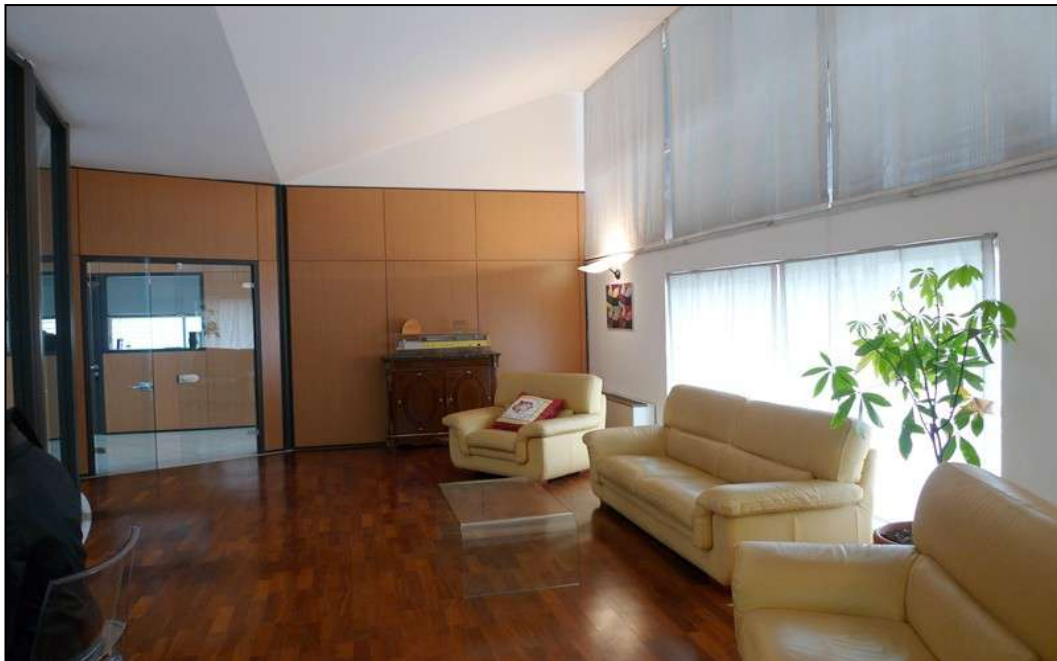
18) L'ufficio di rappresentanza