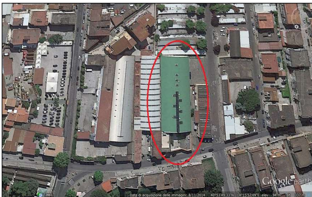
1) Vista dall'alto del contesto urbano nel quale è sito il fabbricato, cerchiato in rosso nell'immagine.