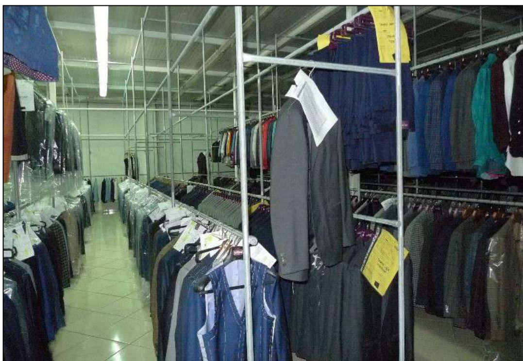
20) Deposito prodotto finito