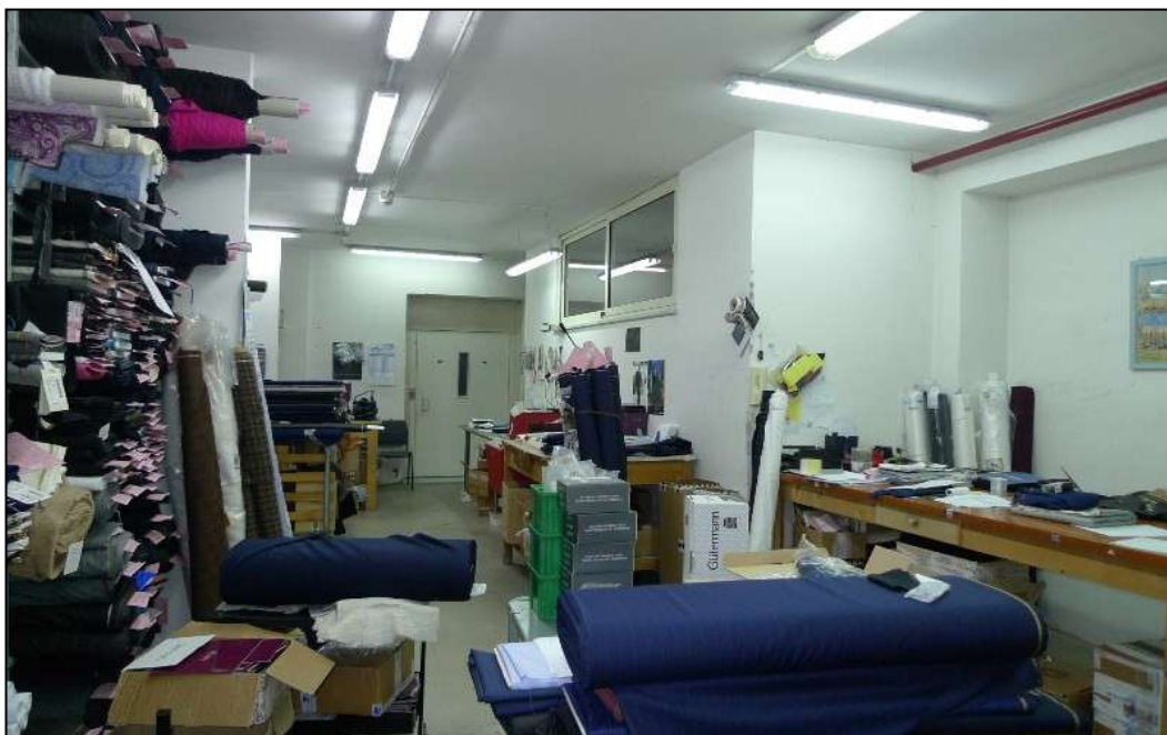
13) Area stoccaggio materie prime