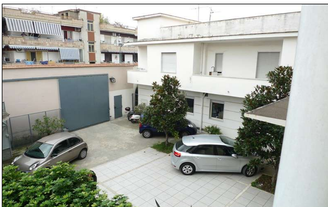
2) Vista dall'alto del piazzale di accesso.