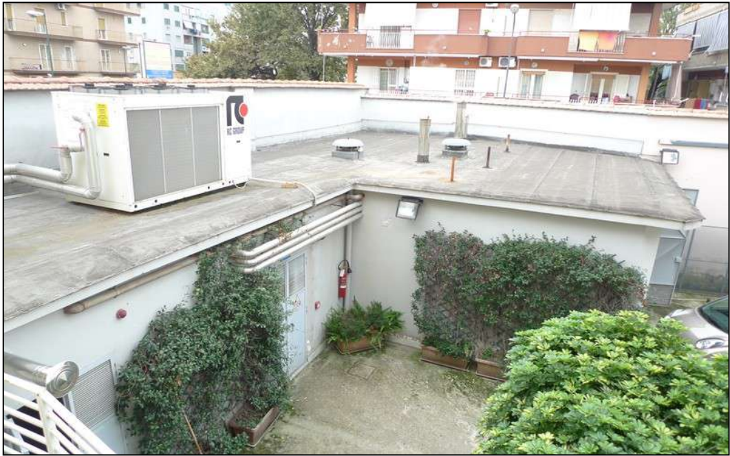
5) Corpo accessorio con locali tecnici.