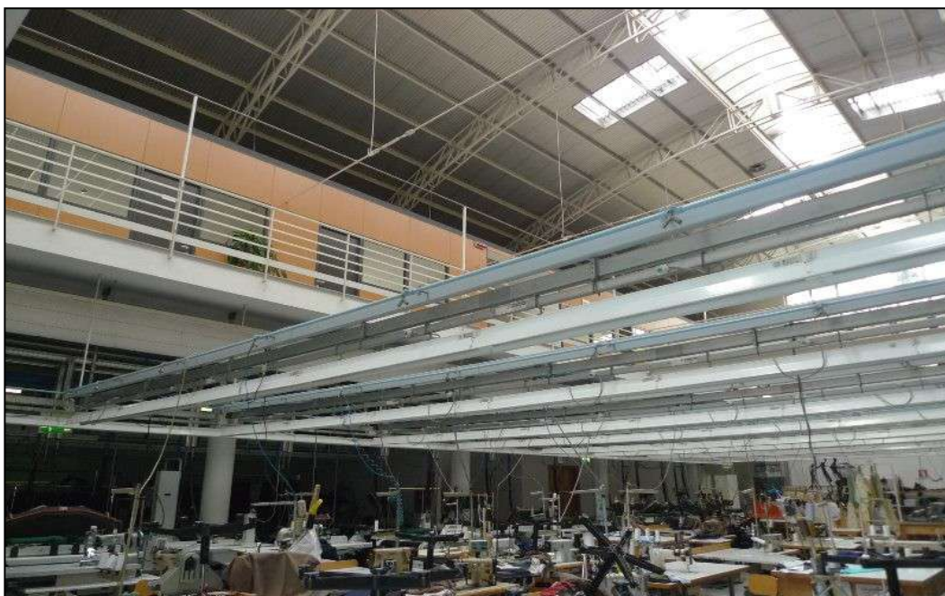
11) Sala lavorazioni