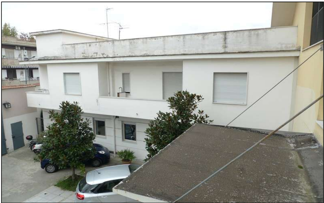
4) Corpo accessorio con atelier ed uffici.