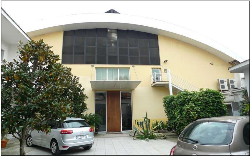
3) Ingresso principale.