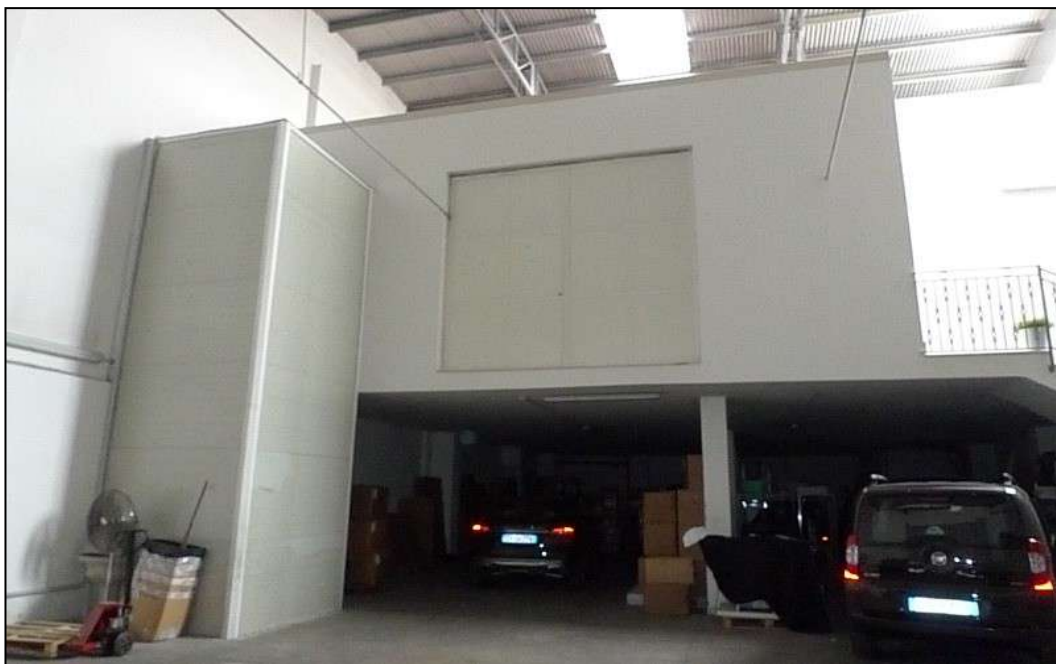
15) Il Deposito con montacarichi