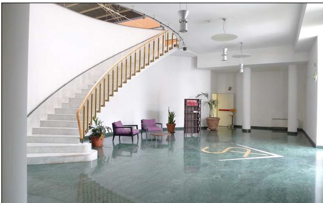
7) L'androne principale.