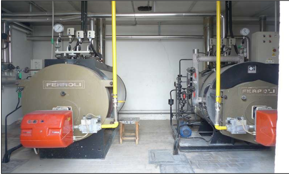
17) Interno del locale caldaia