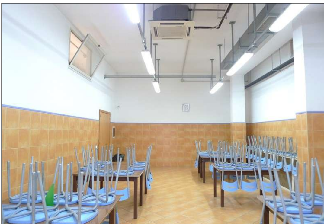
12) Refettorio operai