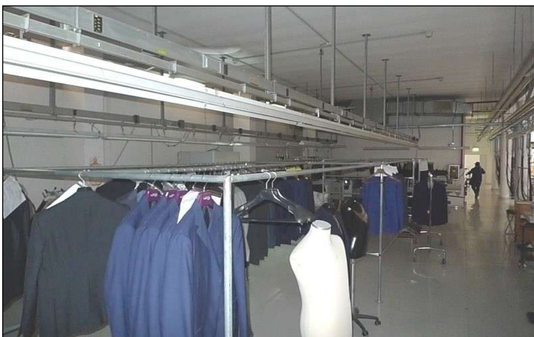
10) Corridoio laterale della sala lavorazioni