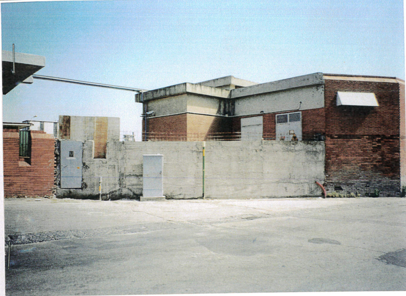
FOTO n° 11 : Muro di recinzione perimetrale in corso di ricostruzione.