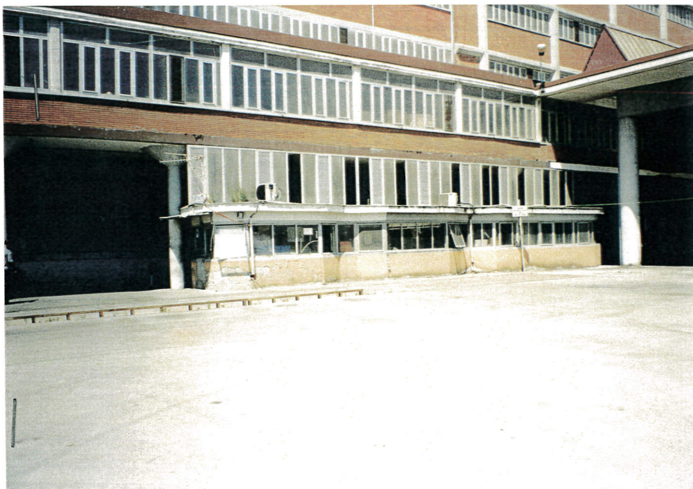
FOTO n° 4: Porticato antistante i molini ed Ufficio movimento e pesa