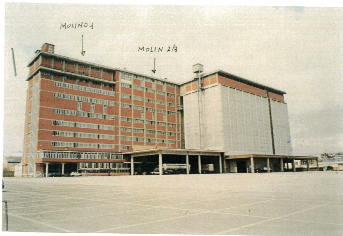
FOTO n° 1: Sono visibili i due molini (con rivestimento in mattoni rossi), i due silos, le pensiline e il porticato;