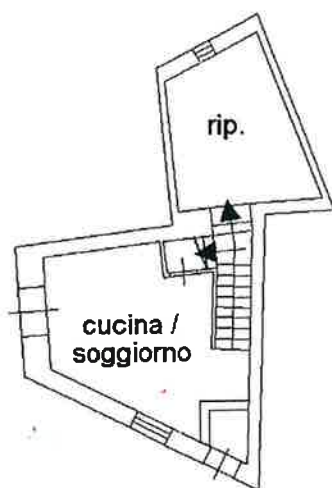
PIANO TERRA h=285