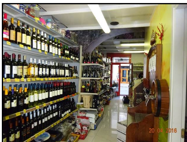
Vista interna del locale commerciale