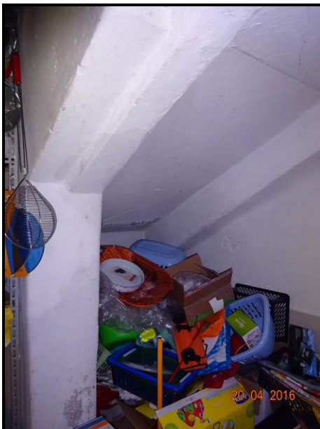
vista del locale sottoscala locale commerciale (ente Tav. C2)