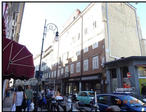
Prospetto edificio su Corso Saba