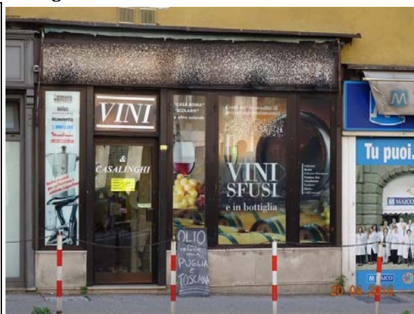
Prospetto edificio ed accesso all'immobile su via Carducci