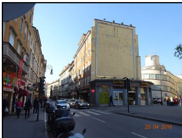
Vista dell'edificio da largo Barriera