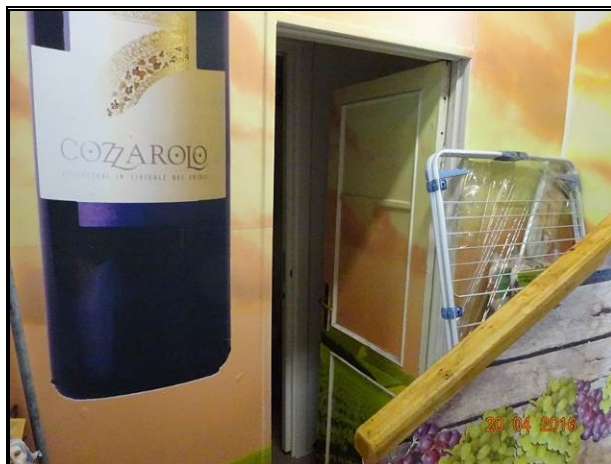
Accesso al servizio igienico