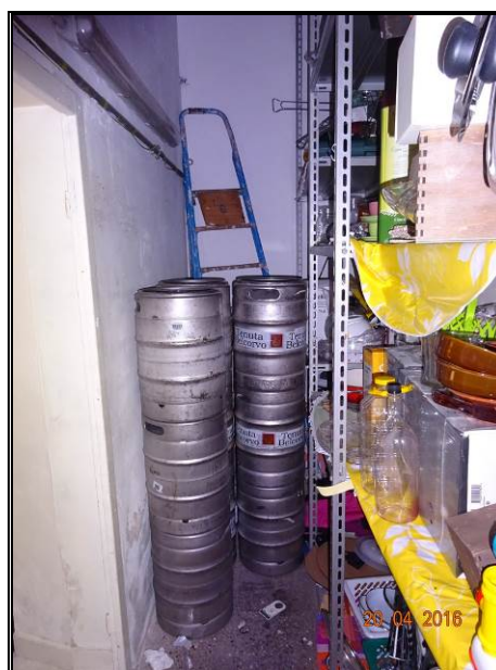
Vista del magazzino