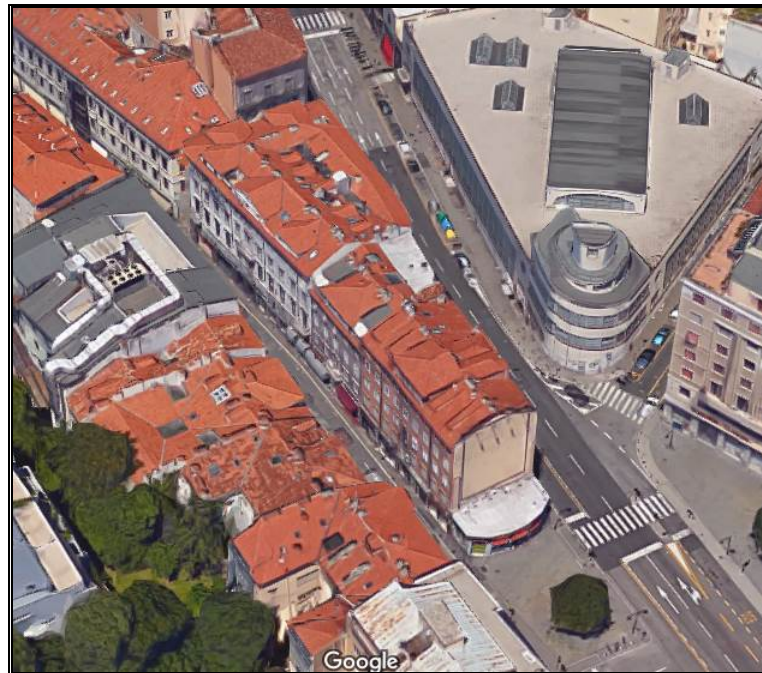
Inquadramento ambientale

Relazione Immobiliare Locale affari sito al pianoterra dell'edificio sito in Corso Saba n. 38 a Trieste R.E. 274/2015