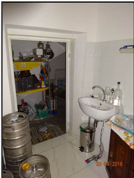
Vista del locale magazzino