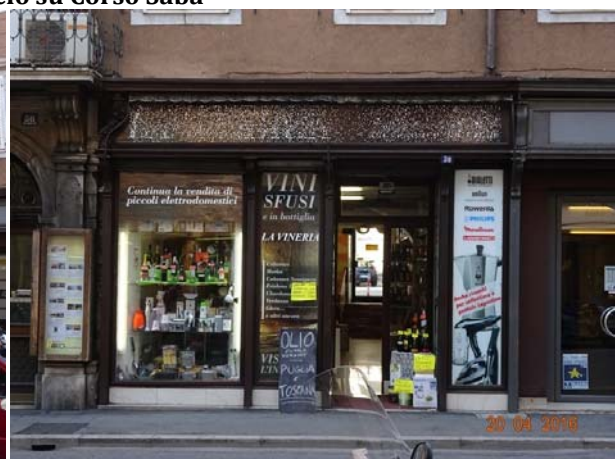
Particolare Prospetto ed accesso all'immobile su Corso Saba