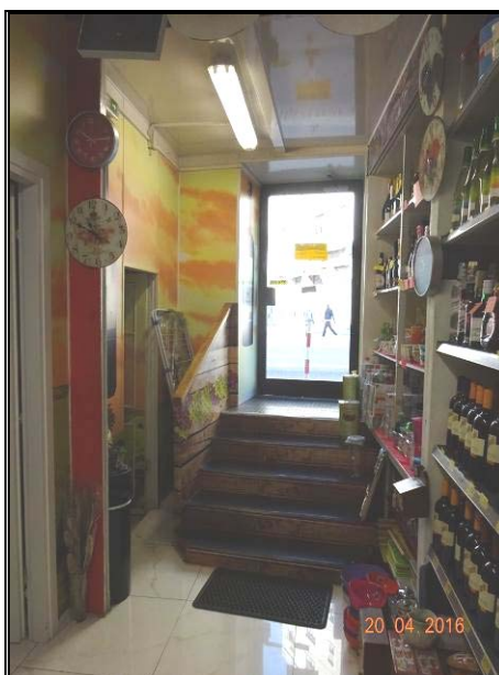
Vista interna del locale commerciale