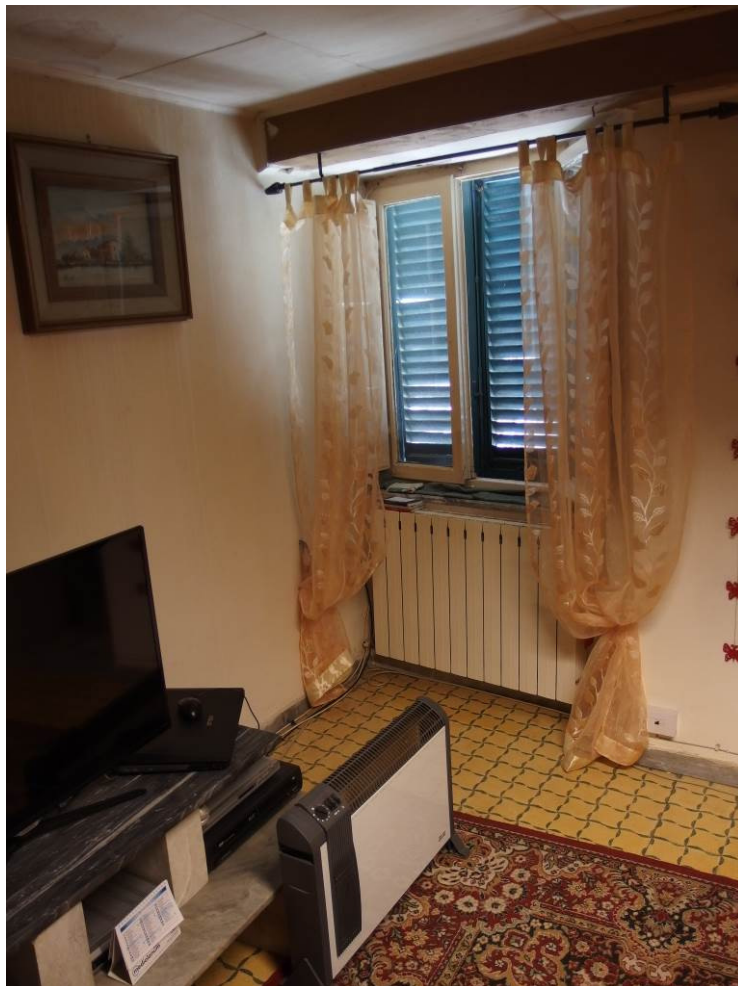
FOTO 15 _ vista interna del locale ad uso soggiorno al piano terra