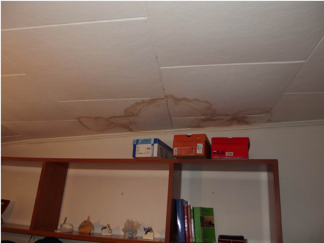
FOTO 19 _ particolare delle infiltrazioni nella controsoffittatura al piano terra