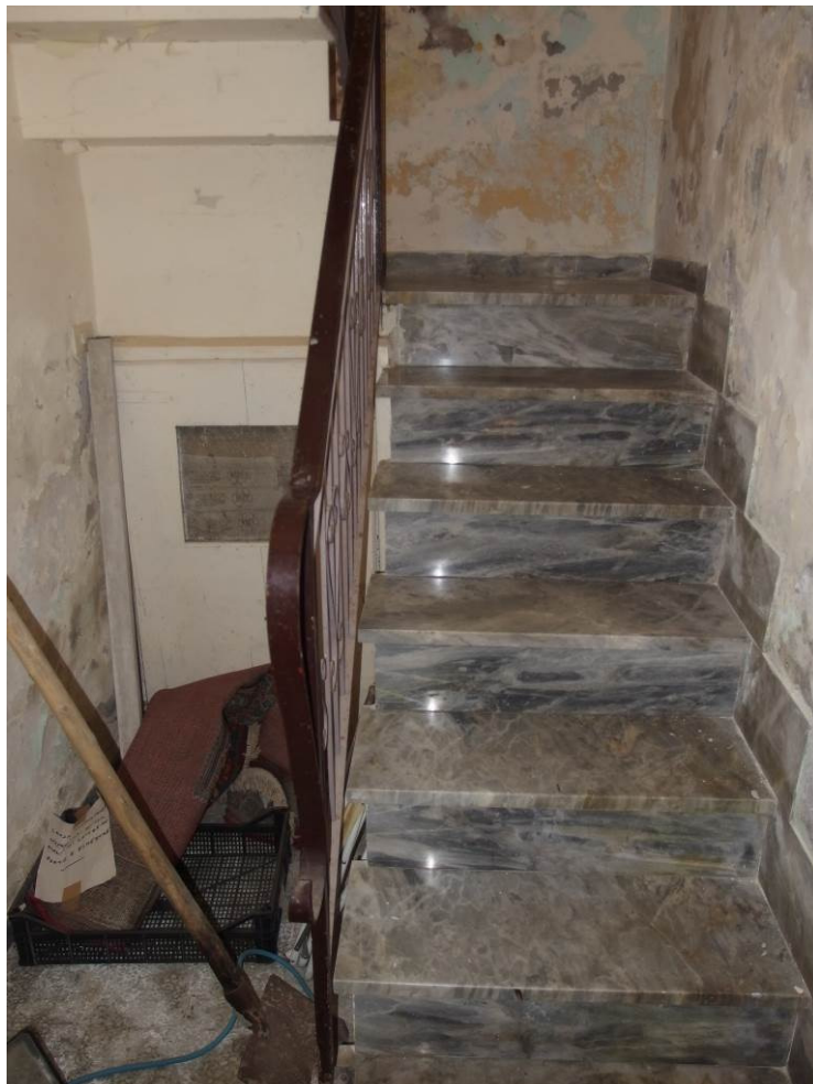
FOTO 9 _ vista interna del locale ad uso ingresso/scale al piano seminterrato