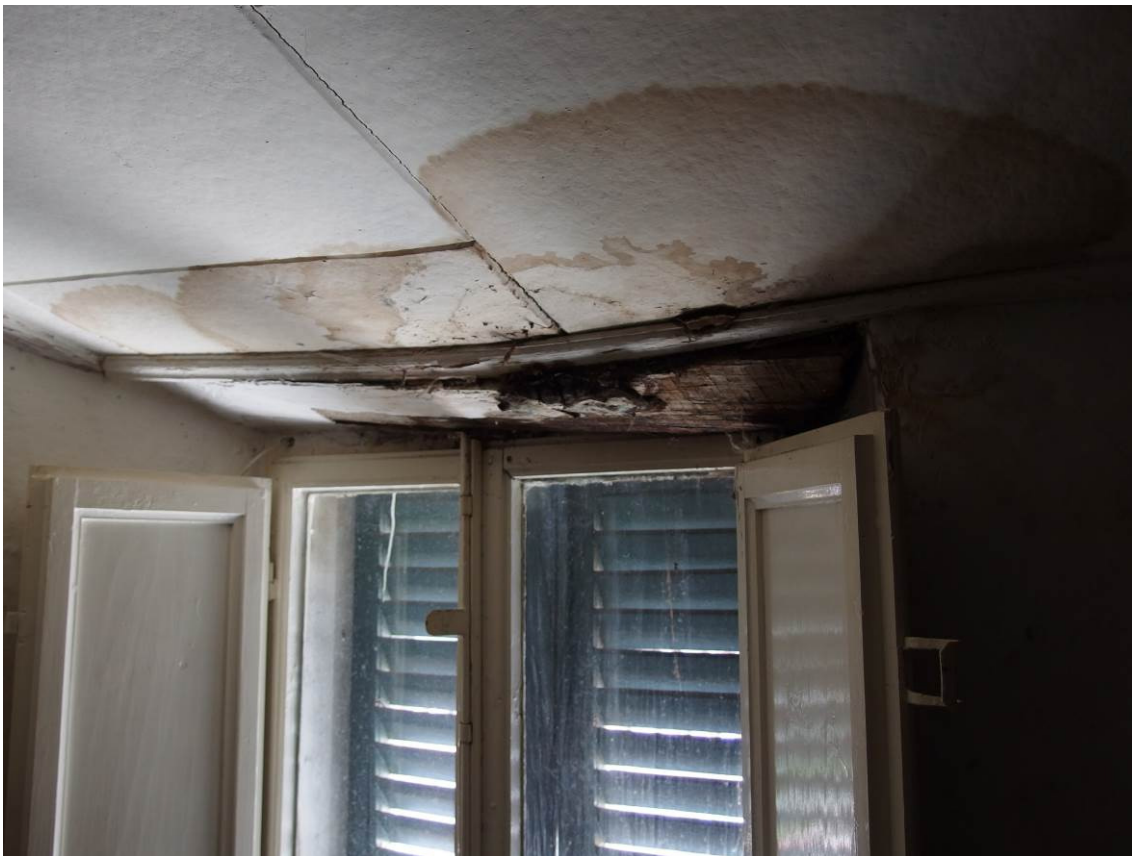
FOTO 25 _ particolare del cedimento dell'architrave della finestra di una camera al piano primo