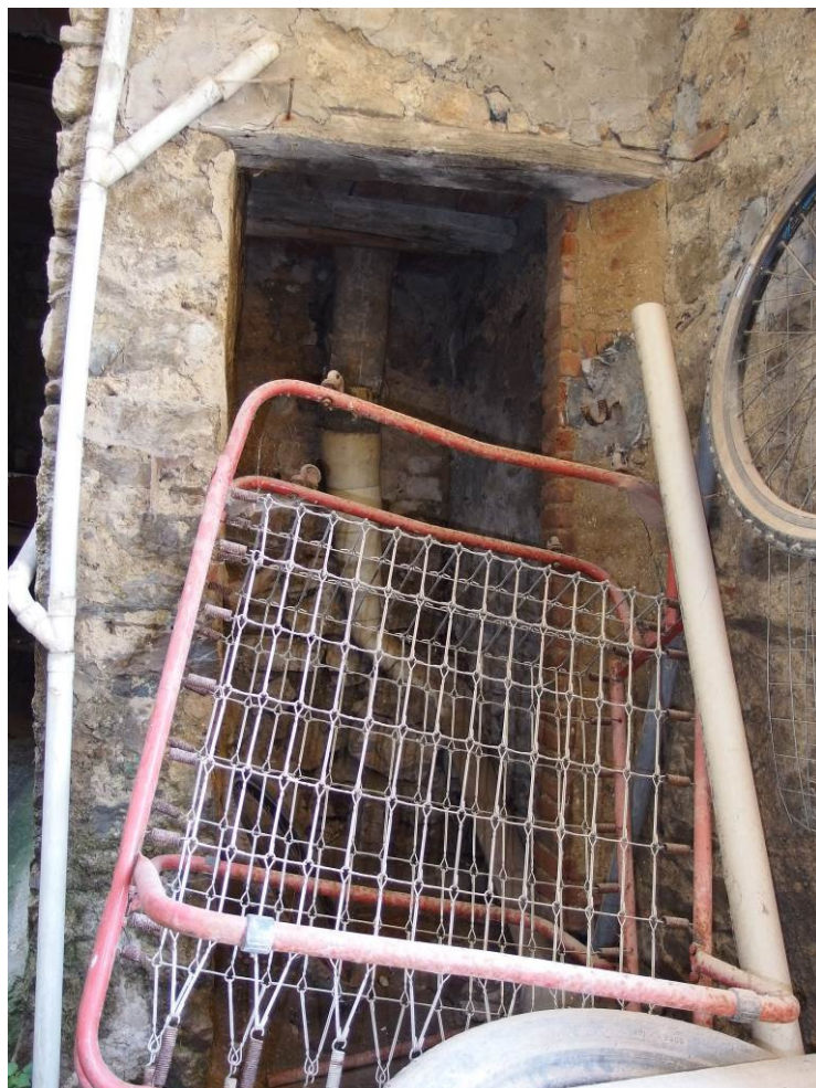
FOTO 4 _ locale ripostiglio al piano seminterrato