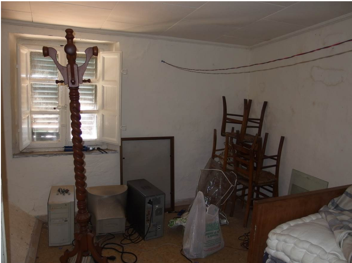
FOTO 22 _ vista interna del locale ad uso camera al piano primo