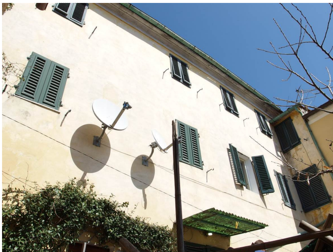
FOTO 2 _ prospetto Sud