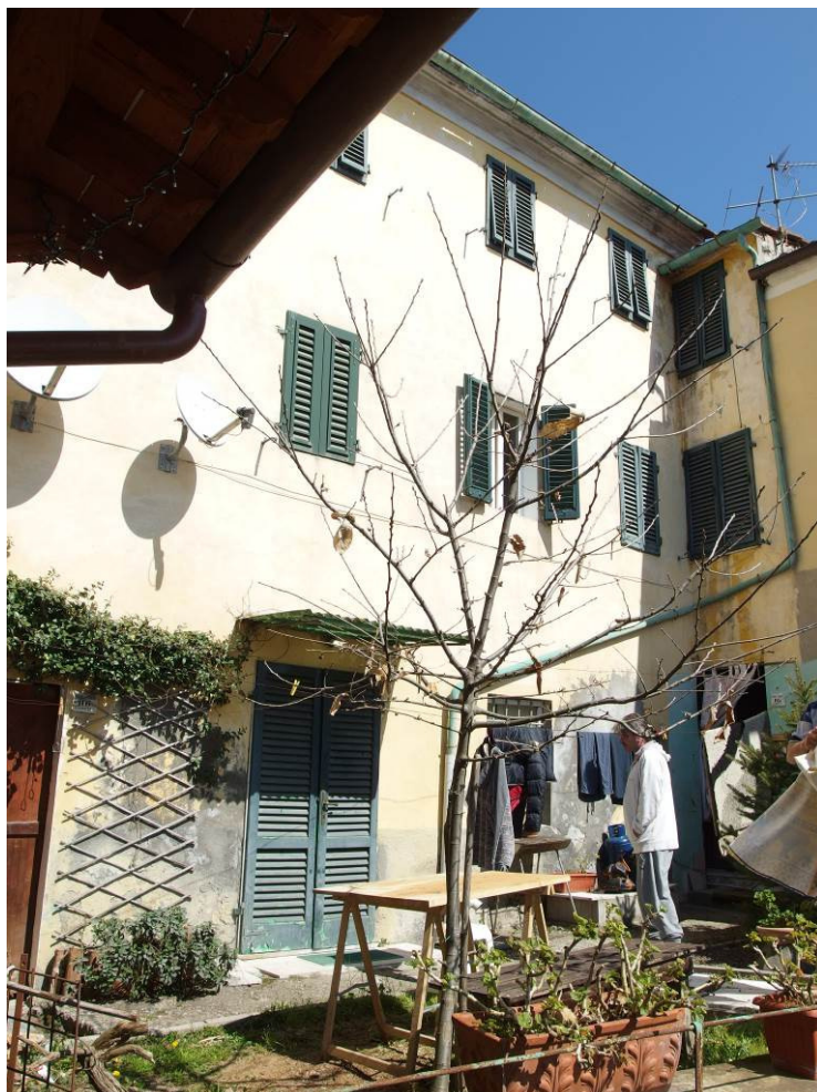
FOTO 1 _ prospetto Sud