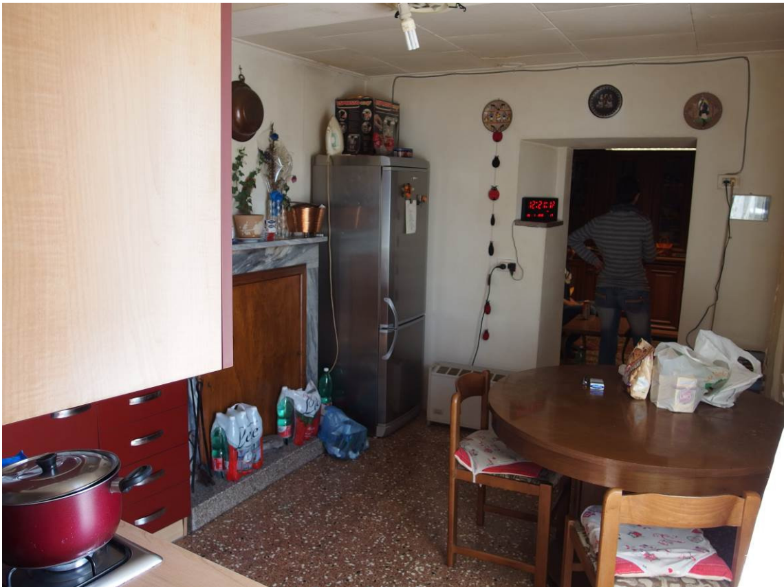
FOTO 14 _ vista interna del locale ad uso cucina al piano terra