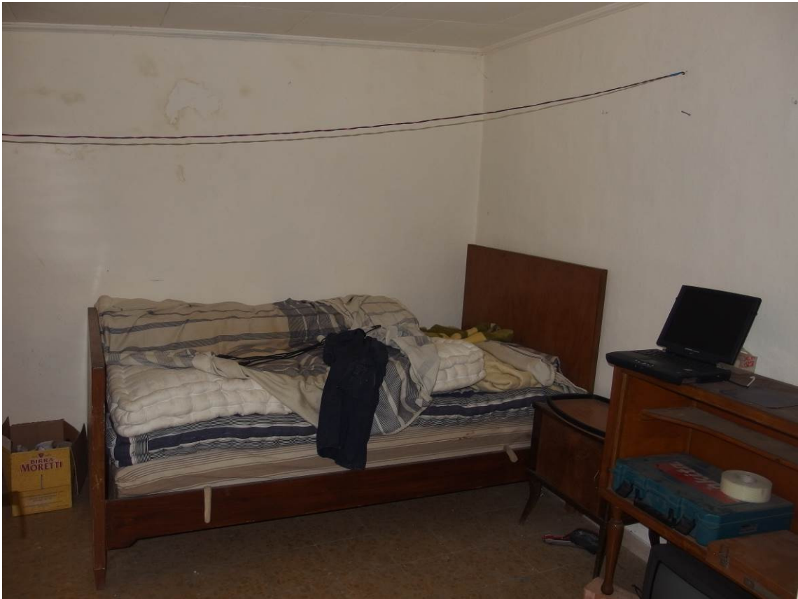
FOTO 21 _ vista interna del locale ad uso camera al piano primo