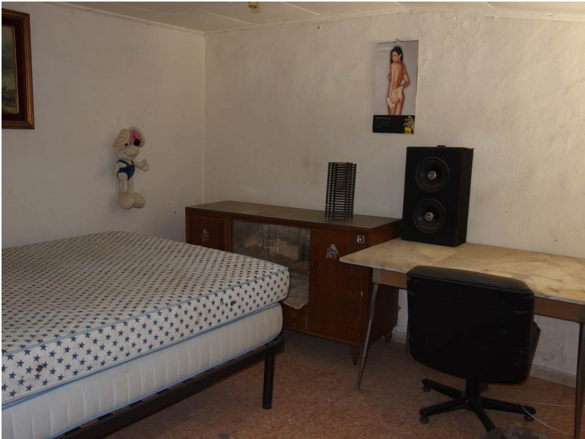
FOTO 23 _ vista interna del locale ad uso camera al piano primo