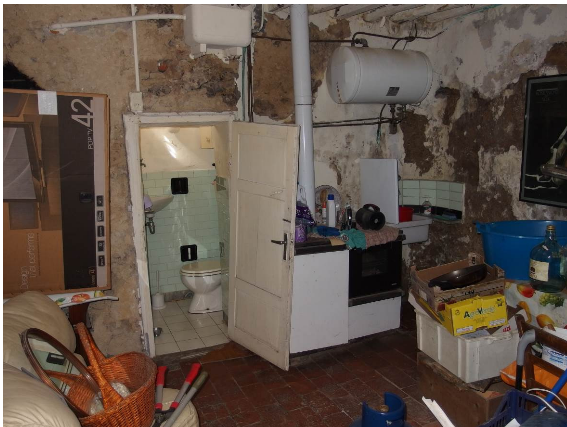
FOTO 10 _ vista interna del locale ad uso dispensa al piano terra