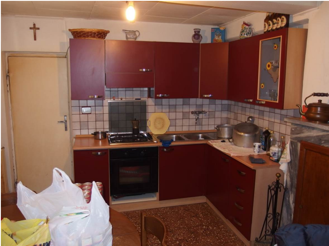
FOTO 13 _ vista interna del locale ad uso cucina al piano terra