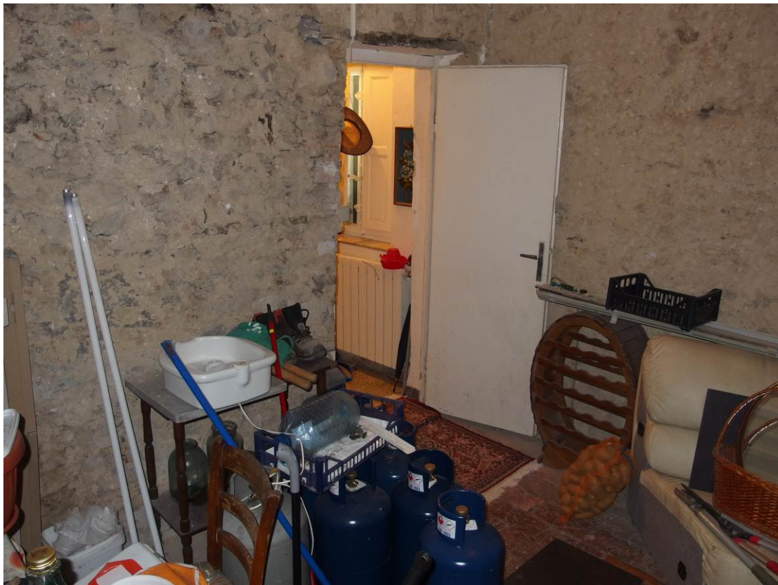
FOTO 11 _ vista interna del locale ad uso dispensa al piano terra