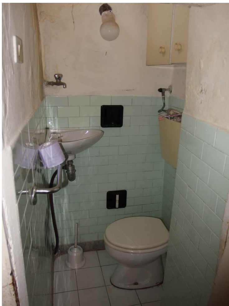
FOTO 12 _ vista interna del locale ad uso servizio igienico al piano terra