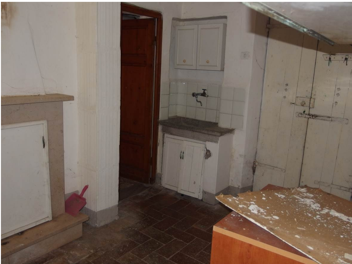
FOTO 28 _ vista interna del locale ad uso cucina al piano primo