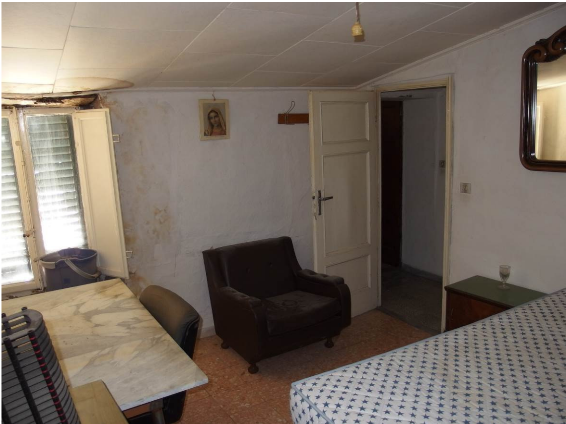
FOTO 24 _ vista interna del locale ad uso camera al piano primo