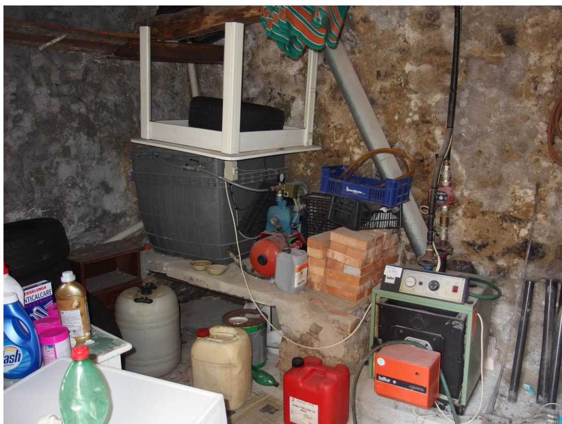
FOTO 6 _ vista interna del locale ad uso cantina al piano seminterrato