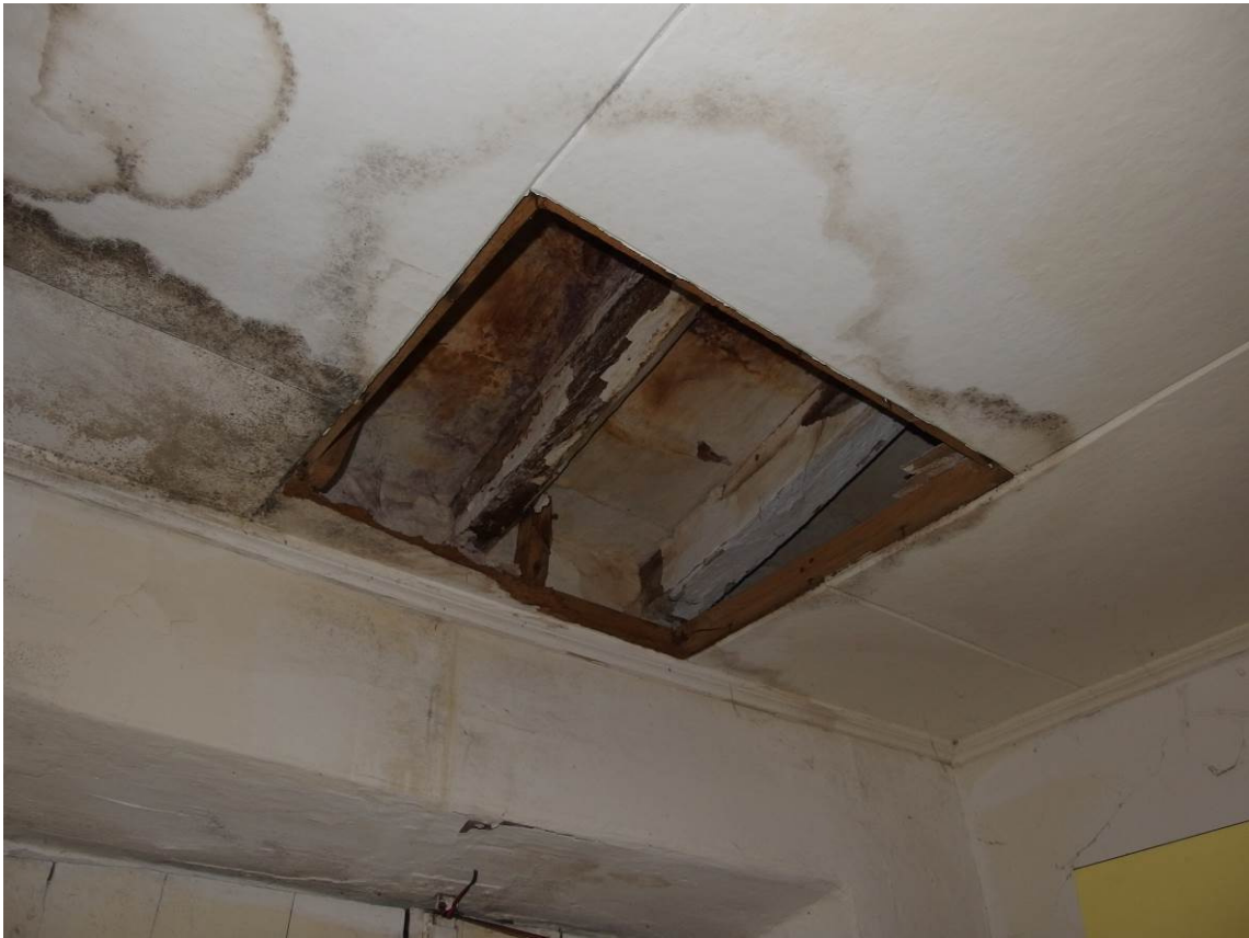
FOTO 29 _ particolare delle infiltrazioni nella controsoffittatura al piano primo