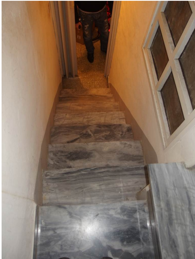
FOTO 20 _ scale di collegamento tra il piano terra e il piano primo