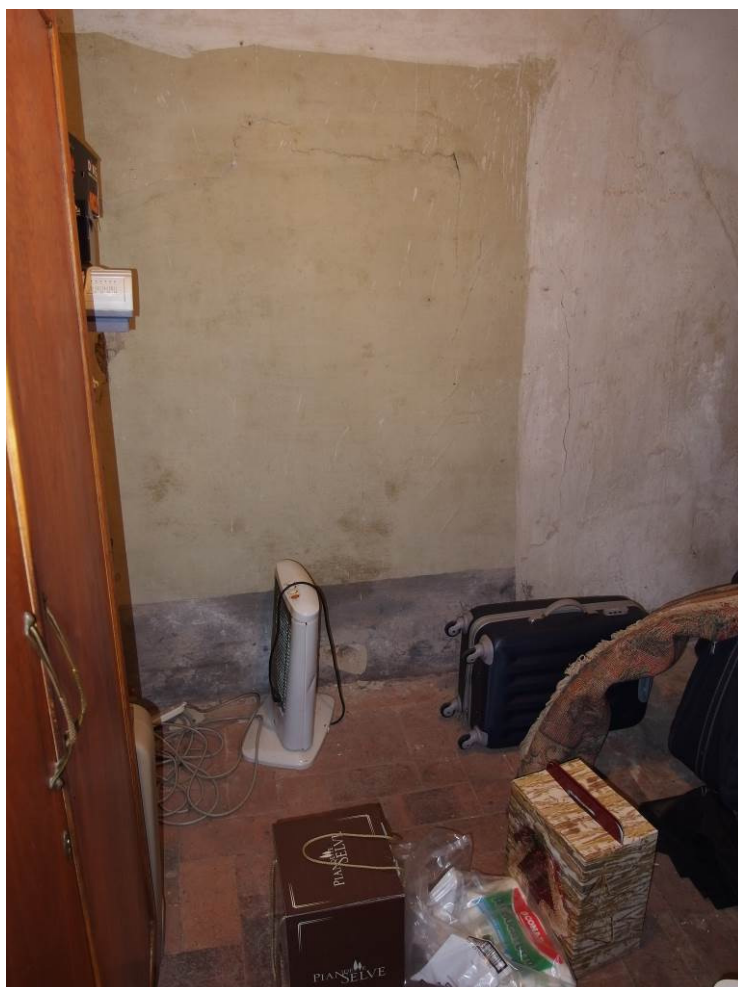
FOTO 16 _ vista interna del locale ad uso ripostiglio al piano terra