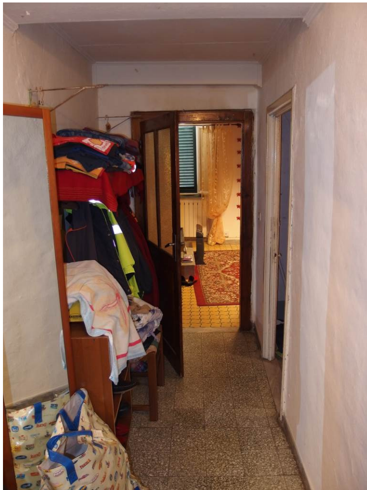
FOTO 17 _ vista interna del locale ad uso disimpegno al piano terra