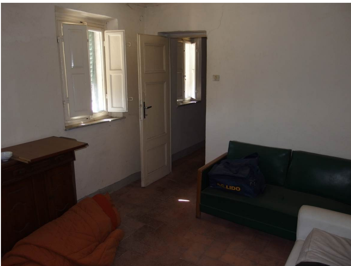
FOTO 26 _ vista interna del locale ad uso soggiorno al piano primo