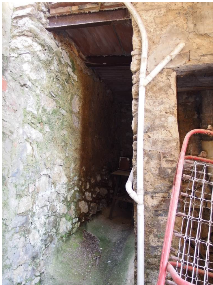
FOTO 5 _ locale di sgombero esterno al piano seminterrato