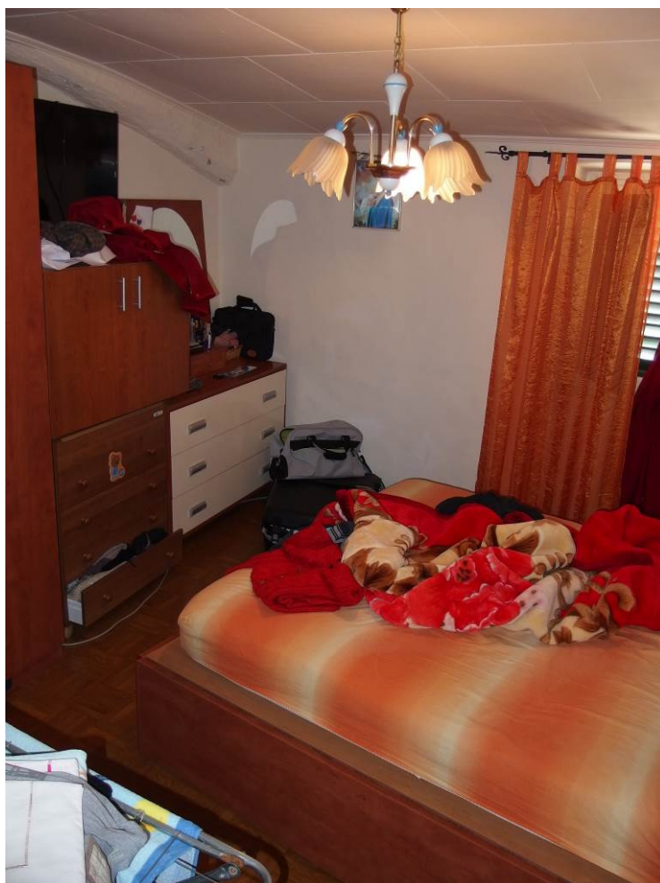
FOTO 18 _ vista interna del locale ad uso camera al piano terra