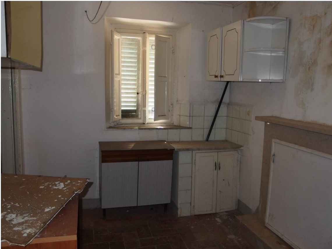
FOTO 27 _ vista interna del locale ad uso cucina al piano primo