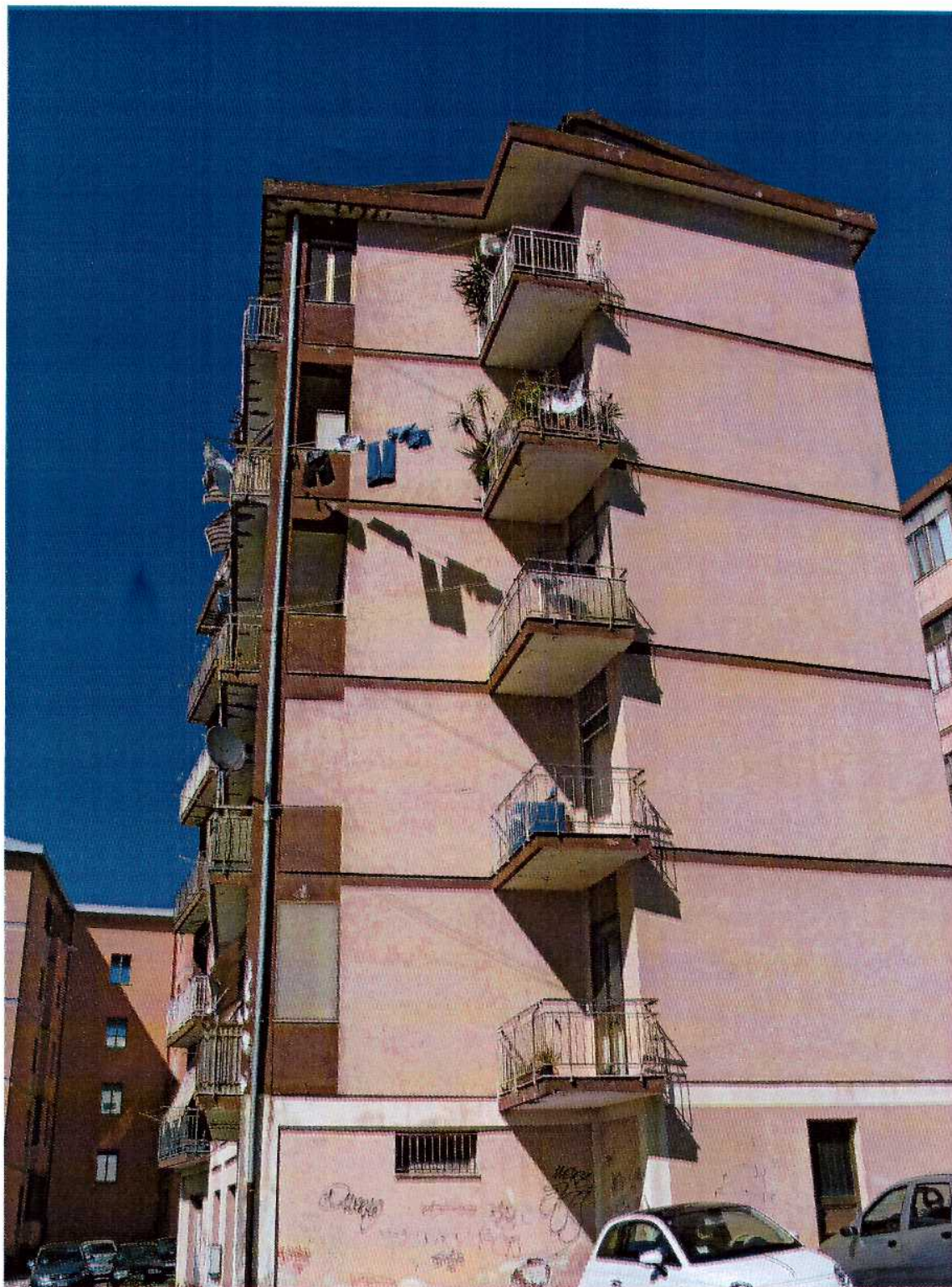
foto 6 - - Complesso ex IACP - via Aosta 6- Prospetto Sud