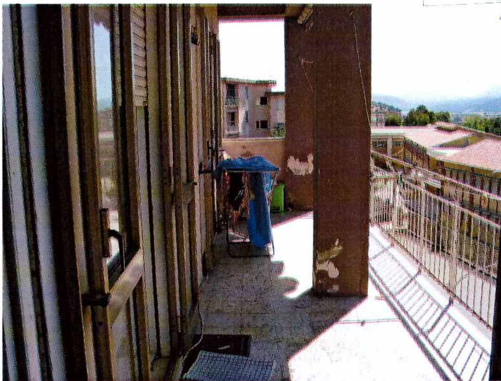
Foto 6 - Balcone