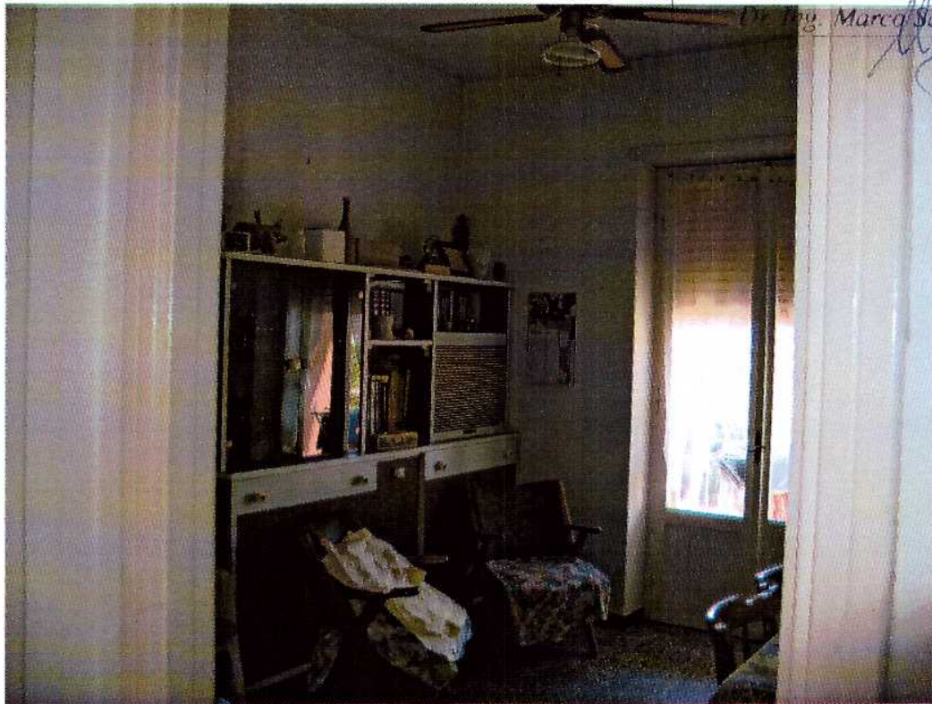
Foto 4 - Camera