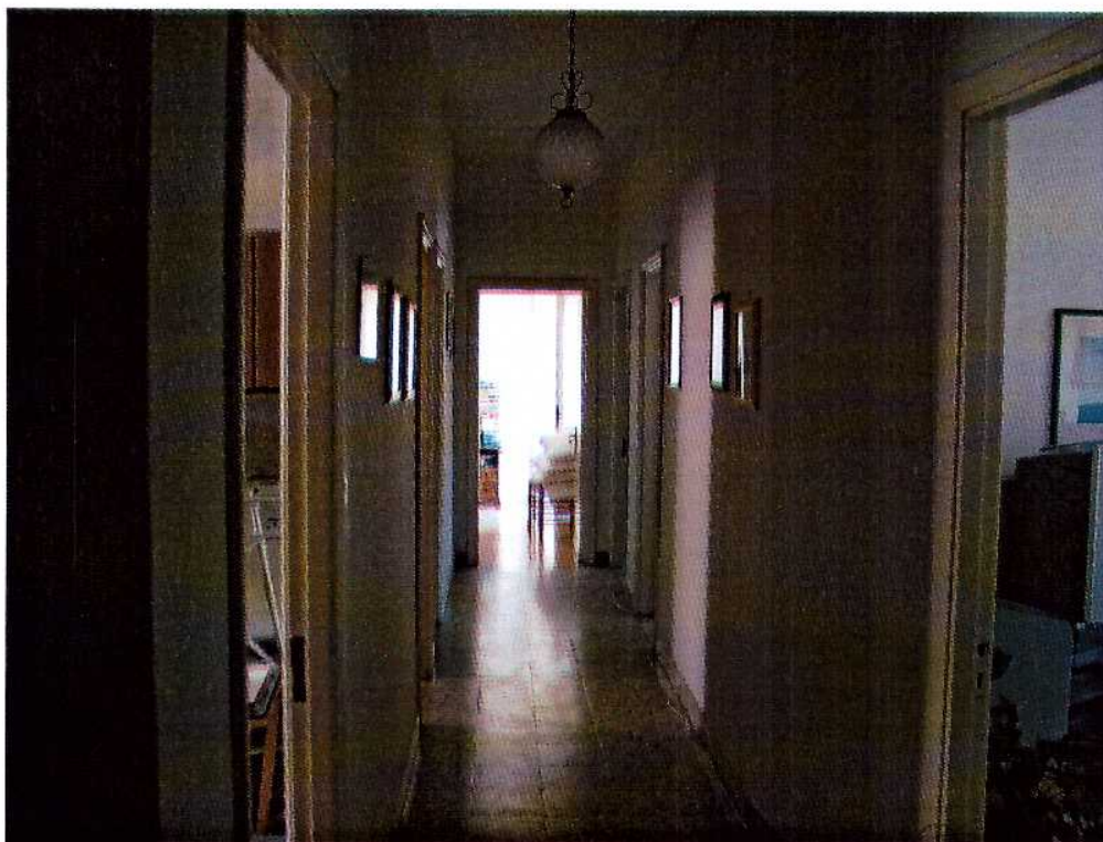
Foto 5 - Corridoio