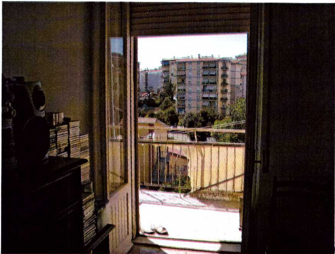
Foto 11 - Balcone