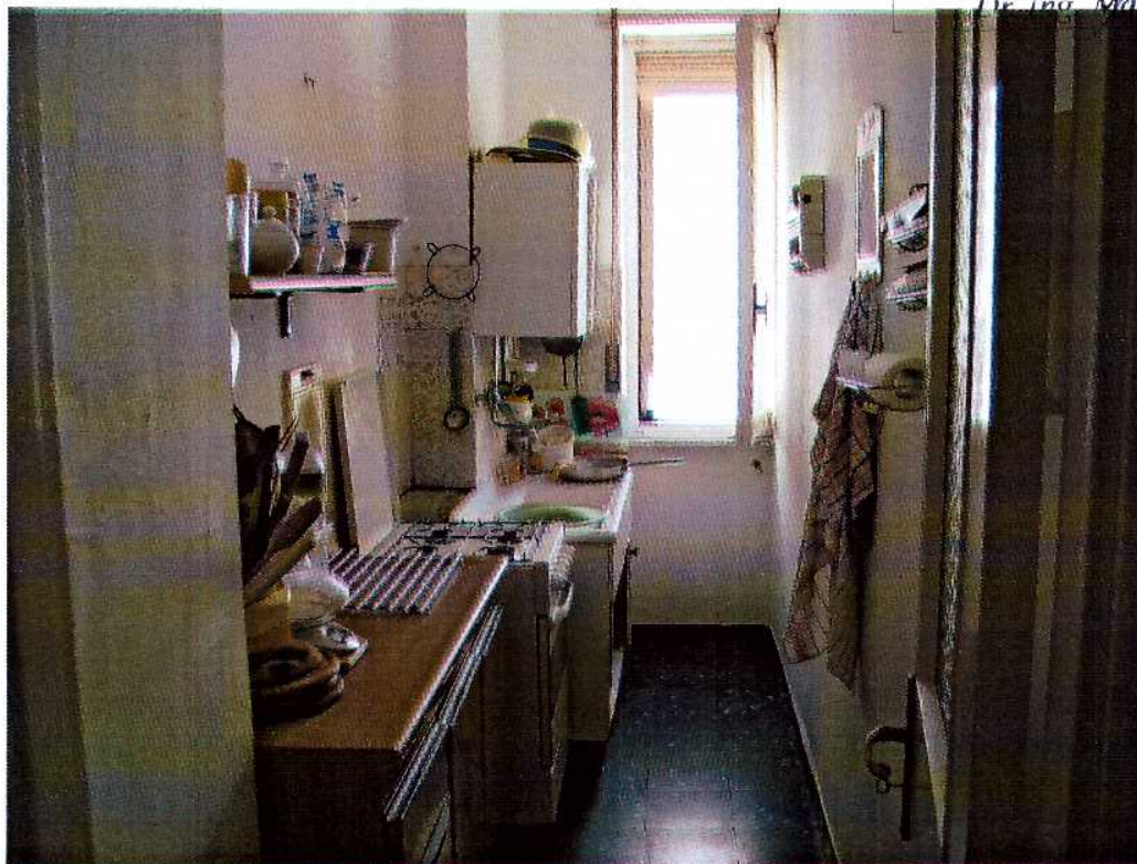
Foto 10 - Cucina