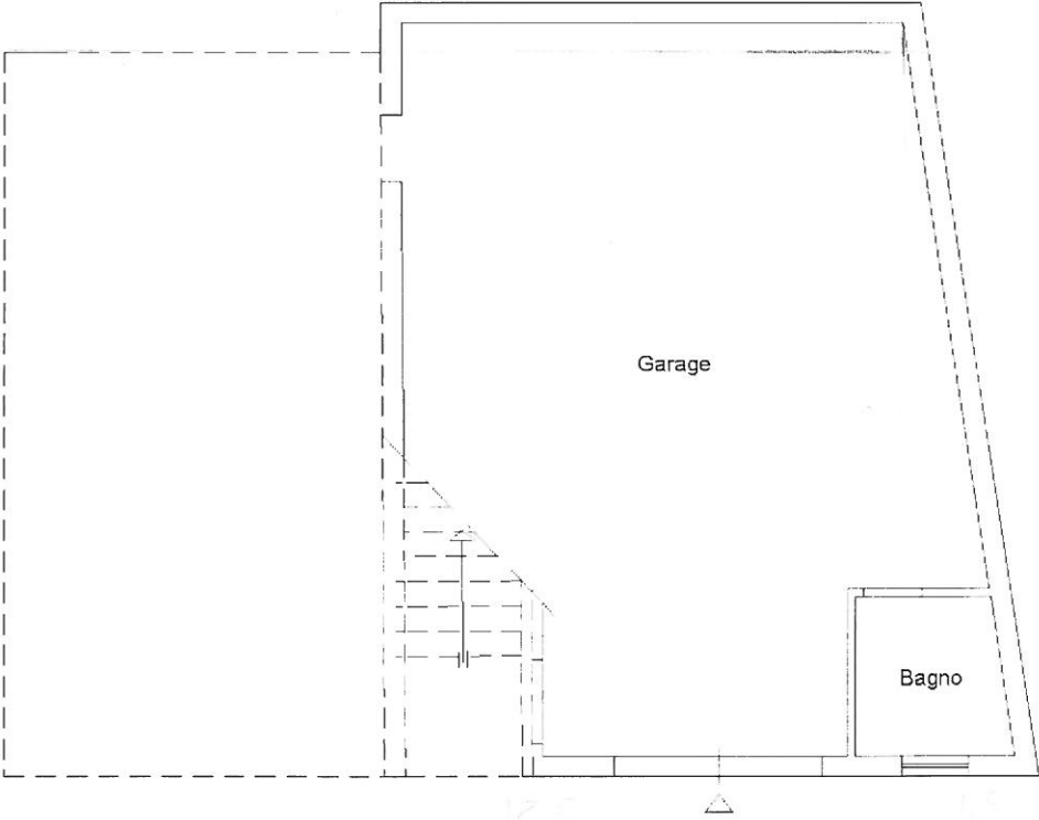
PIANO SEMINTERRATO H= 2,70