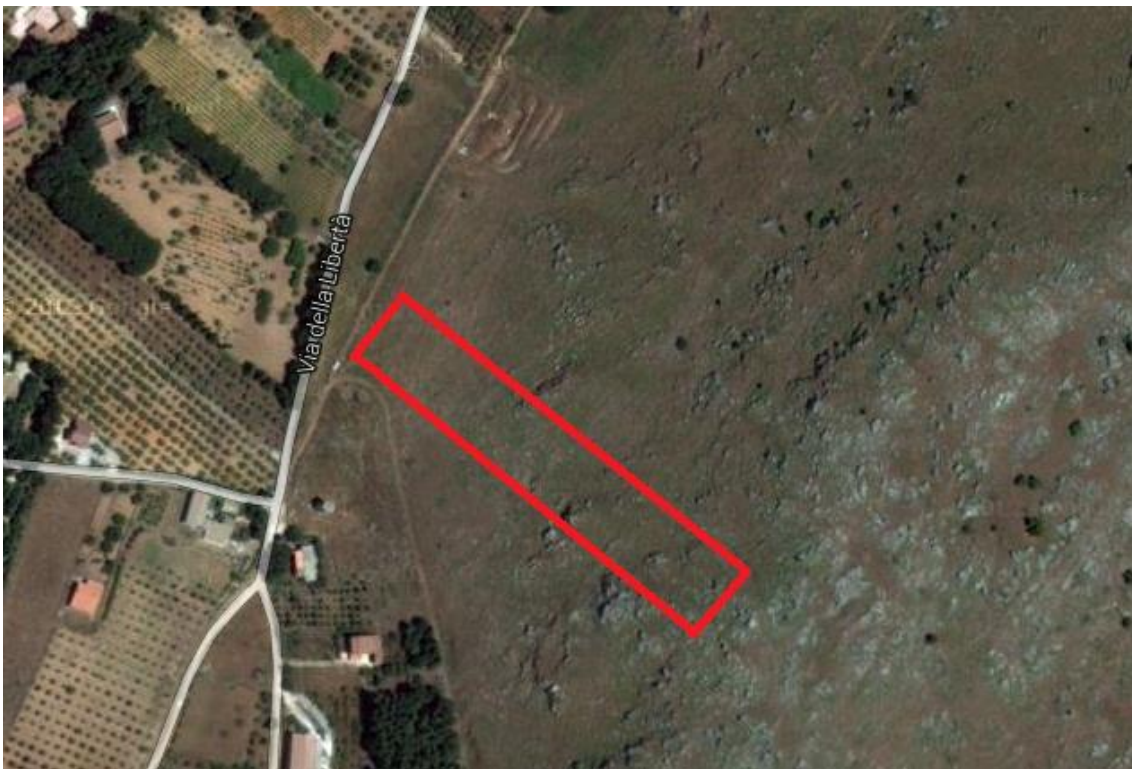
Fotografia 2: Ingombro dei terreni su una ripresa satellitare del luogo.