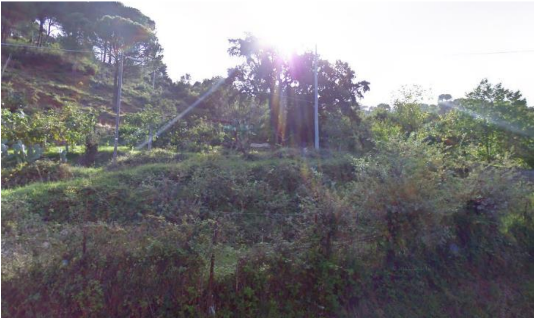
Fotografia 4: Vista dall' esterno del lotto.