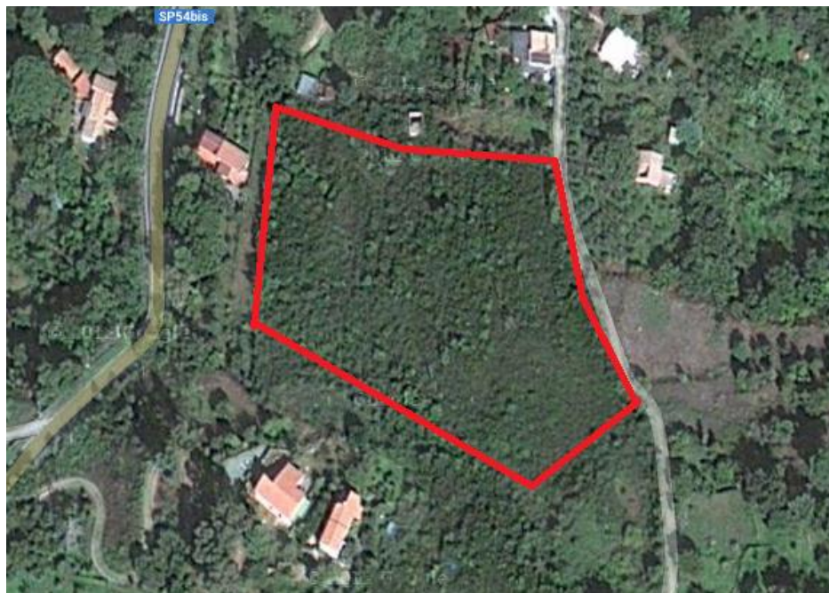
Fotografia 2: Ingombro del terreno su una ripresa satellitare del luogo.