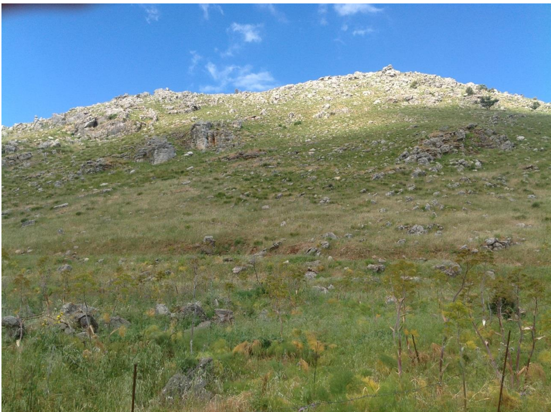
Fotografia 4: Vista dall'interno del lotto.