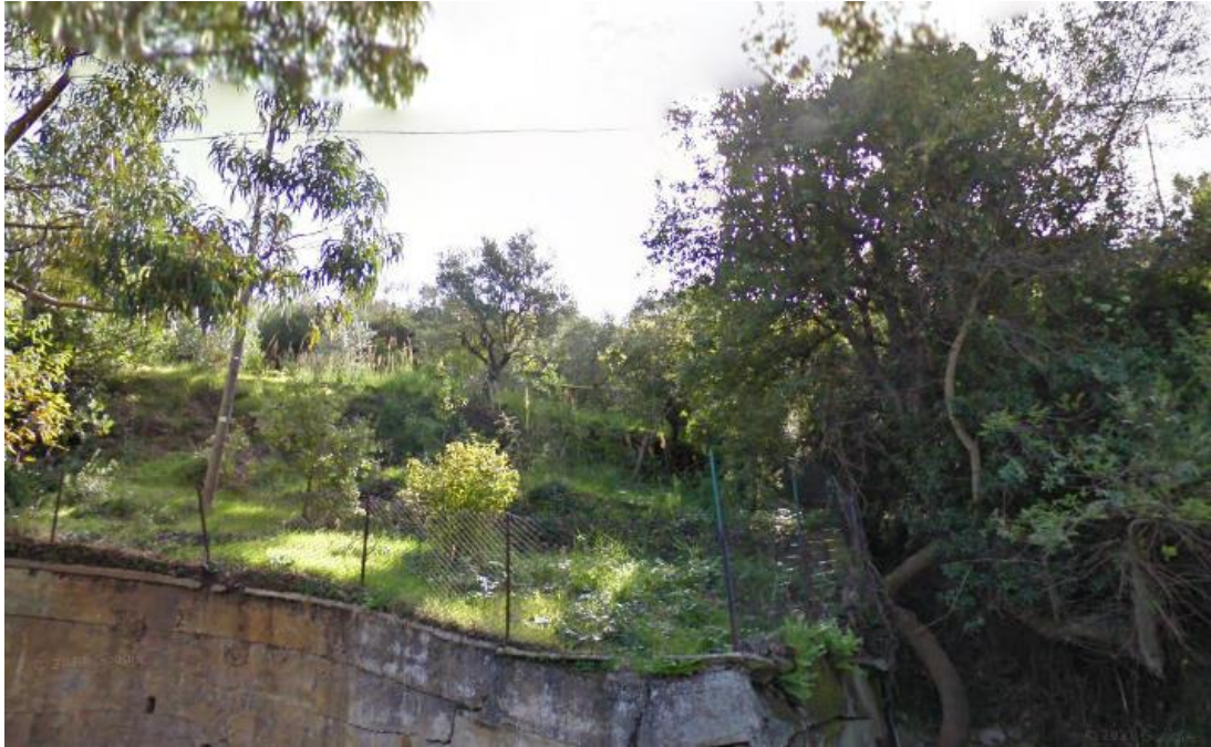
Fotografia 3: Vista dalla strada provinciale 54 bis.