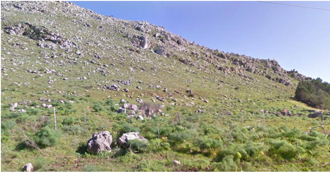
Fotografia 3: Vista dalla strada interpoderale.