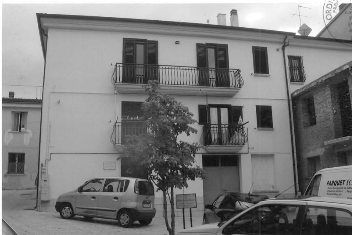
FOTO n° 7 – LOCALE TERRANEO ALLA PIAZZA C. BATTISTI - mq 34,37 PART. N° 929 – FINESTRA MURATA E PORTA