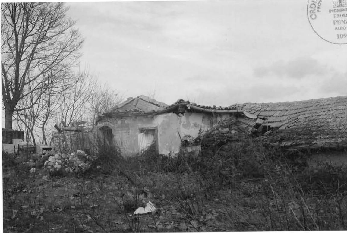
FOTO n° 19 – Quel che resta dell'abitazione alla cui destra vi è la parte terminale della neviera