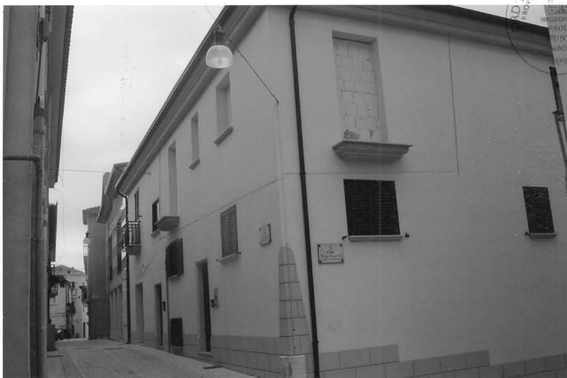
FOTO n° 5 – APPARTAMENTO AL CORSO VITTORIO EMANUELE - Particella N° 929 VISTA DEI PROSPETTI CON FINESTRE E BALCONI MURATI