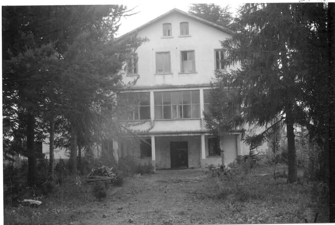
FOTO n° 9 – EX STAZIONE CARABINIERI ALLA VIA PETRILE VISTA DALLA STRADA