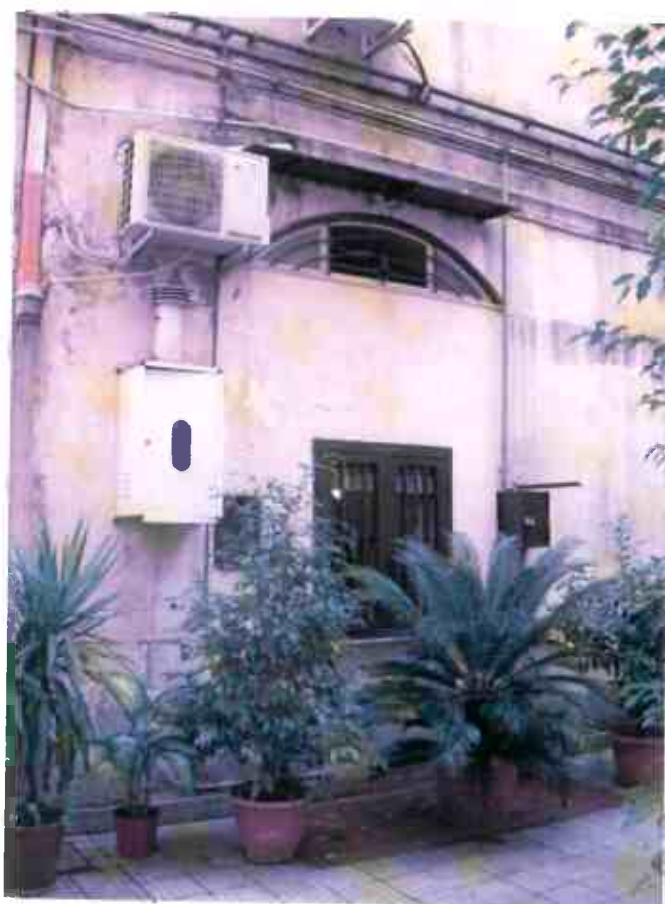
FOTO N. 18 – finestra porzione di unità i. 2 che affaccia sul cortile