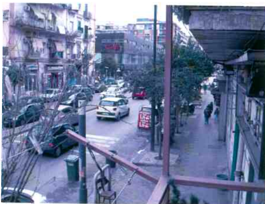
FOTO N. 14 – Porzione unità i. 1: balcone con affaccio su via Arenaccia