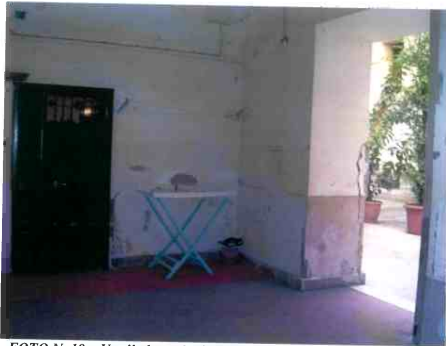
FOTO N. 19 – Vestibolo scala G con accesso alla porzione d'unità i. 2