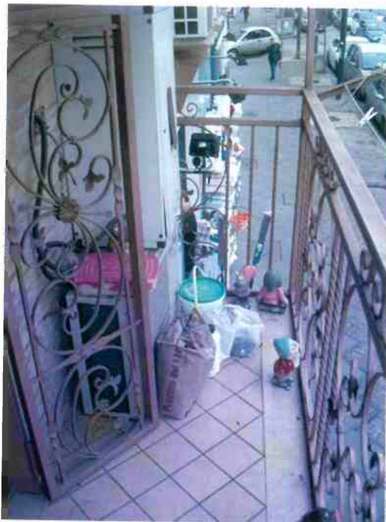
FOTO N. 13 – Porzione unità i. 1: balcone con affaccio su via Arenaccia