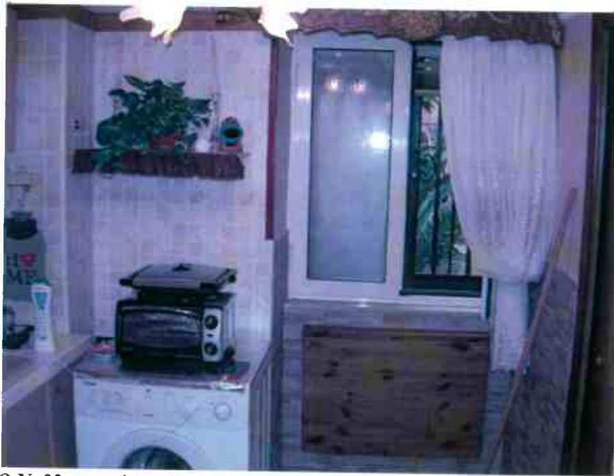
FOTO N. 22 – porzione d'unità i. 2: soggiorno con finestra che affaccia sul cortile