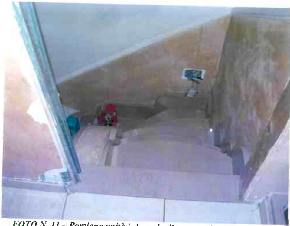
FOTO N. 11 – Porzione unità i. 1: scala d'accesso al piano soppalcato