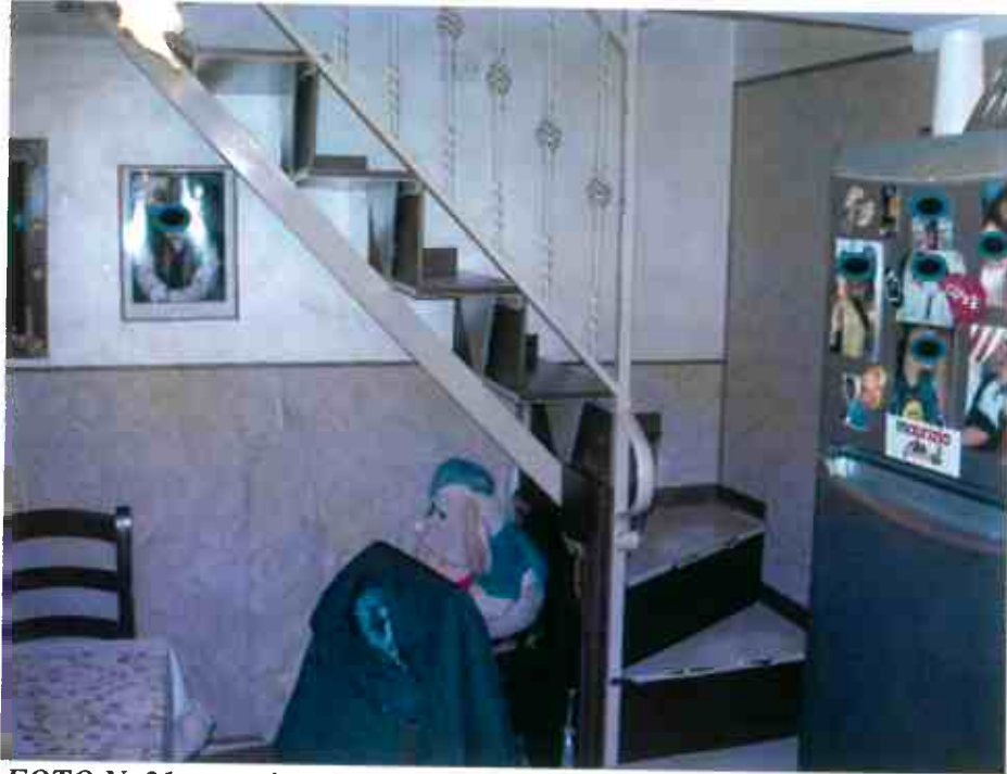
FOTO N. 21 – porzione d'unità i. 2: soggiorno con particolare della scala