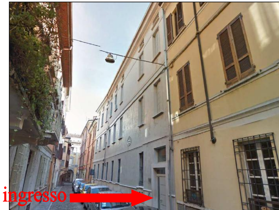
Ripresa n. 1: VISTA ESTERNA da Via Galana con indicazione ingresso all'edificio