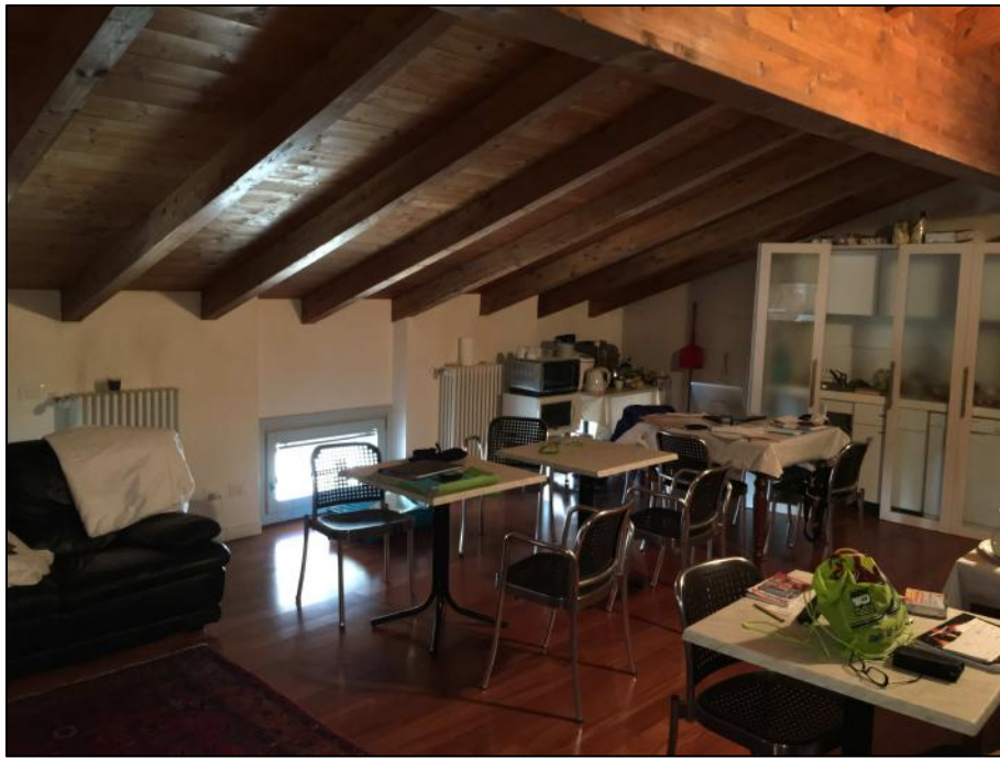
Ripresa n. 5: zona giorno (soggiorno/pranzo)