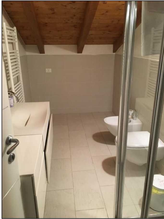
Ripresa n. 9: servizio igienico