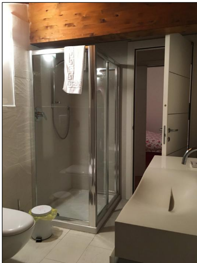
Ripresa n. 8: servizio igienico