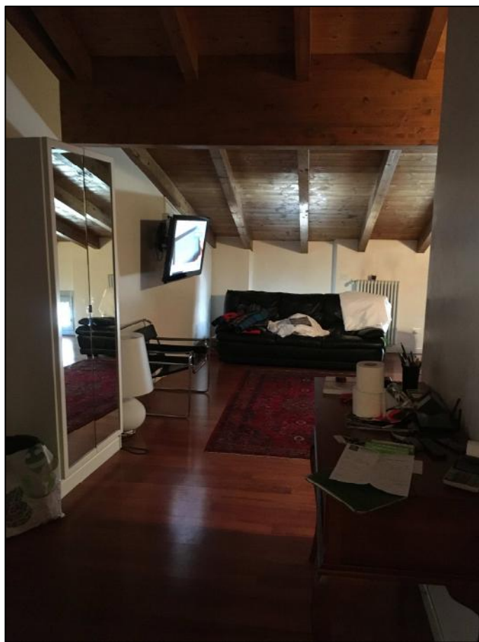
Ripresa n. 3: ingresso su zona giorno