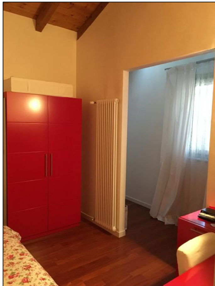
Ripresa n. 6: letto (vano centrale)