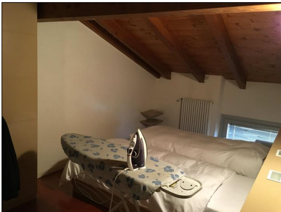
Ripresa n. 7: letto (vano a sud/est)