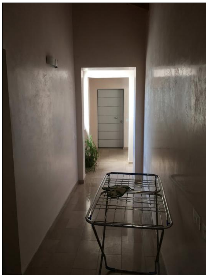
Ripresa n. 2: corridoio di distruzione delle 3 unità immobiliari al piano sottotetto