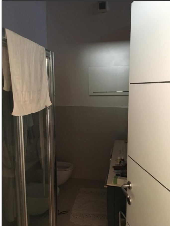
Ripresa n. 5: servizio igienico