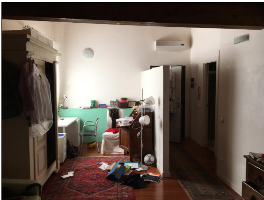
Ripresa n. 3: zona giorno (soggiorno/cucina)