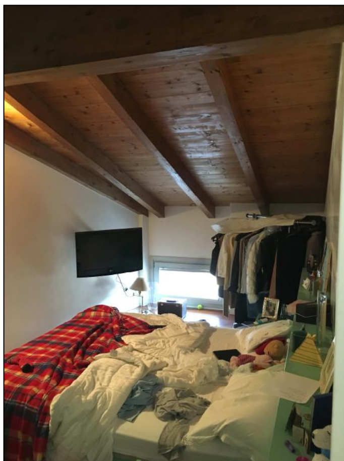
Ripresa n. 4: camera da letto