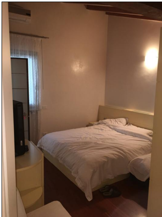
Ripresa n. 5: camera da letto