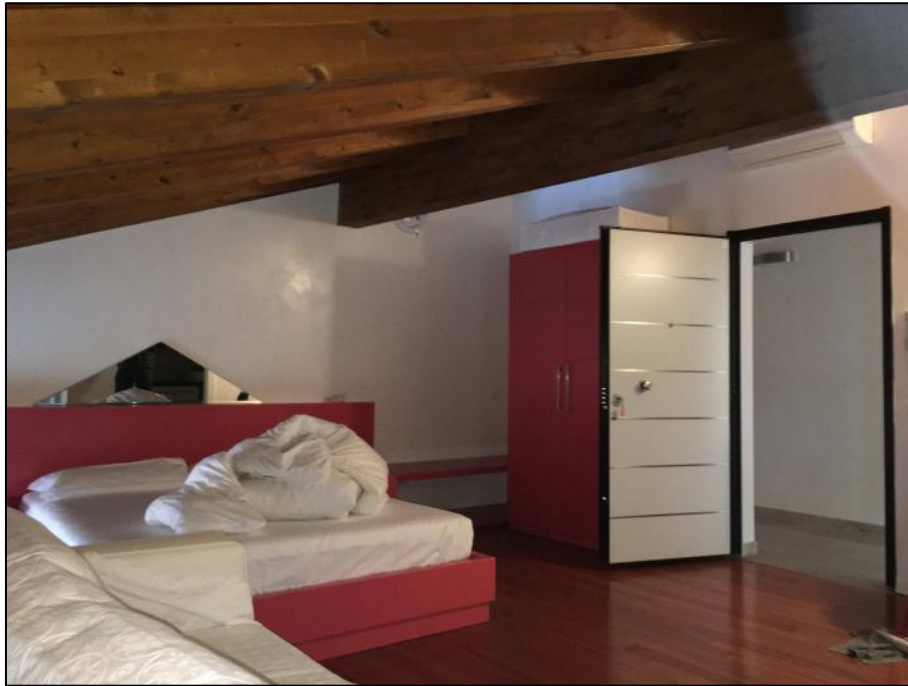
Ripresa n. 3: zona giorno (soggiorno/cucina) - attualmente adibita a camera da letto