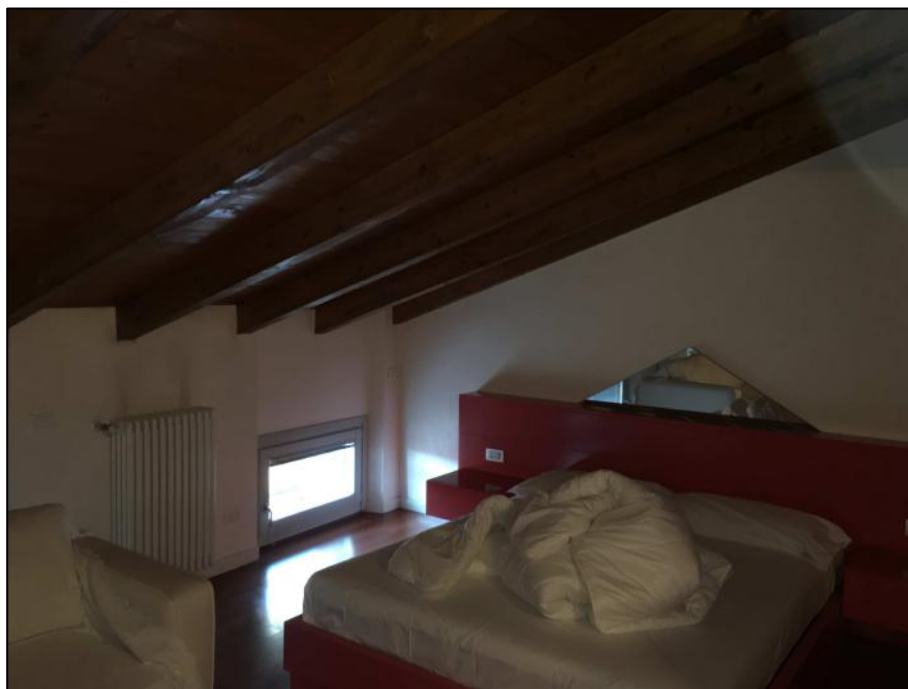
Ripresa n. 4: zona giorno (soggiorno/cucina) - attualmente adibita a camera da letto