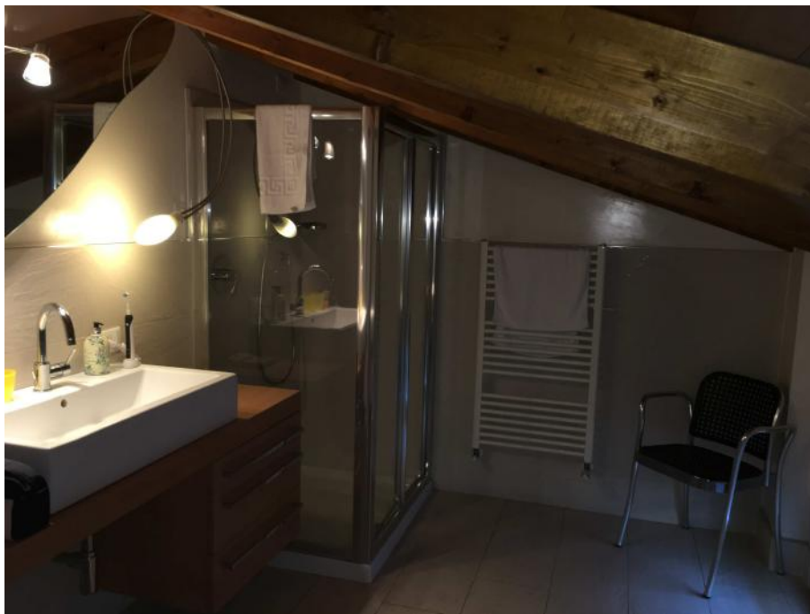
Ripresa n. 6: servizio igienico