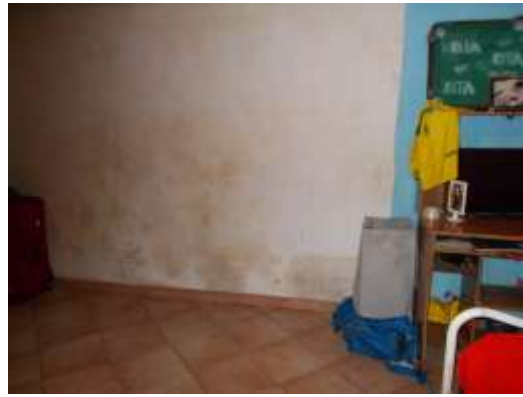
26. Macchie di umidità nel locale al piano interrato