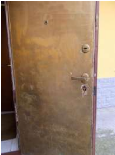
11. Portoncino di ingresso