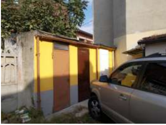
7. Locale cantina nel cortile