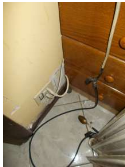
30. Collegamenti elettrici non appropriati