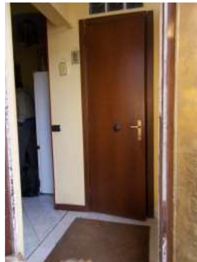
12. Zona di ingresso con porta del bagno