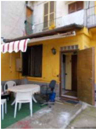
9. Particolare dell'ingresso all'immobile pignorato