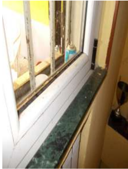
34. Particolare del serramento esterno