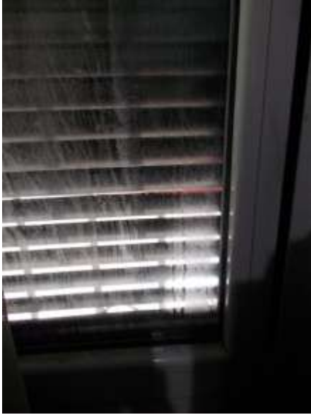
31. Gocce di condensa sul vetro del serramento esterno