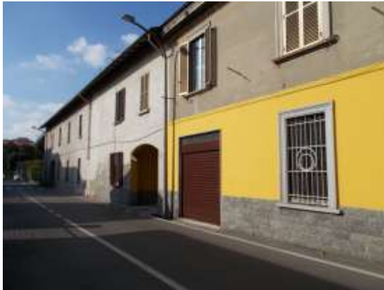
1. Facciata esterna dalla strada