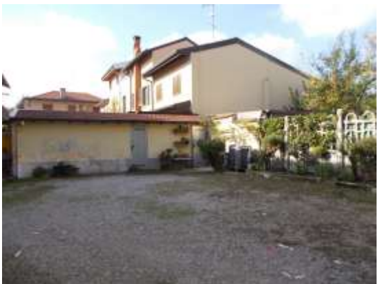
6. Cortile comune