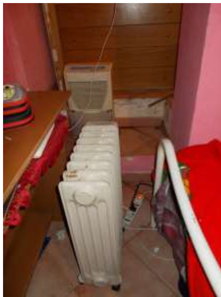
29. Riscaldamento elettrico del piano interrato