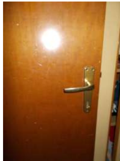
22. Porta interna