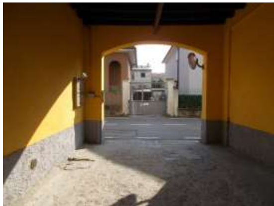
3. Ingresso carrabile