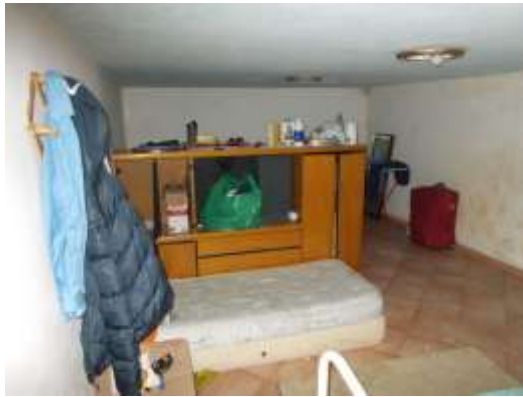
25. Locale al piano interrato