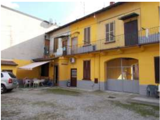
5. Facciata interna