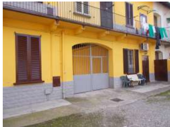
4. Cortile comune