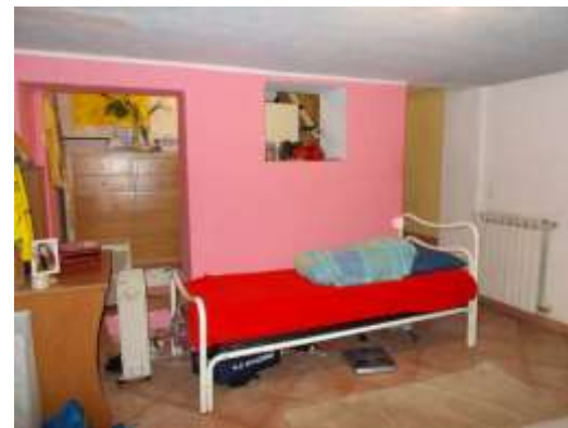
28. Locale al piano interrato