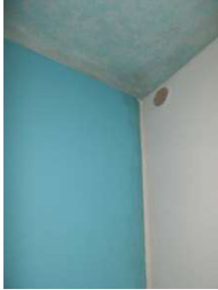
32. Muffe e macchie di condensa sui muri e sul plafone della camera