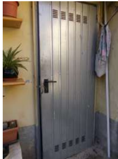
10. Bagno comune nel cortile (uso ripostiglio)