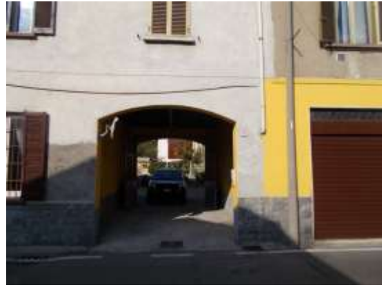
2. Ingresso alla corte comune (dalla strada)