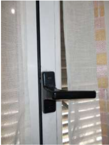
33. Serramento esterno