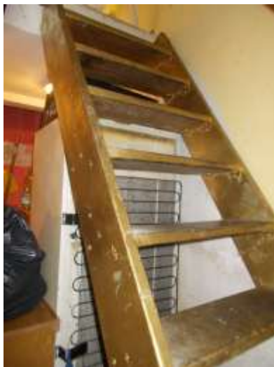
23. Scala di accesso al piano interrato