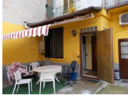
8. Ingresso all'immobile pignorato