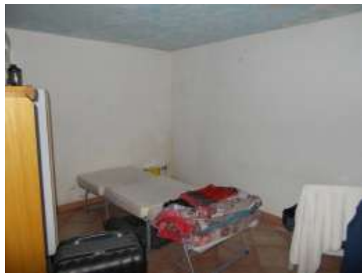
27. Locale al piano interrato