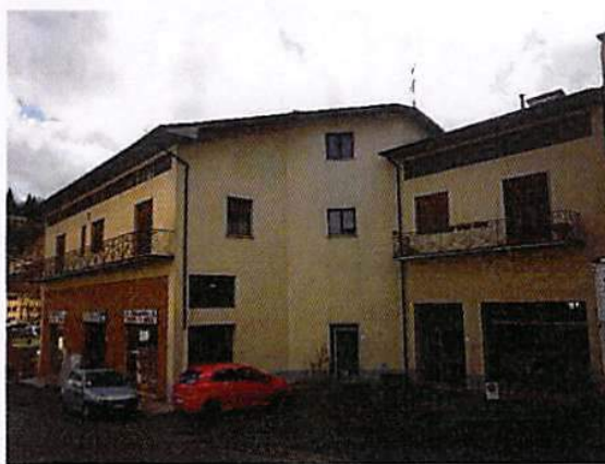
Mappale 4960 (ingresso appartamenti)