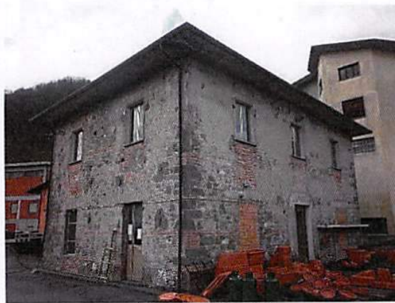
Mappale 4384 foto 2 di 4