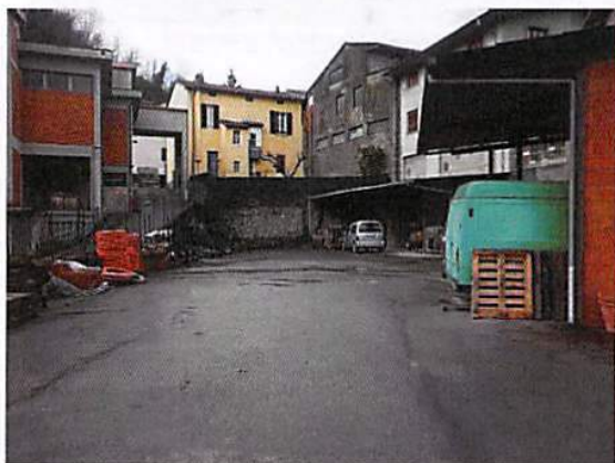
Piazzale esclusivo e tettoie in acciaio