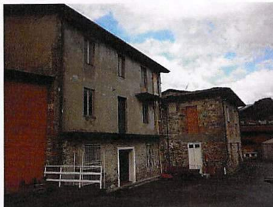
Mappale 4384 foto 4 di 4