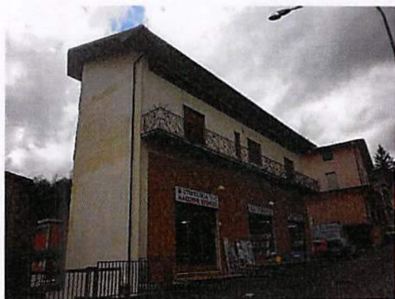
Mappale 4960 (accesso al negozio)