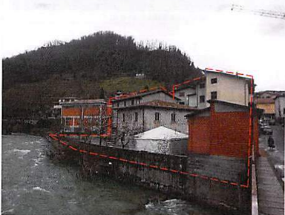
Veduta complessiva dei beni pignorati