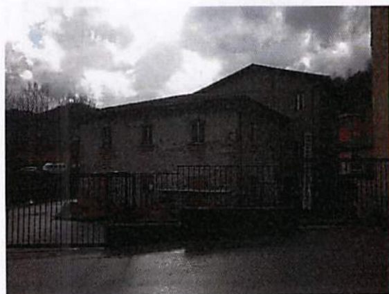
Mappale 4384 foto 1 di 4