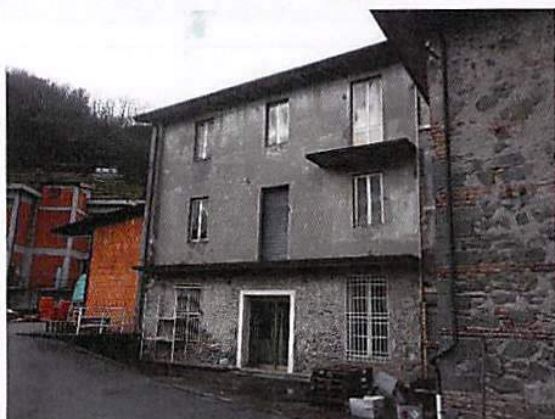
Mappale 4384 foto 3 di 4