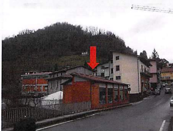
Immobile ad uso esposizione