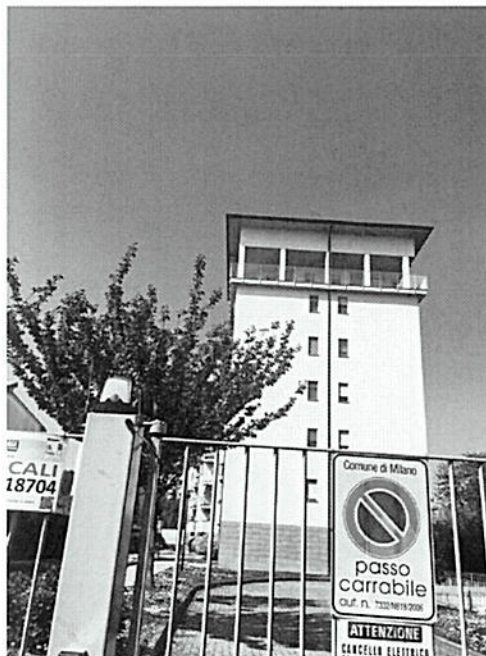
Facciate laterali – Via Dante Chiasserini n°30 - Milano