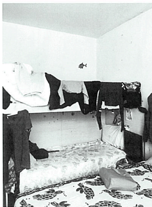
Camera da letto – Via Dante Chiasserini n°30 - Milano

Rge n°1274/2015: Tribunale Milano TRZ121CTU917 Procedimento: BANCA POPOLARE COMMERCIO contro Giudice : Dott.ssa Gabriella Mennuni