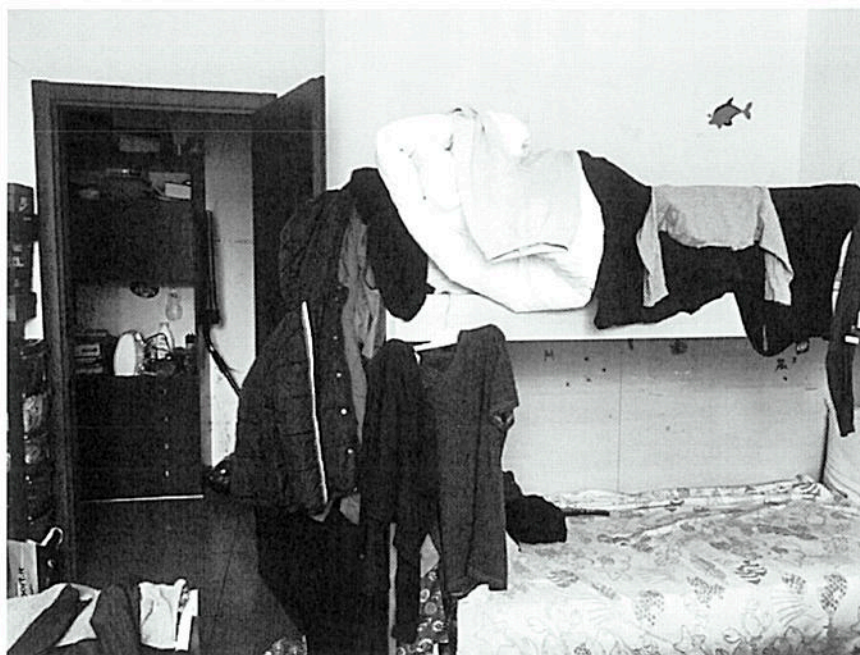
Camera da letto – Via Dante Chiasserini n°30 - Milano

STUDIO DI ARCHITETTURA ROSSANA TERZAGHI www.studioarkterzaghi.it