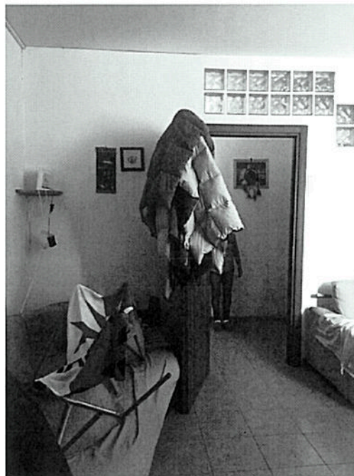
Cucina - Soggiorno – Via Dante Chiasserini n°30 - Milano