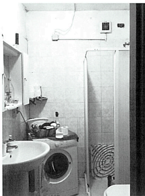
Bagno – Via Dante Chiasserini n°30 - Milano