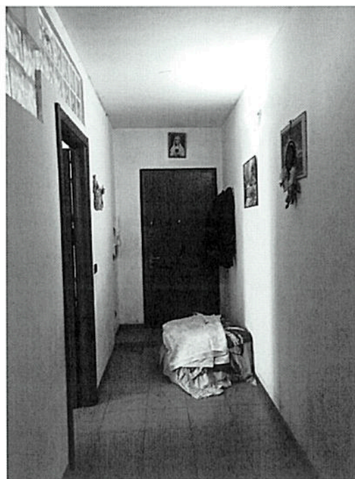
Disimpegno ingresso - Via Dante Chiasserini n°30 - Milano