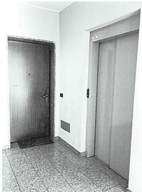
Scala – Porta blindata unità immobiliare - Ascensore – Via Dante Chiasserini n°30 - Milano