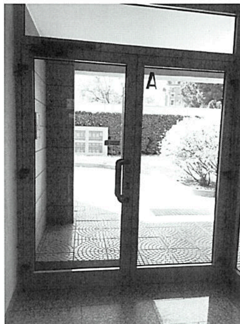
Facciate laterali e Ingresso – Via Dante Chiasserini n°30 - Milano