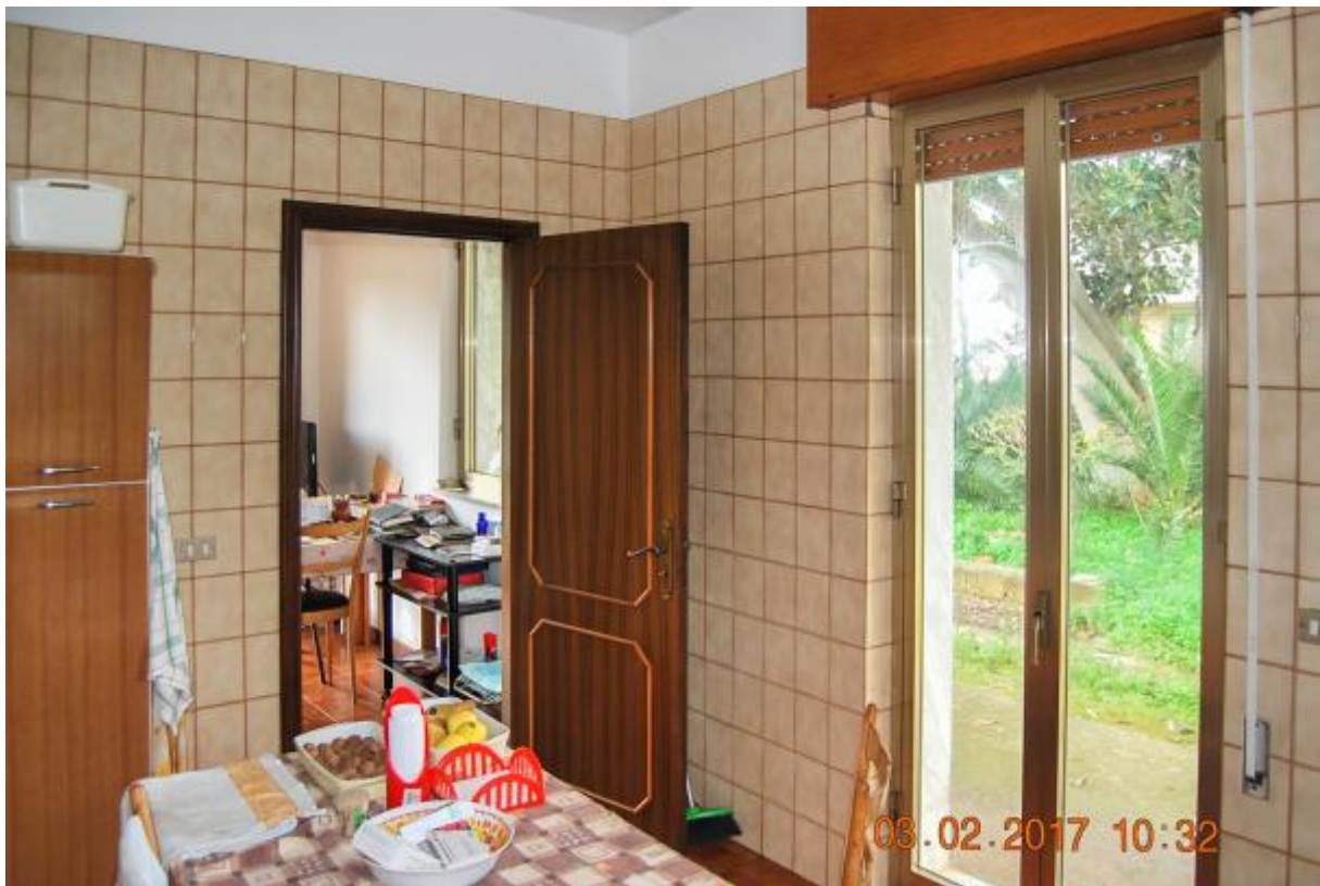
Foto 17 - Vista della cucina