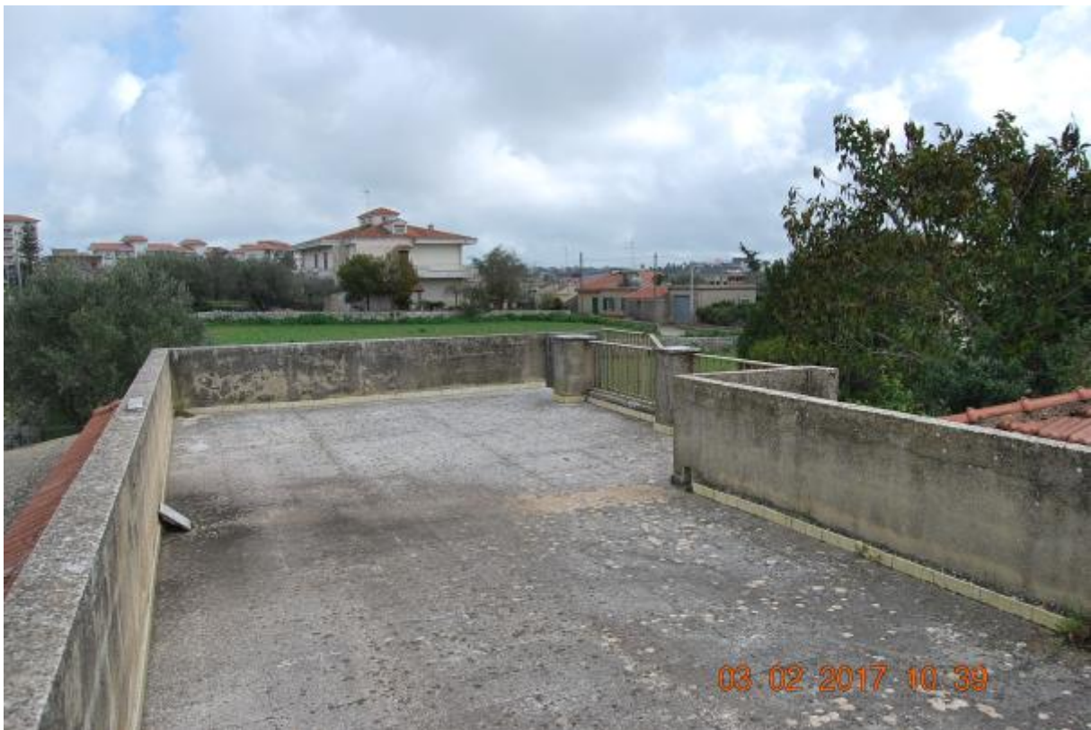
Foto 12 - Il terrazzo visto da altra angolazione