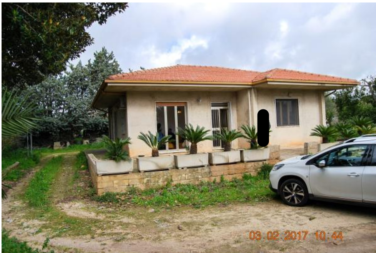
Foto 5 - La villetta vista da altra angolazione