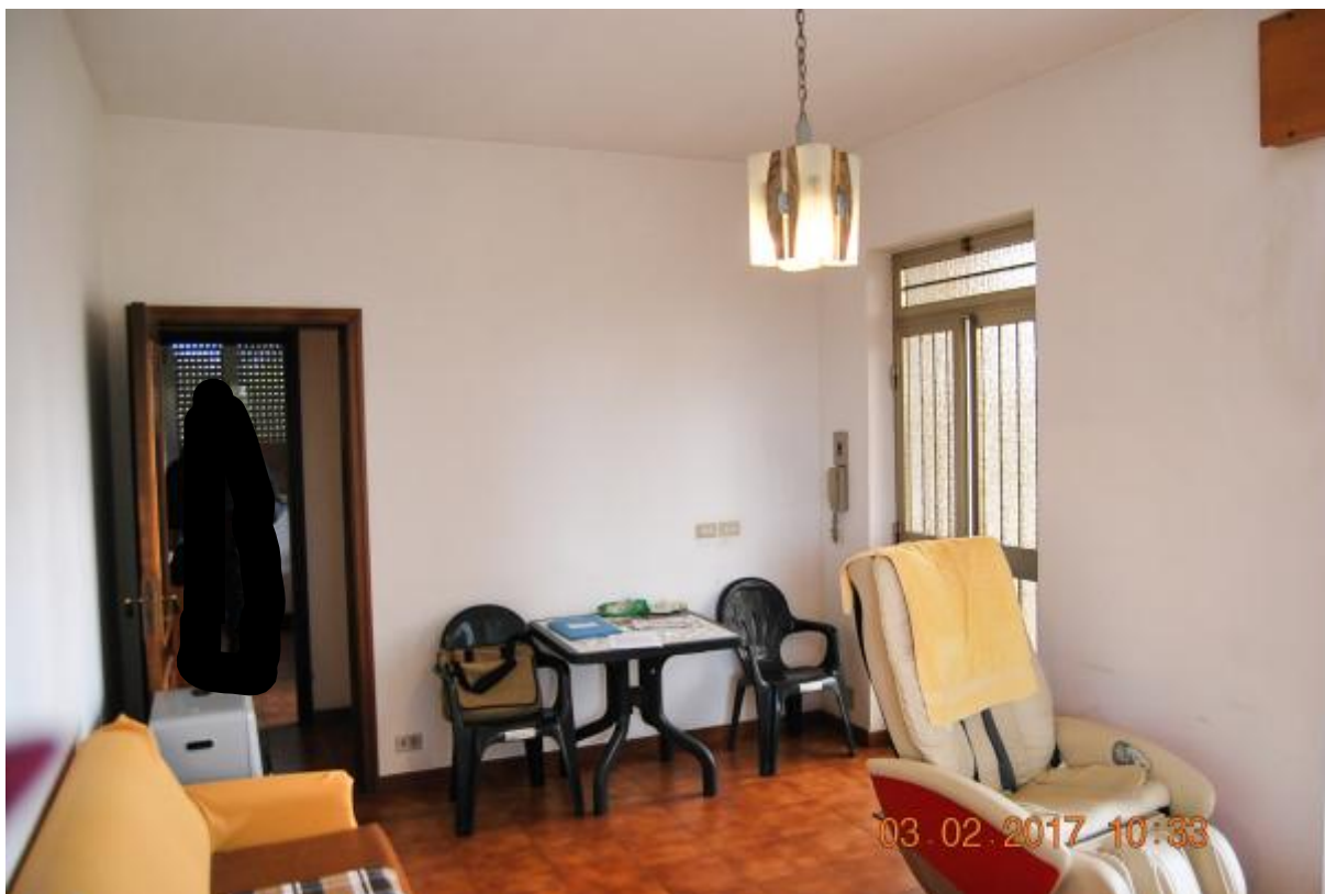
Foto 15 - L'ingresso-soggiorno