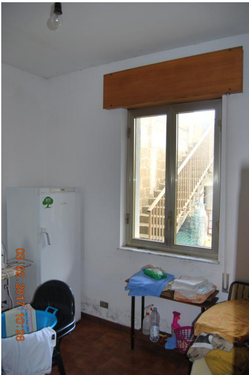
Foto 21 - Scorcio della cameretta