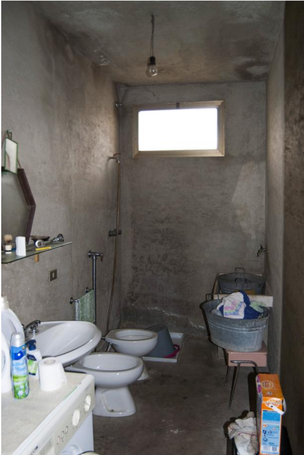
Foto 25 - Il w.c. a servizio del garage