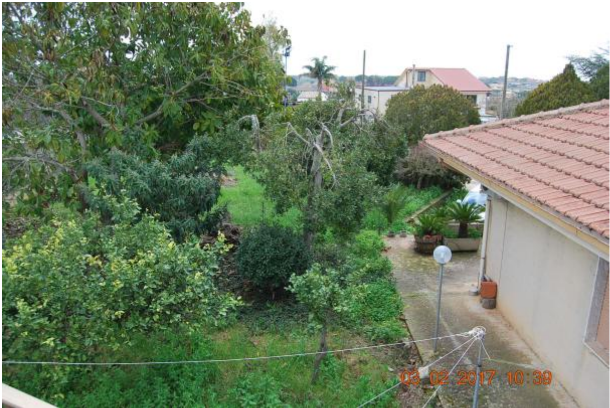
Foto 13 - Parte del giardino visto dal terrazzo