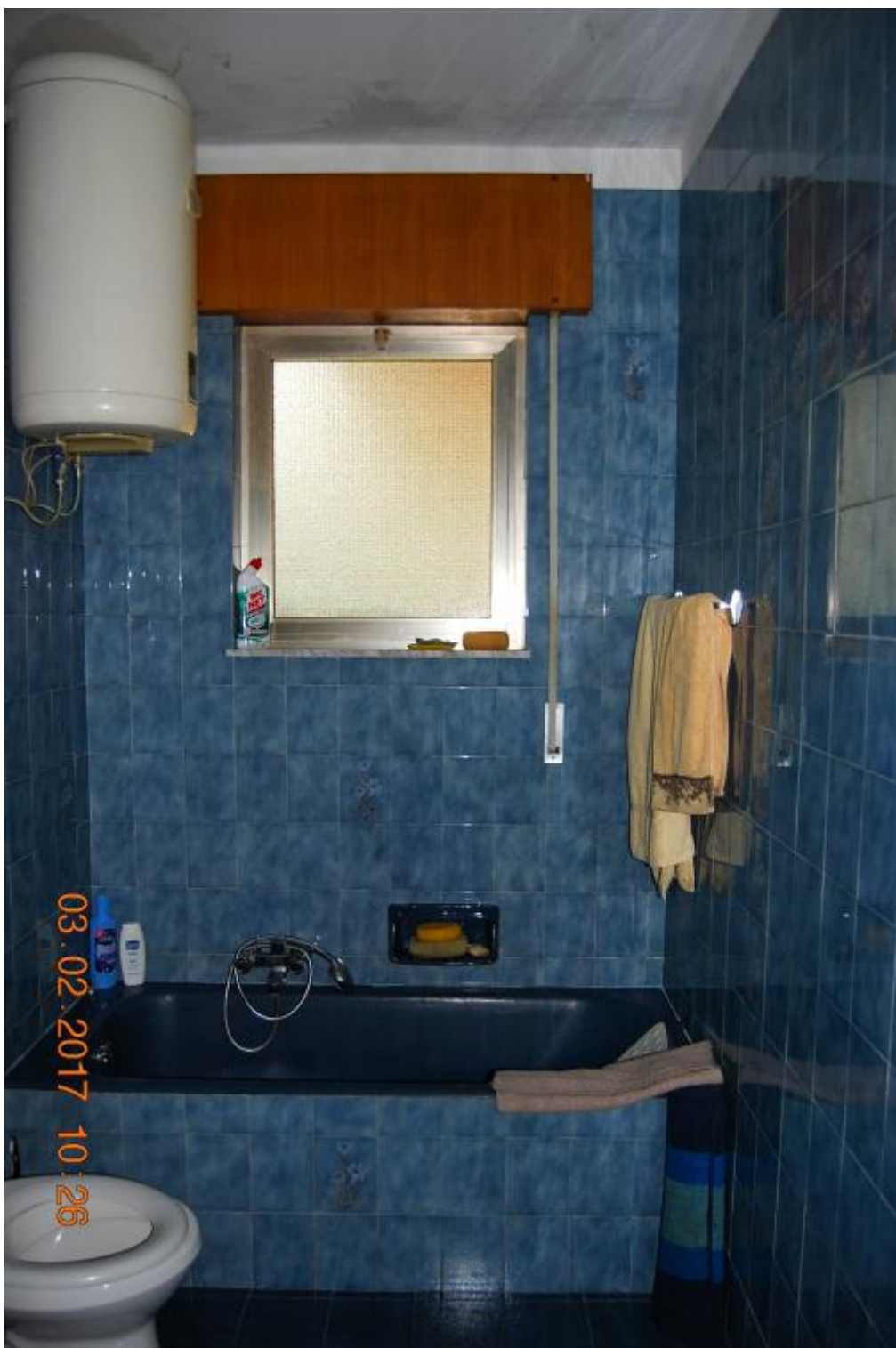
Foto 22 - Vista del bagno