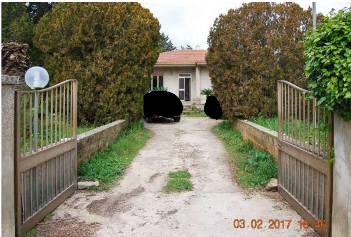
Foto 3 - Vista del vialetto principale che conduce alla villetta