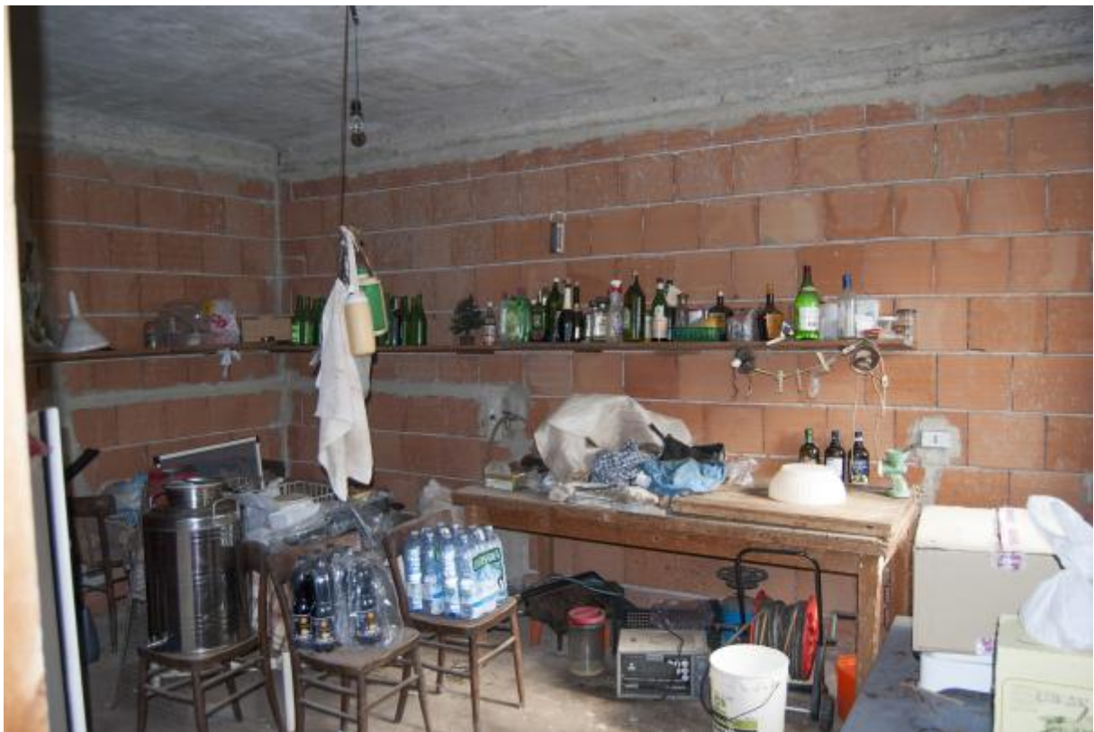
Foto 24- Il locale deposito