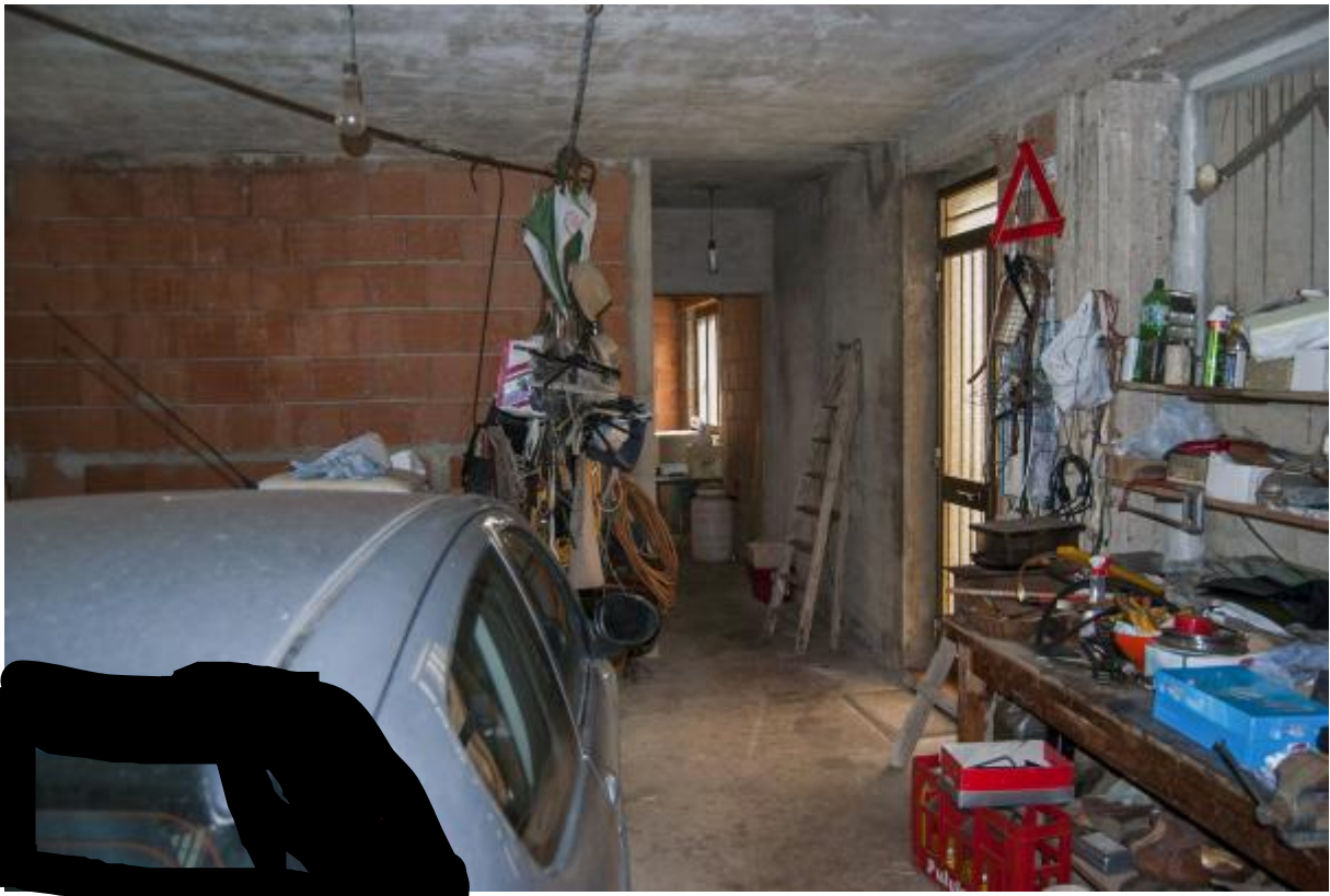
Foto 23 - Vista di parte del garagei