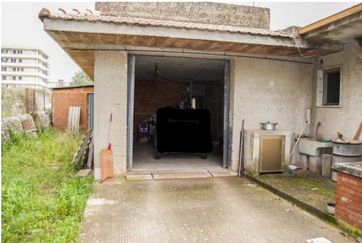
Foto 8 - Particolare dell'ingresso al garage