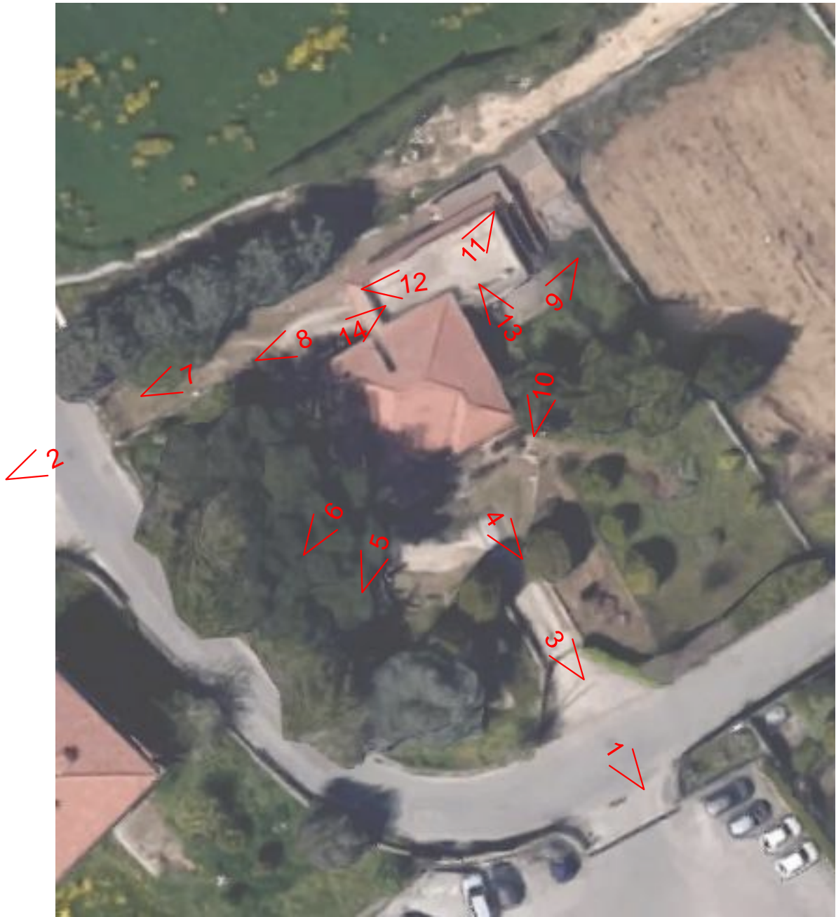
Planimetria con indicazione dei punti di vista fotografici esterni