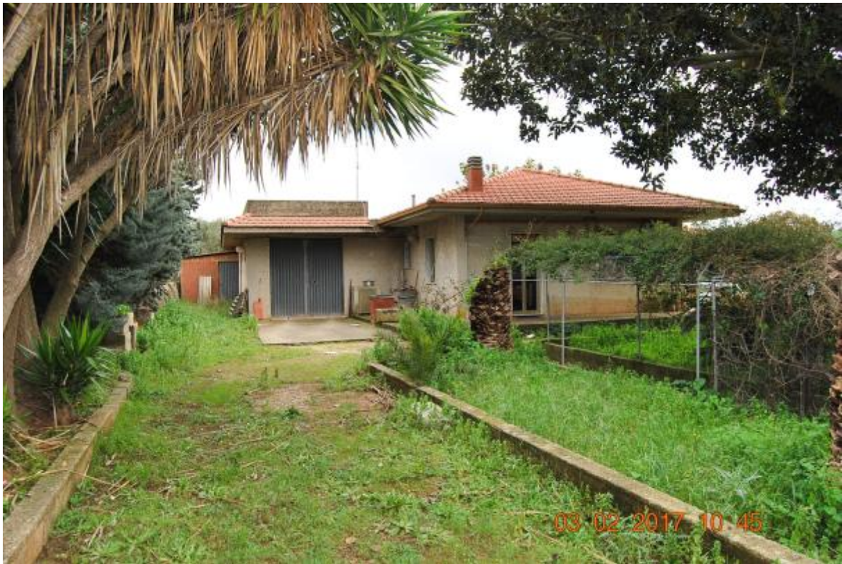
Foto 7 - La villetta vista dall'ingresso secondario