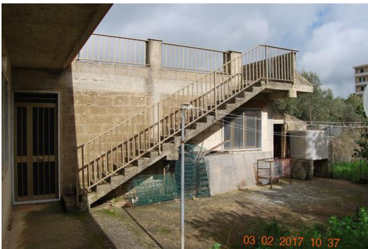
Foto 10 - Vista della scala di accesso al terrazzo e del locale accessori