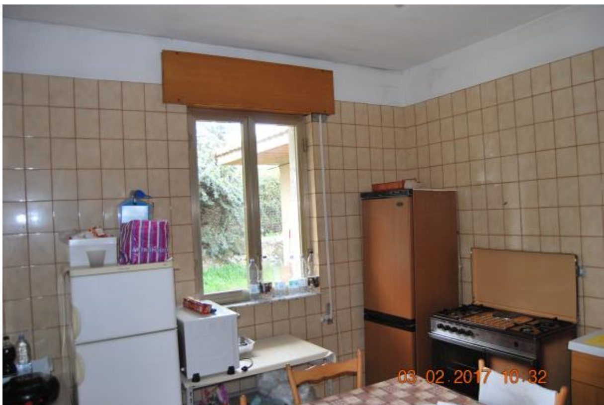
Foto 18 - La cucina