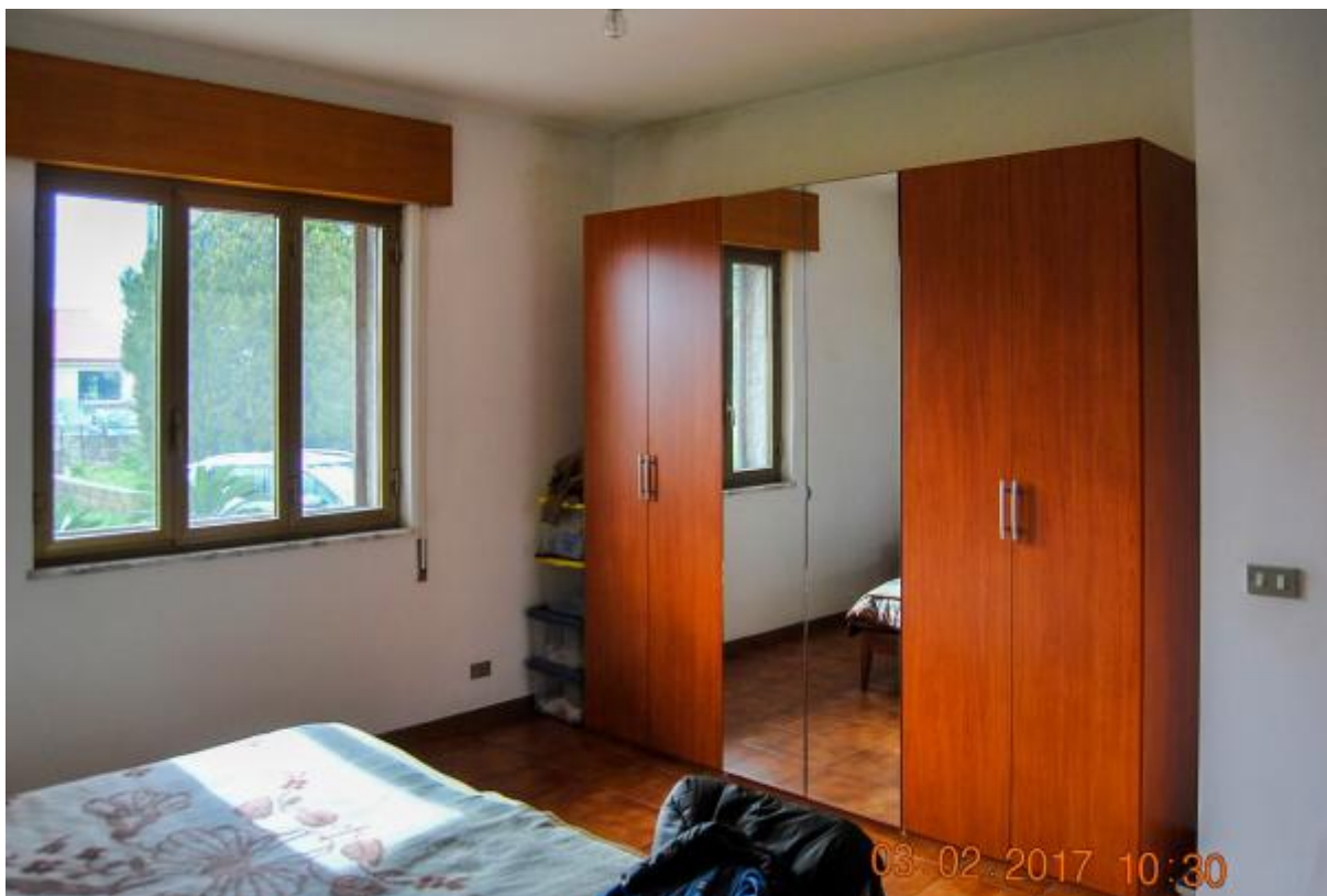
Foto 19 - Vista della camera da letto