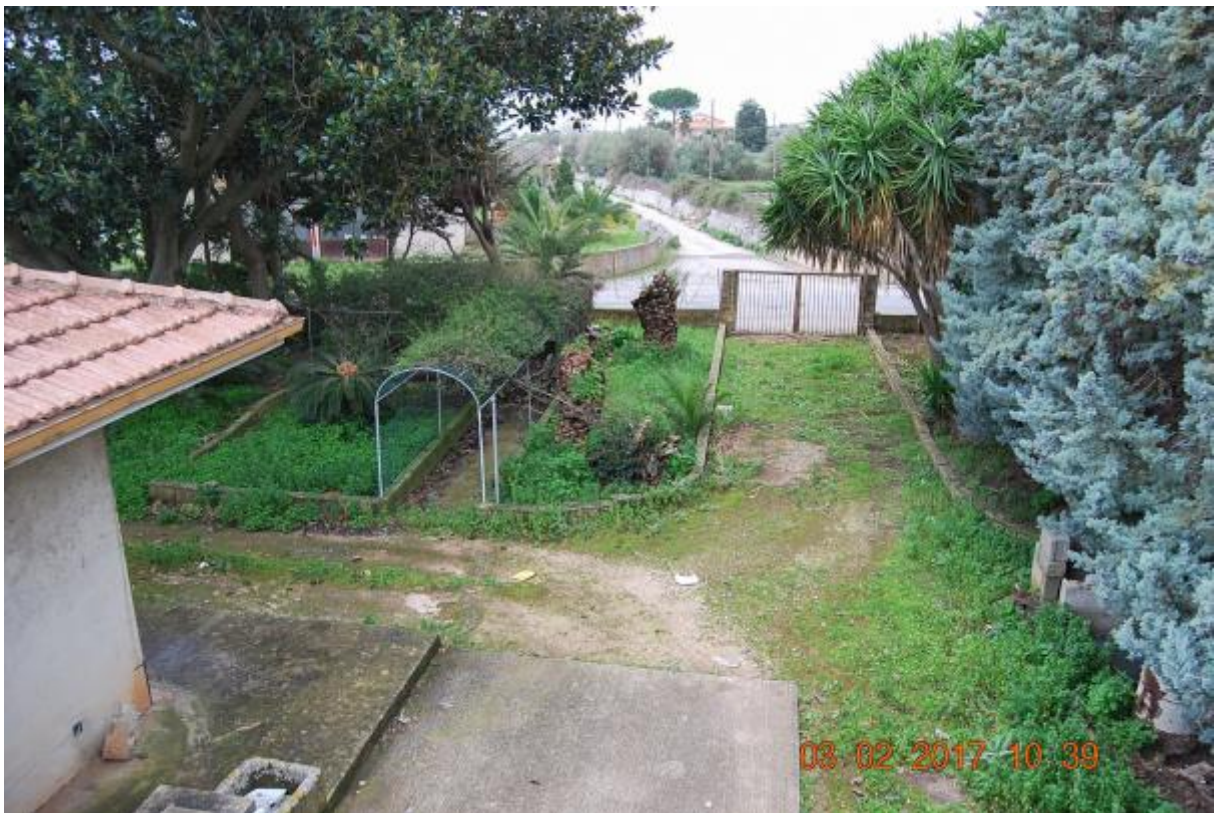
Foto 14 - Vista del giardino dal terrazzo