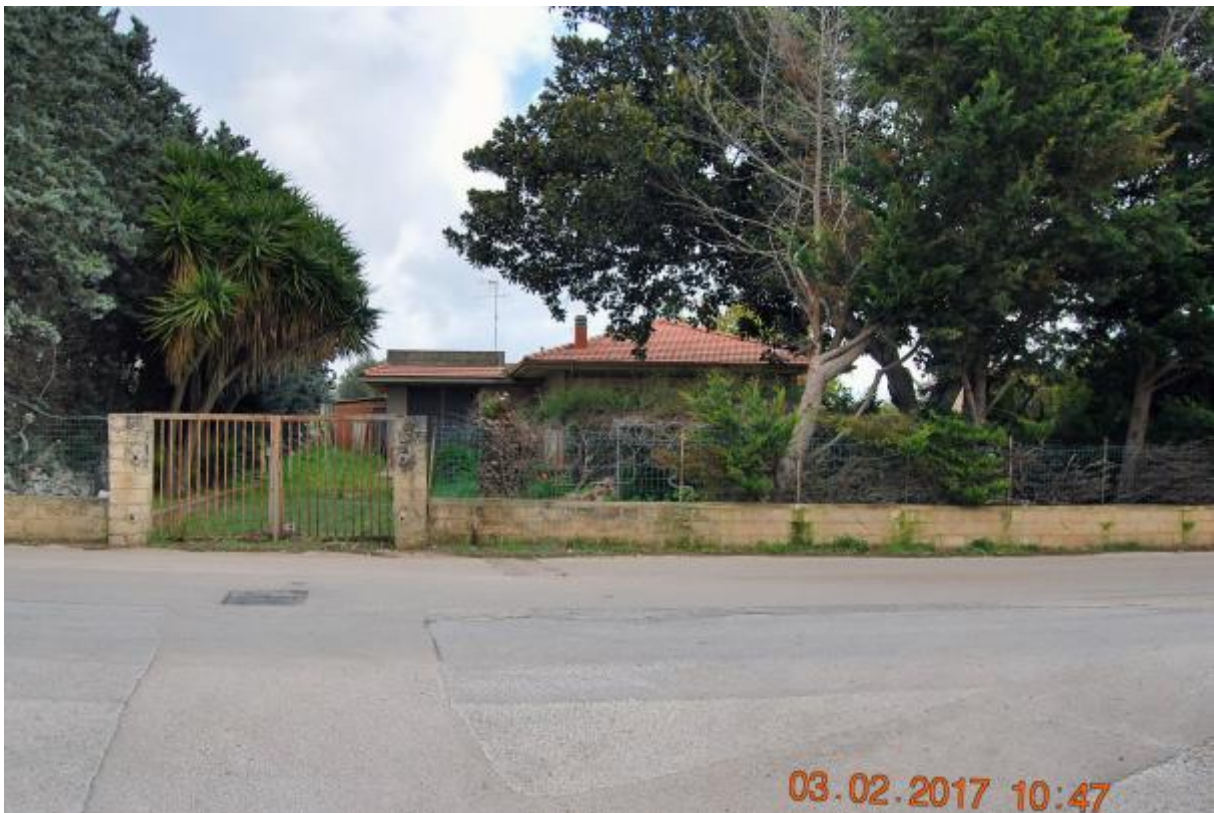
Foto 2 - L'ingresso secondario visto dalla via Cava Gucciardo Pirato