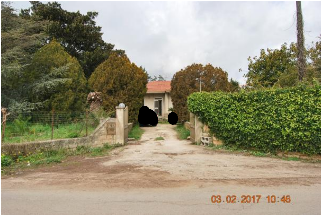
Foto 1 - L'ingresso principale visto dalla via Cava Gucciardo Pirato