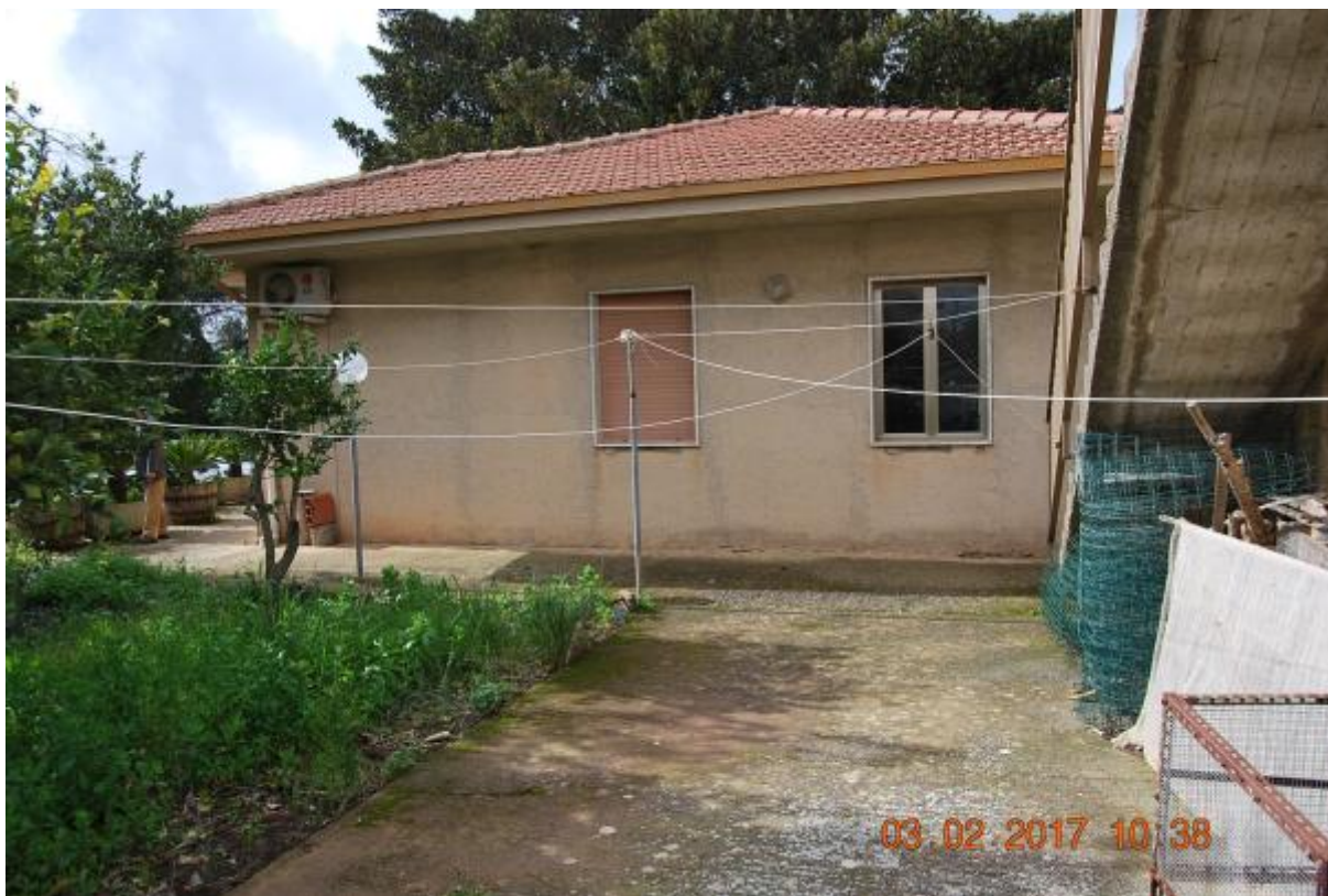
Foto 9 - La villetta vista da altra angolazione