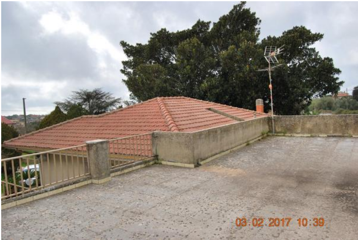
Foto 11 - Il terrazzo