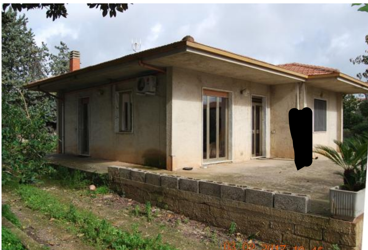
Foto 6 - La villetta vista lateralmente