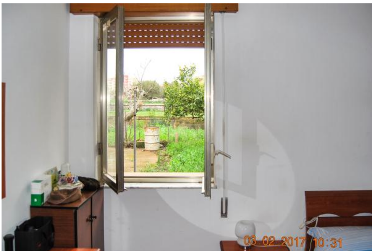
Foto 20 - Altra vista della camera da letto