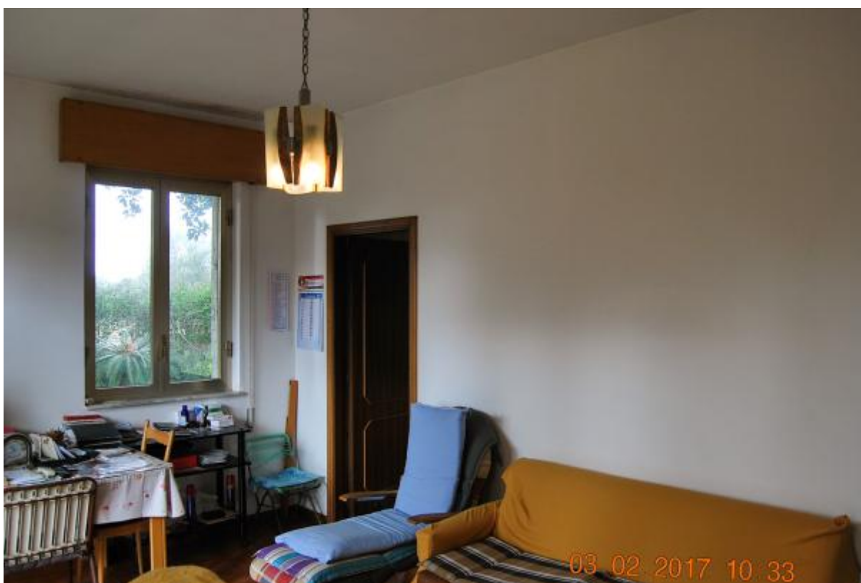
Foto 16 - L'ingresso-soggiorno visto da altra angolazione