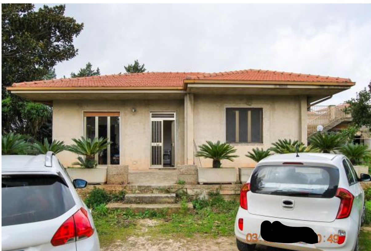
Foto 4 - La villetta vista in primo piano