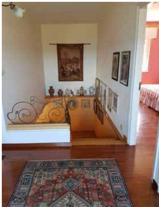
Foto 32. Pianoprimo, disimpegno.