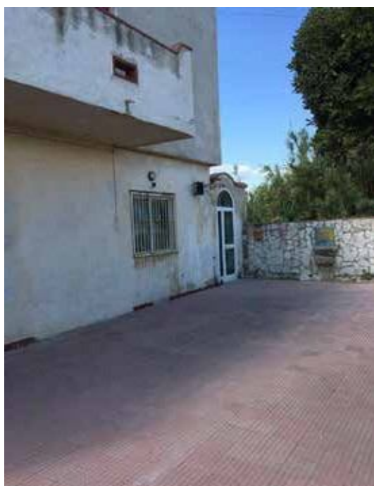
Foto 2. Spiazzale antistante l'immobile.