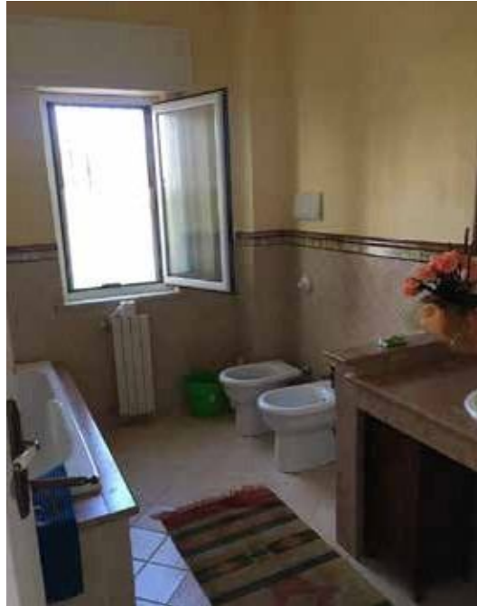
Foto 35. Pianoprimo, servizio igienico.

ALLEGATO 1: DOCUMENTAZIONE FOTOGRAFICA LOTTO UNICO