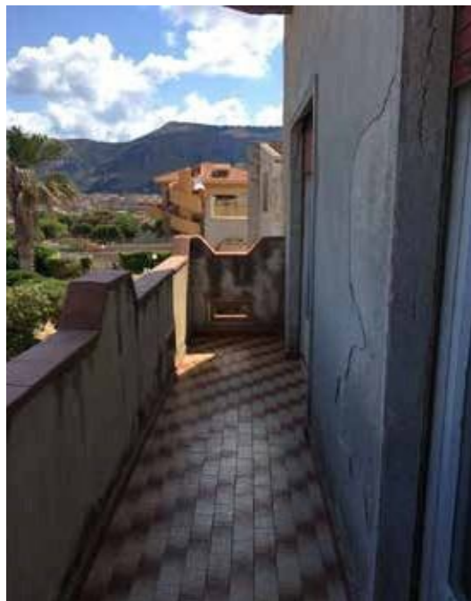
Foto 36. Pianoprimo, balcone.