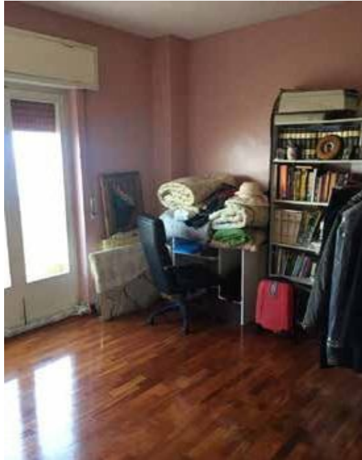
Foto 33. Pianoprimo, camera 2.