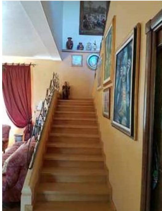
Foto 25. Vanoscaladiaccessoalpianoprimo.