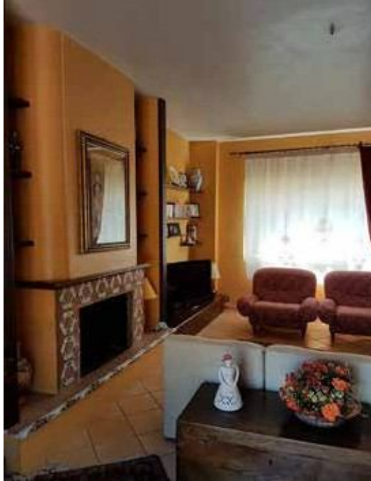
Foto 11. Pianoterra, soggiorno.

ALLEGATO 1: DOCUMENTAZIONE FOTOGRAFICA LOTTO UNICO