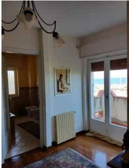
Foto 27. Pianoprimo, disimpegno.

ALLEGATO 1: DOCUMENTAZIONE FOTOGRAFICA LOTTO UNICO