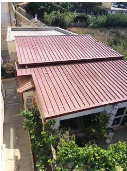
Foto 10. Dependancedicuisiprevedelademolizione.