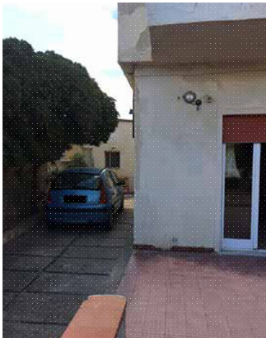
Foto 5. Spiazzale antistante l'immobile.

ALLEGATO 1: DOCUMENTAZIONE FOTOGRAFICA LOTTO UNICO