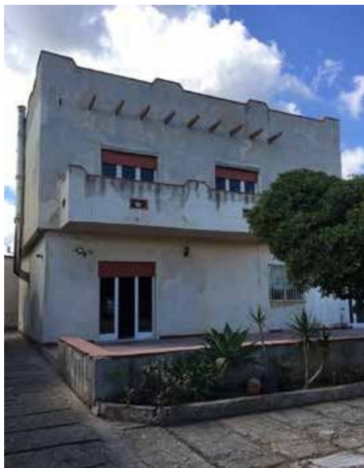
Foto 1. Prospettiva principale, accessibile da Corso Italia, n°65.

ALLEGATO 1: DOCUMENTAZIONE FOTOGRAFICA LOTTO UNICO