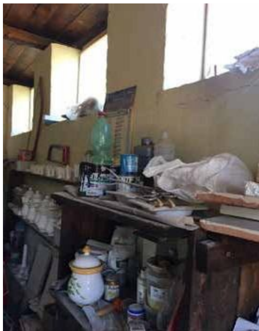
Foto 22. Pianoterra, laboratorio.