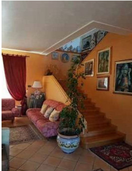
Foto 13. Pianoterra, soggiorno.