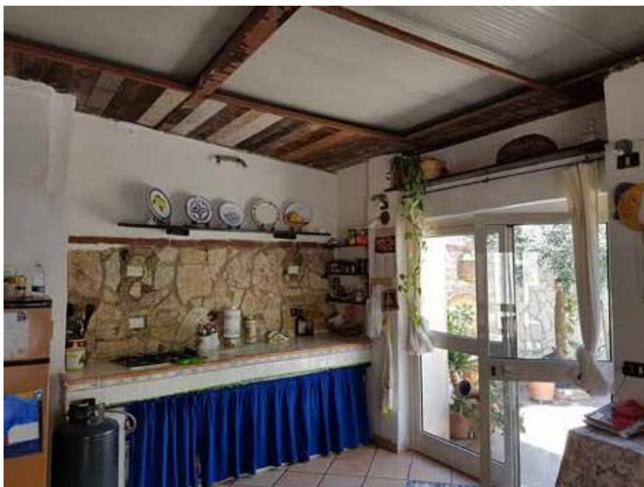
Foto 42. Dependancedicuisiprevedelademolizione.