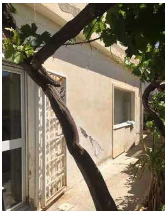
Foto 6. Retro-prospetto.