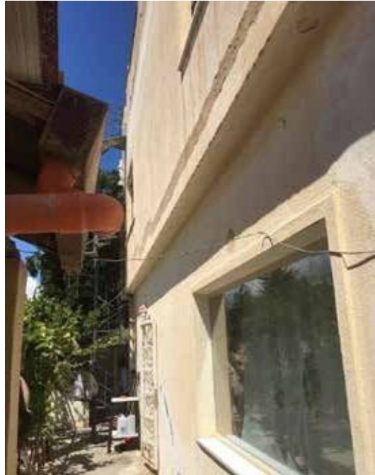
Foto 7. Retro-prospetto.

ALLEGATO 1: DOCUMENTAZIONE FOTOGRAFICA LOTTO UNICO