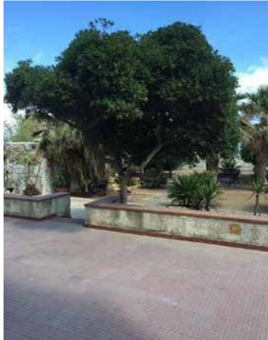
Foto 3. Spiazzale antistante l'immobile.

ALLEGATO 1: DOCUMENTAZIONE FOTOGRAFICA LOTTO UNICO