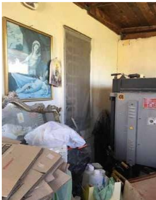
Foto 24. Pianoterra, laboratorio.