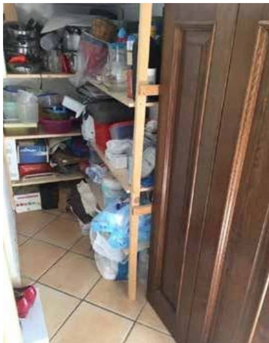
Foto 16. Pianoterra, dispensa.