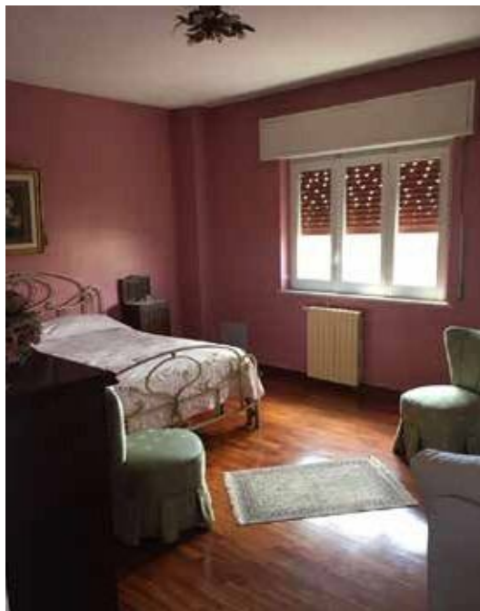
Foto 34. Pianoprimo, camera 1.