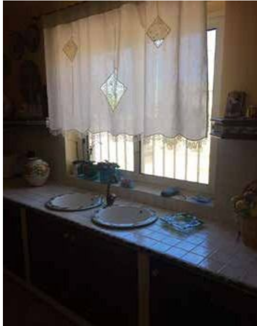
Foto 17. Pianoterra, servizio igienico.