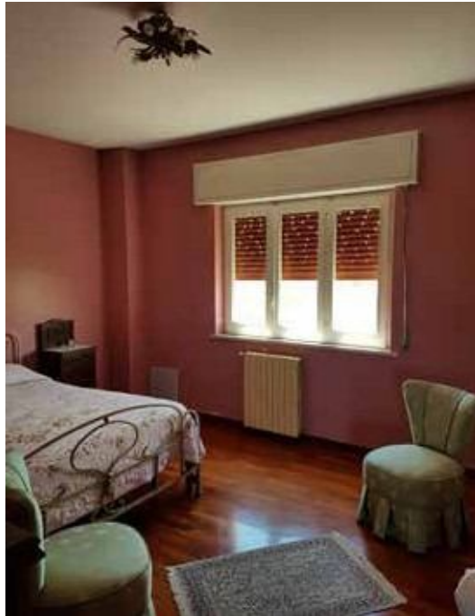
Foto 31. Pianoprimo, camera 1.

ALLEGATO 1: DOCUMENTAZIONE FOTOGRAFICA LOTTO UNICO