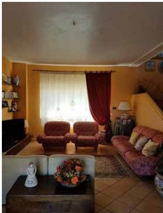
Foto 12. Pianoterra, soggiorno.