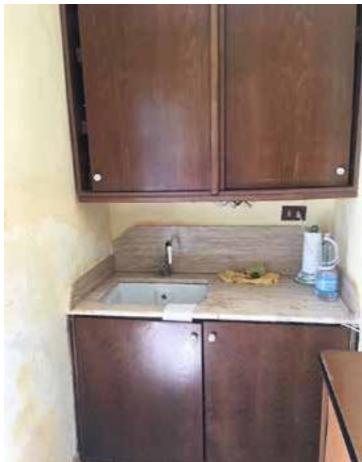
Foto 20. Pianoterra, zona cottura.