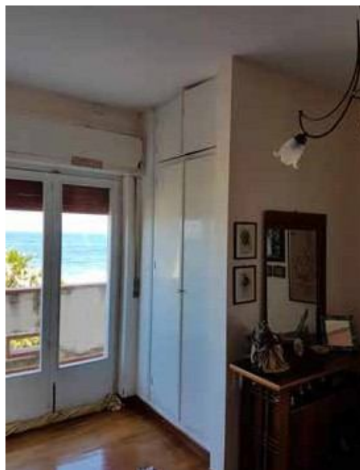
Foto 26. Pianoprimo, disimpegno.