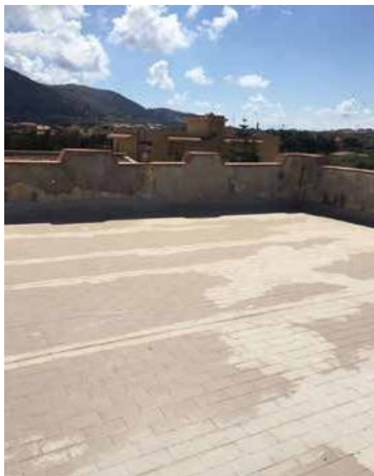
Foto 38. Lastrico solare.