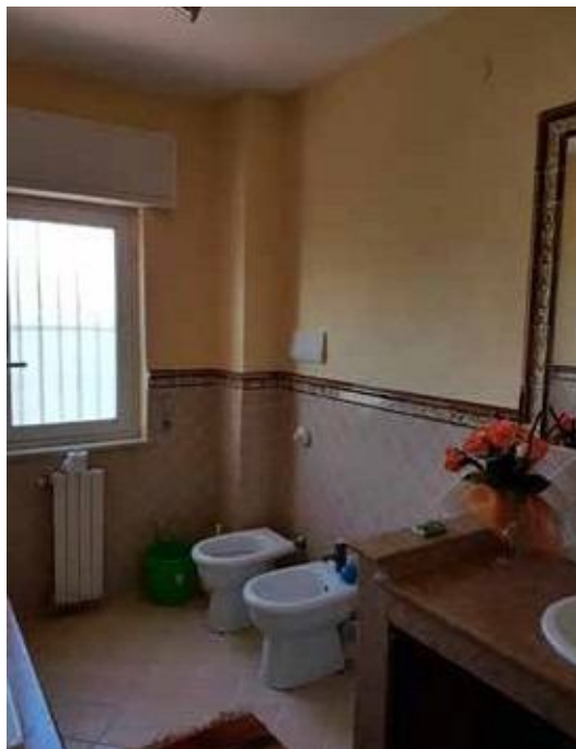
Foto 28. Pianoprimo, servizio igienico.