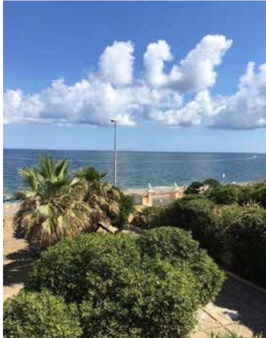
Foto 37. Piano primo, vista dal piano primo.