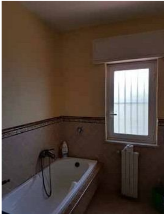
Foto 29. Pianoprimo, servizio igienico.