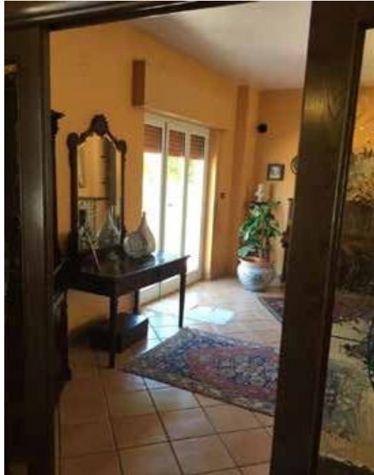
Foto 15. Pianoterra, soggiorno.

ALLEGATO 1: DOCUMENTAZIONE FOTOGRAFICA LOTTO UNICO