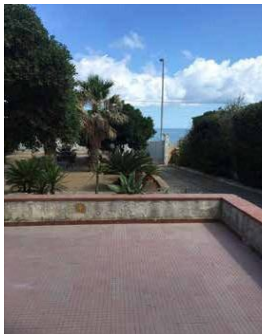
Foto 4. Spiazzale antistante l'immobile.