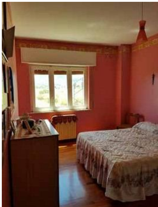
Foto 30. Pianoprimo, camera 3.