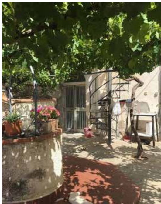
Foto 8. Retro-prospetto.