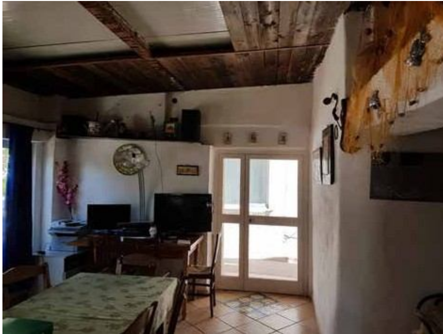
Foto 41. Dependancedicuisiprevedelademolizione.