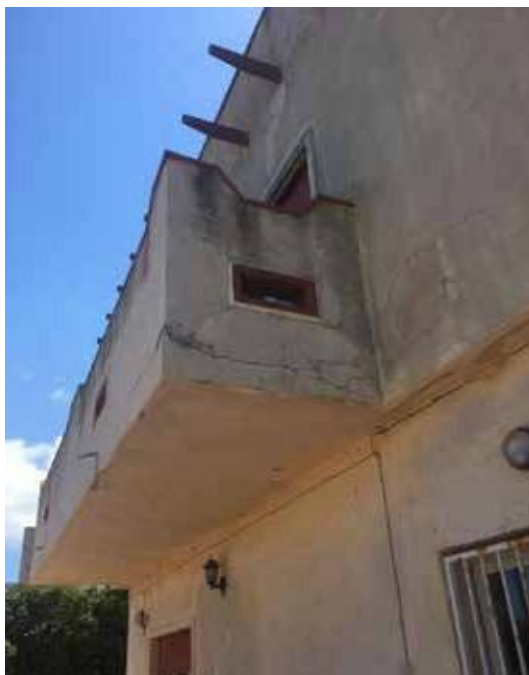
Foto 9. Prospetto principale.

ALLEGATO 1: DOCUMENTAZIONE FOTOGRAFICA LOTTO UNICO