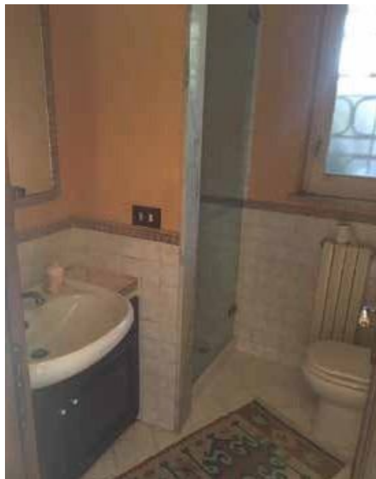
Foto 18. Pianoterra, servizio igienico.