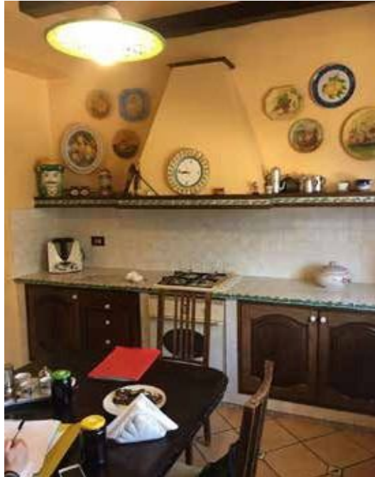
Foto 19. Pianoterra, cucina.