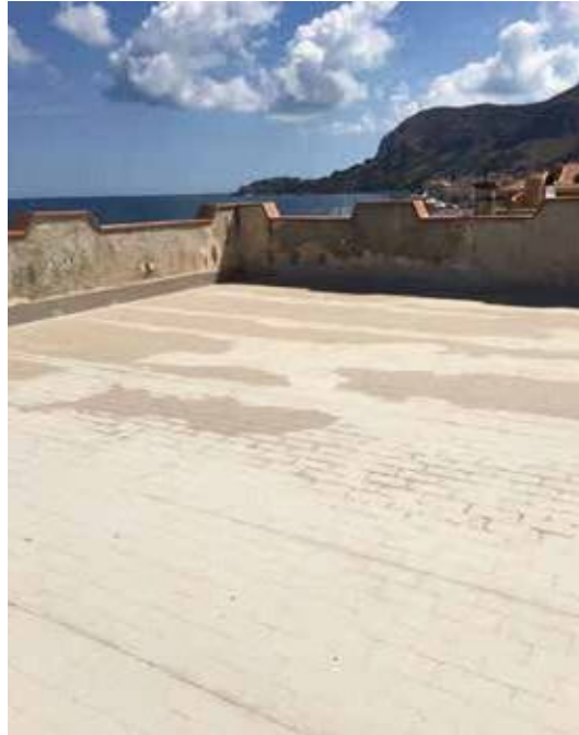
Foto 39. Lastrico solare.

ALLEGATO 1: DOCUMENTAZIONE FOTOGRAFICA LOTTO UNICO