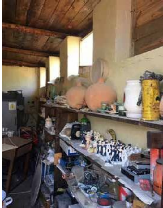
Foto 23. Pianoterra, laboratorio.

ALLEGATO 1: DOCUMENTAZIONE FOTOGRAFICA LOTTO UNICO