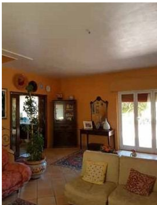
Foto 14. Pianoterra, soggiorno.