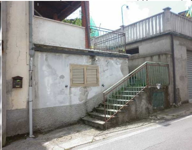
Scala di accesso al piano terra dell'immobile (appartamento)