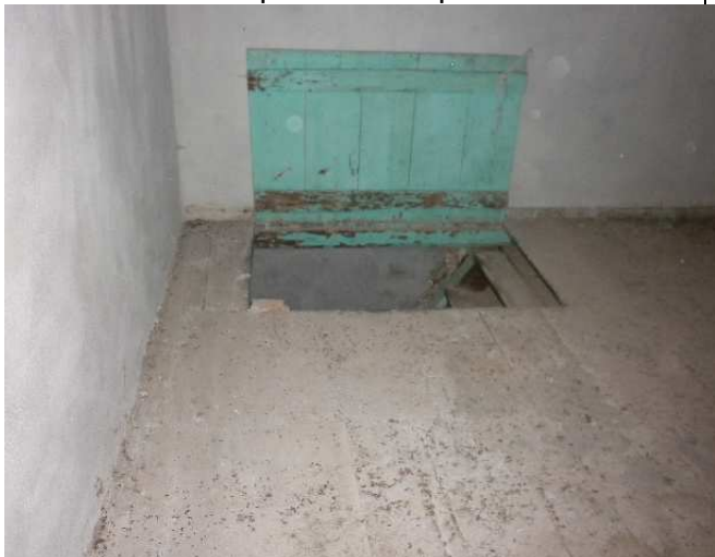
Botola in corrispondenza accesso piano secondo