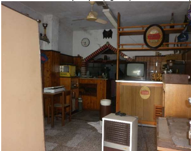
Vano principale (ingresso)