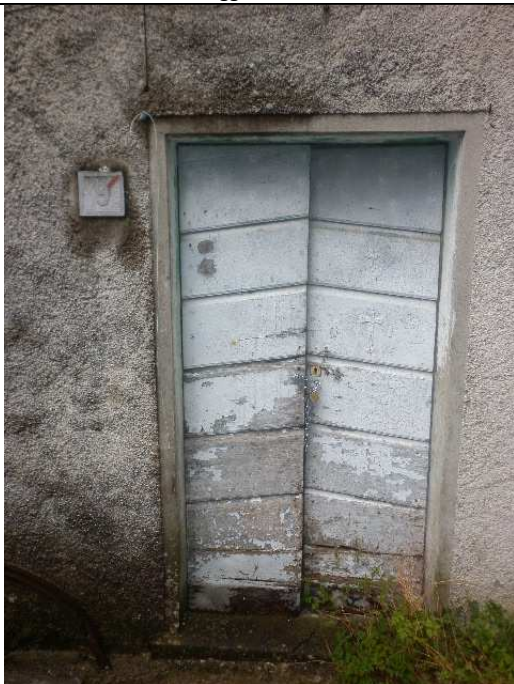
Porta di accesso all'abitazione