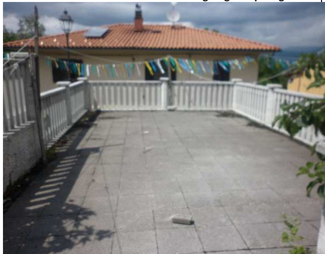
Particolare 1 – Terrazza sovrastante garage e ripostigli