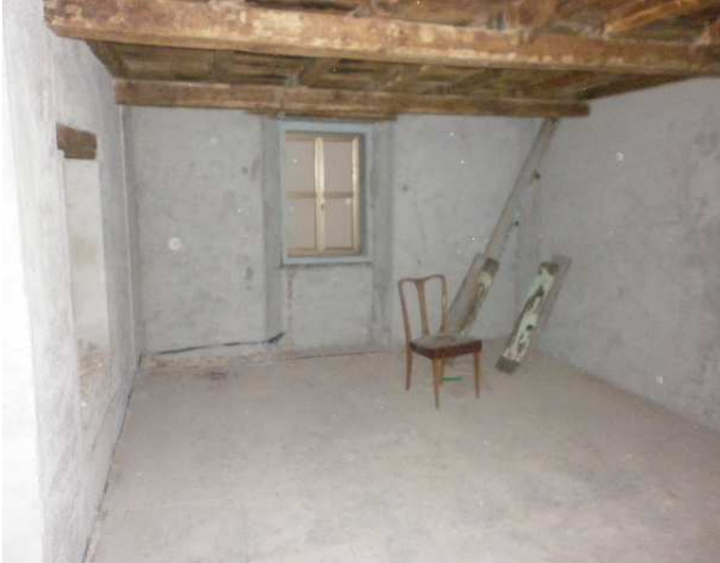
Vano a piano primo