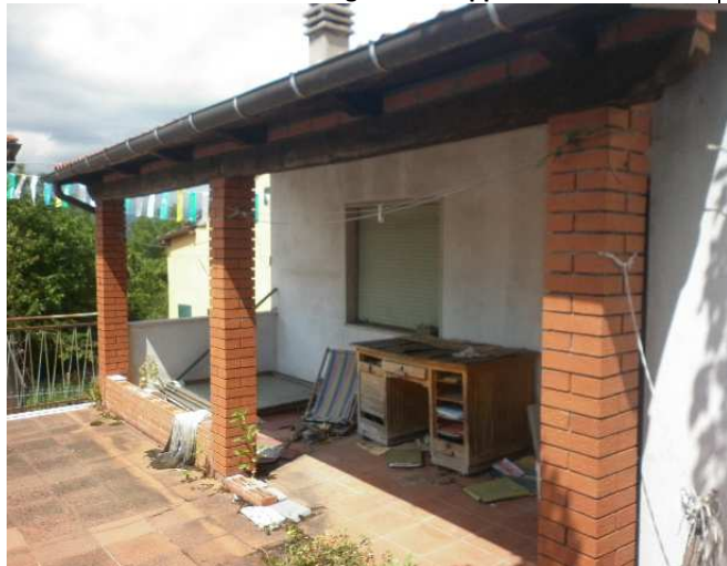
Porticato anistante l'ingresso all'appartamento