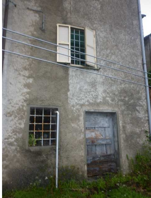
Accesso alla cantina/legnaia