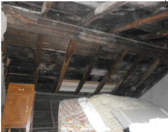
Particolare 2 del sottotetto