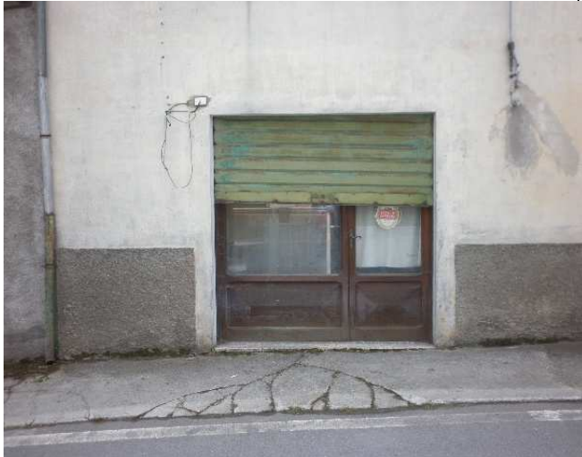
Particolare porta di accesso all'unità immobiliare