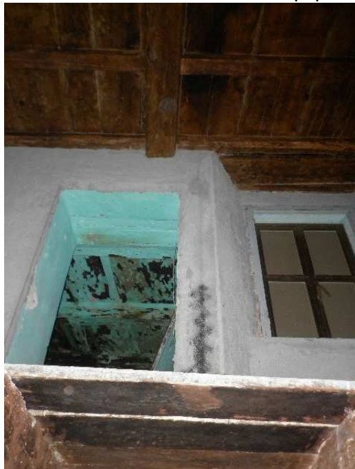
Particolare vano che consente accesso ad altra proprietà