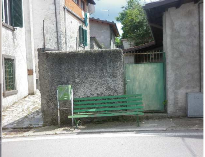
Particolare accesso alla resede esclusiva