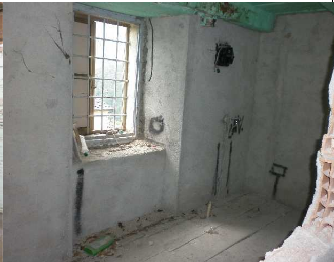
Particolare 2 – Vano Piano Terra