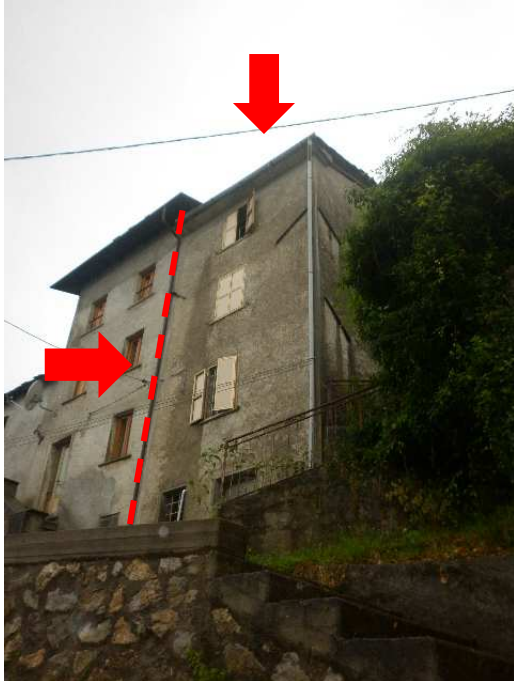
Immobile oggetto di esecuzione