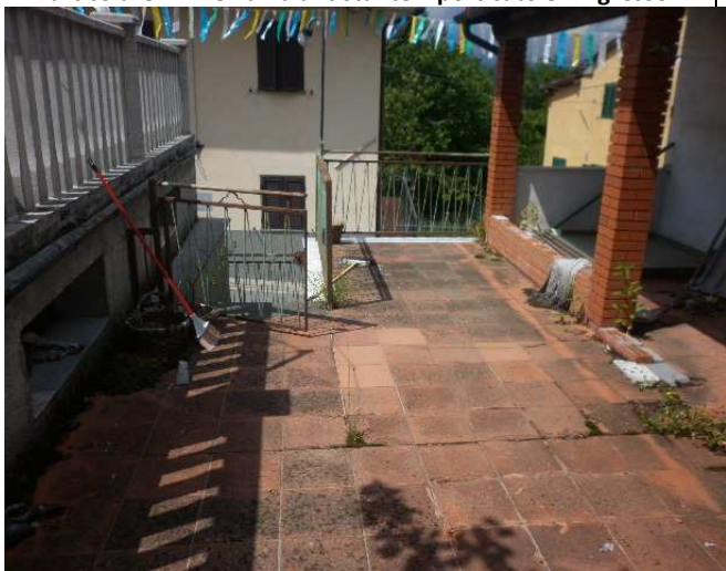
Particolare 1 – Terrazza antistante il porticato e l'ingresso