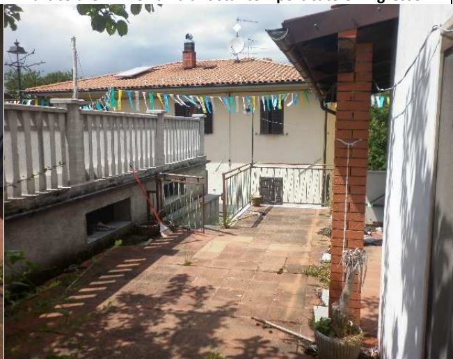
Particolare 2 – Terrazza antistante il porticato e l'ingresso