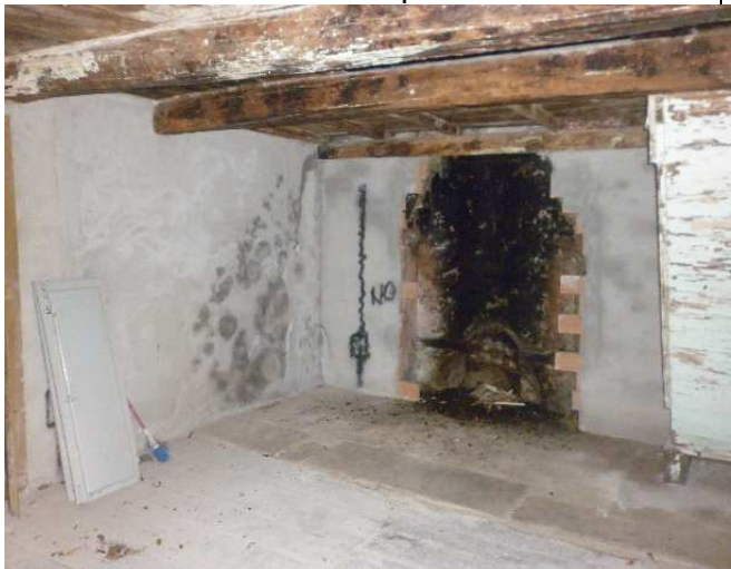
Particolare 1 – Vano piano terra