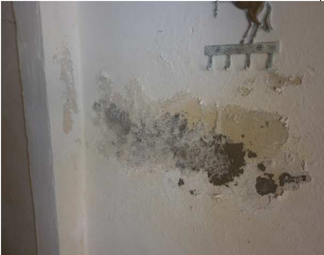
Particolare 1 – Umidità nell'ingresso