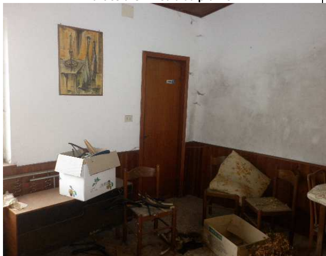
Particolare 1 – Sala da pranzo