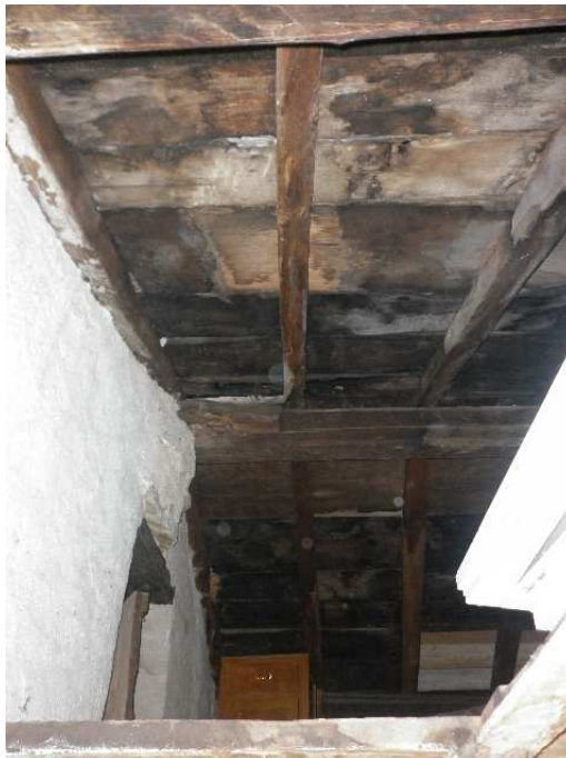
Particolare 1 del sottotetto