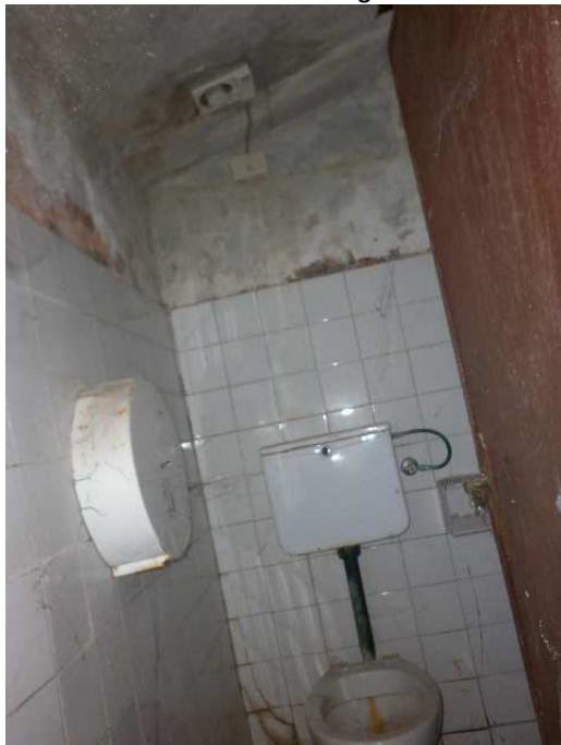
Particolare 1 – Bagno