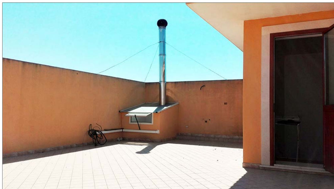
Immagine 9: Bene N° 2 - lastrico solare a piano terzo