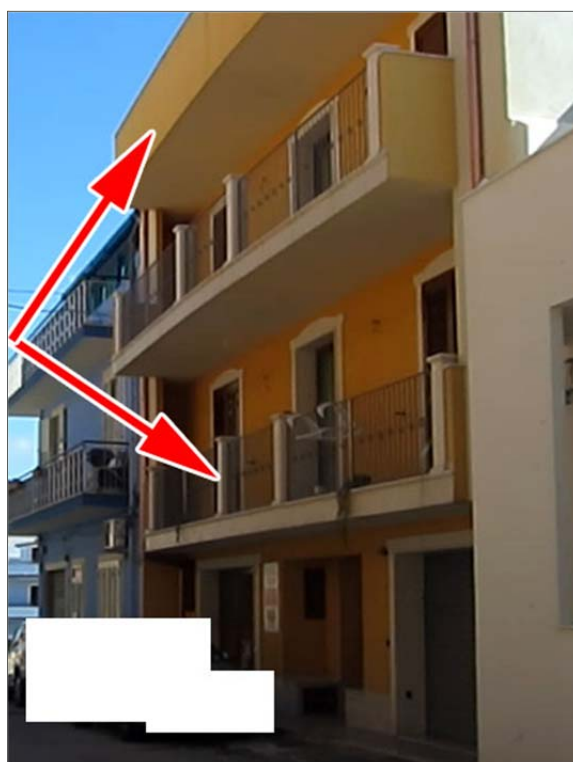
Immagine 2: Bene n° 1 Appartamento piano primo e bene n° 2 lastrico solare piano terzo