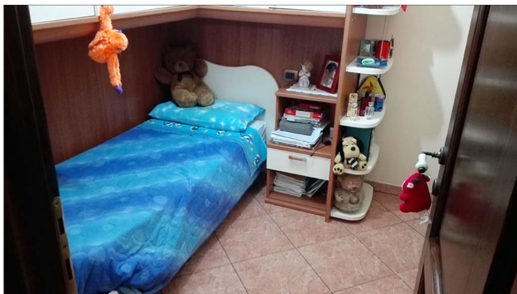
Immagine 6: Bene n° 1 Appartamento piano primo