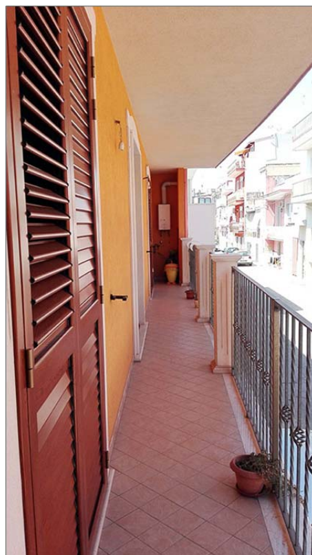
Immagine 8: Bene n° 1 Appartamento piano primo