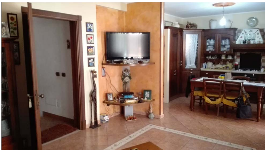
Immagine 3: Bene n° 1 Appartamento piano primo