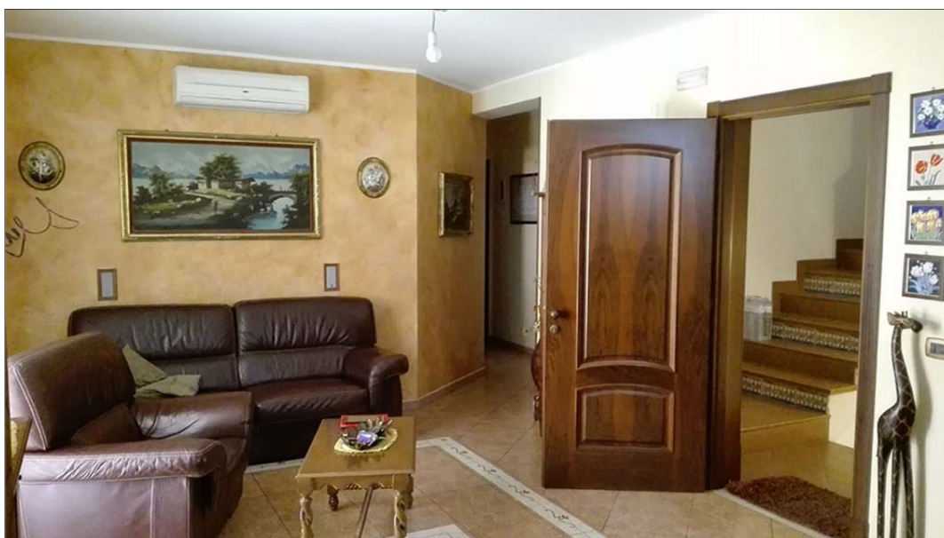
Immagine 4: Bene n° 1 Appartamento piano primo