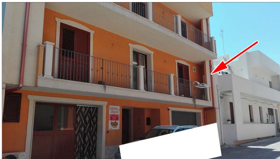
Immagine 1: Bene n° 1 Appartamento piano primo