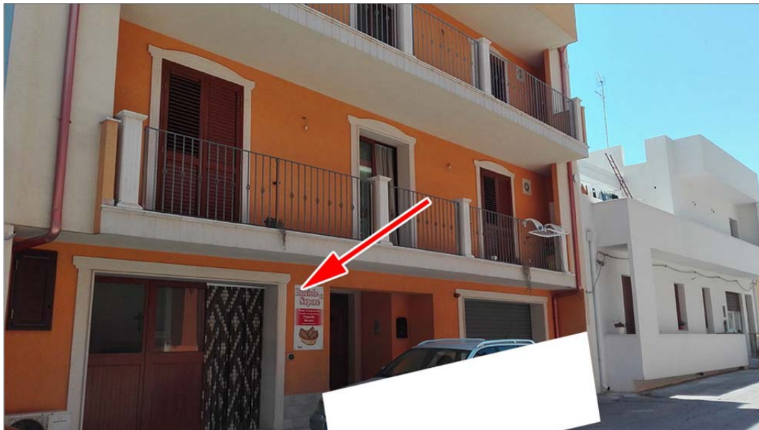
Immagine 1: Bene n° 3 locale commerciale piano terra