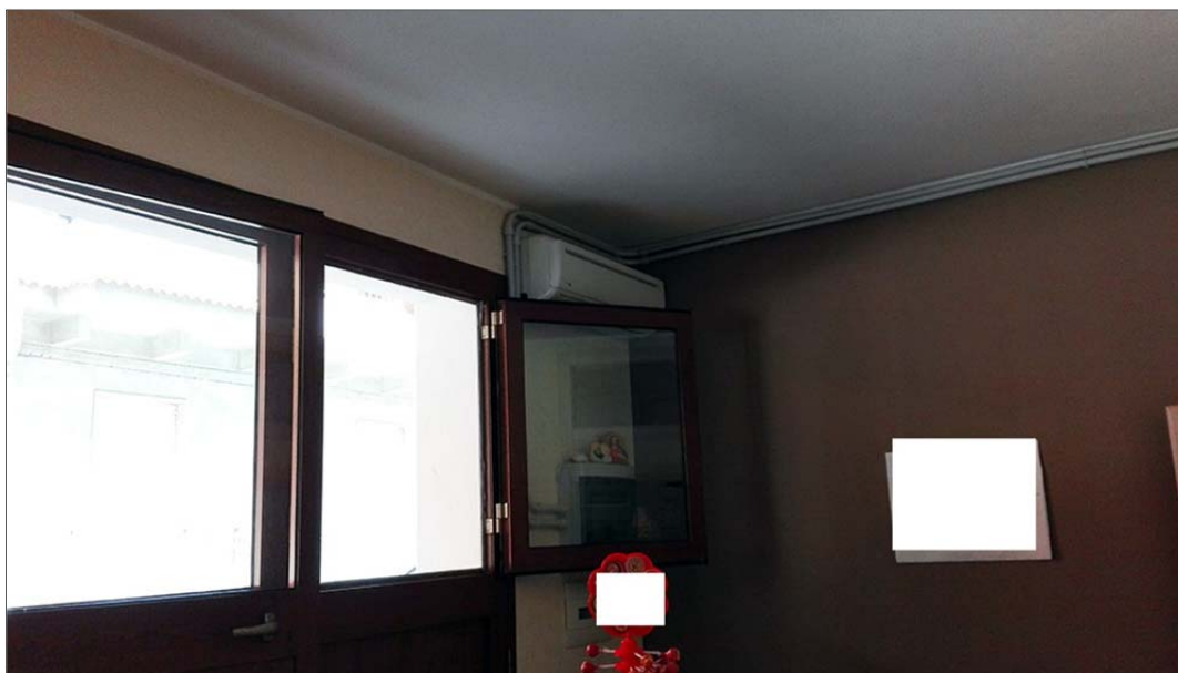
Immagine 5: Bene N° 3 - locale commerciale a piano terra