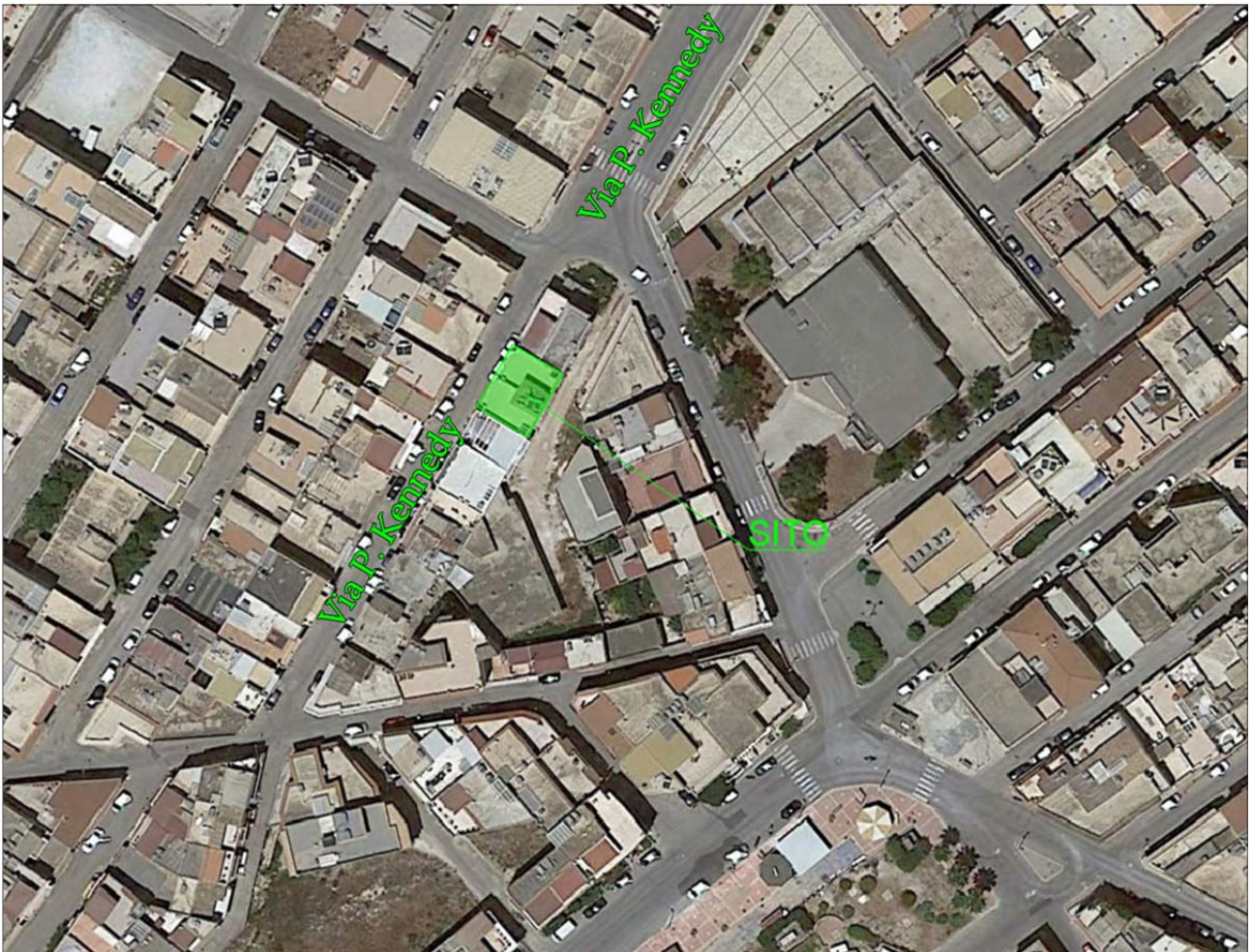
Foto aerea della zona