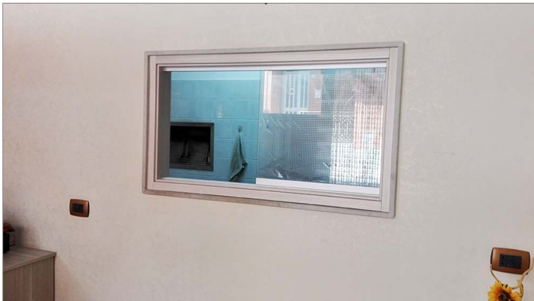
Immagine 4: Bene N° 3 - locale commerciale a piano terra