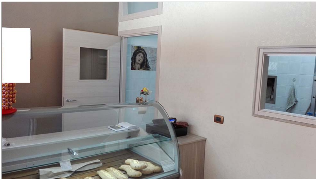
Immagine 3: Bene N° 3 - locale commerciale a piano terra