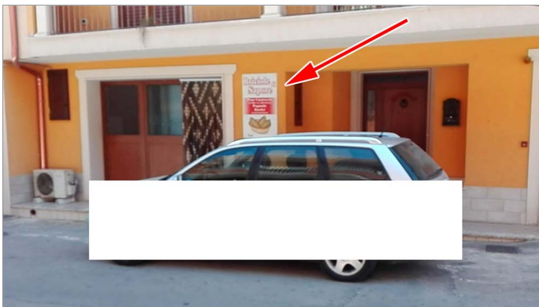
Immagine 2: Bene n° 3 locale commerciale piano terra