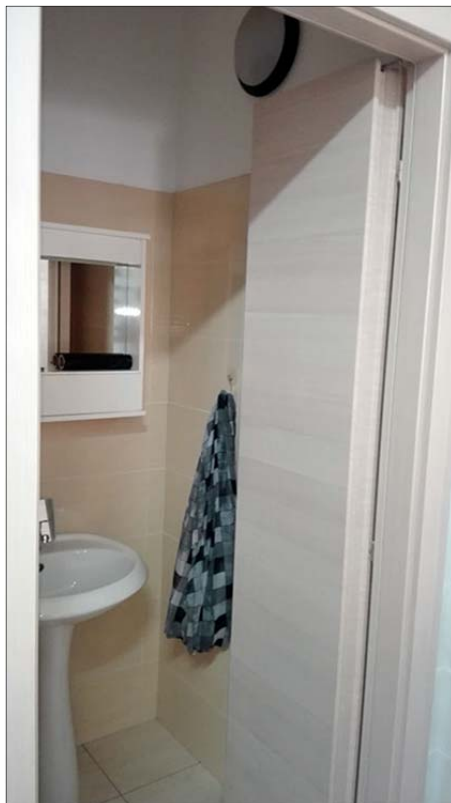
Immagine 3: Bene N° 3 - locale commerciale a piano terra