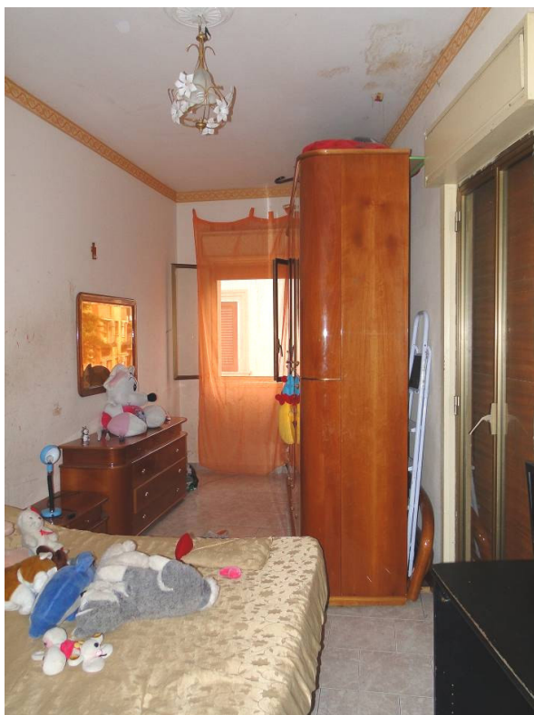
Camera da letto.