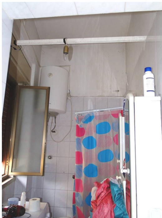
Locale wc doccia.