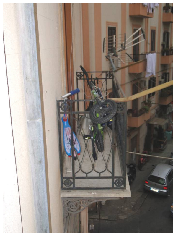
Balcone n.2 su via Imperatrice Costanza, con accesso dalla camera da letto.