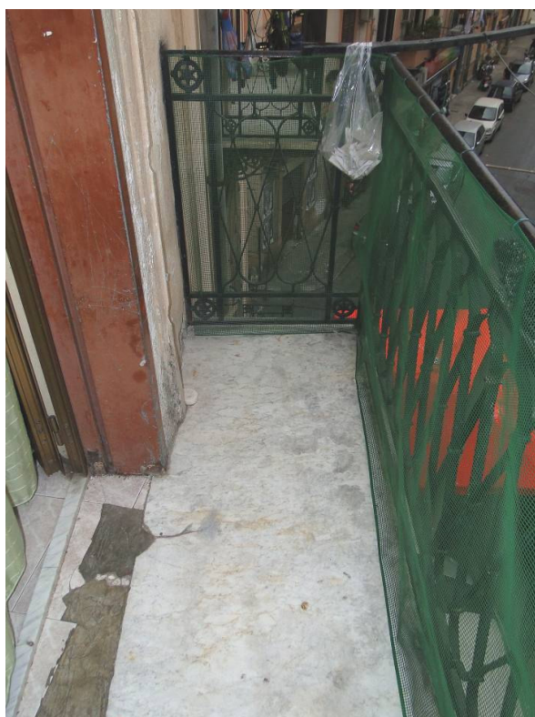
Balcone n.1 su via Imperatrice Costanza, con accesso dalla cucina-soggiorno.