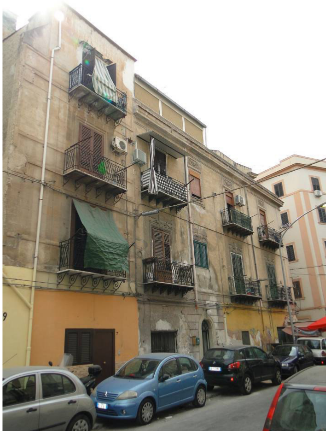
Vista dell'edificio sito a Palermo in via Imperatrice Costanza n.3.