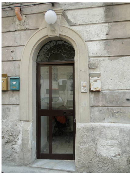
Portoncino di ingresso all'edificio.