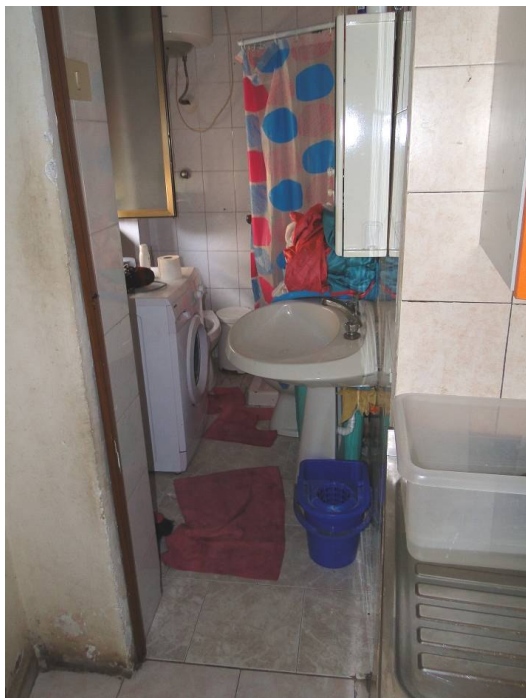
Locale wc doccia.