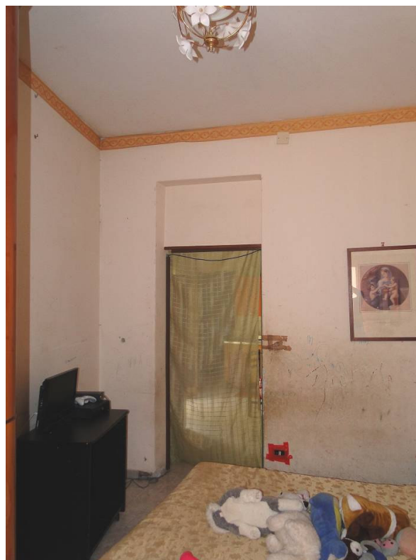
Camera da letto.