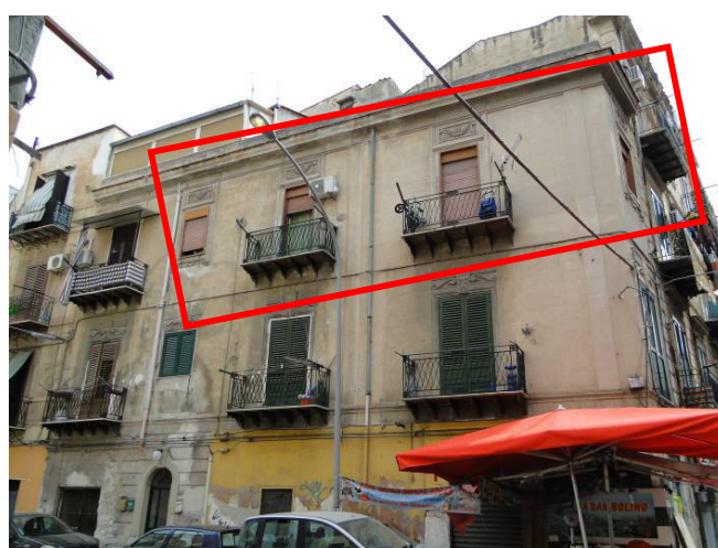
Individuazione dell'immobile oggetto della procedura.