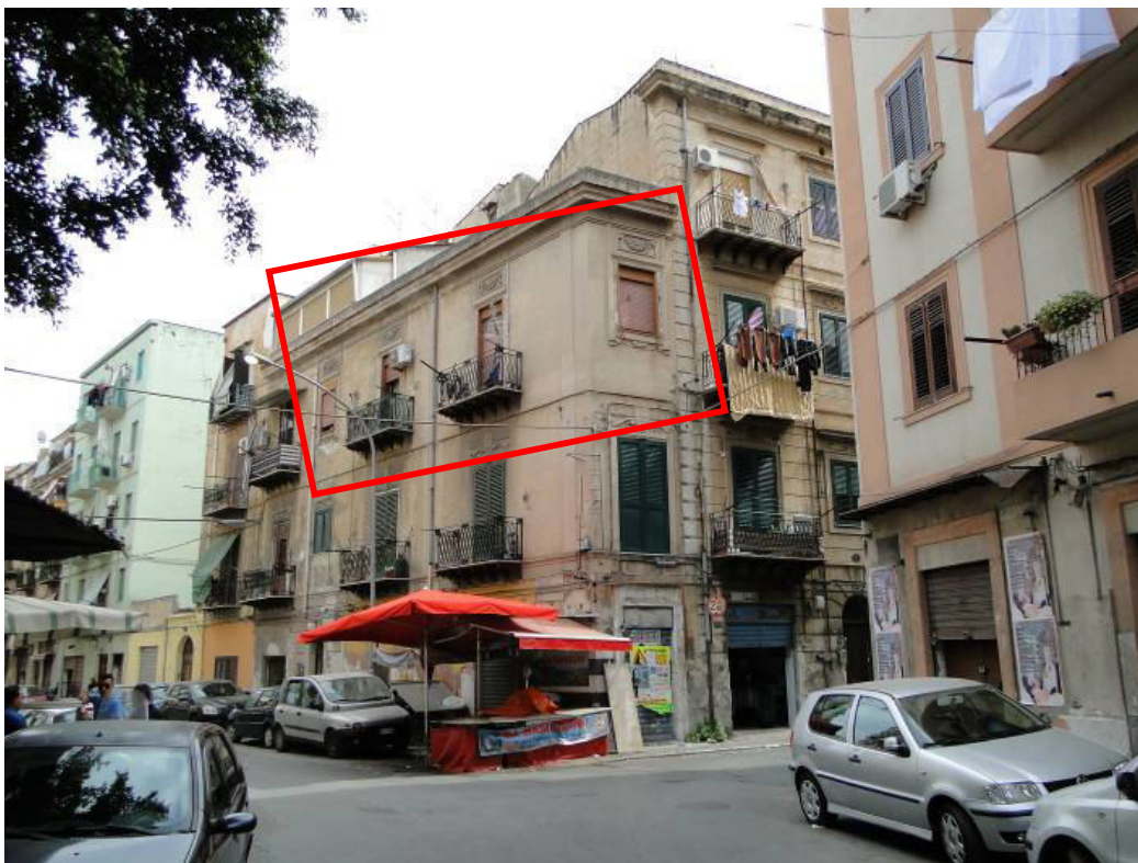
Vista dell'edificio sito a Palermo in via Imperatrice Costanza n.3, all'angolo con la via Cipressi.