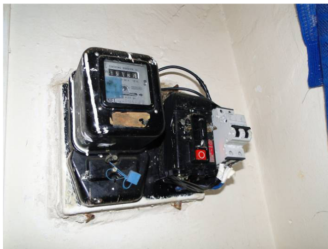
"Quadretto elettrico" dell'appartamento.