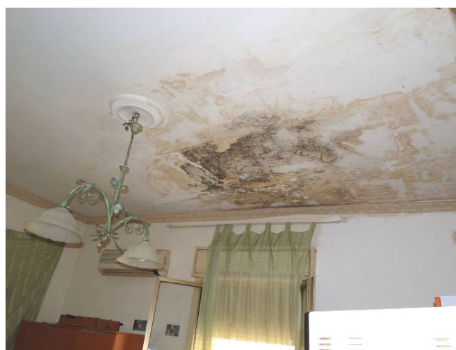
Cucina soggiorno: particolare del soffitto ammalorato.