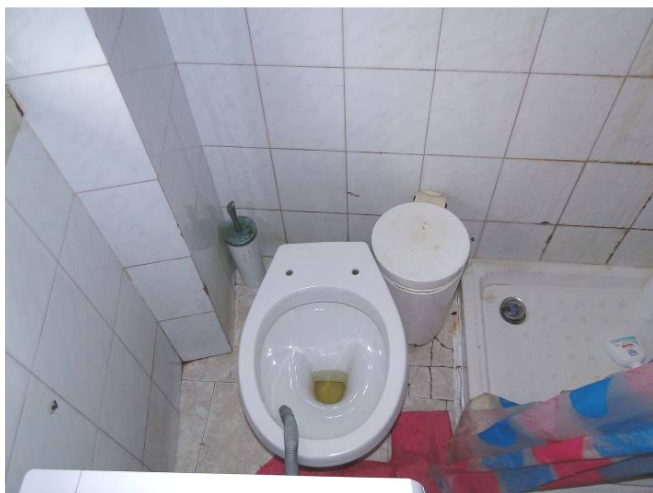
Locale wc doccia.