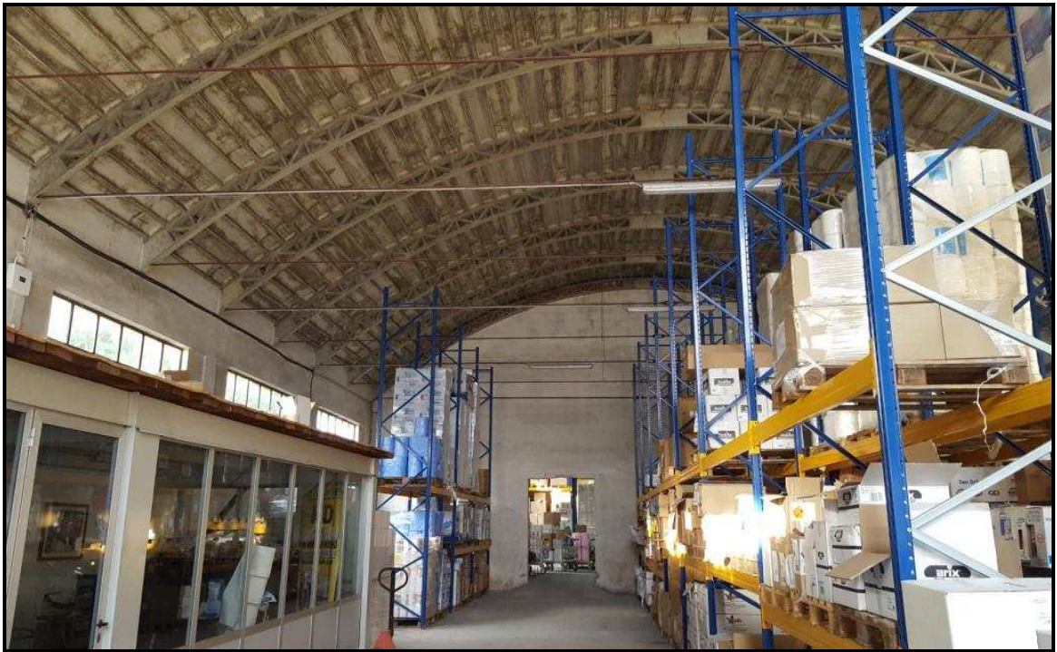
Foto s: interno del 1° vano del cespite N°3, con vista dal lato sud.