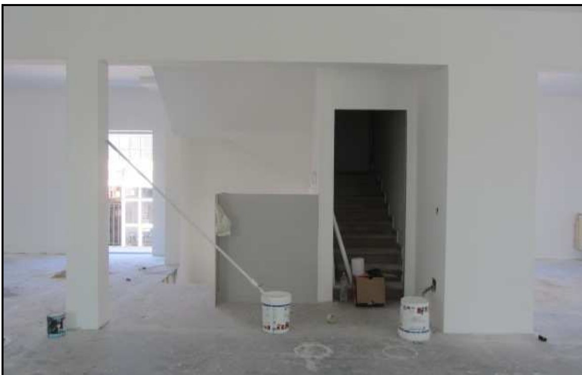
Foto l: interno P.1° cespite N°2 lato sud con visuale del vano scala.