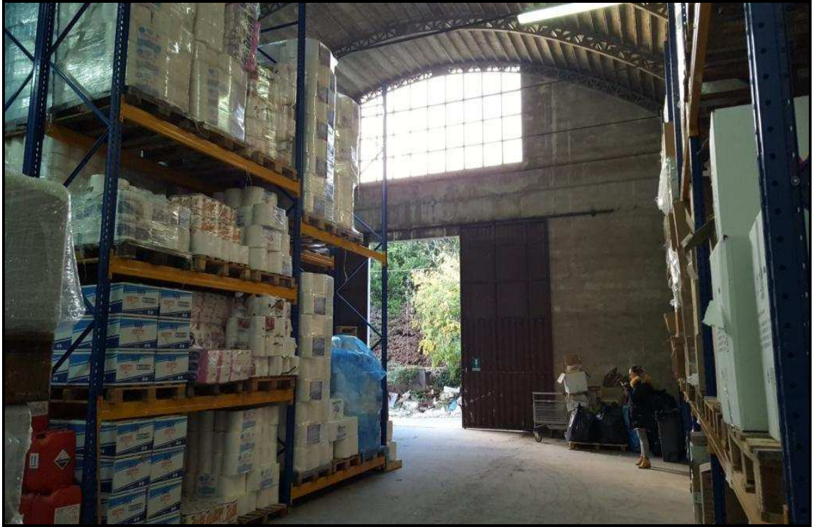
Foto u: interno del 2° vano del cespite N°3 con vista dal lato est.