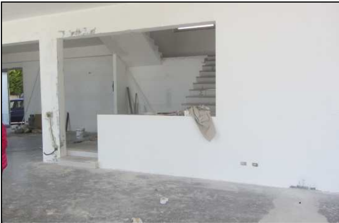
Foto h: interno P.T. cespite N°2 lato sud con visuale del vano scala.