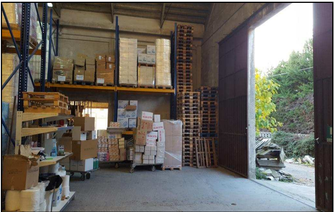
Foto t: interno del 2° vano del cespite N°3, con vista dal lato nord.