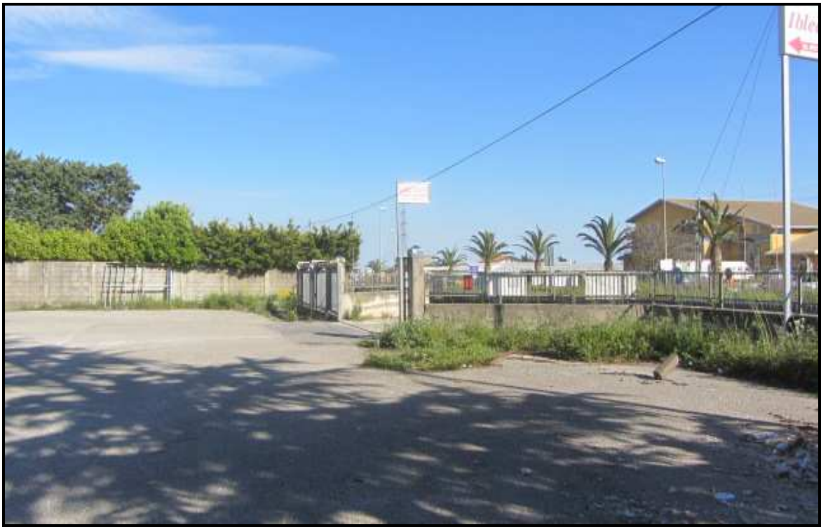
Foto a: spazio antistante il cespite n°2 ( immobile destinato ad esposizione, uffici e servizi).