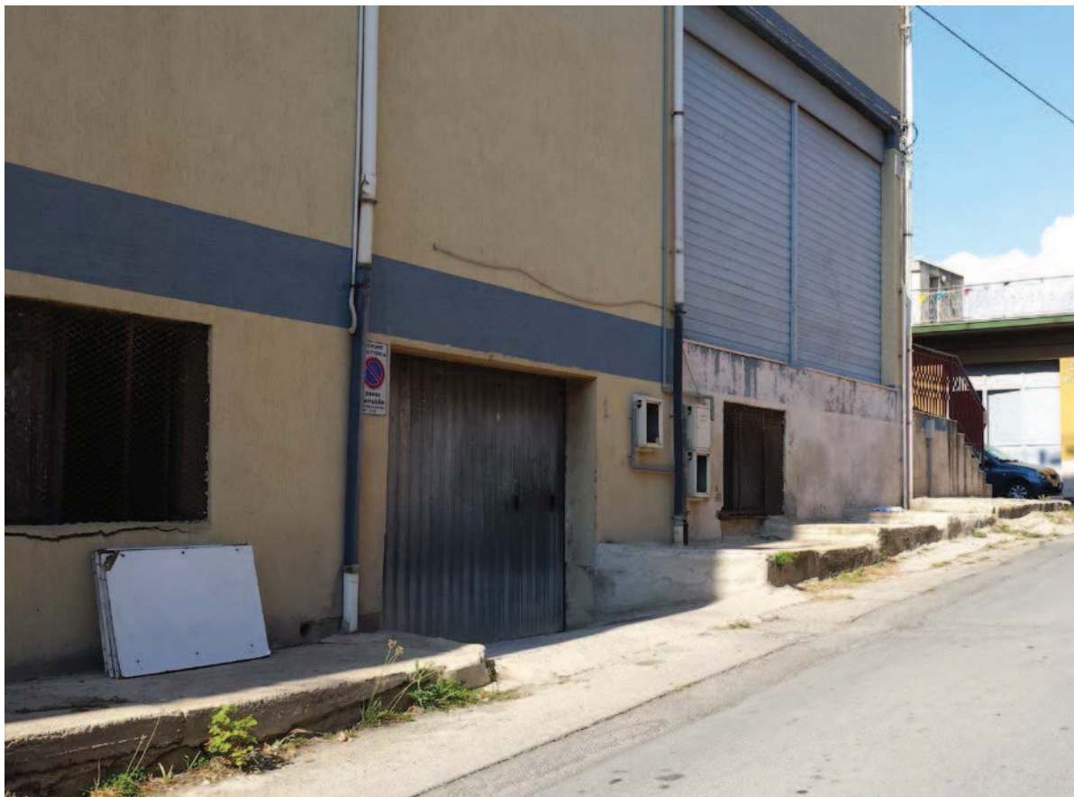
Foto n° 9 – accesso al posto auto coperto da Via Arditì del Popolo