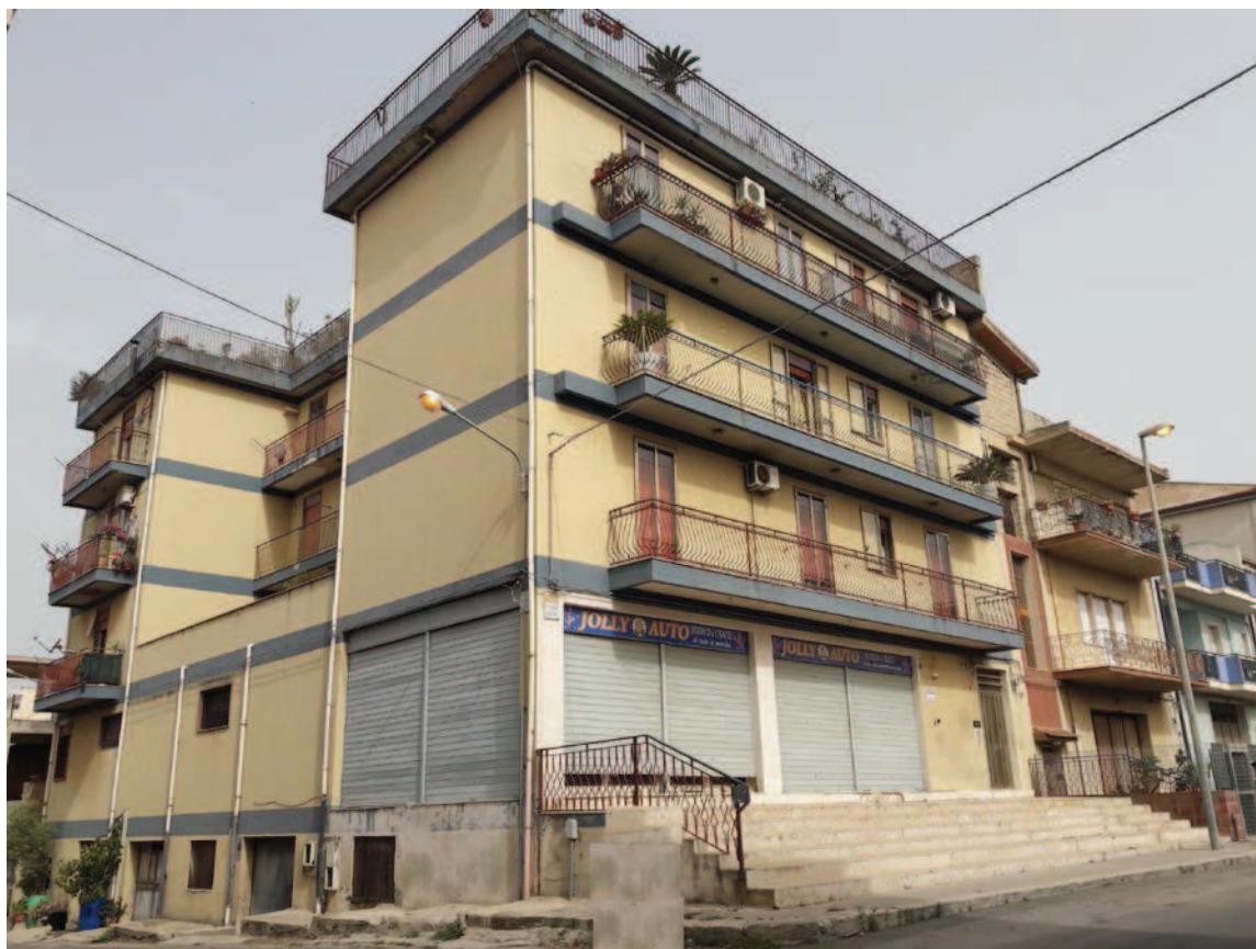
Foto n° 2 – prospetto dell'immobile angolo Via Forcone e Via Arditì del Popolo