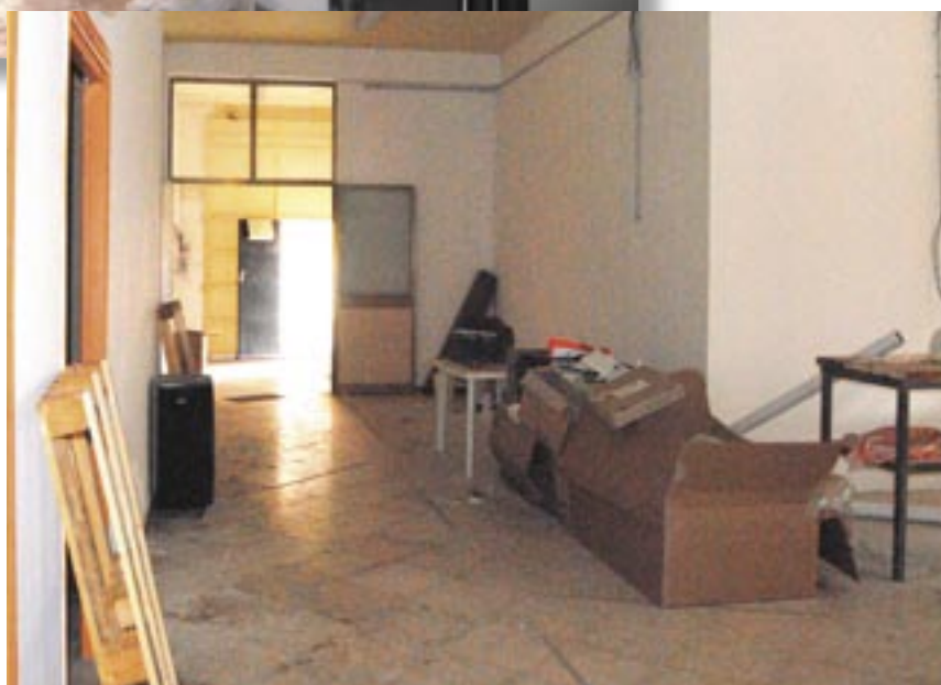
sotto - stanza con tramezzatura in cartongesso