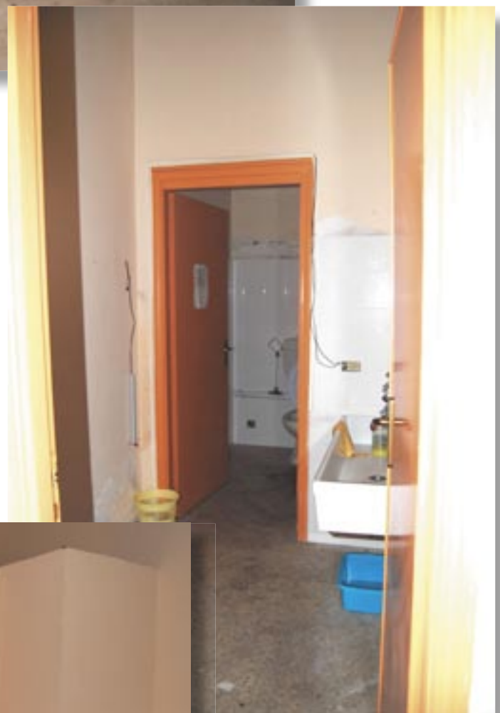
sotto - vano con all'interno wcd da demolire