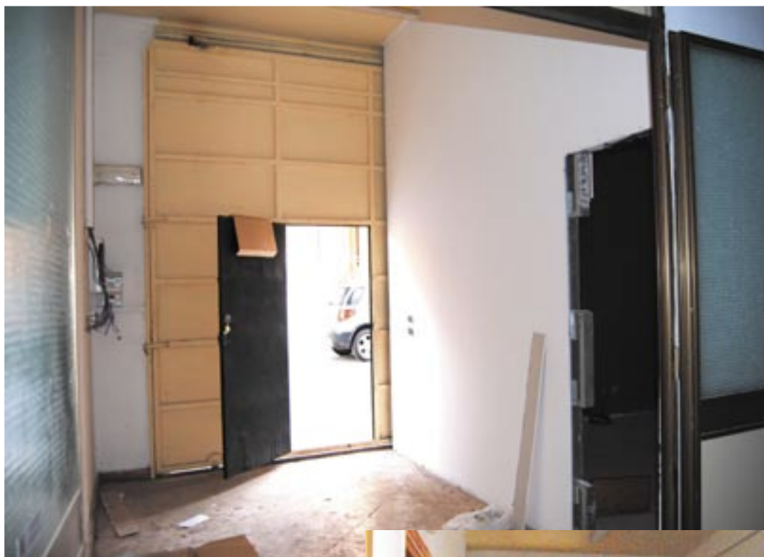
sopra - disimpegno