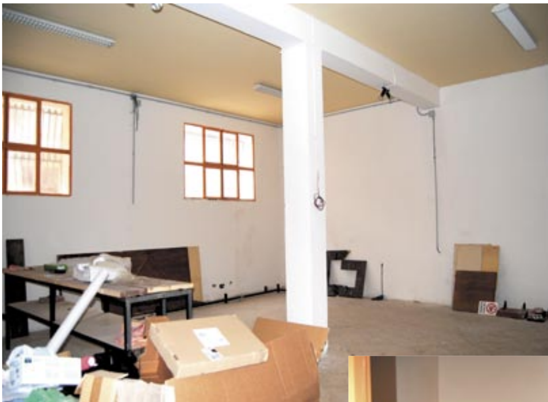
sopra - ampio vano pilastrato