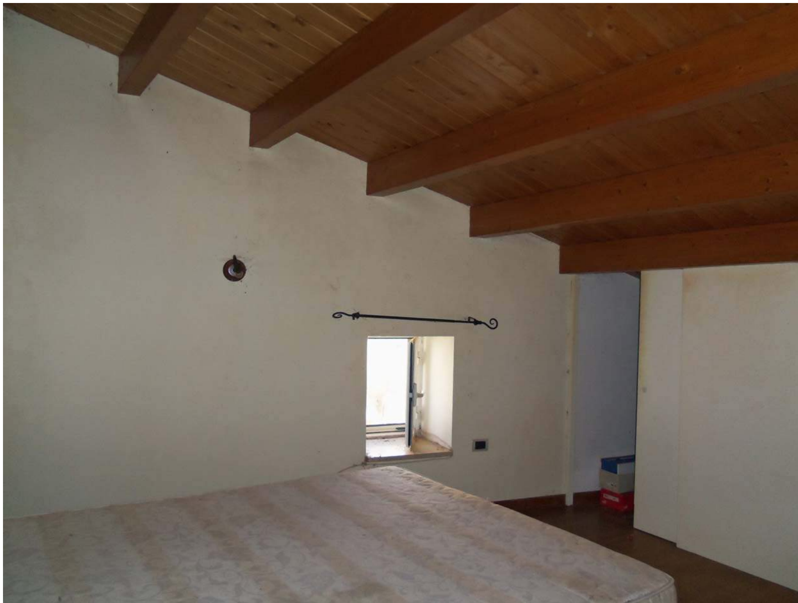
Foto n. 12 - Vista della camera da letto al livello soppalcato. Soppalco realizzato abusivamente e non regolarizzabile, da demolire.