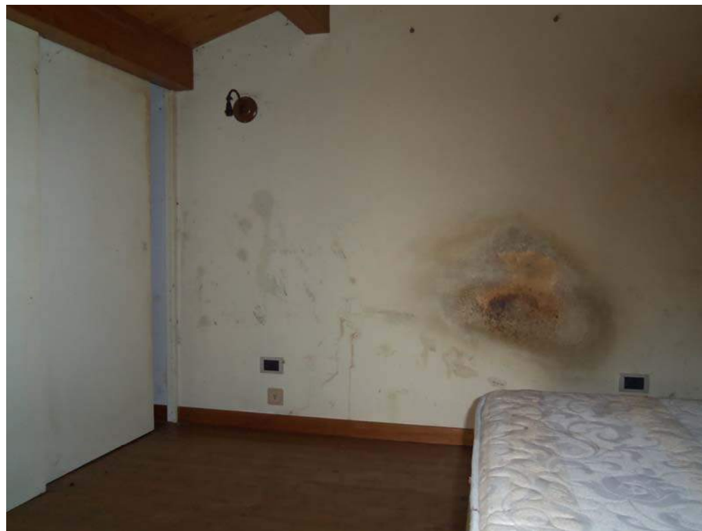
Foto n. 13 - Vista di alcune macchie di umidità sulla parete di confine del livello soppalcato e particolare della scala di accesso.