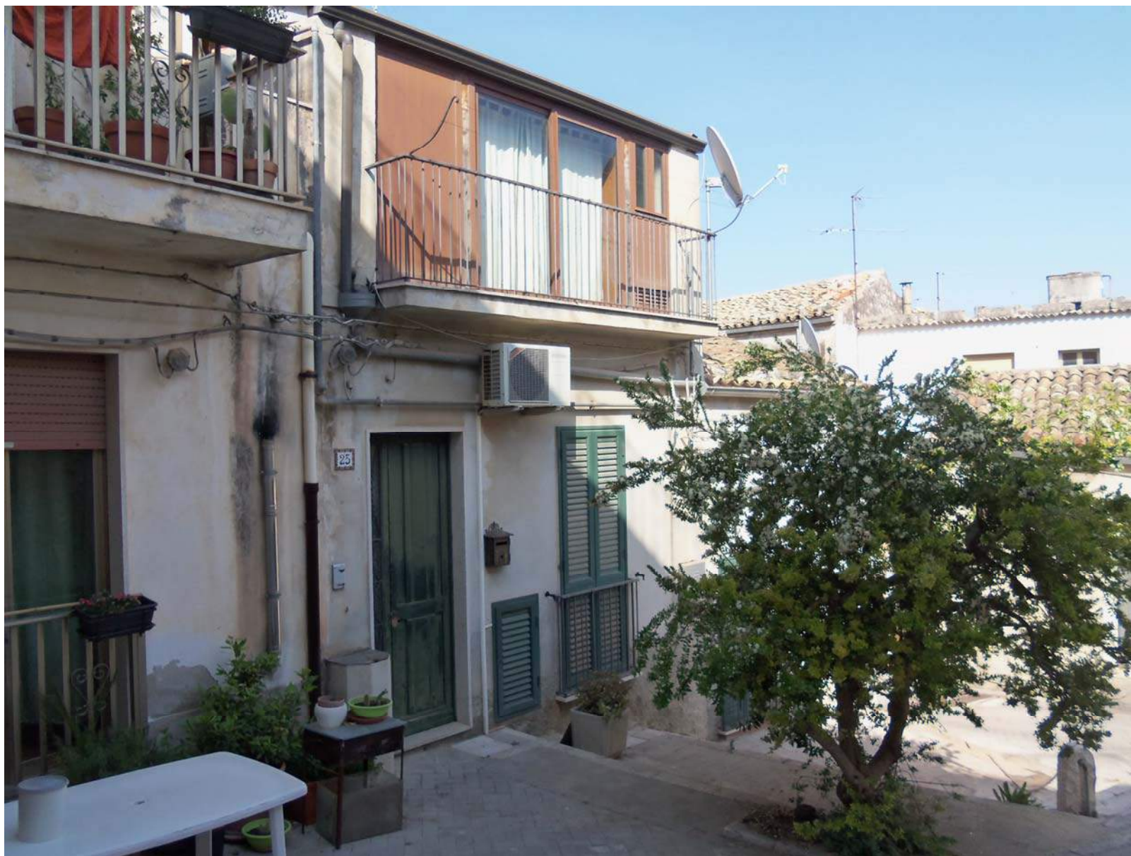
Foto n. 2 - Vista del portone di ingresso all'immobile.