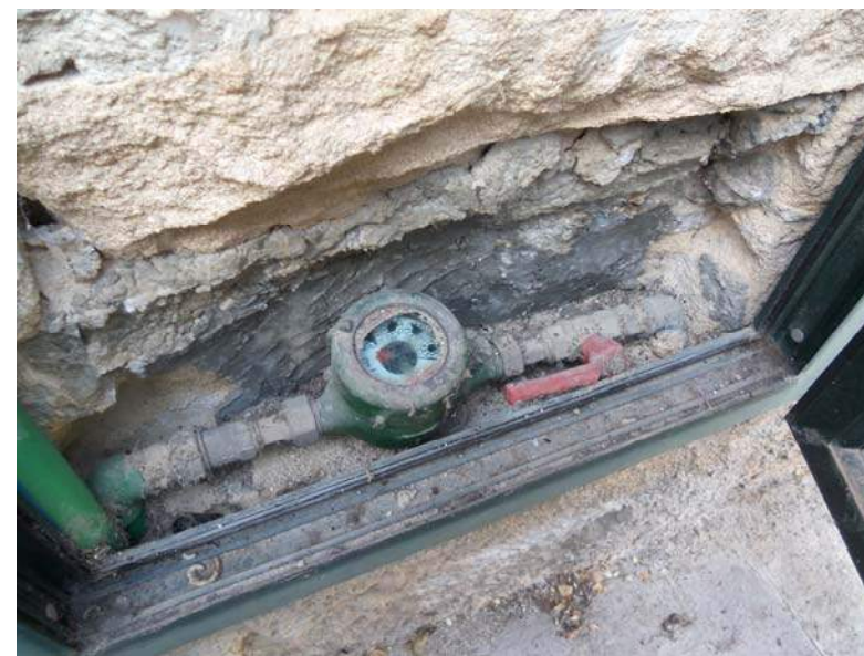
Foto n. 4 - Vano sul prospetto principale per alloggiamento contatore ed elettropompa impianto idrico.