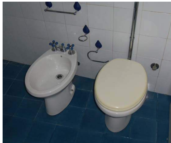
Foto n. 9 - Vista del bagno al piano terra, con particolari dei sanitari e dell'estrattore d'aria.