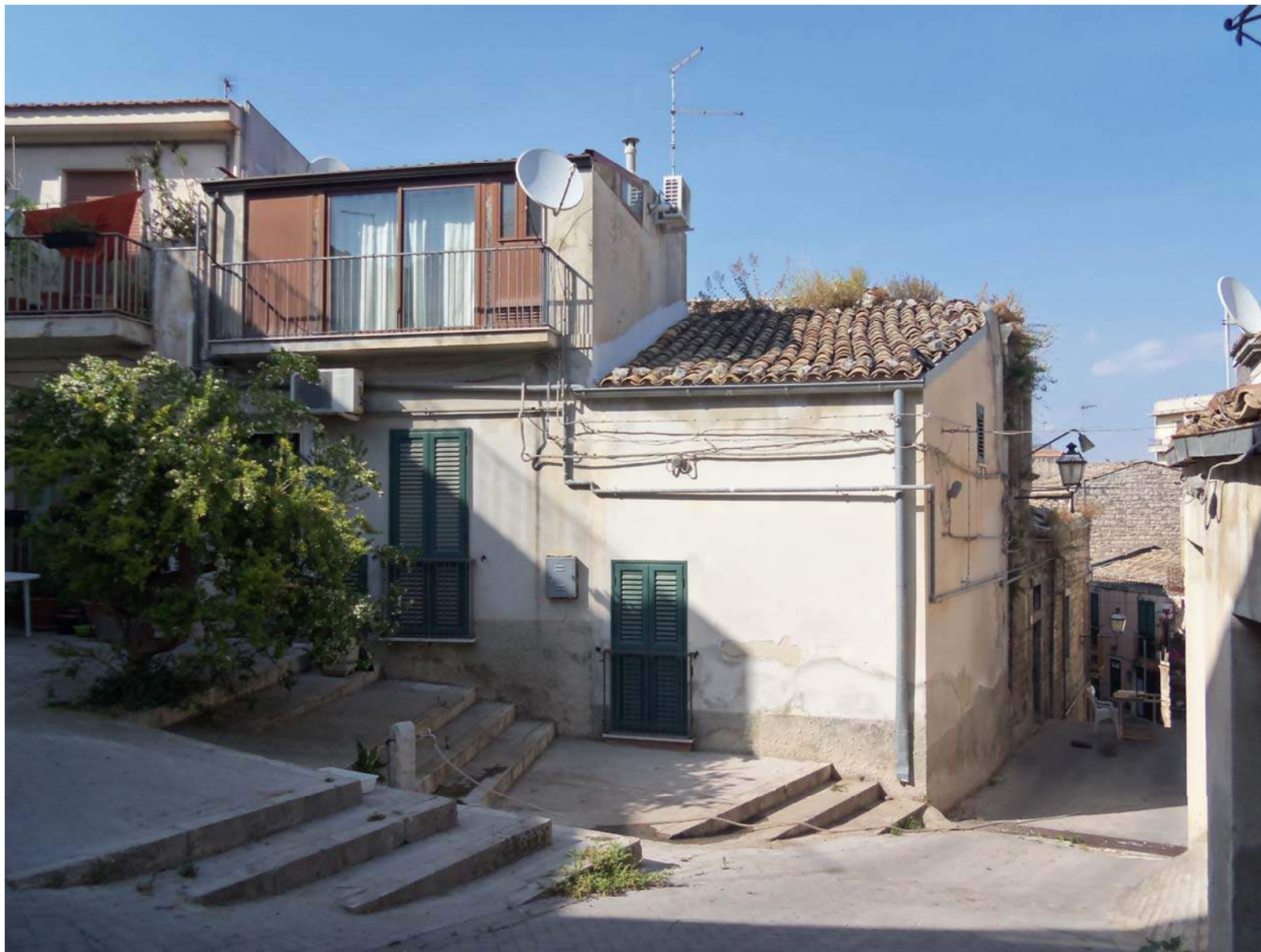
Foto n. 1 - Vista del prospetto principale e laterale dell'immobile su via Aprile.