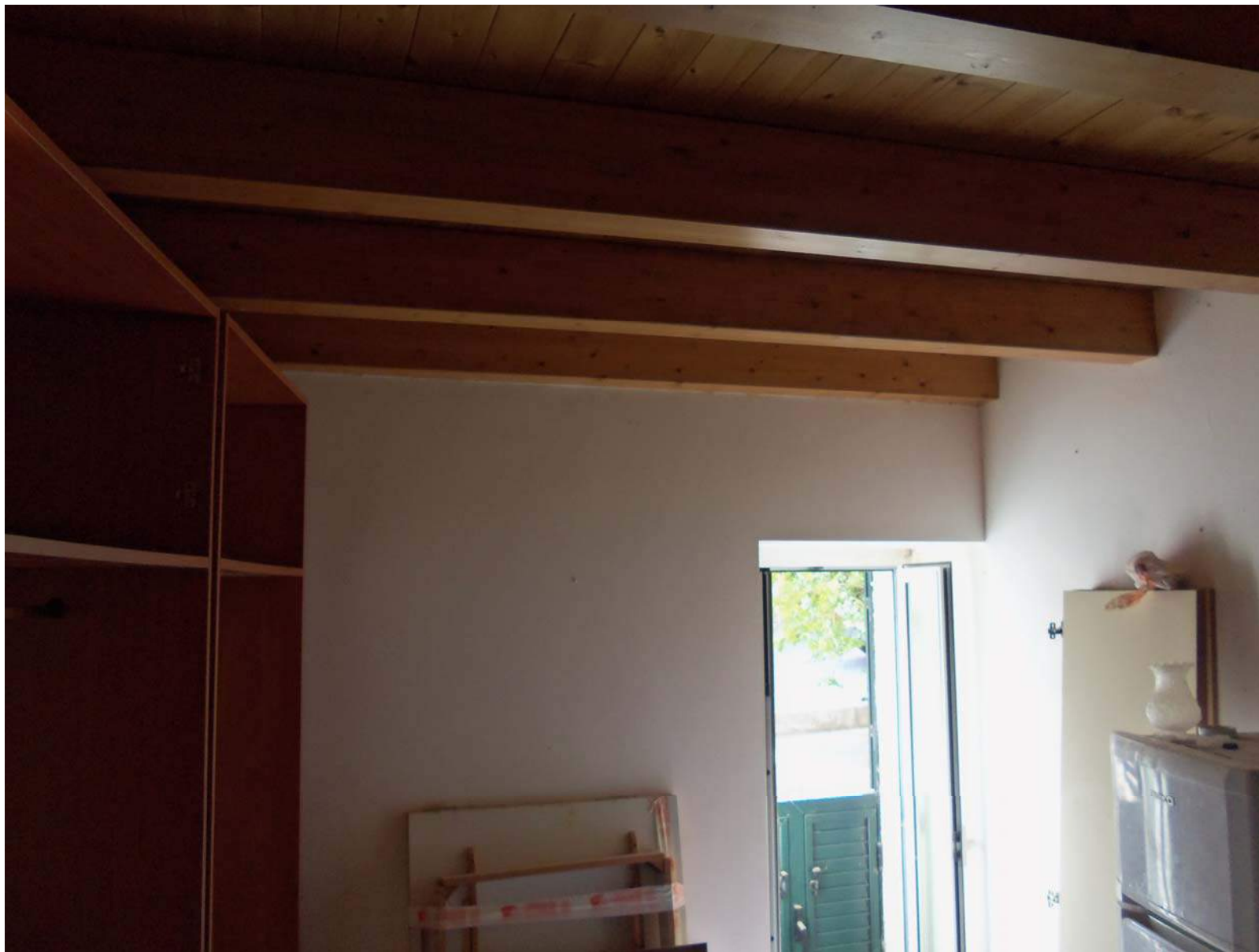
Foto n. 11 - Altra vista del locale al piano terra adiacente l'ingresso-soggiorno. Soppalco realizzato abusivamente e non regolarizzabile, da demolire.