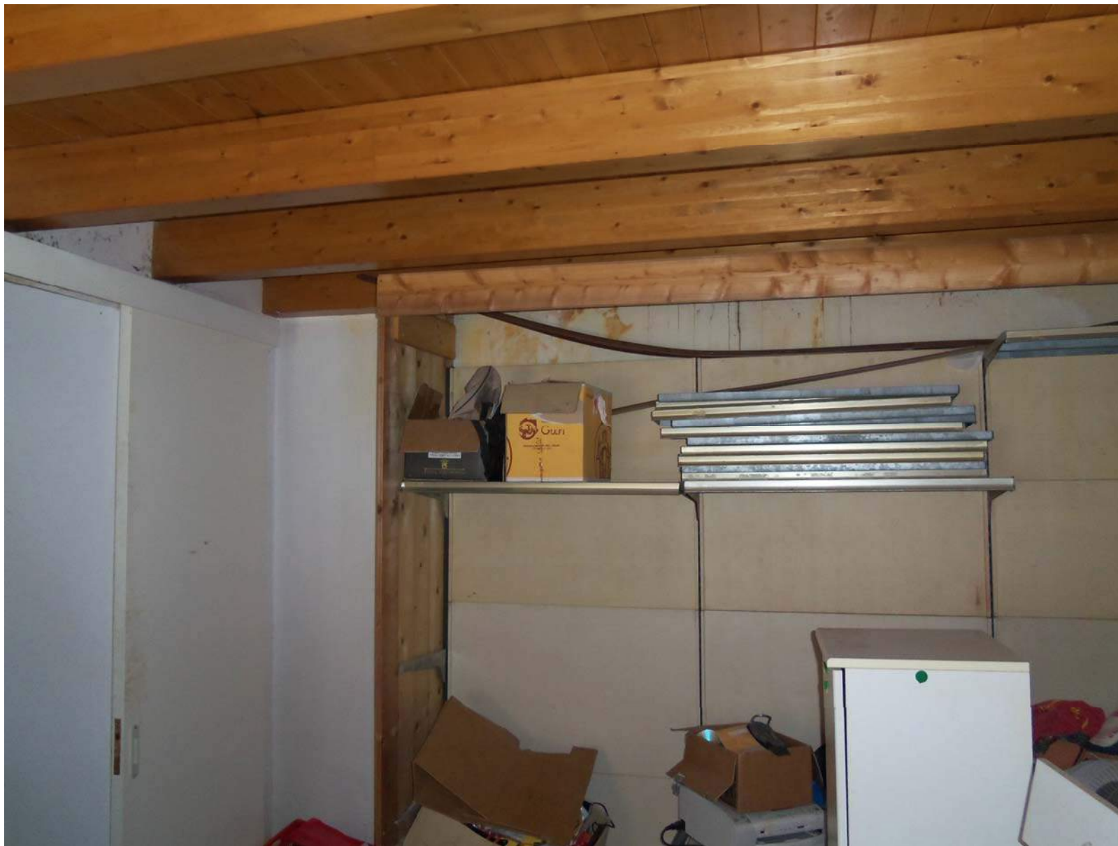
Foto n. 10 - Vista del locale al piano terra adiacente l'ingresso-soggiorno. Soppalco realizzato abusivamente e non regolarizzabile, da demolire.