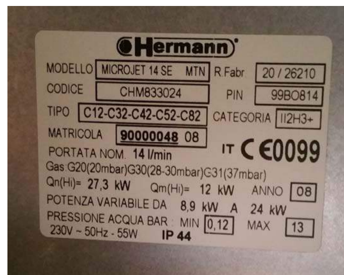
Foto n. 19 - Vista della lavanderia al primo piano, con particolari dello scaldabagno e del contatore gas metano ubicati all'interno.