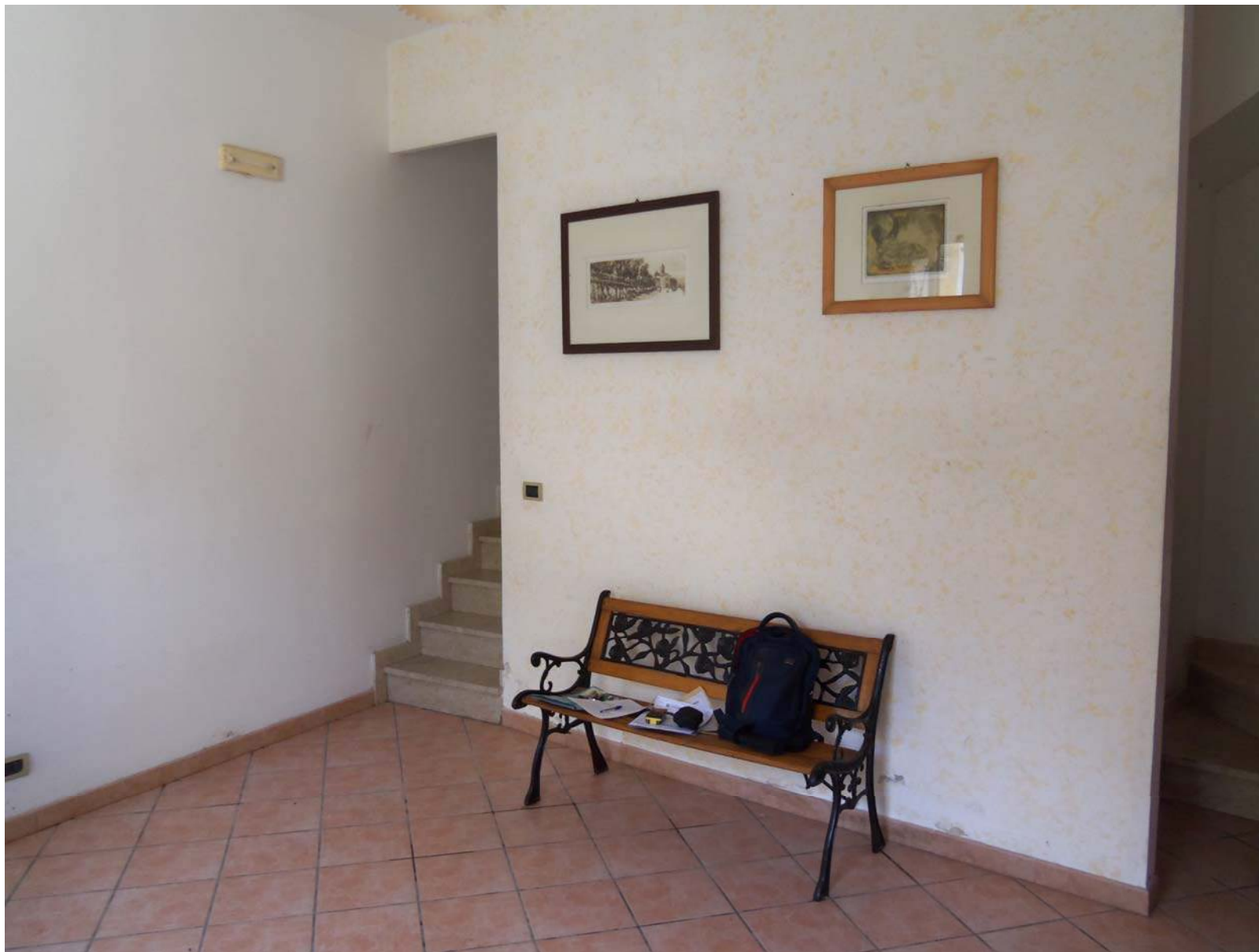
Foto n. 7 - Altra vista dell'ingresso-soggiorno al piano terra.