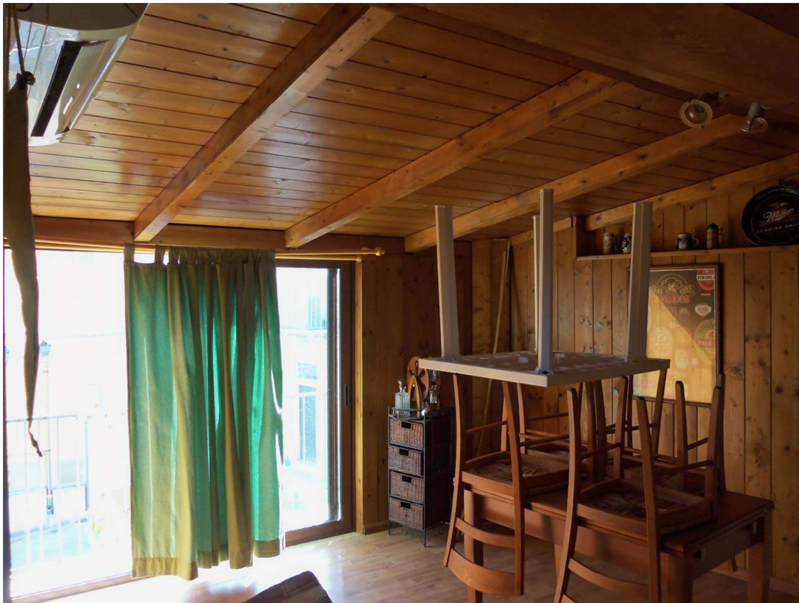
Foto n. 17 - Vista della sala da pranzo al piano primo. Ambiente realizzato abusivamente e non regolarizzabile, da demolire.