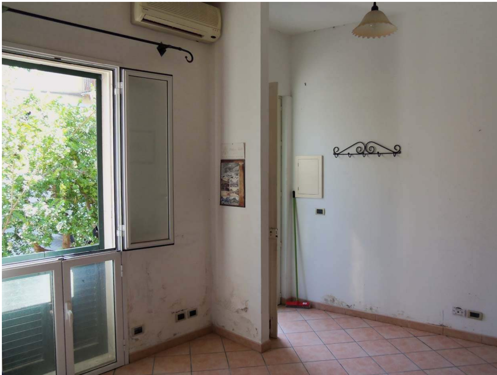
Foto n. 5 - Vista dell'ingresso-soggiorno al piano terra. Visibili macchie di umidità da risalita capillare sulla parete perimetrale.