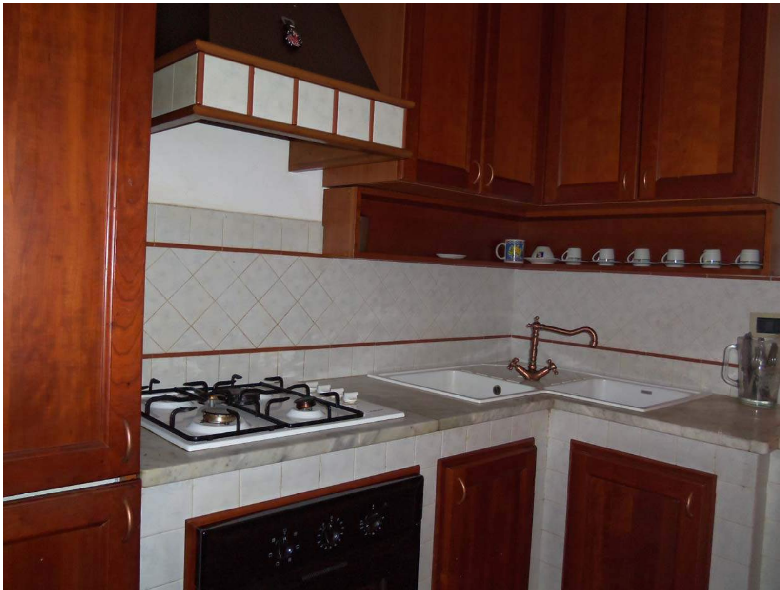
Foto n. 15 - Dettaglio della cucina in muratura.