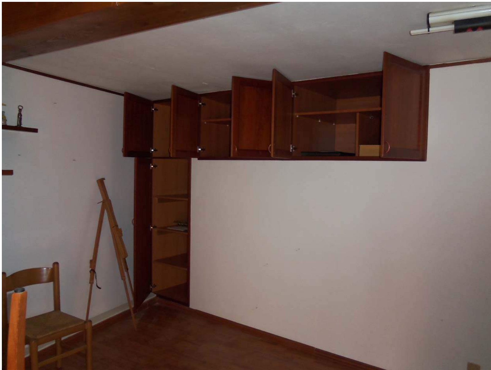
Foto n. 16 - Altra vista della zona cottura.