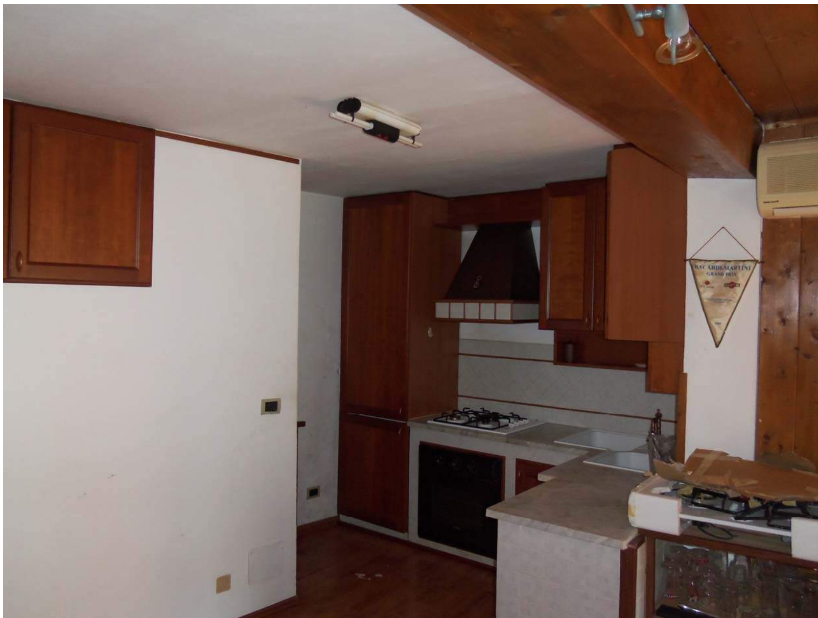
Foto n. 14 - Vista della zona cottura al piano primo.