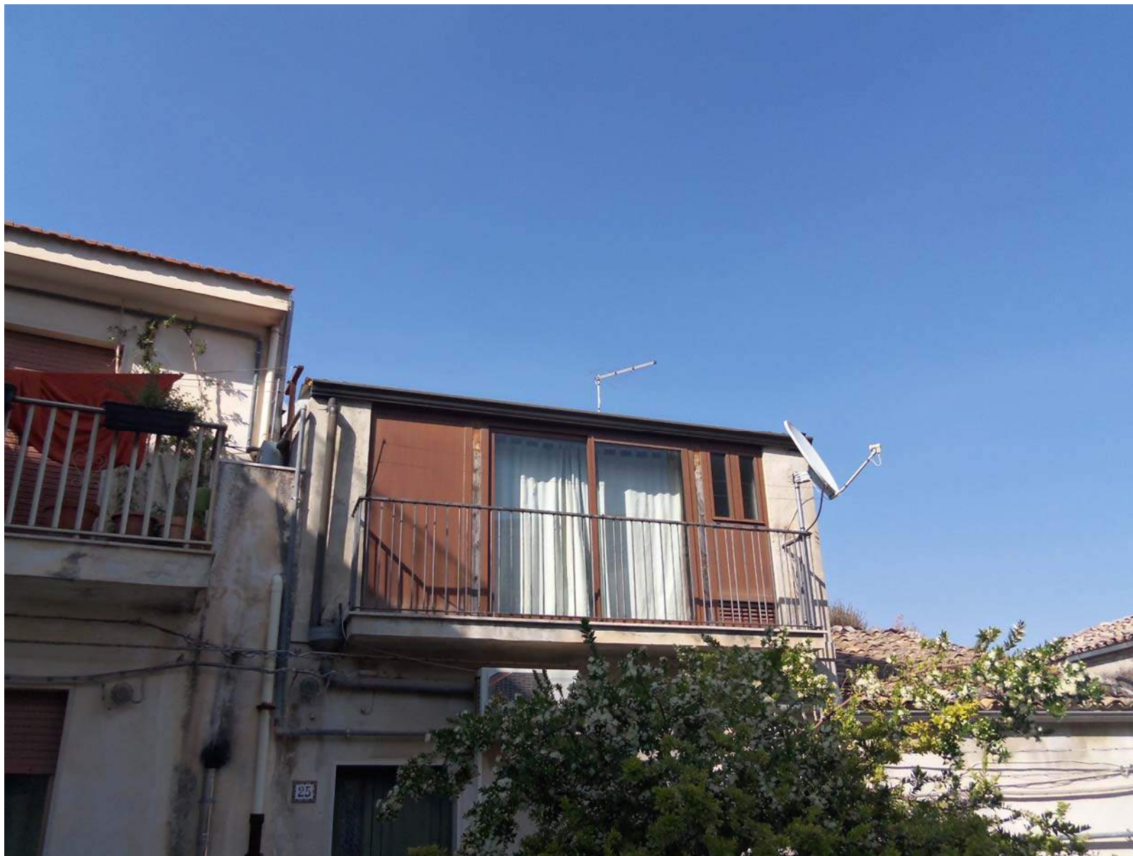
Foto n. 3 - Particolare della struttura di chiusura del lastrico solare visibile dal prospetto principale. Opera abusiva non regolarizzabile, da demolire.