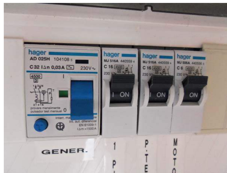
Foto n. 8 - Particolare del contatore e del quadro elettrico ubicati all'ingresso dell'immobile.