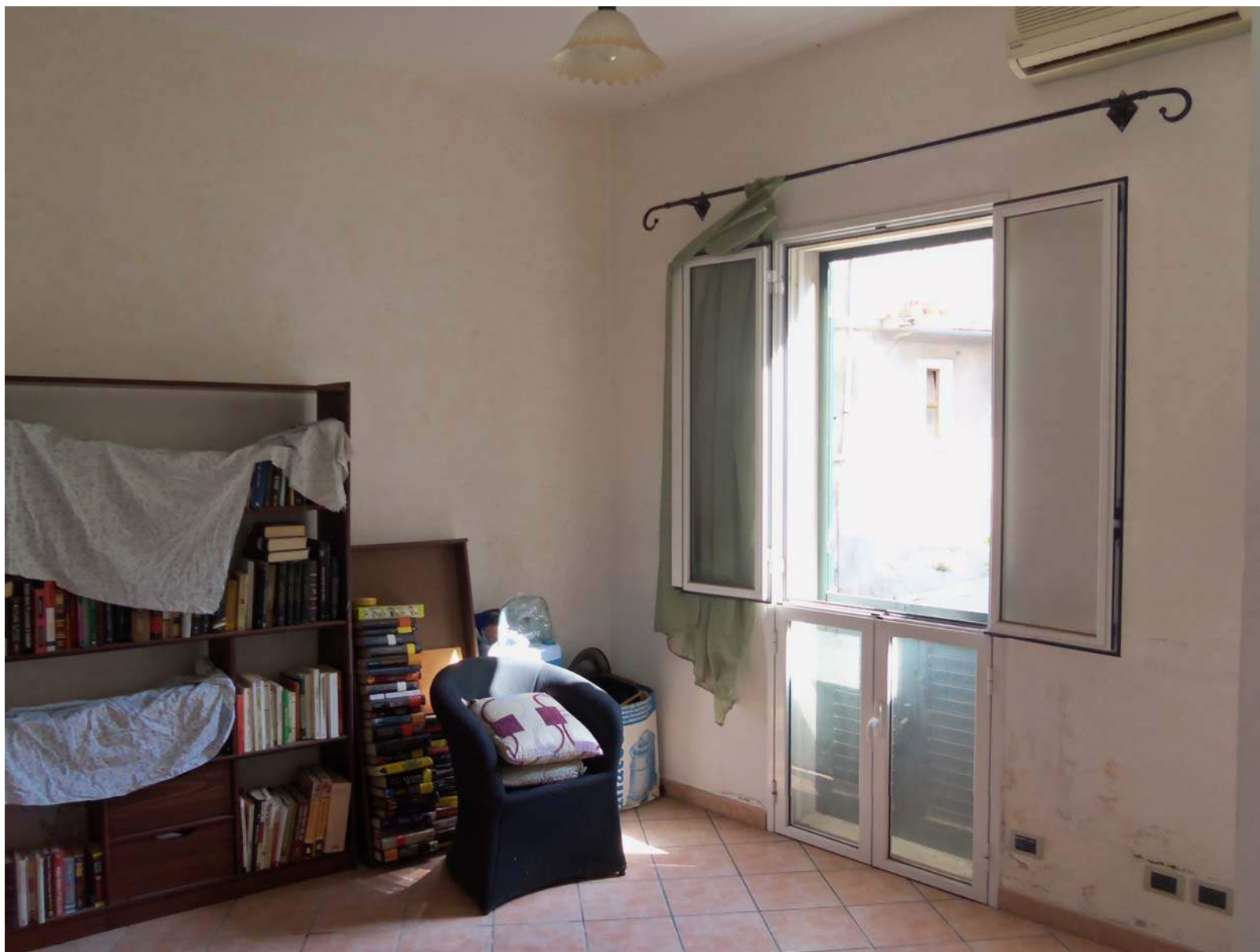
Foto n. 6 - Vista dell'ingresso-soggiorno al piano terra.