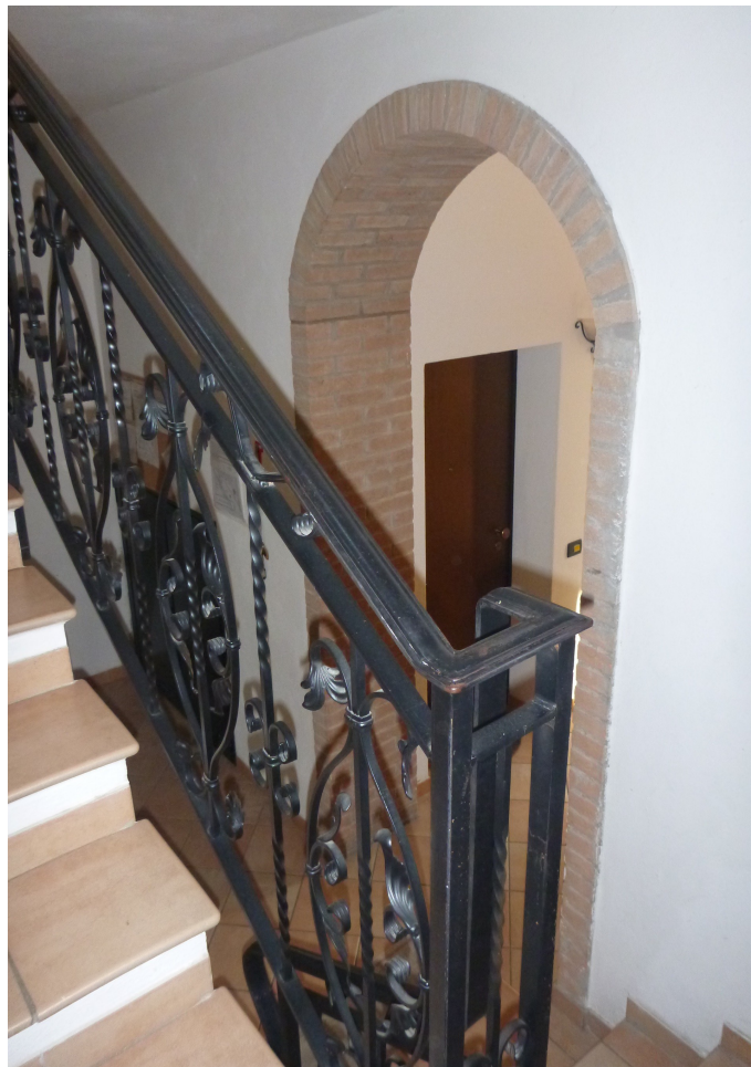
Vano scale condominiale