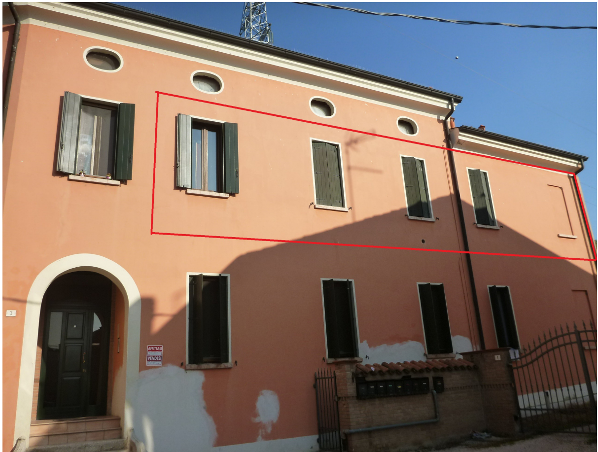
Prospetto su via pubblica