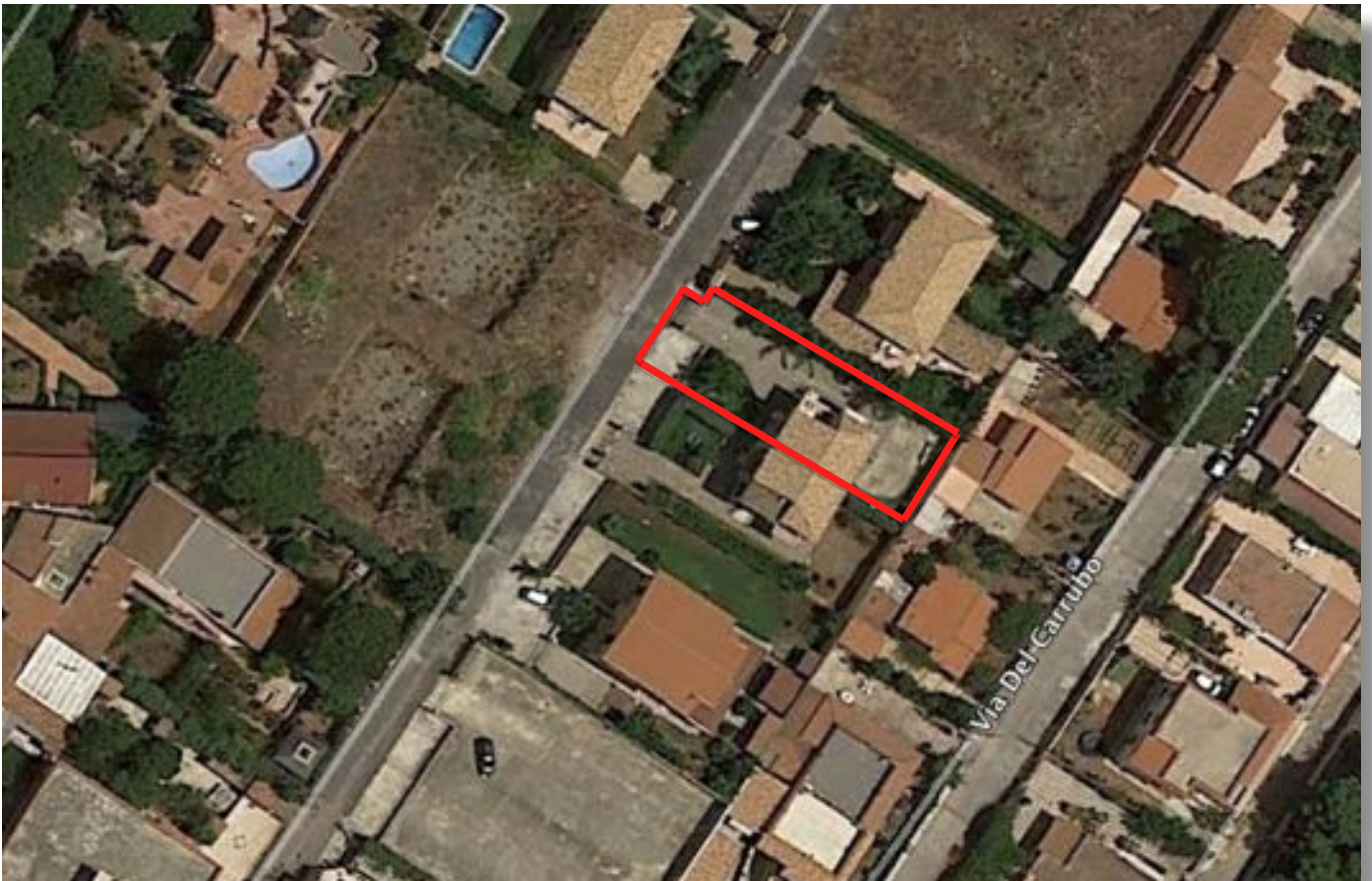
sopra - dettaglio vista aerea