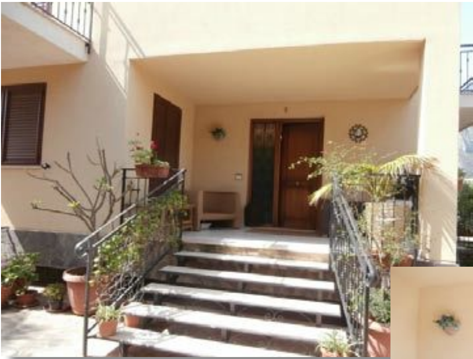
sopra - portico antistante l'ingresso accanto - portone d'ingresso