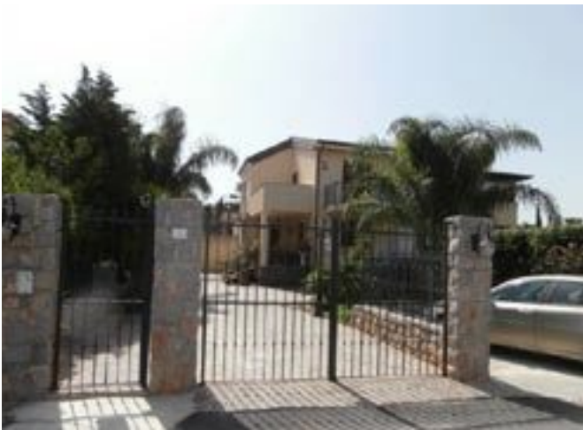
sotto - sx retro prospetto, dx sdettaglio aperture da sanare