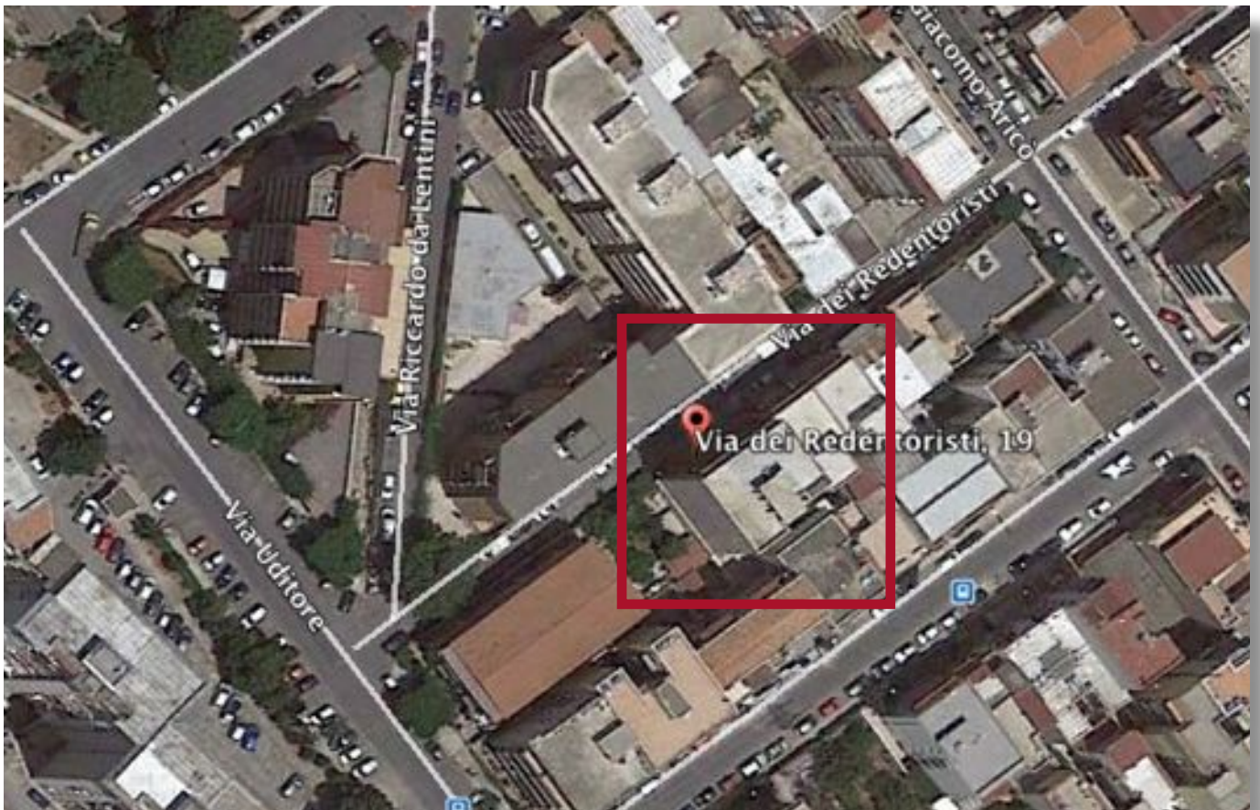
sopra - dettaglio vista aerea