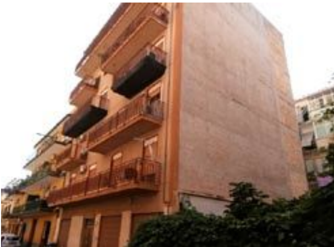
al centro - prospetto su via Redentoristi sotto - scorci degli altri prospetti (da definire)