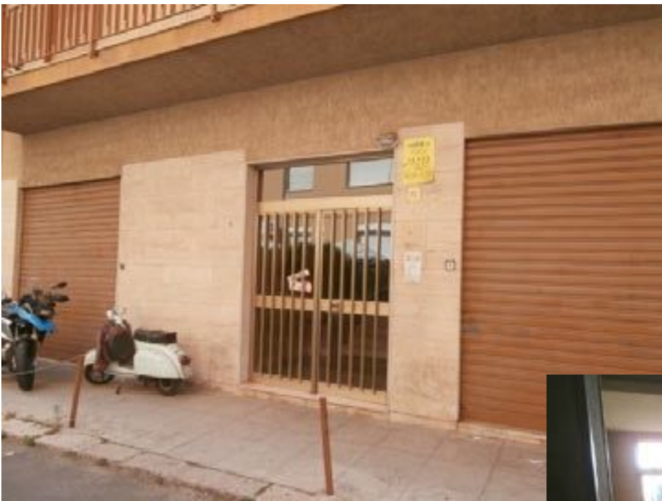
sopra - portone accanto - interno portineria