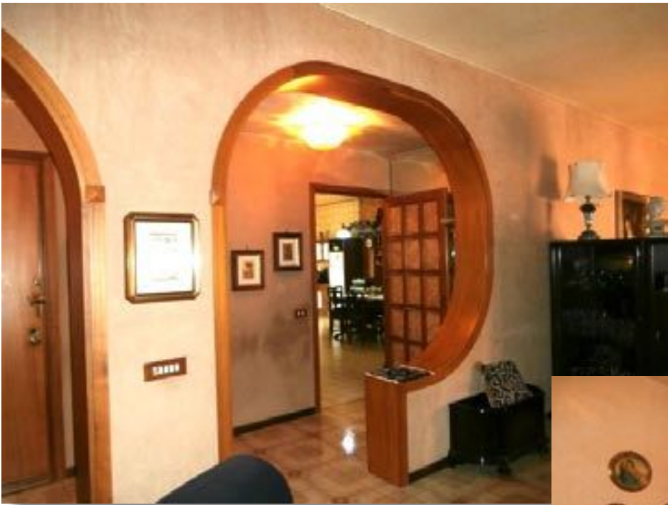
sopra - scorcio dal salone verso il soggiorno accanto - camera