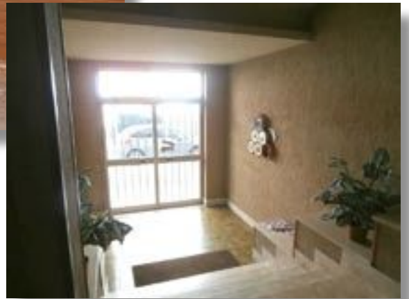
al centro - porta d'ingresso dal pianerottolo e soggiorno in basso - cucina in veranda da dismettere