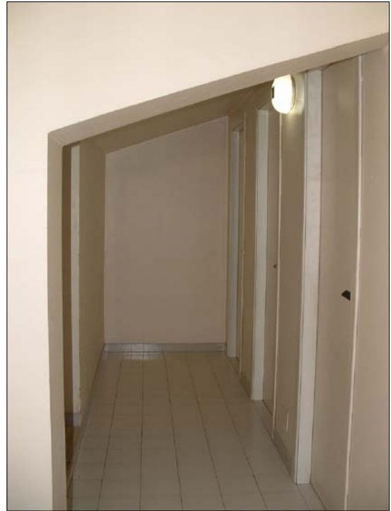
FOTO 8 - VISTA CAMERA PICCOLA