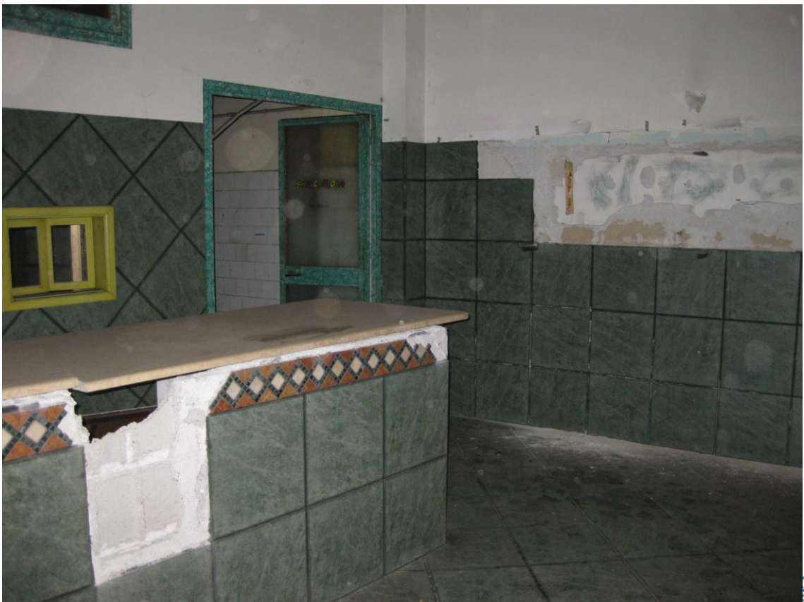
Foto 6: Altra inquadratura del primo ambiente; al centro la porta che conduce al secondo ambiente

REGIONE DEGR... PALERMO DOTT. ING. MARCO D'ADDELFIO Sez. A Settore civile e ambientale n° 8324