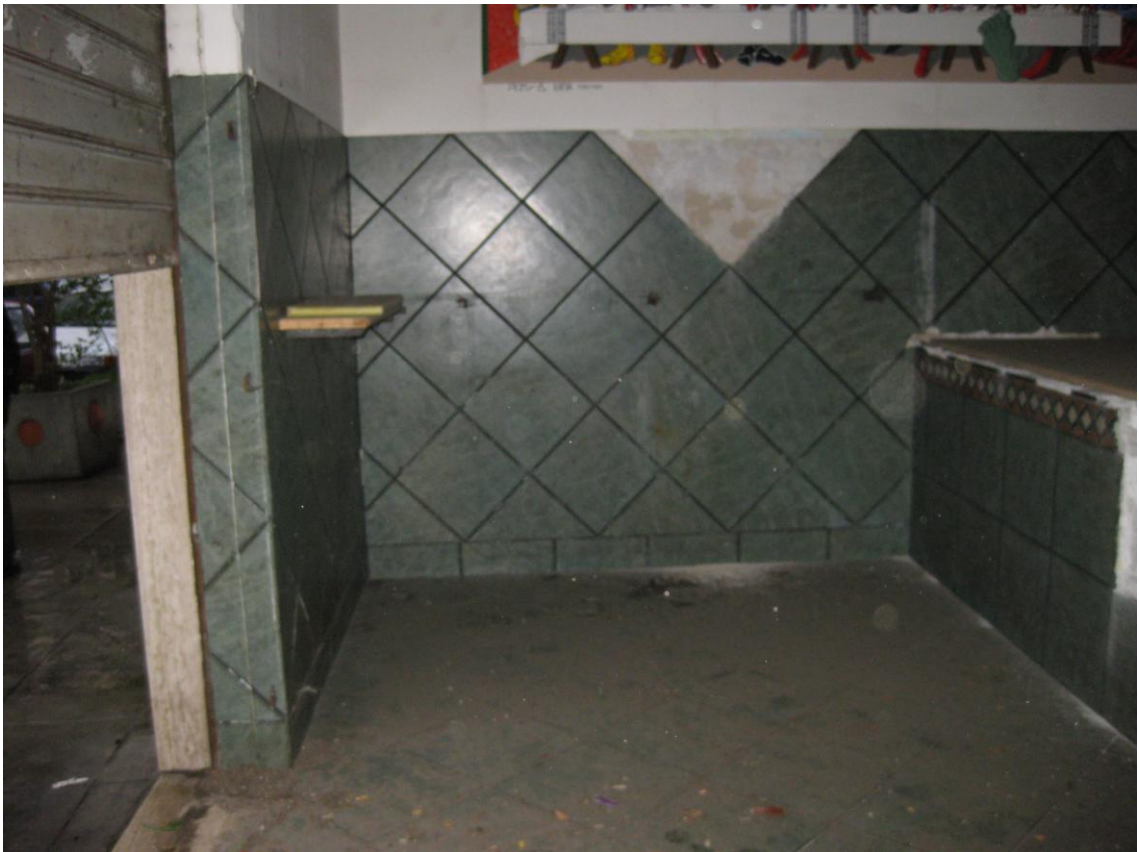
Foto 5: Il primo ambiente, superando la serranda metallica avvolgibile