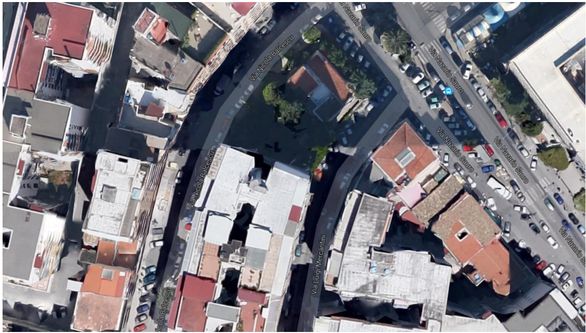
Foto 3: Panoramica dall'alto dell'immobile identificato nel N.C.E.U. del Comune di Palermo nel foglio 48 dalla p.lla 677