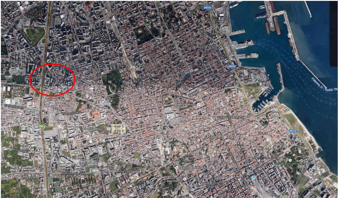
Foto 1: Vista aerea dell'immobile identificato nel N.C.E.U. del Comune di Palermo nel foglio 48 dalla p.lla 677 rispetto all'abitato di Palermo