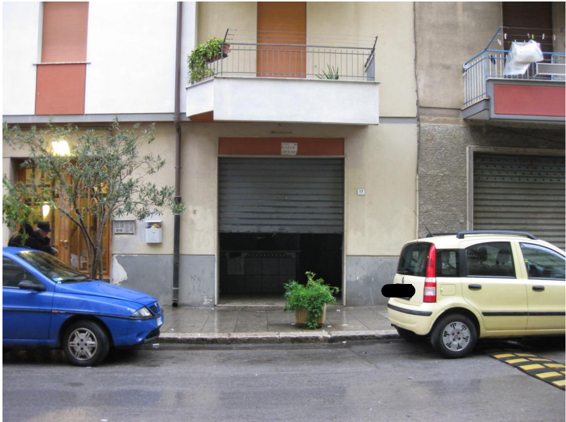
Foto 4: Inquadratura, dalla via Nicola Balcescu, dell'ingresso al magazzino identificato toponomasticamente dal civico n. 17