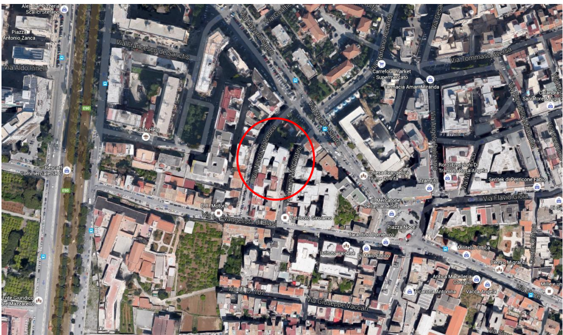
Foto 2: Altra vista aerea dell'immobile identificato nel N.C.E.U. del Comune di Palermo nel foglio 48 dalla p.lla 677

REGIONE DEGLI INGEGNERI DELLA PROVINCIA DI PALERMO DOTT. ING. MARCO D'ADELFO Sez. A Settore civile e ambientale n° 8324 Pagina 1