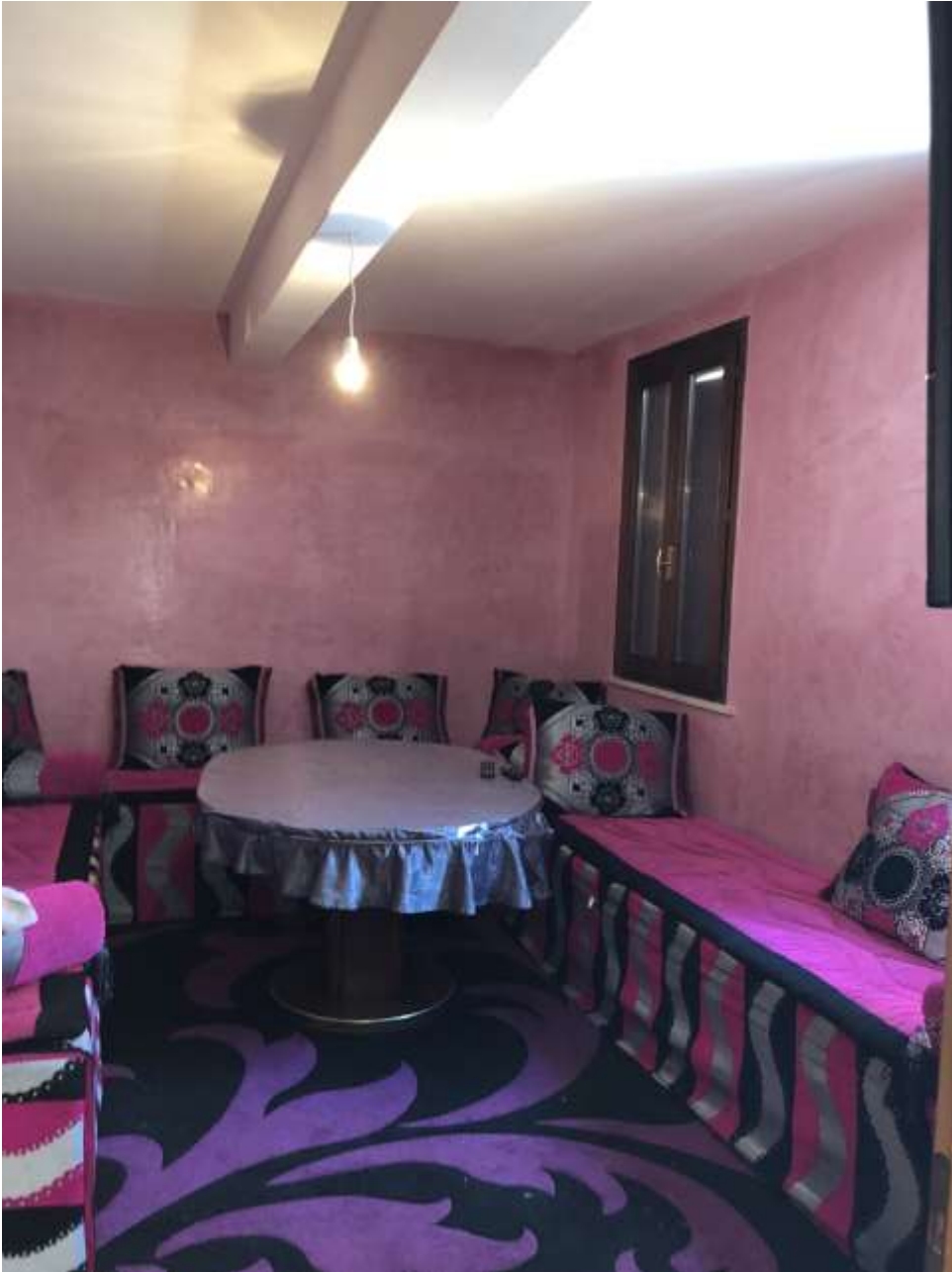
Foto 8: immagine della sala con controsoffitto in cartongesso e trave finta