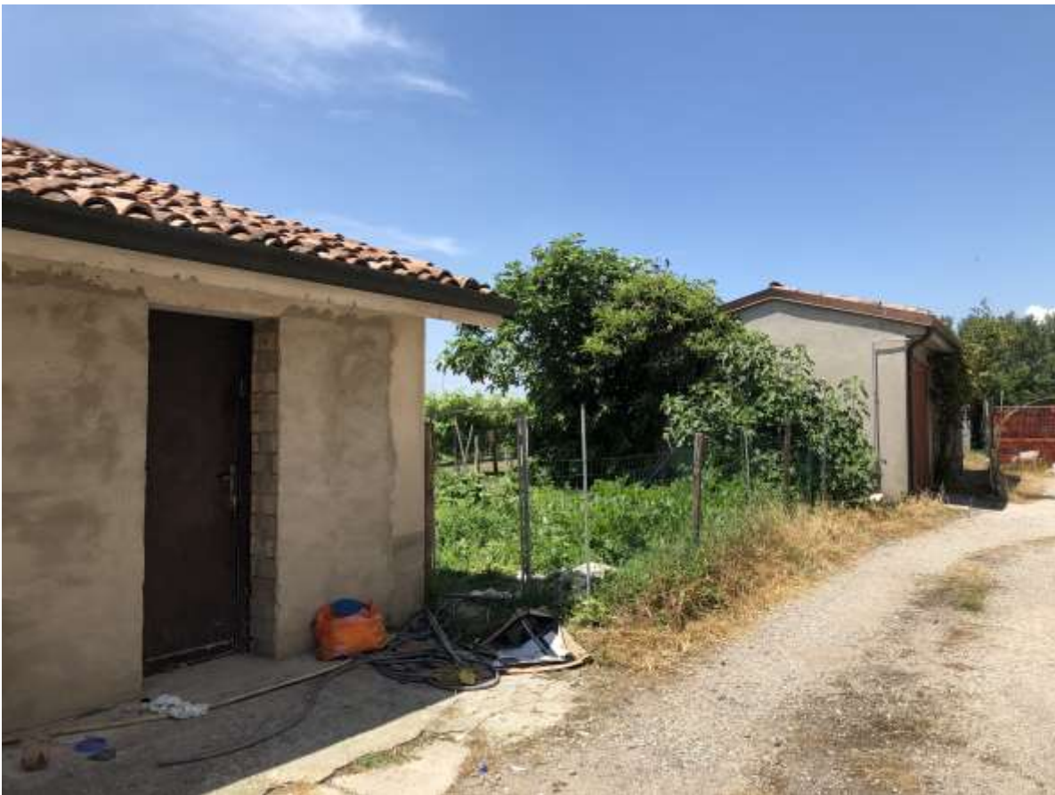
Foto 49 e 50: veduta esterna del rustico di cui al fg 36 mapp. 18 con antistante porzione di area di pertinenza in cls