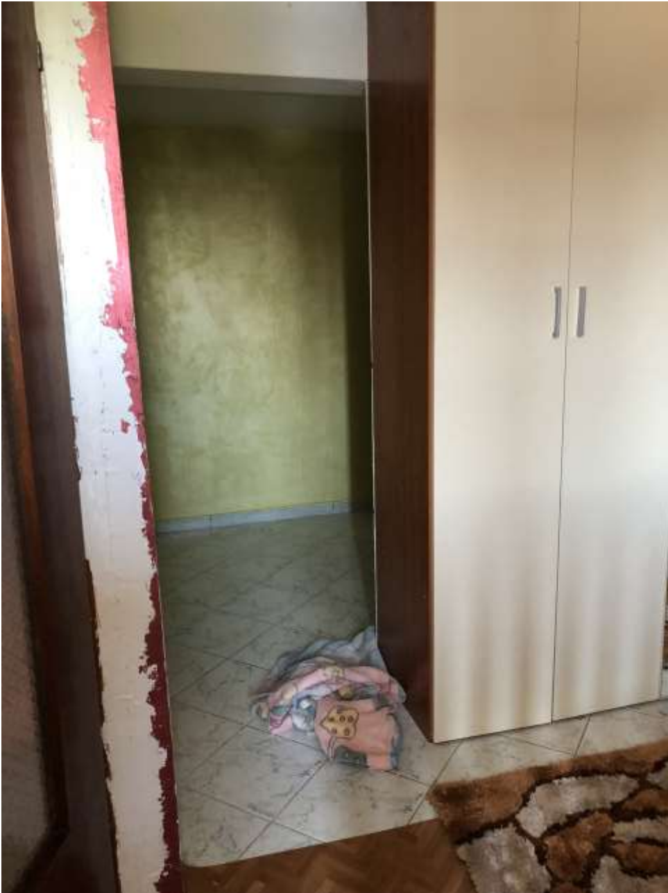
Foto 29: armadio utilizzato come separazione tra camera da letto e guardaroba