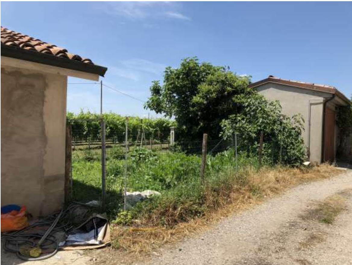
Foto 52 e 53: veduta della porzione di terreno di cui al fg 36 mapp. 17 su cui si trova il serbatoio di GPL (terreno non compreso nella presente perizia)