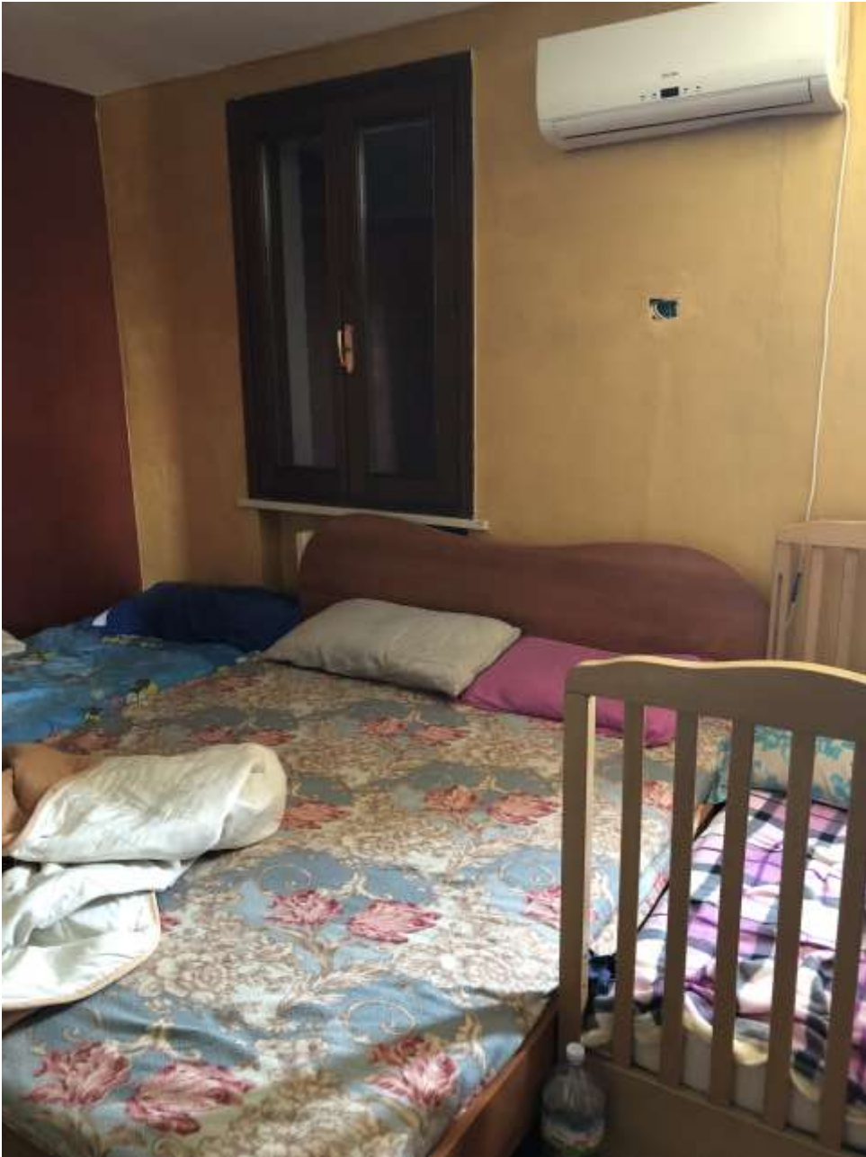
Foto 32: camera da letto con condizionatore per il raffrescamento estivo