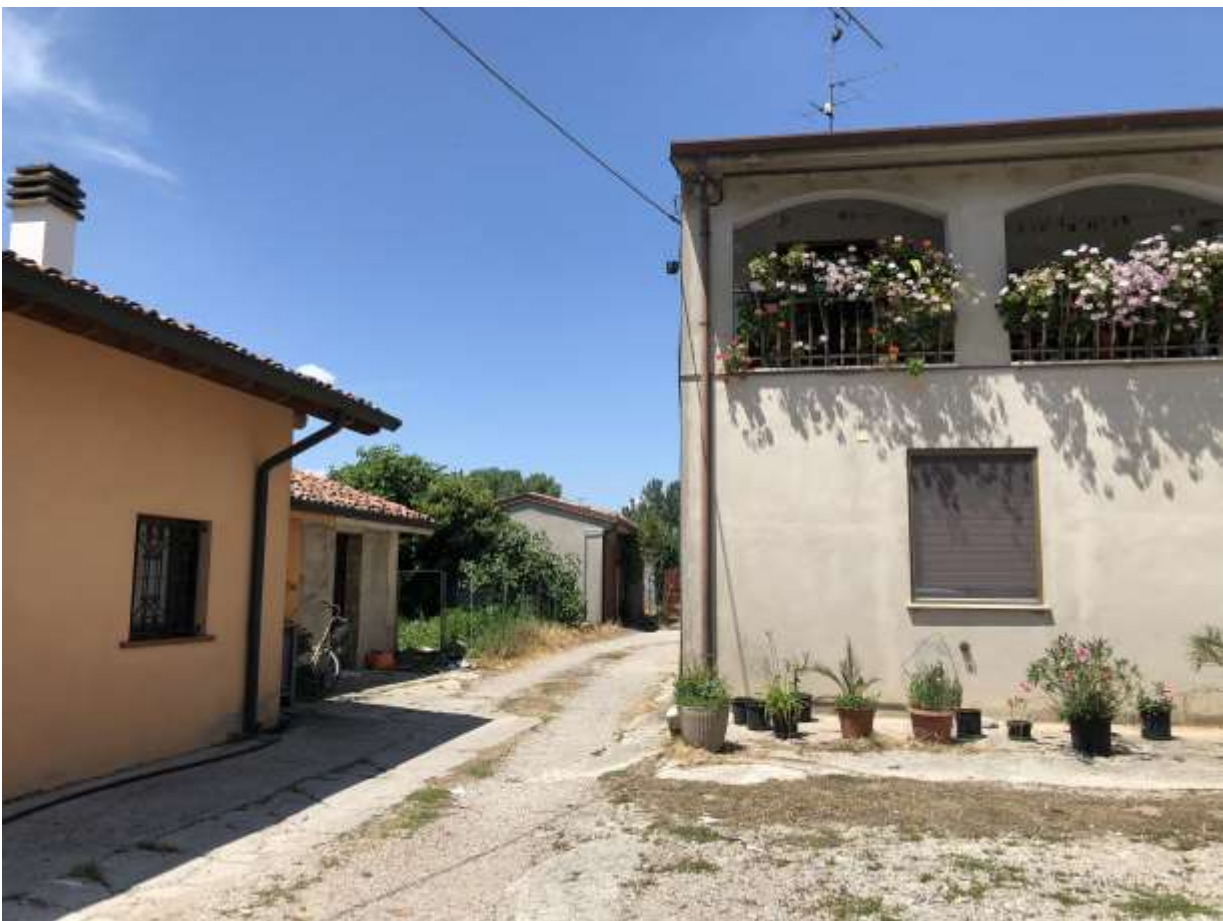
Foto 62 e 63 area cortiva comune antistante il rustico e l'abitazione