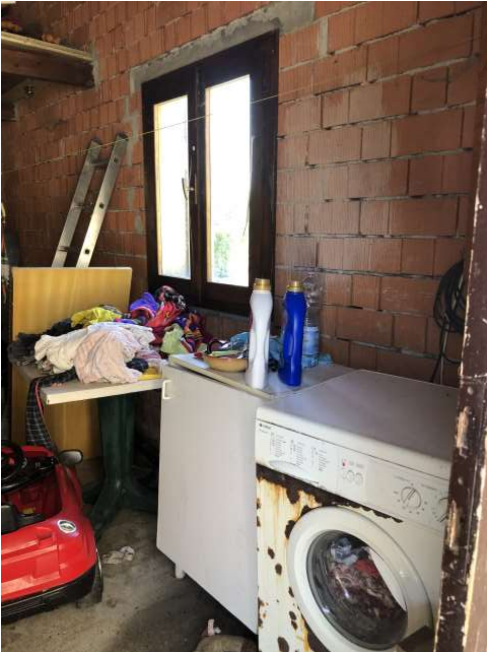
Foto 44: veduta interna del rustico in muratura di laterizi e pavimento in battuto di cls