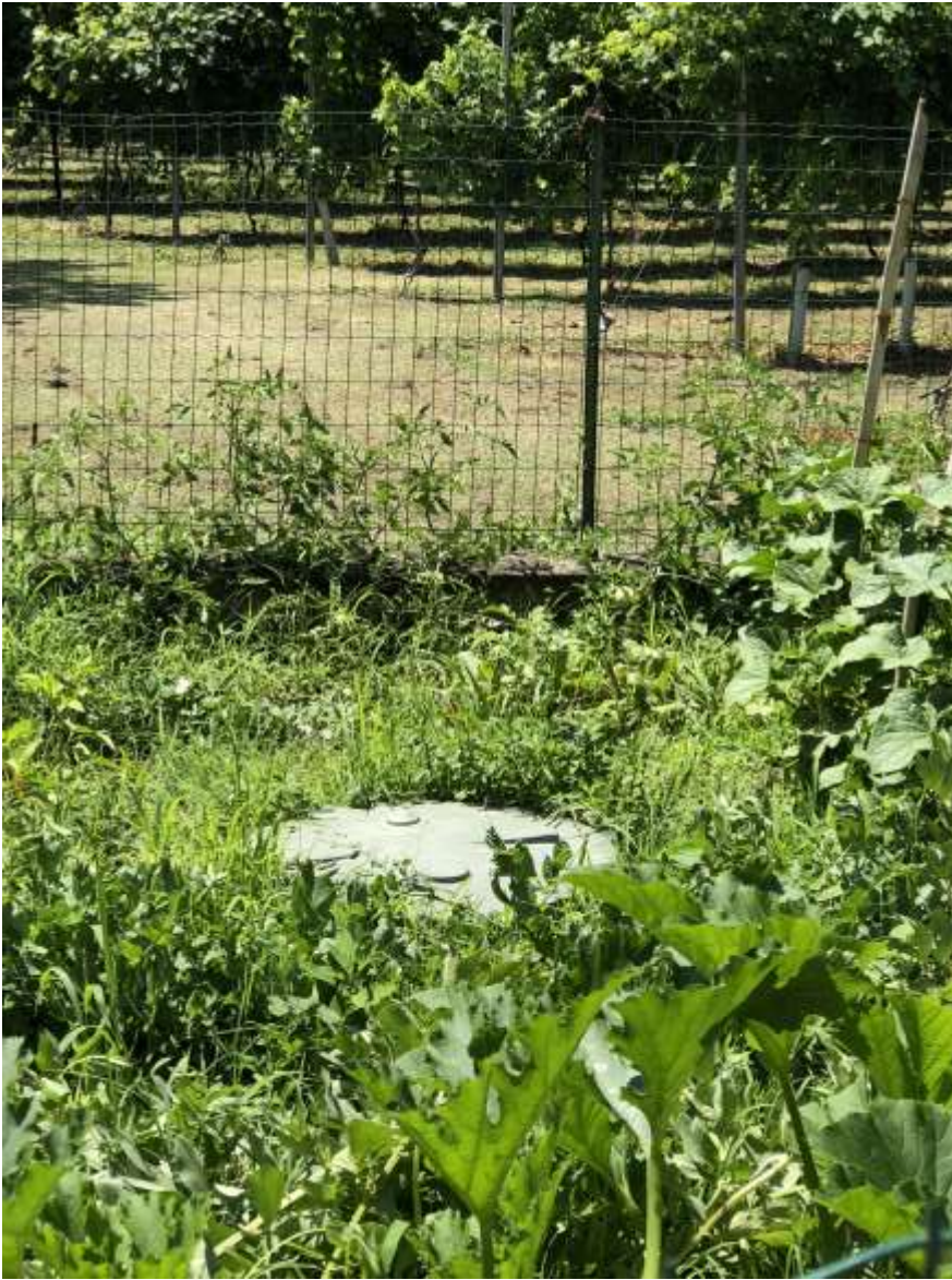
Foto 54 e 55: serbatoio di GPL sul mappale 17 del fg 36 adiacente al rustico