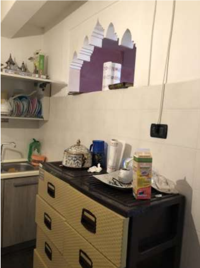
Foto 20 e 21: altre immagini della cucina e della parete in cartongesso di divisione con la sala