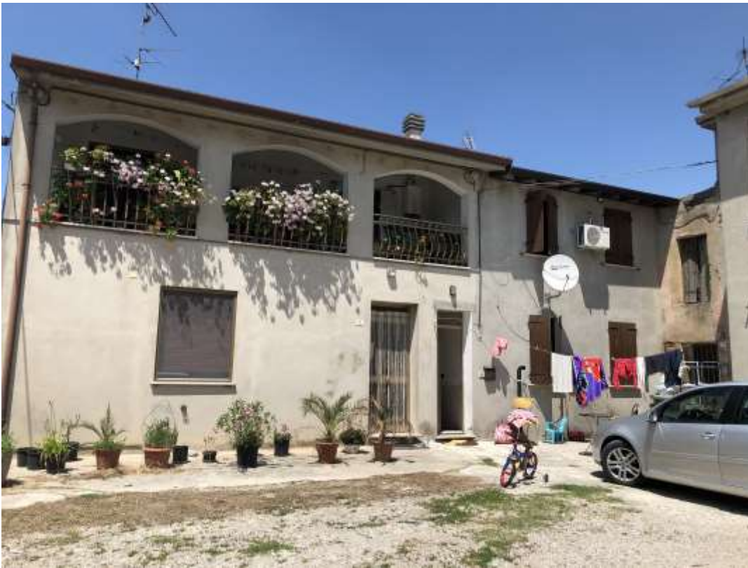
Foto 68: fronte dell'abitazione sulla corte comune (lato in angolo a sinistra con ingresso sotto la loggia)