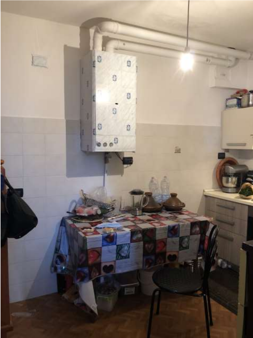
Foto 17: veduta della cucina con rivestimento di mattonelle in ceramica fino a circa 170 cm