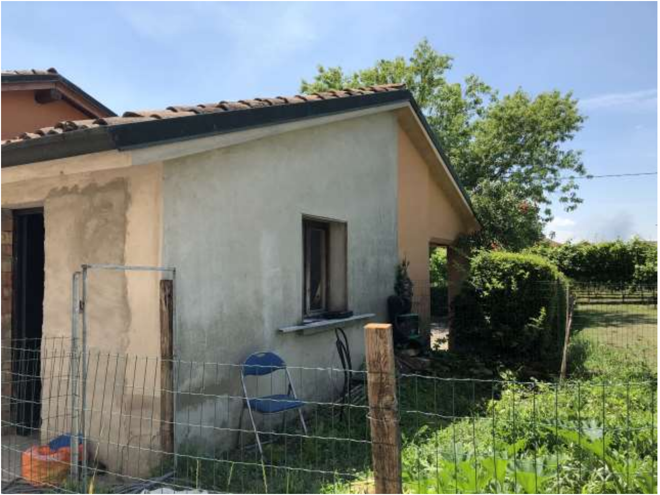
Foto 51: veduta laterale del fabbricato rustico (porzione grigia)