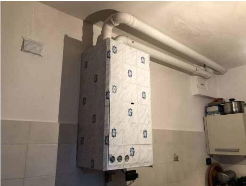
Foto 18 e 19: immagini della caldaia per riscaldamento e acqua calda sanitaria