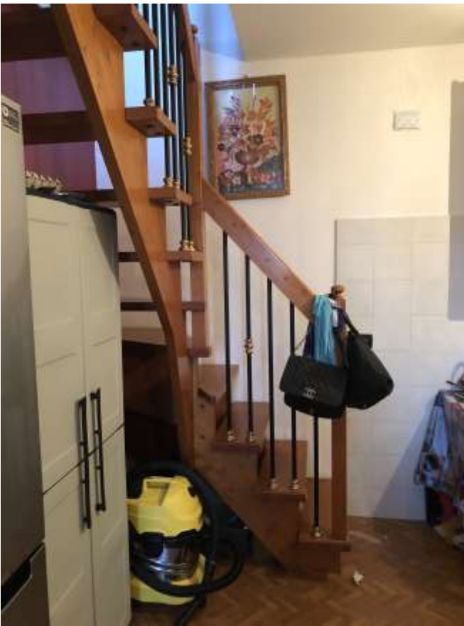
Foto 14 e 15: scala in legno di accesso al piano primo posizionata in cucina