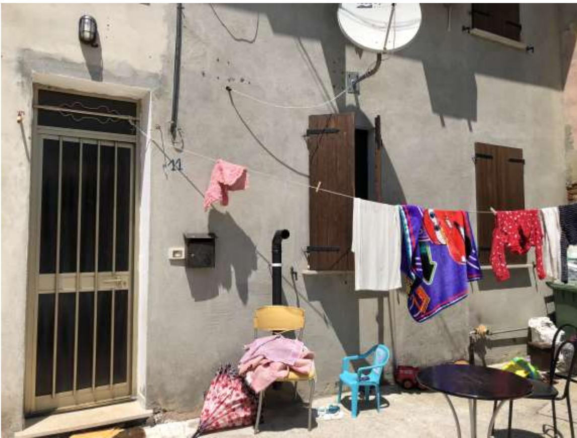
Foto 1 e 2: vedute esterne dell'abitazione in via Gabbiana a San Rocco di Quistello