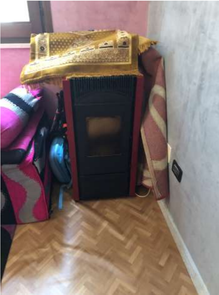
Foto 10 e 11: particolare presa elettrica e stufa a pellet nella sala