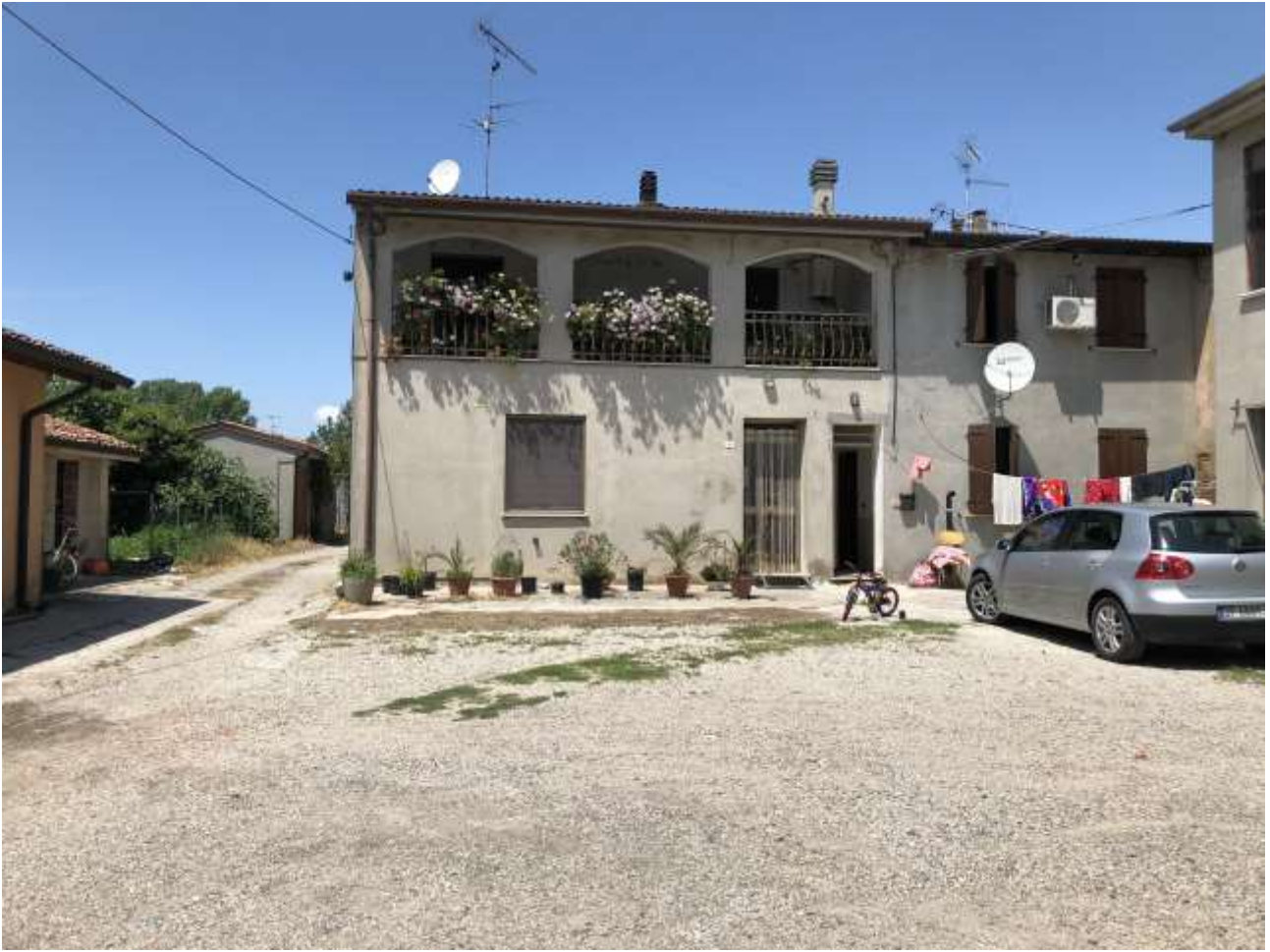
Foto 74: area cortiva comune con abitazione a destra e rustico a sinistra