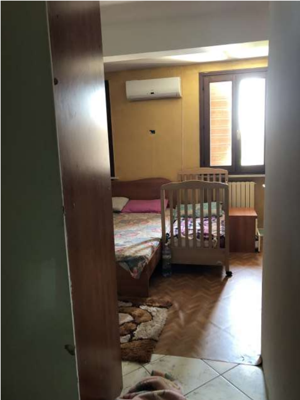
Foto 27: camera da letto piano primo con armadio di separazione con la zona guardaroba