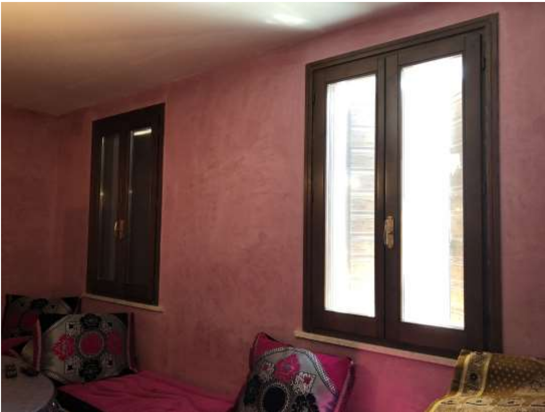
Foto 12 e 13: altre vedute della sala con controsoffitto in cartongesso (che ha ridotto l'altezza interna dei locali)