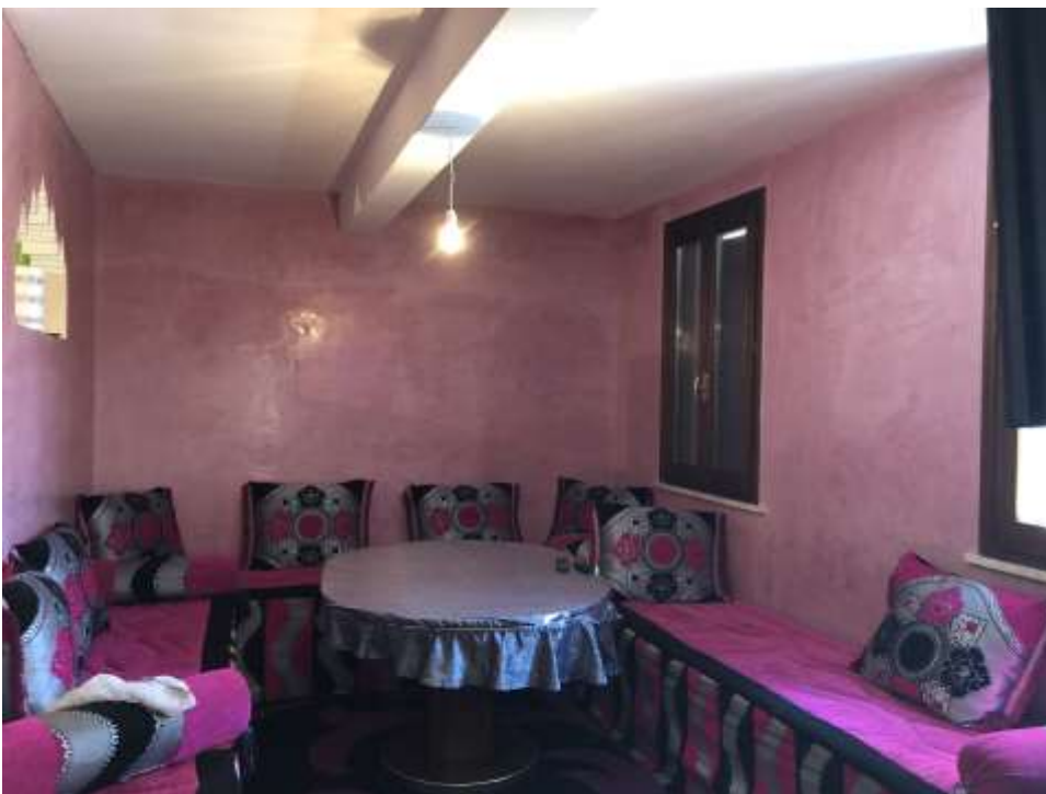
Foto 6 e 7: porta di ingresso nella sala e immagine della sala con le due finestre