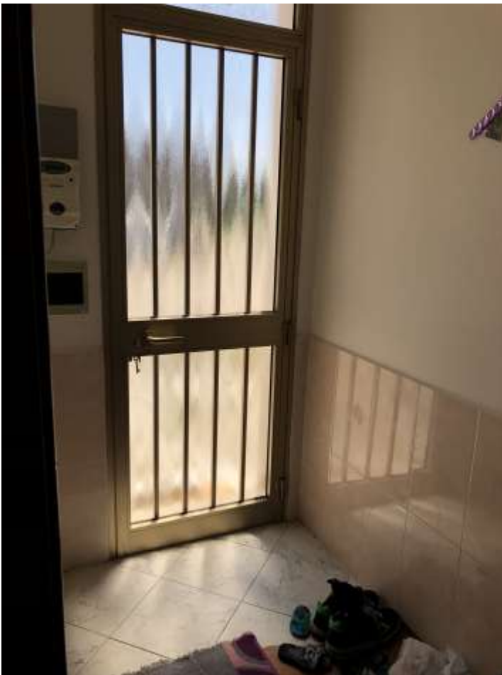
Foto 4 e 5: veduta del portoncino di ingresso all'abitazione dall'esterno e dall'interno