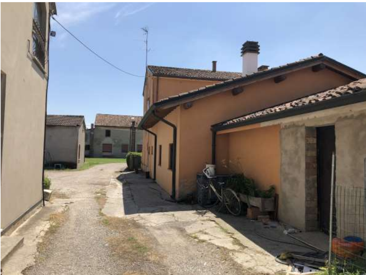
Foto 58 e 59: vedute esterne dell'area cortiva comune di cui al foglio 36 mappale 24 antistante il rustico