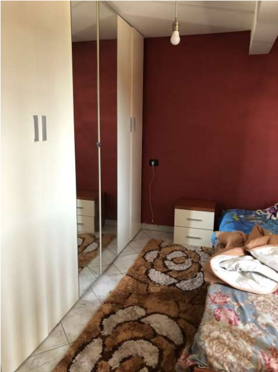
Foto 34: armadio utilizzato come parete divisoria con il guardaroba