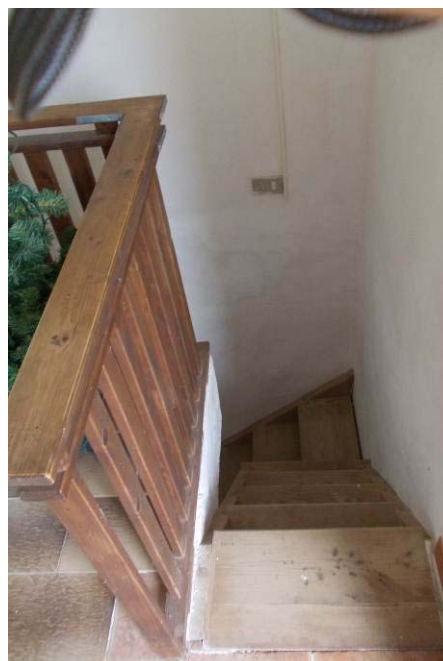
Foto 14 (scala di comunicazione interna piano terra – primo piano)