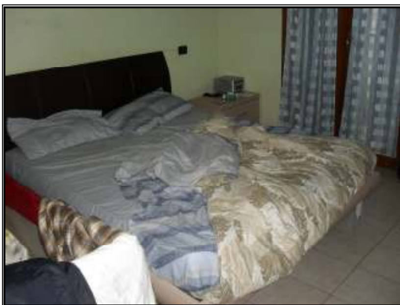
Camera da letto – piano primo