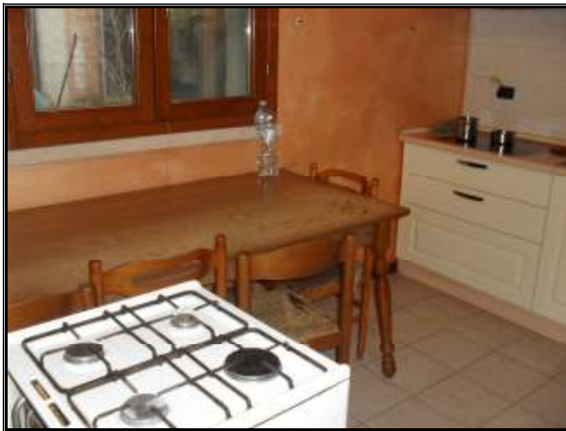
Cucina – piano terra