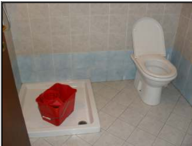
Bagno – piano terra