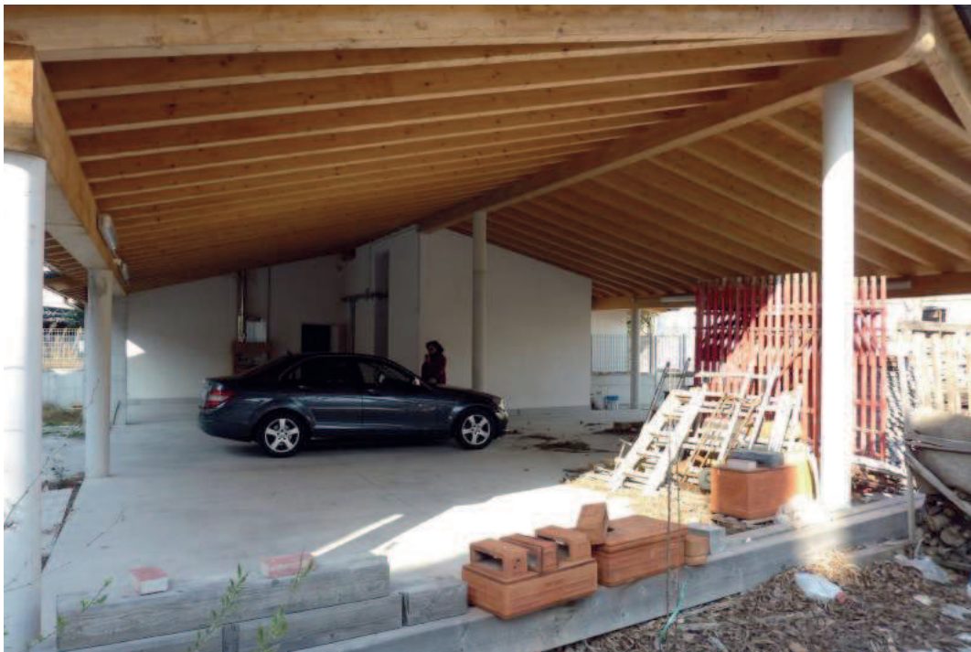
Foto 5- posti auto coperti