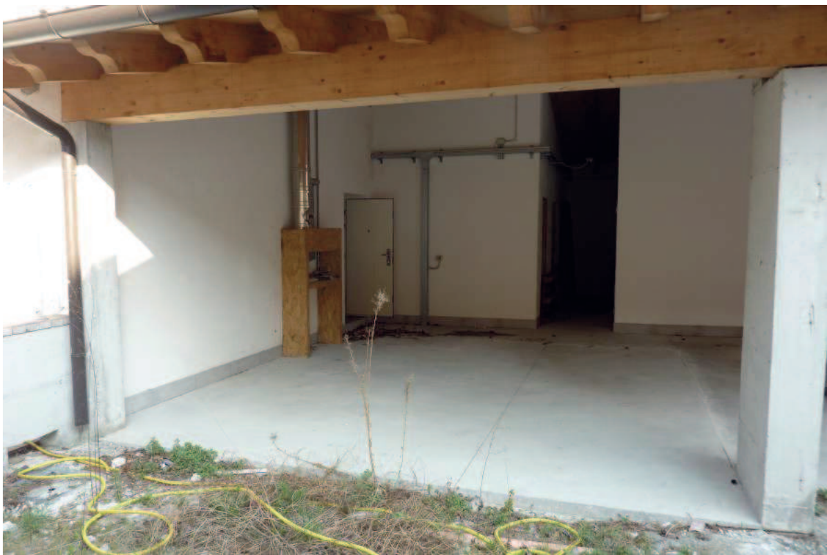
Foto 8 – ingresso secondario postico in corrispondenza della tettoia