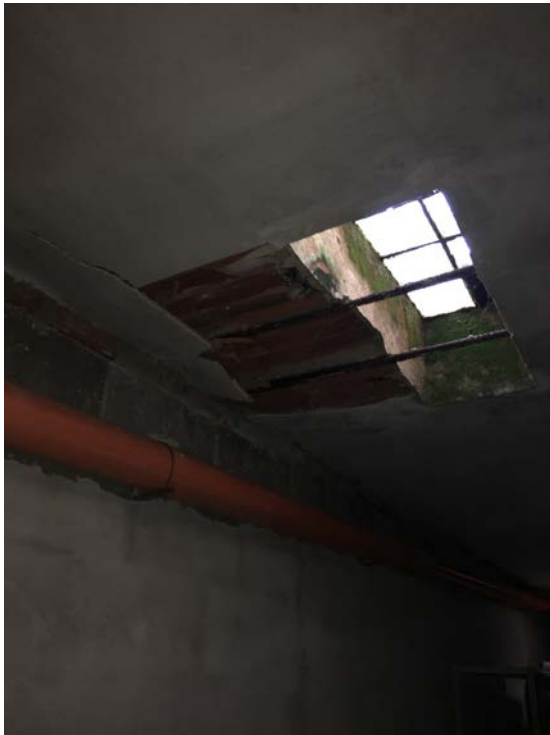
Soffitto locale deposito