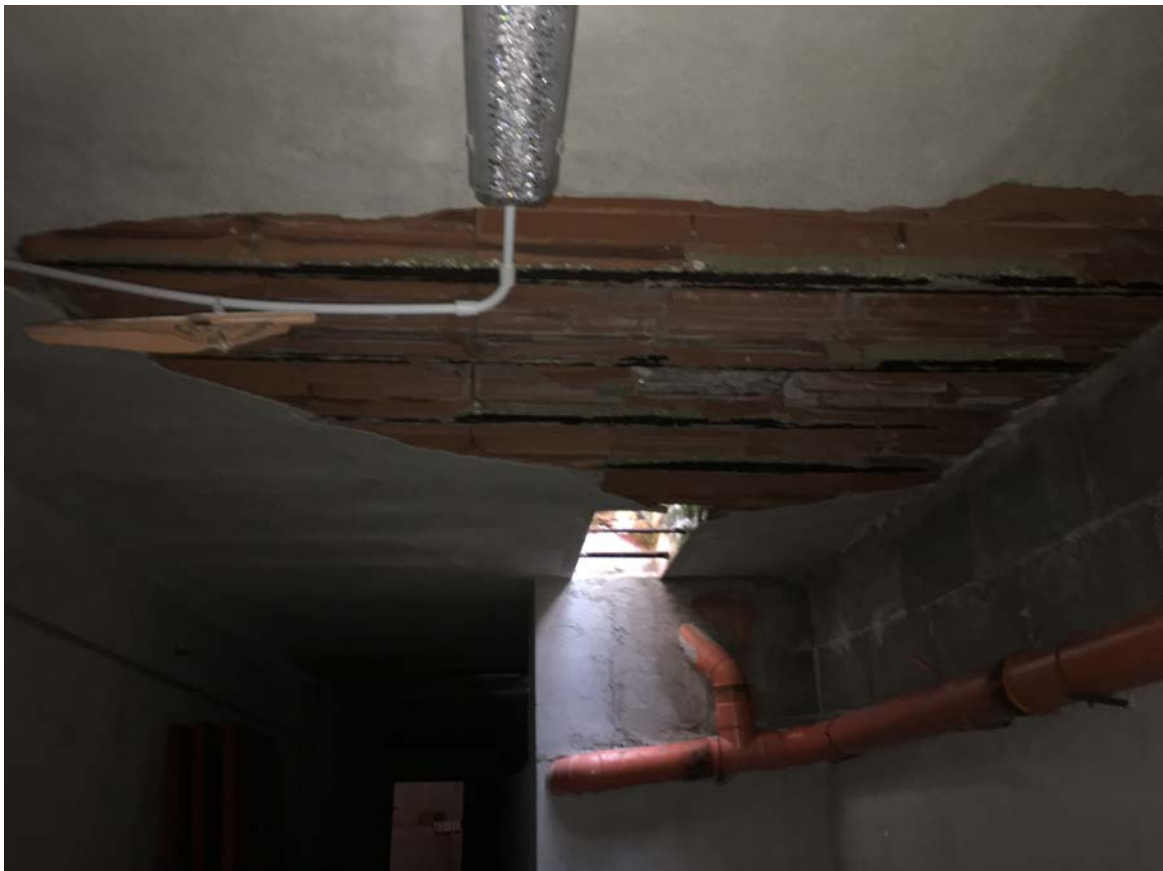
Soffitto locale deposito