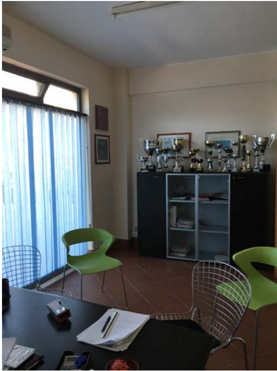
Ufficio entrando a destra dell'ingresso