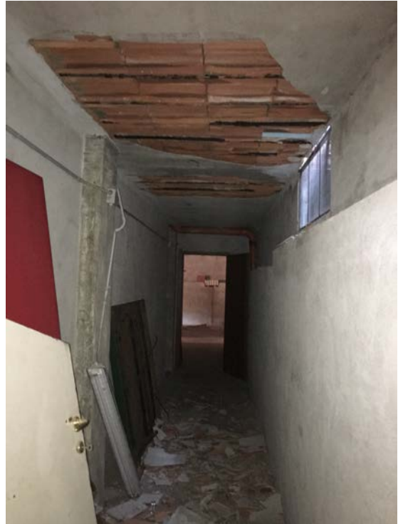
Locale deposito verso locale garage