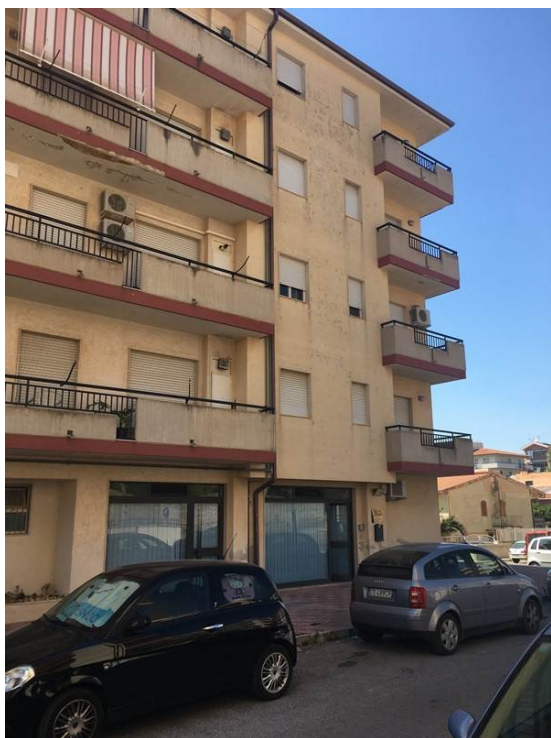
Prospetto su via Gucciardo Pirato Passo Cane