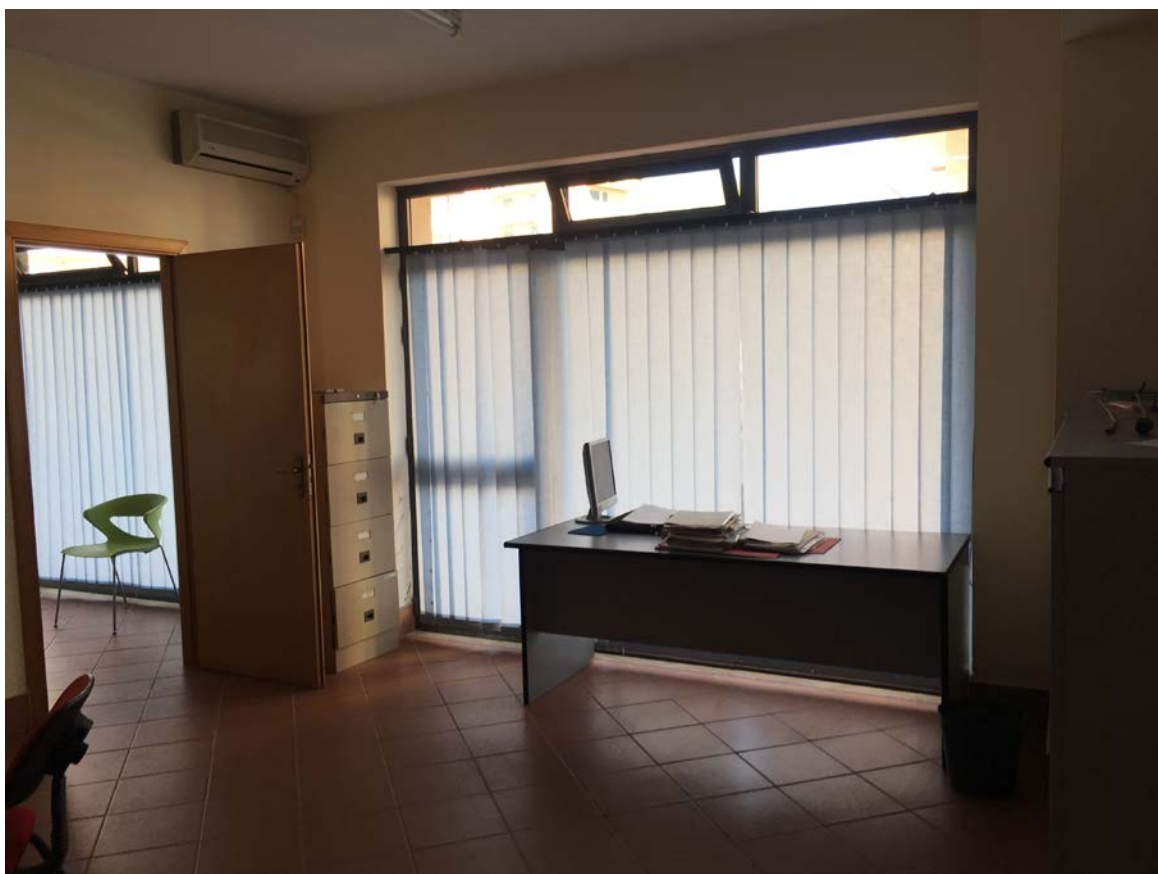
Ufficio entrando a sinistra dell'ingresso