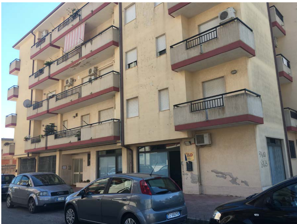
Angolo tra le vie Gucciardo Pirato Passo Cane e via Gucciardo Pirato