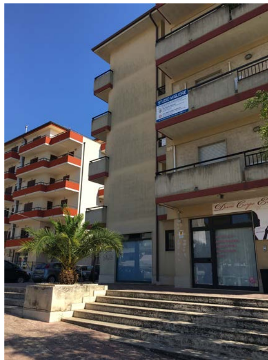
Prospetto su via Gucciardo Pirato