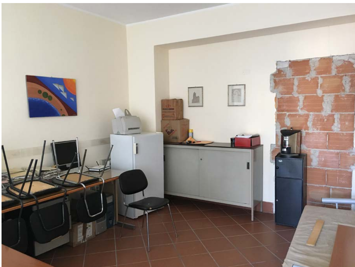
Ufficio retrostante l'ingresso