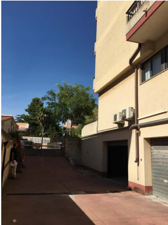
Rampa carraia e ingresso garage elocale deposito