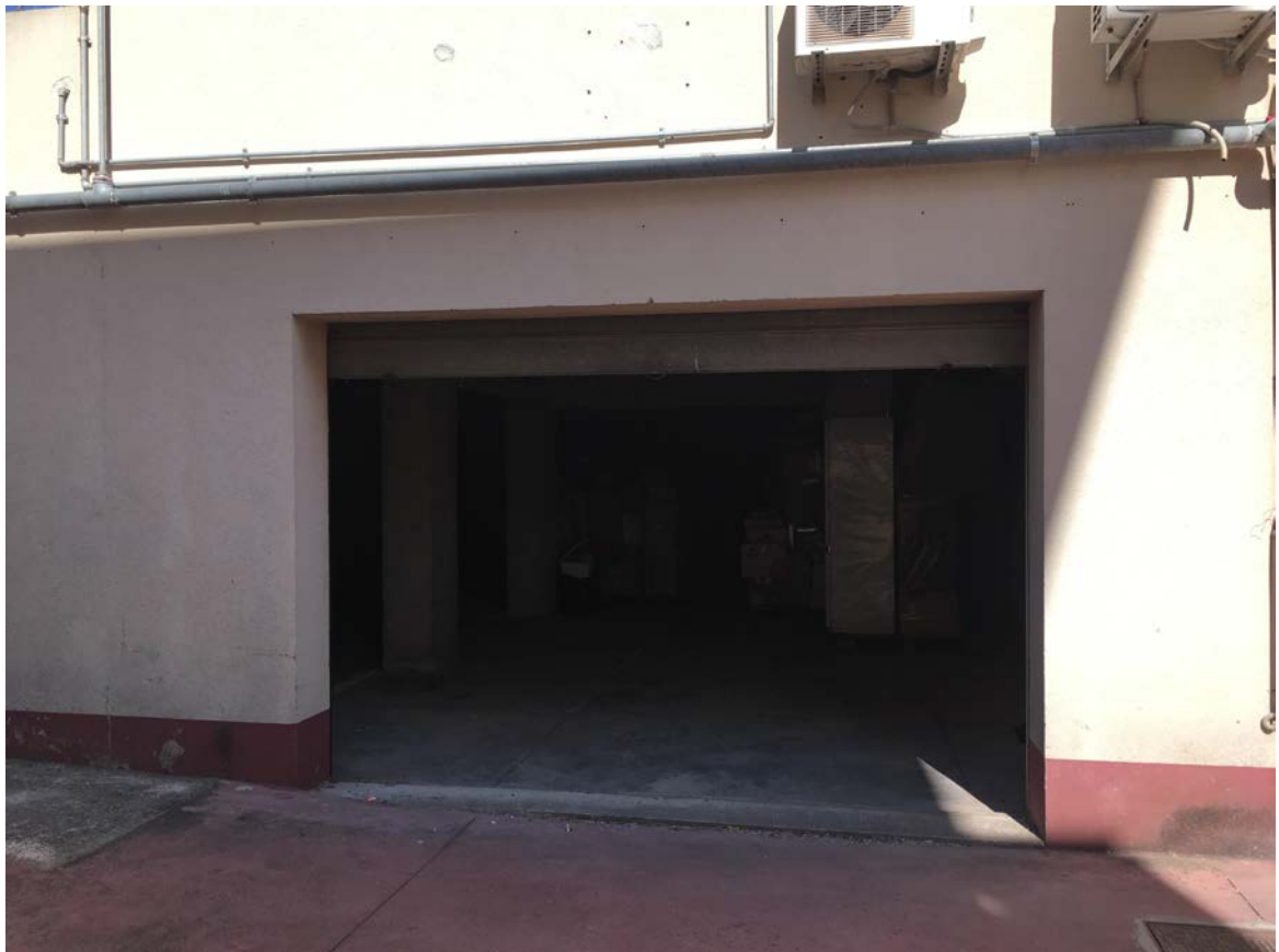
Ingresso garage e locale deposito