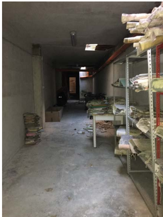
Interno locale deposito