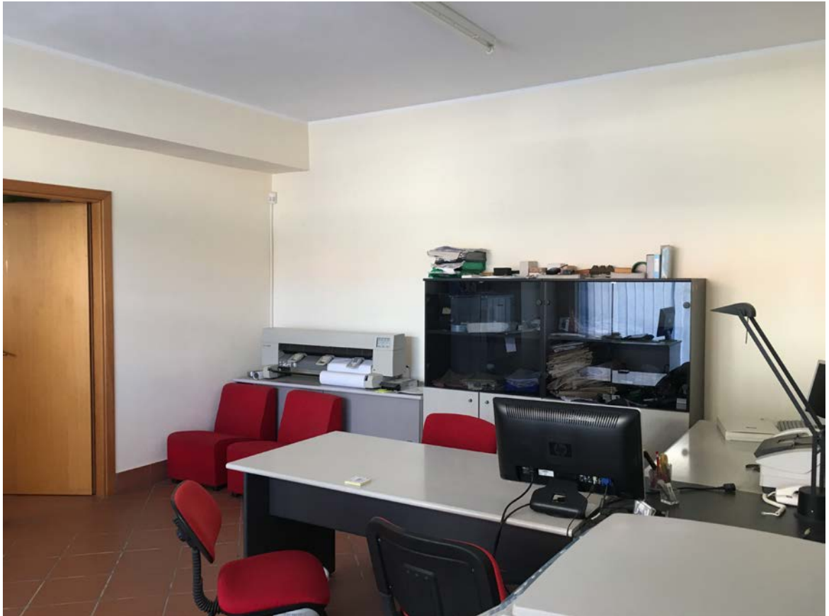
Ufficio entrando a sinistra dell'ingresso