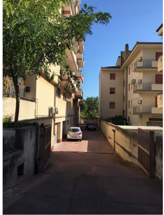
Ingresso rampa carraia