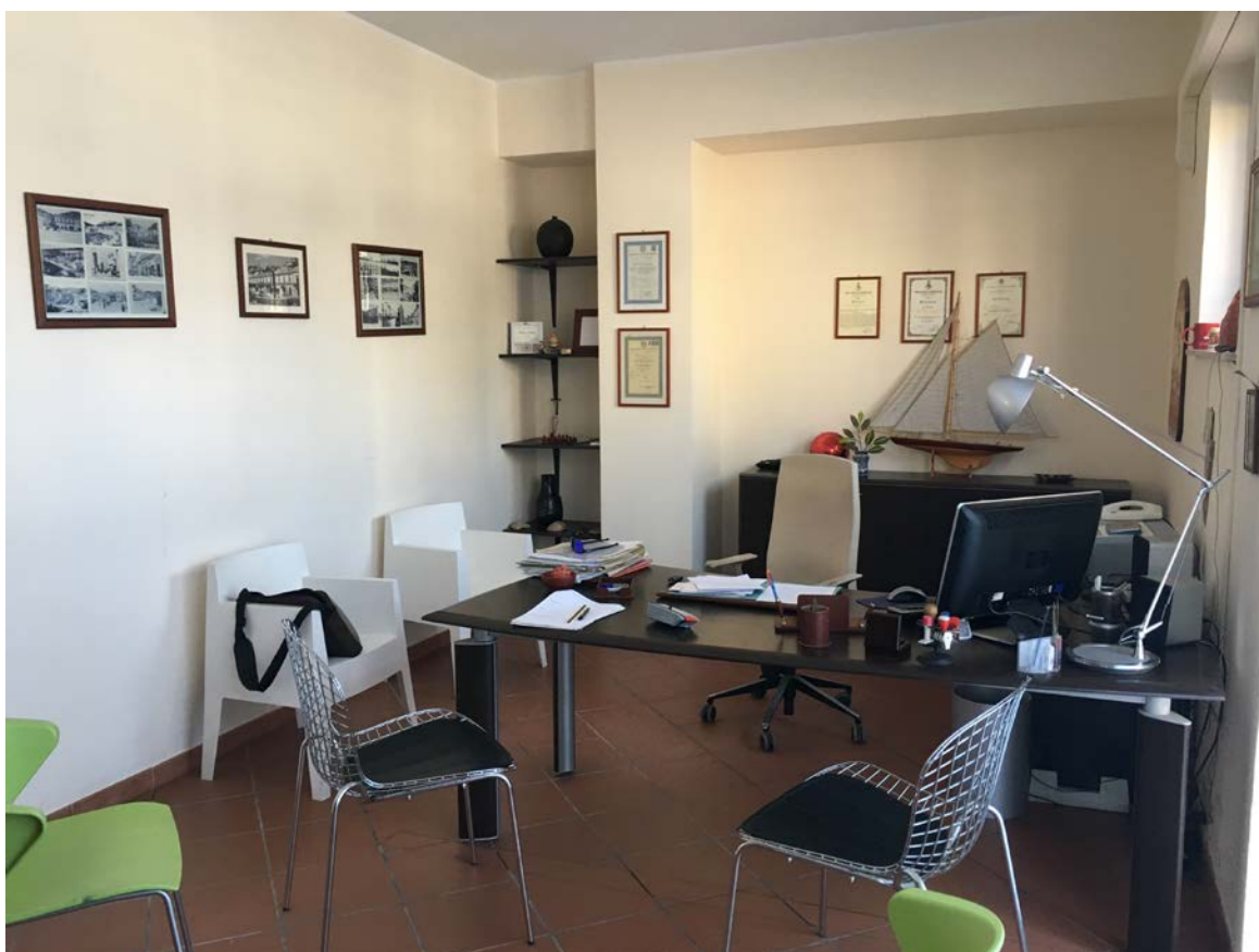
Ufficio entrando a destra dell'ingresso