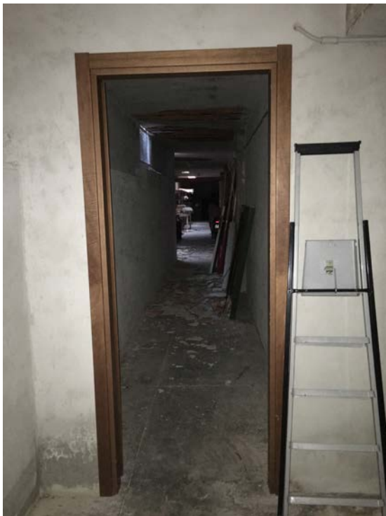
Ingresso locale deposito dal locale garage