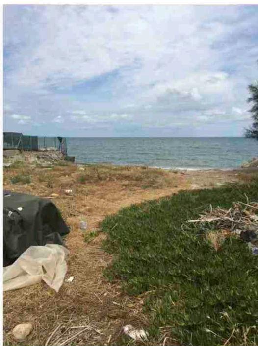
foto n. 3 spezzone di terrone sulla spiaggetta