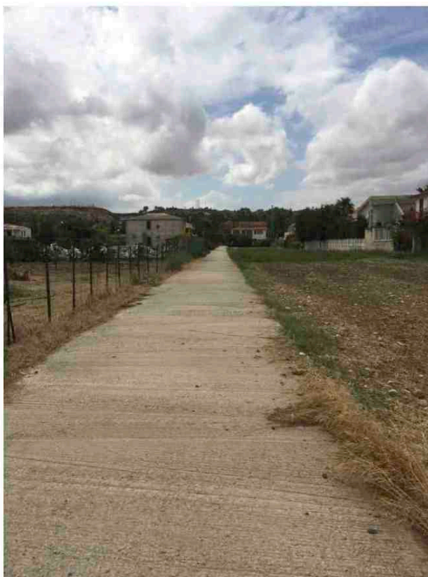
foto n. 4 vista globale del terreno