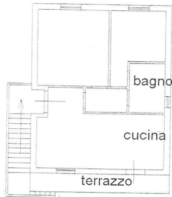
Piano Primo H=270