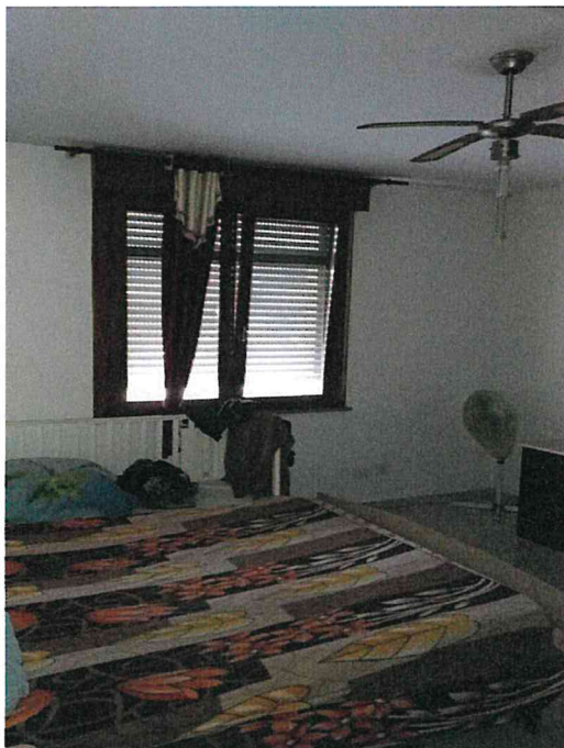
Fotografia n° 9