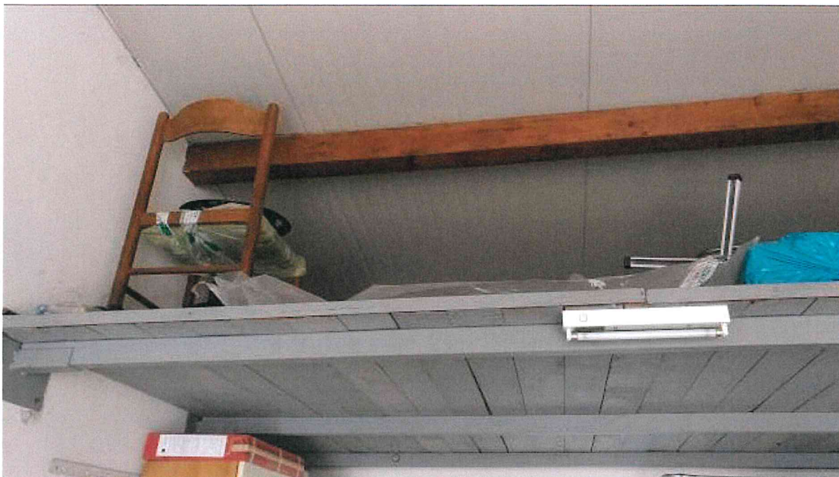
Fotografia n° 19