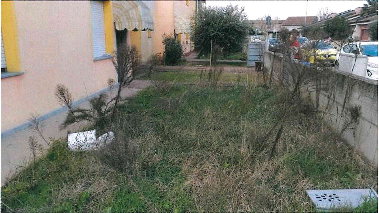
Fotografia n° 15