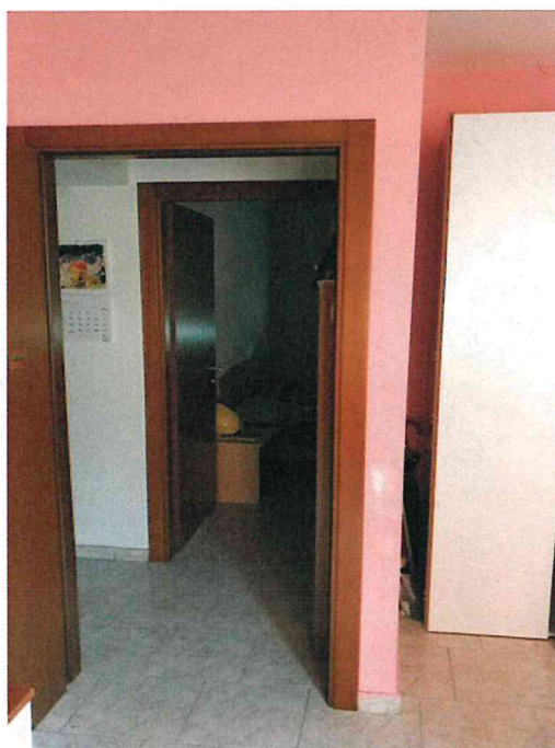
Fotografia n° 12