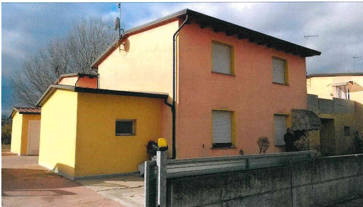
Fotografia n° 1