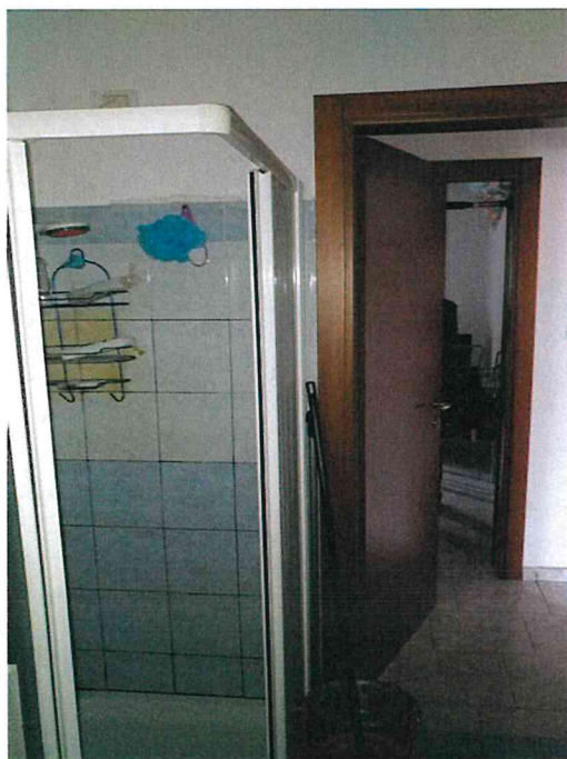
Fotografia n° 8