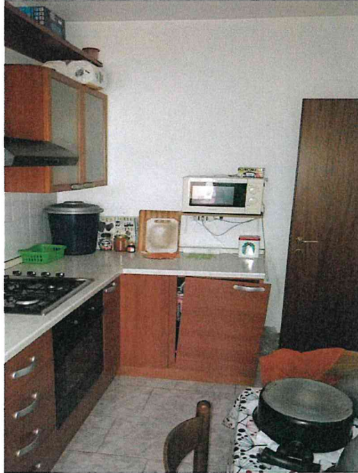
Fotografia n° 5