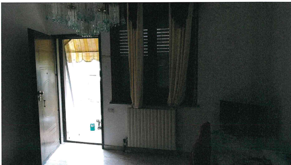
Fotografia n° 2