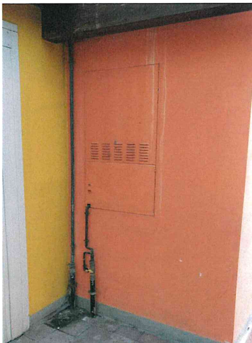
Fotografia n° 13