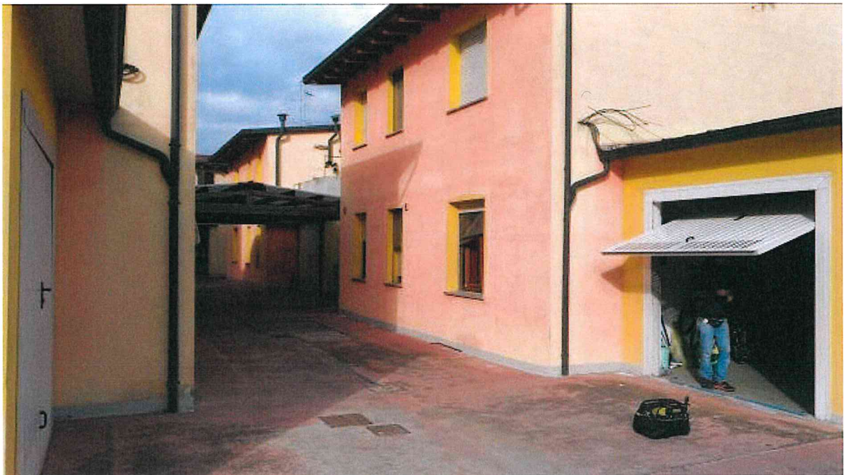
Fotografia n° 18