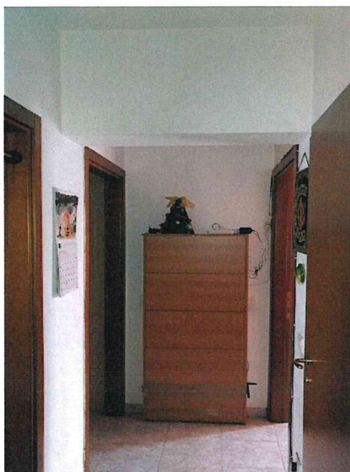
Fotografia n° 4