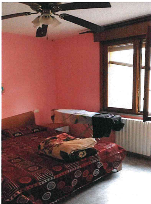
Fotografia n° 11