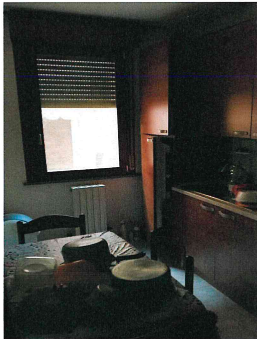
Fotografia n° 6