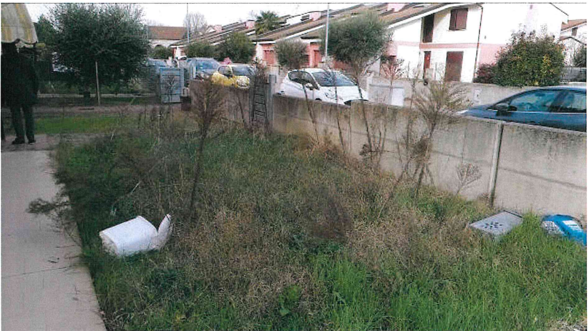
Fotografia n° 16