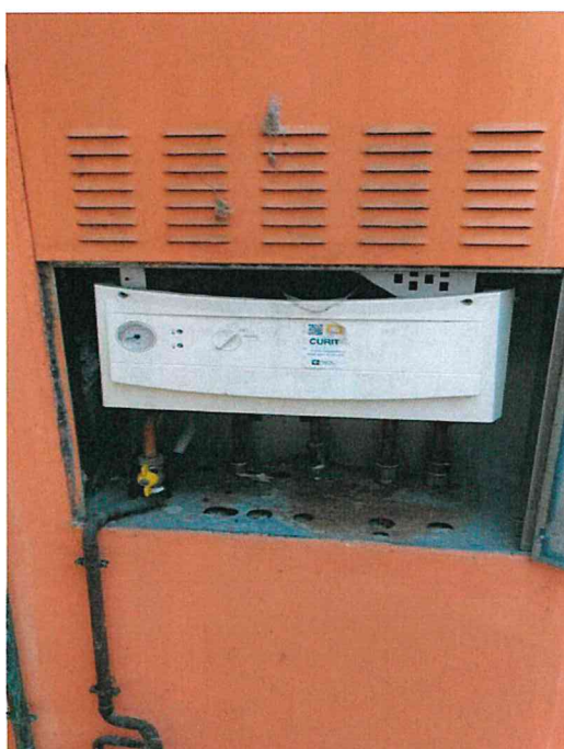
Fotografia n° 14