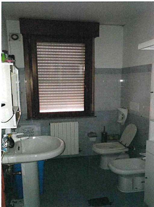
Fotografia n° 7