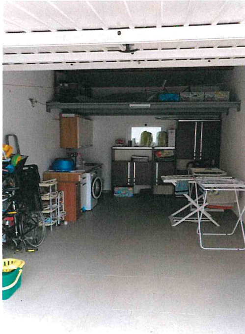
Fotografia n° 17