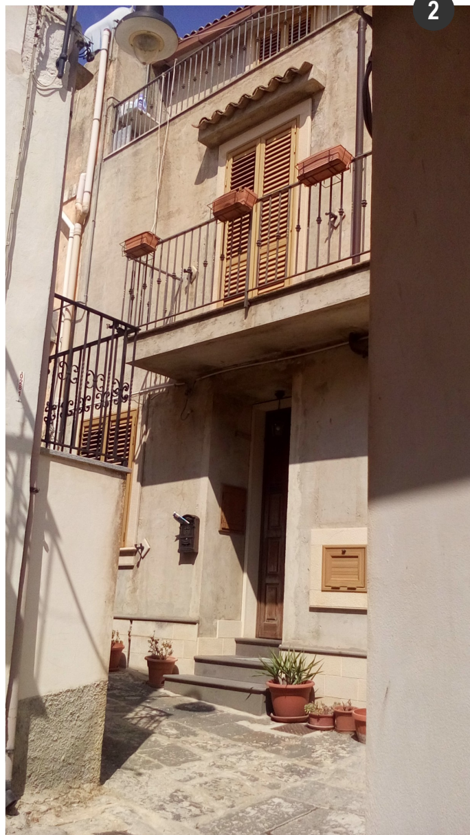
Prospetto su via Pignatello